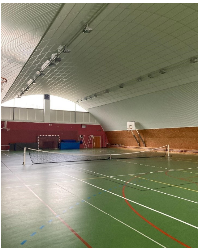
(Multifunkční sportovní hala – rok 2023).