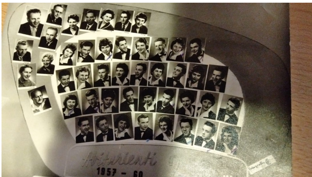
(Tablo absolventů)