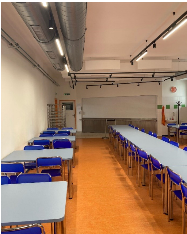
(Nově vybudovaná jídelna z roku 2019)