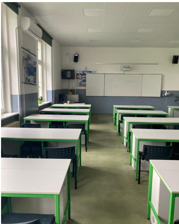
(Učebna zeměpisu – rok 2023)