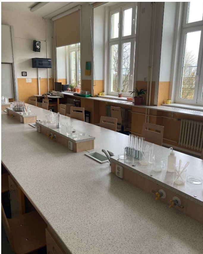
(Učebna chemie – rok 2023)