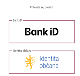
Obrázek 1: Výběr metody identifikace (autor)