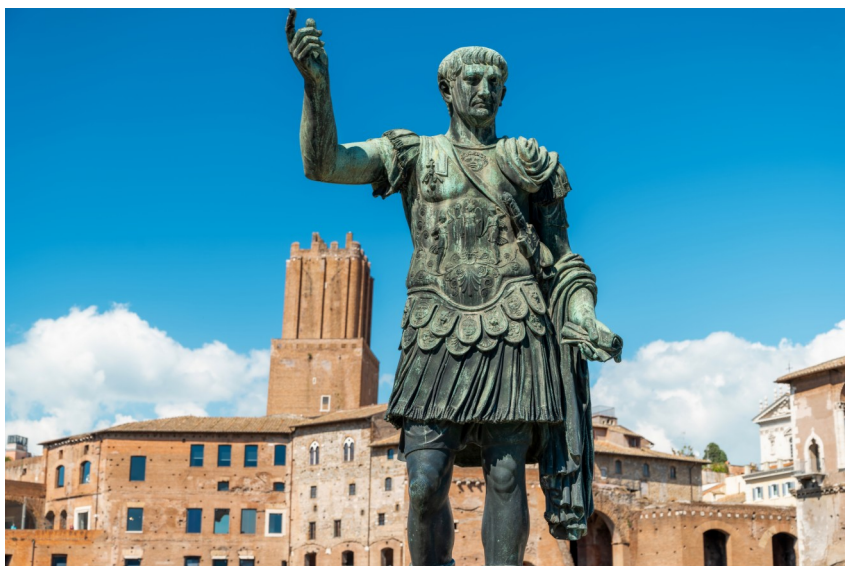
Obr. 3 Augustus v podobě vojáka a diplomata v jedné osobě