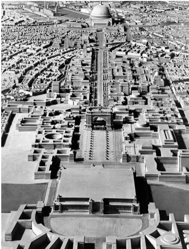
Obr. 4 Hitlerův model Berlína