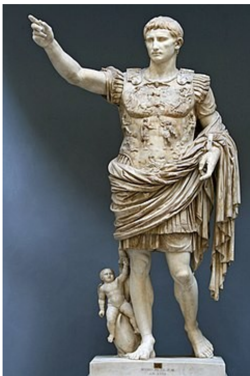
Obr. 2 Augustova socha z Prima Porty