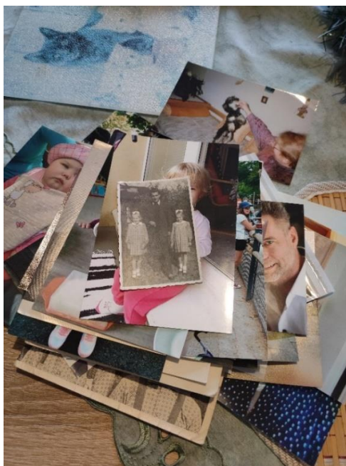
Obr.č. 2: Fotografií, jež znázorňovaly jednu z podob domova, bylo mnoho. Foto autorka, 2022.

„No to je po rodičích, to je historie, ta čajová souprava. To dostala babička roku 1907 jako svatební dar.“