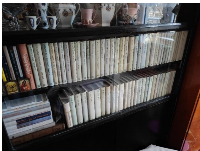
Obr.č.11: Sbíрка knih paní Holoubkové.

Věci provozní jsou ty, které moji informátoři užívají v každodenním životě a mají pro ně hodnotu užitkovou. I tak jsou nicméně potřebné. Mezi tyto věci řadím například postel, nádobí nebo hygienické pomůcky.