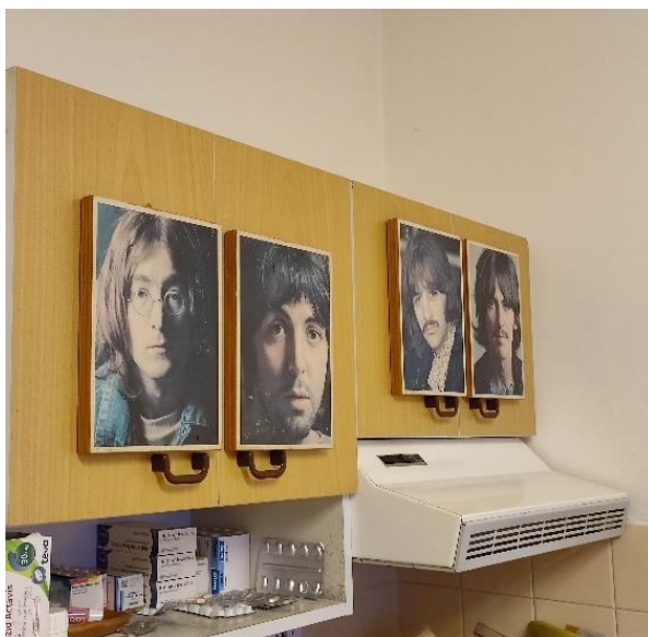
Obr.č. 8: Polička s léky a plakáty členů oblíbené kapely pana Brázdila, Beatles. Foto autorka, 2022.

„Tady mám moje lyžařský ocenění, když jsem dělal rozhodčího v Japonsku, vyznamenání a všechno. Hlavní je vyznamenání za celoživotní práci v rozvoji tělovýchovy. Já jsem měl hodně rád sport.“