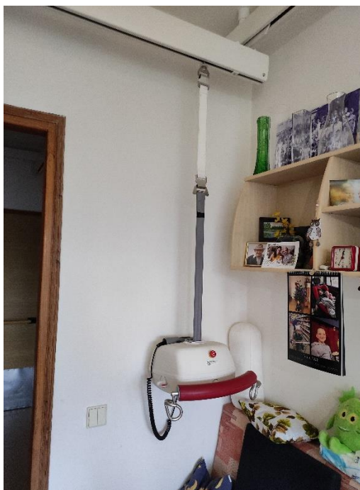
Obr.č.12: „Zvedák“, nezbytná pomůcka paní Pospíšilové. Foto autorka, 2022.

Je také důležité zohledit perspektivu intimní zóny, jíž může pokoj a věci v něm představovat. Tento aspekt může být proto jedním z možných důvodů, proč se moji informátoři nechtěli o některých věcech zmiňovat a proč také nebylo vhodné se na určité věci ptát. Materialita prostředí však mnohé napověděla.