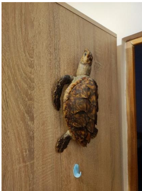
Obr.č. 10: Jeden z mnoha suvenýrů pana Brázdila.

(Z rozhovoru s p. Brázdilem (71) ze 6.12.2022)