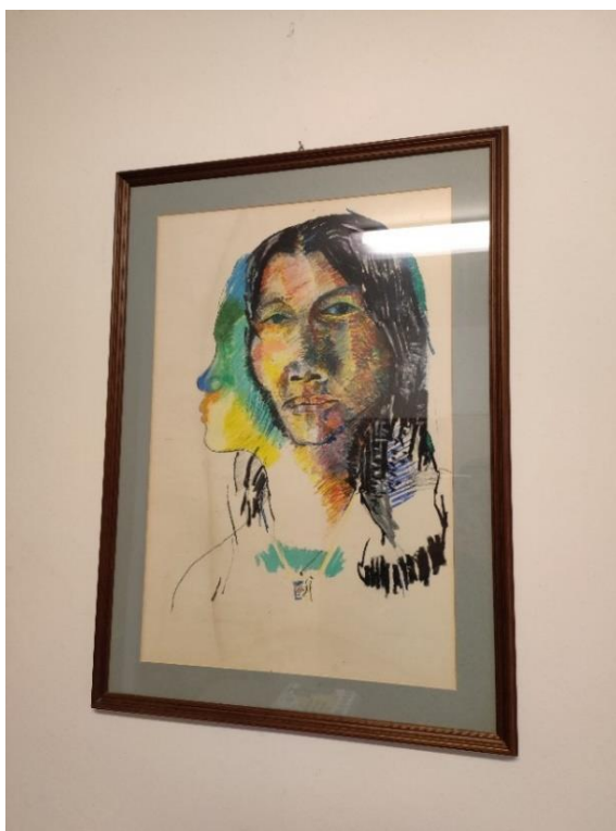
Obr.č.1: Památka na přátelství. Foto autorka, 2022.

(Z rozhovoru s p. Brázdilem (71) ze 6.12.2022)