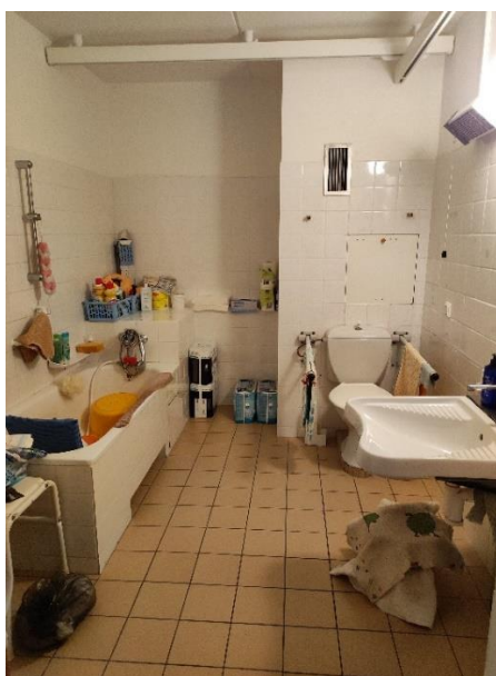
Obr.č.13: Materialita bezbariérové koupelny. Foto autorka, 2022.

Květiny jsou jedny z věcí, které je běžně možné v bytech vidět, jejich význam však bylo těžké odhadnout, neboť moji informátoři o nich sami většinou nemluvili. Jedni je vnímají pouze jako doplněk do bytu, pro druhé mají větší hodnotu a mohou jim také připomínat domov.