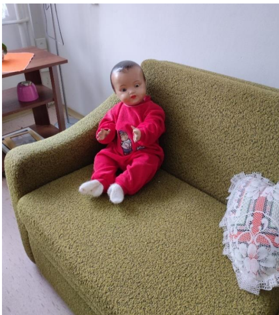
Obr.č. 4 : Panenka paní Pospíšilové. Foto autorka, 2022)

(Z rozhovoru s p. Pospíšilovou (72) z 4.12.2022)