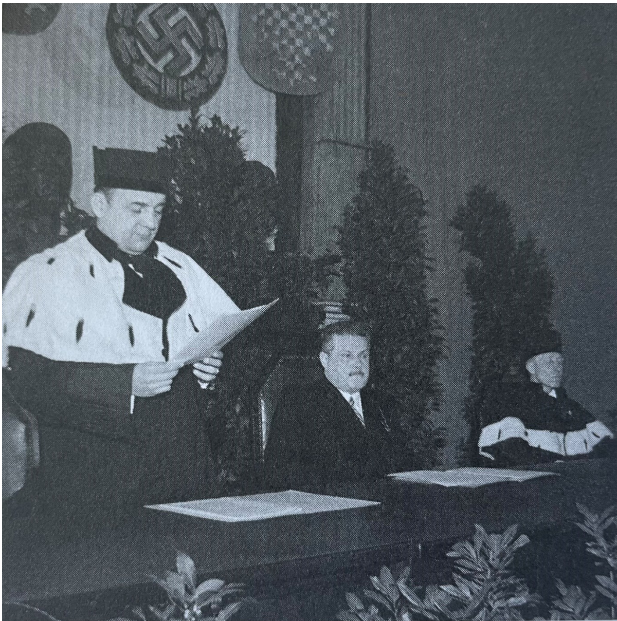
Obr. č. 5 – Josef Kliment jako předseda Nejvyššího správního soudu, 1944