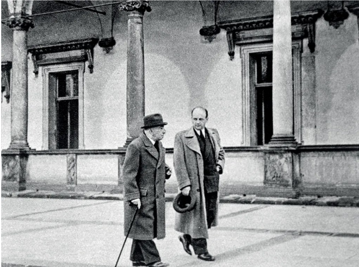
Obr. č. 3 – Prezident Emil Hácha s Josefem Klimentem na vycházce v letohrádku královny Anny, dostupné na: https://echoprime.cz/a/SmC9k/tajemnikem-prezidenta-hachy