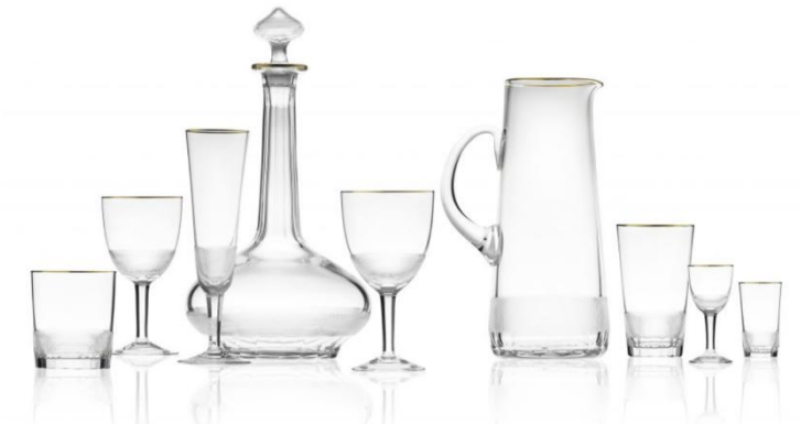
[7] Sklárna Moser, Nápojová souprava Royal, cca 1907.