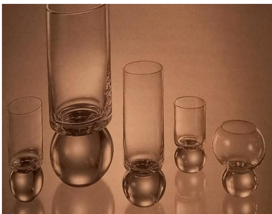
[32] Sklárna Moser, Jiří Šuhájek – nápojová souprava, 1978.