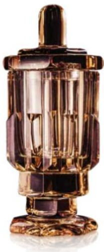
[24] Sklárna Moser, Váza, 1925