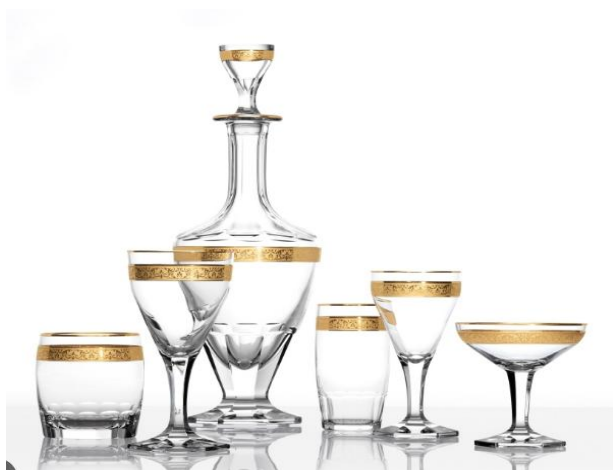
[10] Sklárna Moser, Nápojová souprava Copenhagen, 1909.