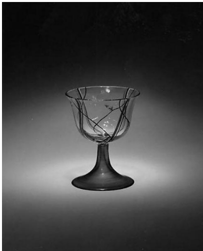
[16] Sklárna Moser, Sklenice na likér –ukázka malovaného skla. cca 1915-1925