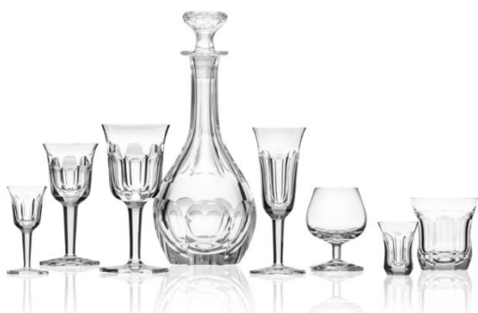
[13] Sklárna Moser, Nápojová souprava Papež, 1916