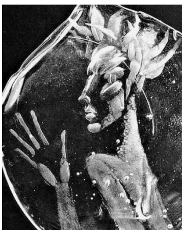
[38] Jiří Hrcuba, Egon Schiele. 2. pol. 20. Století