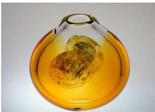
[31] Sklárna Moser, Jiří Šuhájek, Váza s květy. Kolem r. 1973-75