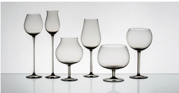
[29] Sklárna Moser, Dlouhý pán, Štíhlá dáma, Tloušťík, Dlouhá tvář, Tlustá Berta, Měsíční tvář, 1958.