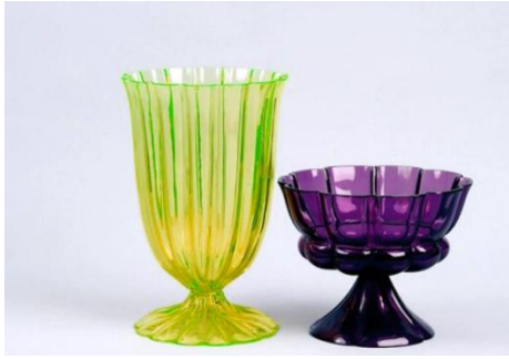
[17]Josef Hoffmann, Vázy, 1900.