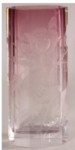
[4] Sklárna Moser, Váza s řezbou květin, není možné určit datování, pravděpodobně kolem r. 1900