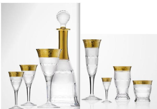
[12] Sklárna Moser, Nápojová souprava Splendid, 1911.