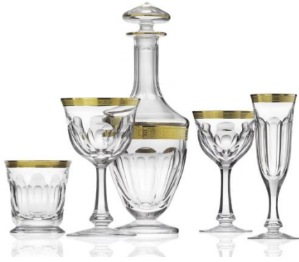
[27] Sklárna Moser, Lady Hamilton, 1934