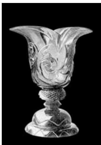
[23] Sklárna Moser, Váza podle návrhu Lotte P. Moserové, 1925.