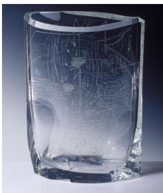
[36] Sklárna Moser, Oldřich Lípa, Umění fugy, 1968.