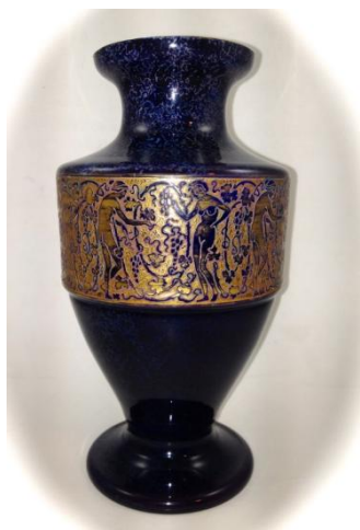
[21] Heinrich Sattler, Váza, 1929.