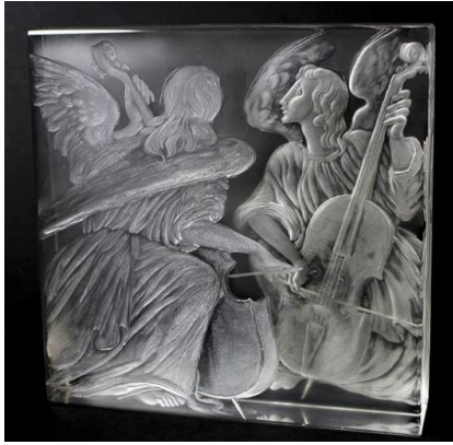
[39] Sklárna Moser, návrh Jiří Harcuba, rytí Ivan Chalupka, 1982.