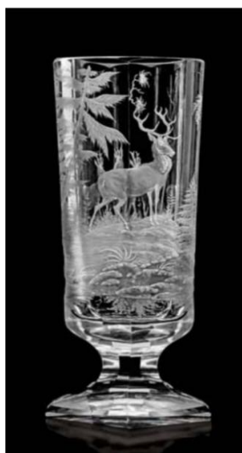
[2] J. F. Hoffmann, Pohár s loveckým motivem, po roce 1870.