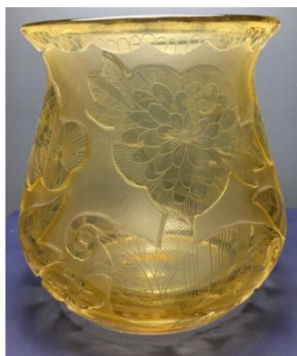
[20] Heinrich Hussmann, Váza, 1928.