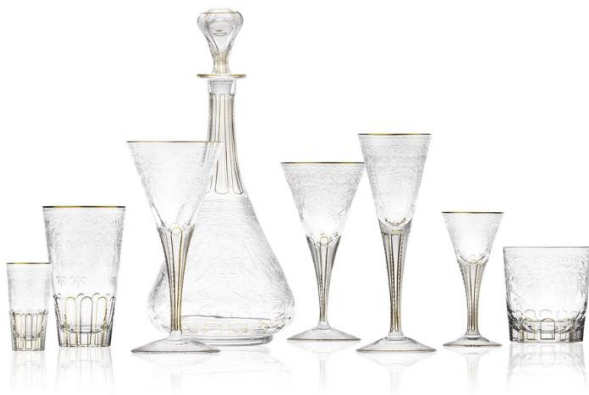
[15] Sklárna Moser, Nápojová souprava Maharani, 1895-1922