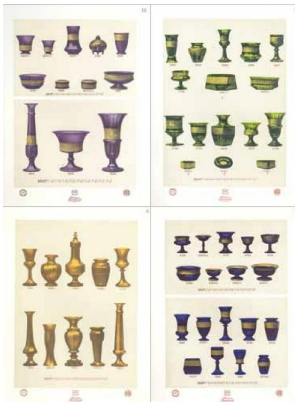
[19] Archiv Moser, Listy z firemního vzorníku výrobků v barvách Ametyst, Smaragd, Topas a Saphir, kolem r. 1922.