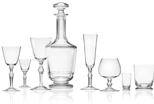
[18] Sklárna Moser, Otto Tauschek, Mozart, 1936