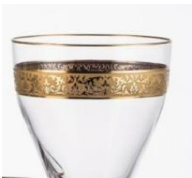
[11] Sklárna Moser, Oroplastika na sérii Copenhagen, 1909.