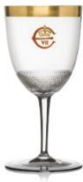
[8] Sklárna Moser, Edward VII., anglický král, 1907