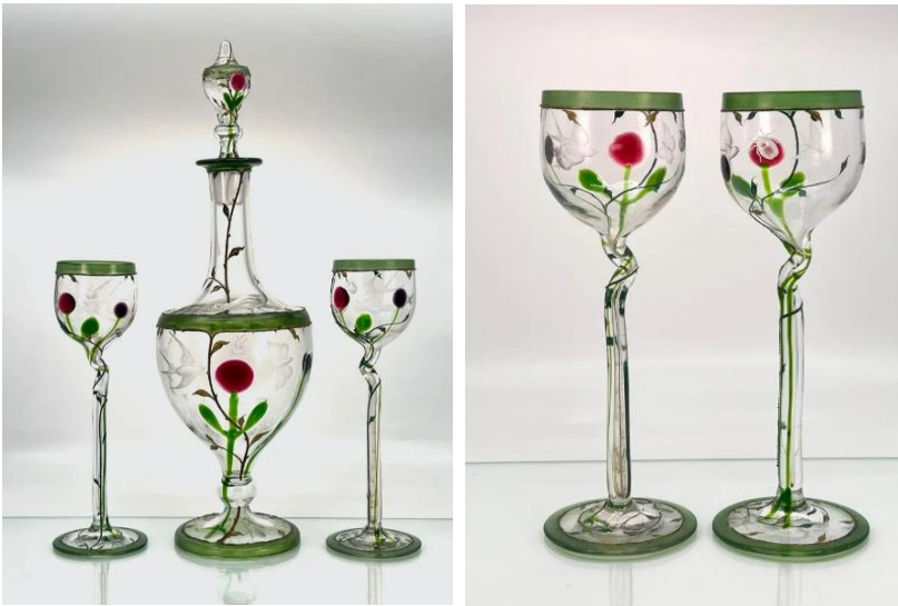
[6] Sklárna Moser, Nápojové sklo ze série „Karlsbader Secession“, 1900.