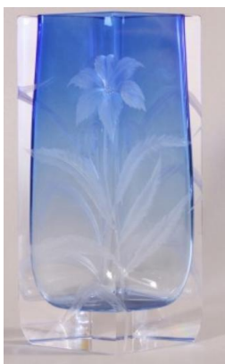
[3] Sklárna Moser, Váza s řezanými květy, kolem r. 1900.