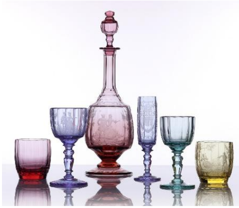
[14] Sklárna Moser, Nápojová souprava Marie Terezie, 1913.