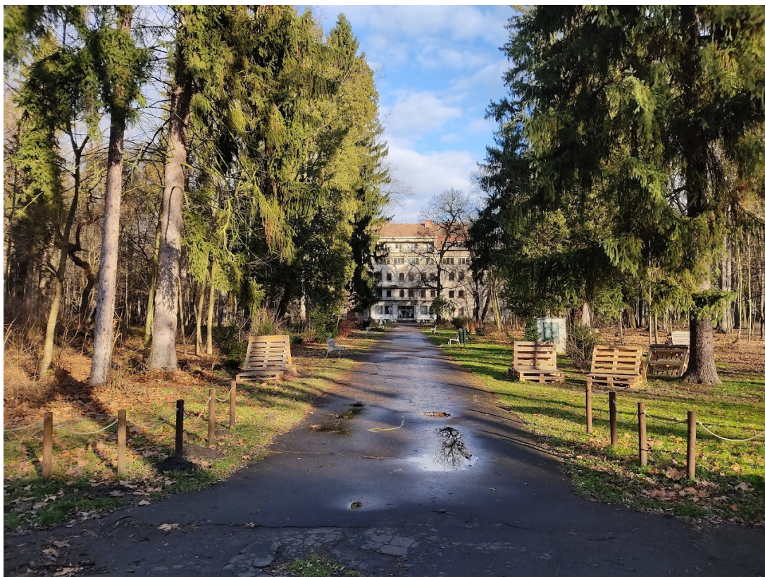
Obrazová příloha 14