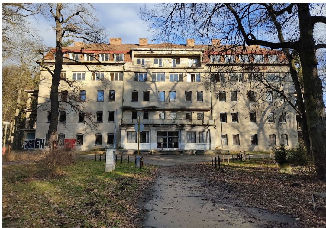
Obrazová příloha 15