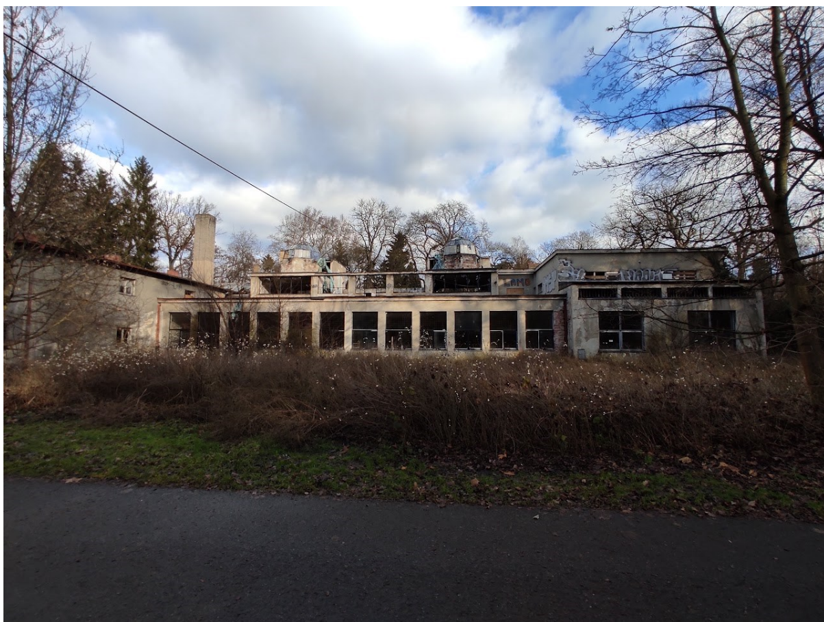
Obrazová příloha 16