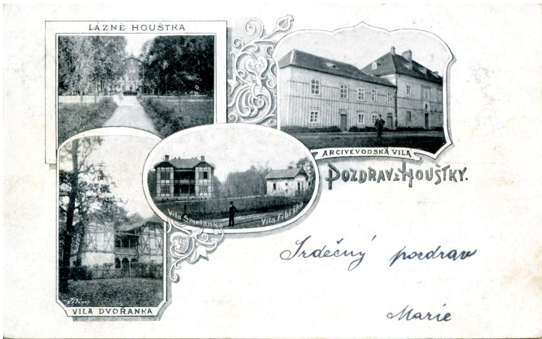
Obrazová příloha 5