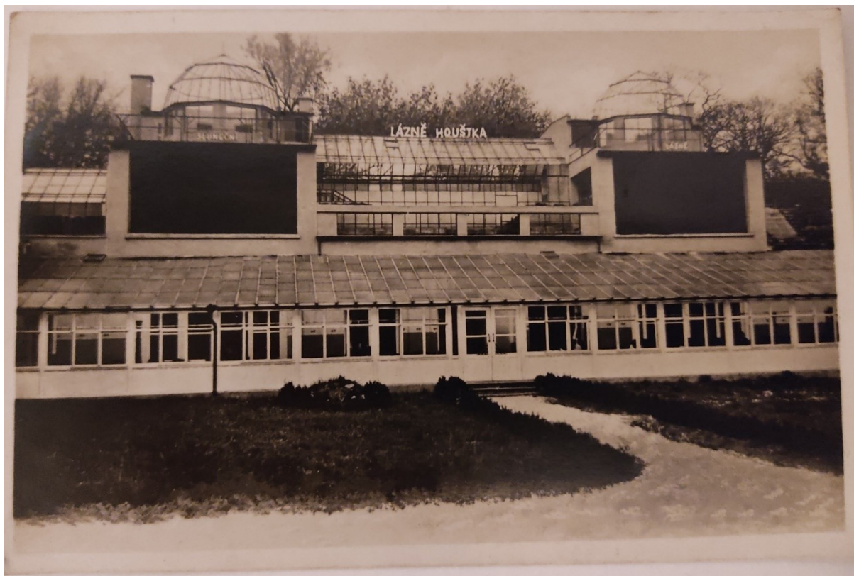
Obrazová příloha 7