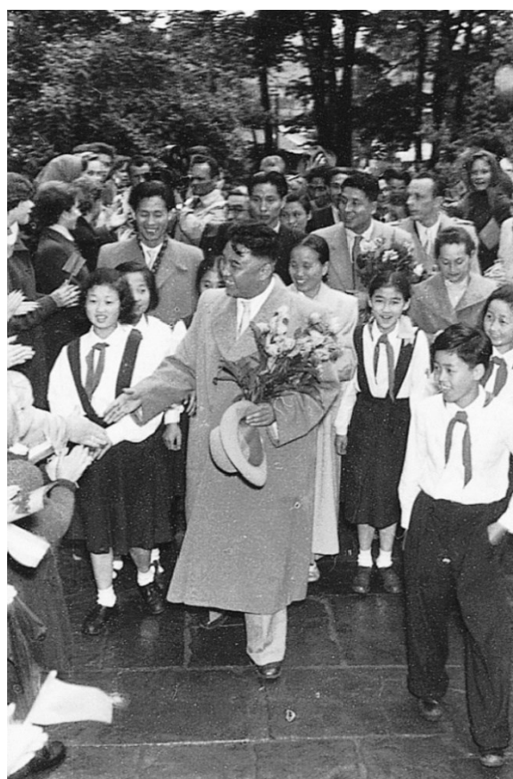
Obrazová příloha 9