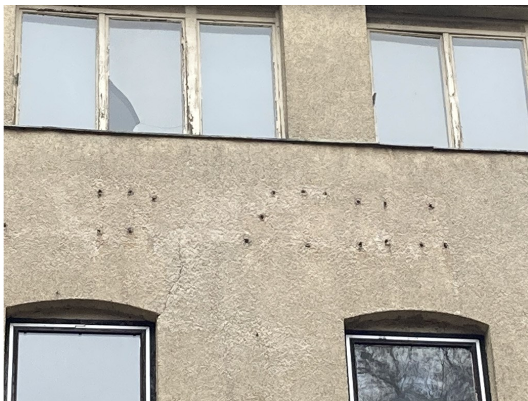
Obrazová příloha 11