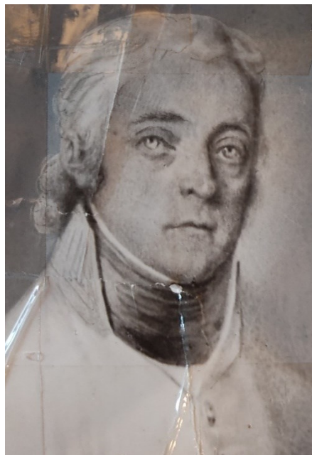
Obrazová příloha 1