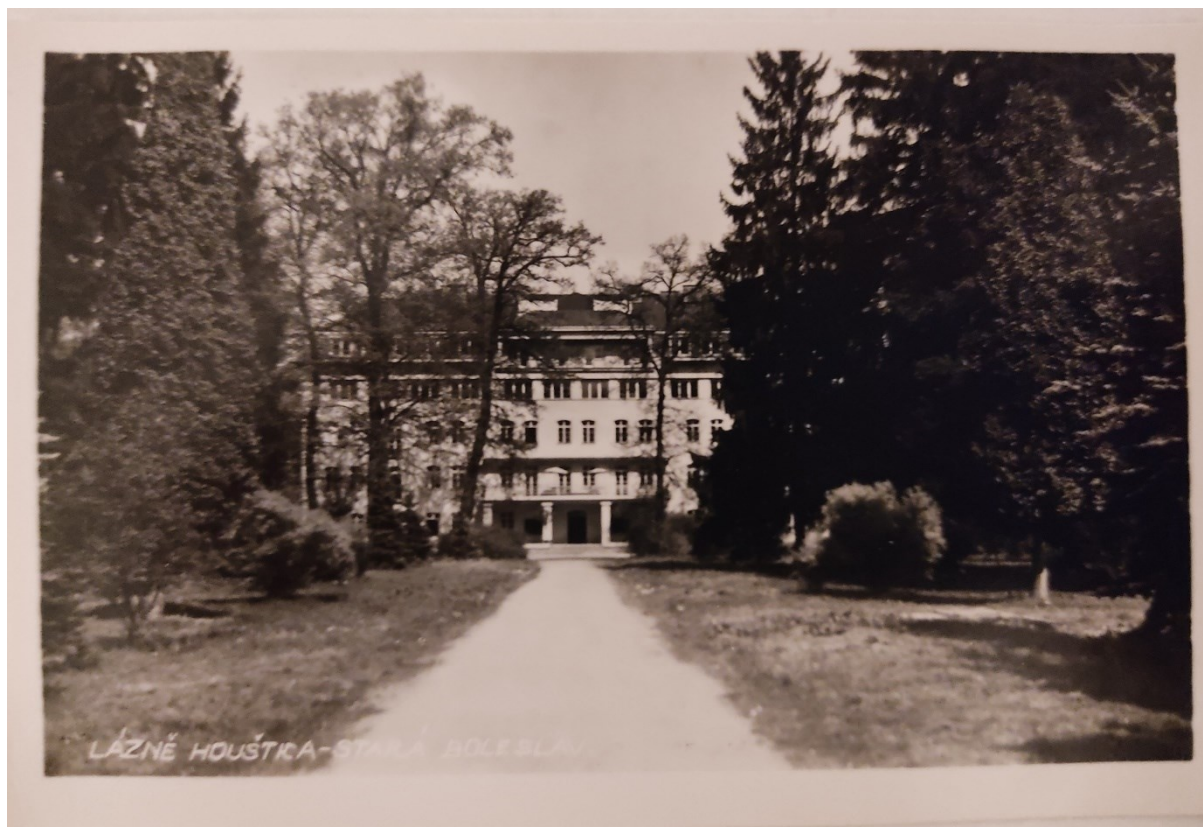
Obrazová příloha 8