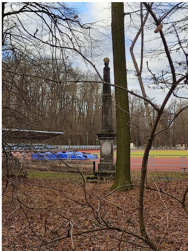
Obrazová příloha 12