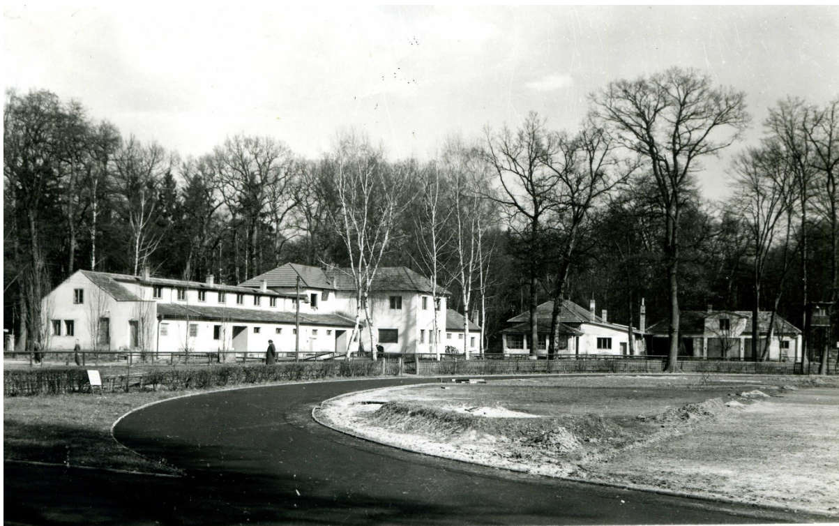
Obrazová příloha 10