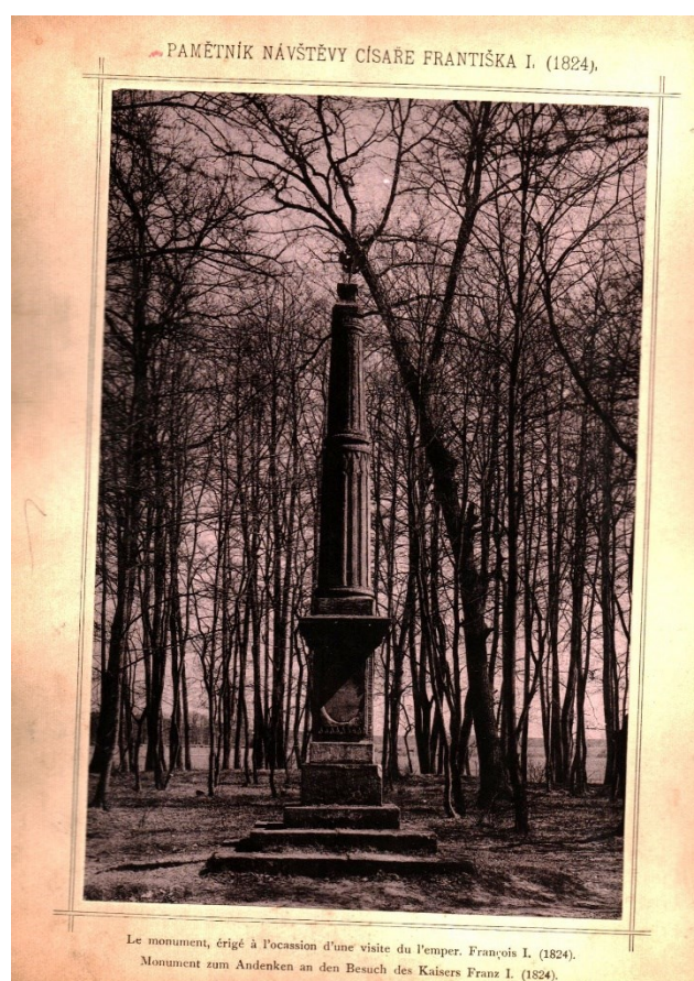
Obrazová příloha 13