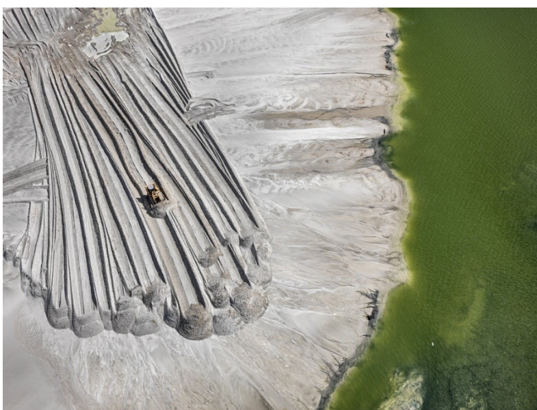
Obrázek 2: Salt Pans #32

Vzhledem k tomu, že se fotografie industriální krajiny zabývá jak přírodou, tak i průmyslem, není překvapivé, že se často dotýká environmentálních témat. „Především mě zajímá lidstvo skrze rozsáhlé průmyslové systémy – zkáza planety člověkem ve snaze dosáhnout růstu a pokroku za každou cenu,“ uvedl současný fotograf Edward Burtynsky, který se fotografií průmyslové krajiny dlouhodobě věnuje. 28 Jeho díla mají nepopiratelnou uměleckou hodnotu. Intenzivně pracuje s tvary, barvami a opakujícími se motivy. Nejvíce se soustředí na stopu, kterou průmyslová aktivita člověka zanechala na okolní krajině. Ke své práci často používá drony, zachycující krajinu z ptačího pohledu. To mu dovoluje poskytnout divákovi náhled na krajinu z úhlů, které běžně nevidí.