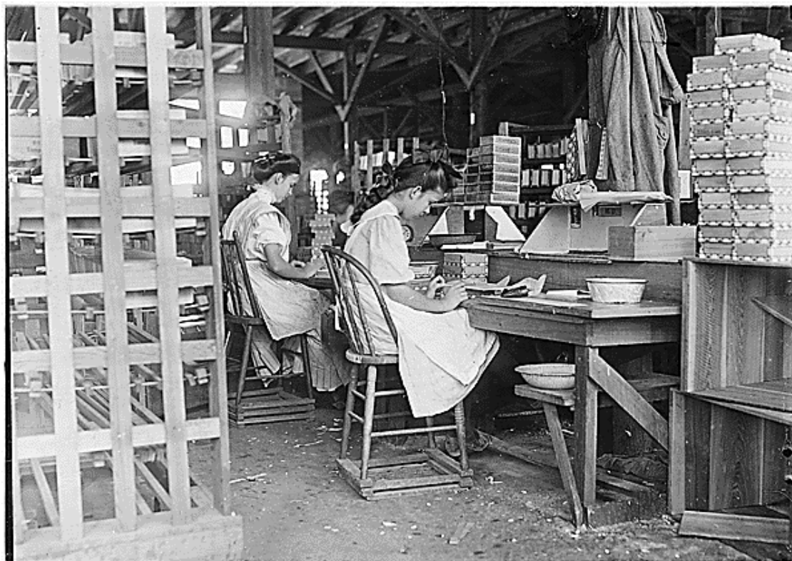
Obrázek 1: Girl Working in Box Factory (Fotografie: Lewis Hine)

dětské práce. 22 Jejím cílem bylo dosáhnout zákazu dětské práce a přesvědčit vlivné politické činitele, aby reformovali pracovní legislativu. Hine následující dekádu systematicky zachycoval děti, které pracovaly například v dolech či tkalnách. Jeho fotografie, které NCLC použil jako podpůrný materiál při lobbingu za zákaz dětské práce, byly klíčové pro úspěšné prosazení cíle organizace. 23