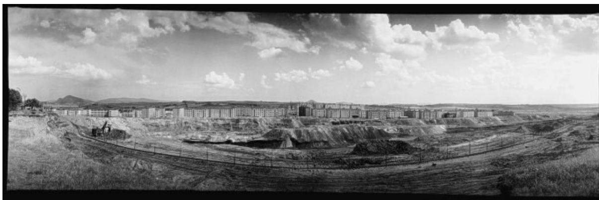
Obrázek 3: Nový most