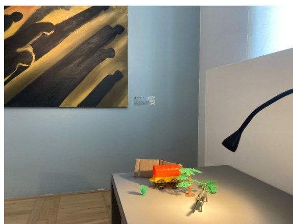
6. Jedno ze stanovišť určené k aktivnímu zapojení