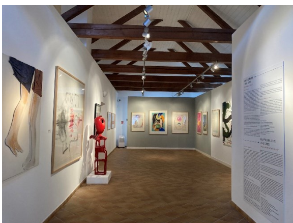
3. Pohled do výstavy Co přetrvá / Příběh galerie

V pardubické galerii mi informace v rámci rozhovoru poskytla jedna edukátorka, která působí na své pozici v galerii nejdéle a je vedoucí oddělení. V průběhu rozhovoru mi edukátorka ukázala prostory galerie v Domě U Jonáše a aktuální výstavu s edukační zónou Co přetrvá / Příběh galerie / 1953–2023 a výstavu Bez názvu (Z nových akvizic) .