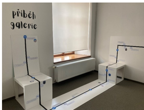
4. Samoobslužná zóna k výstavě