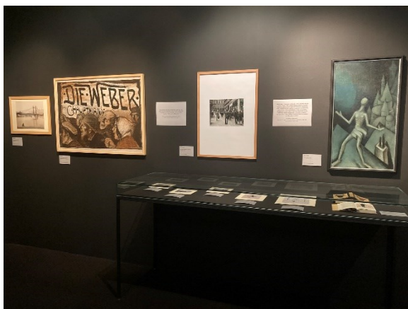
7. Pohled do výstavy ve výstavní síni „13“

V Západočeské galerii v Plzni jsem se za účelem rozhovoru sešla s edukátorkou, s kurátorkou a také se zaměstnankyní, která v rámci dvou částečných úvazků zastává funkci edukátorky i kurátorky zároveň. Se všemi jsem se setkala odděleně uvnitř jejich pracovního zázemí v pobočce galerie v Pražské ulici 13. S kurátorkou jsem rozhovor vedla v přednáškovém sále, s oběma edukátorkami v jejich kanceláři. V Západočeské galerii jsem také navštívila výstavu ve výstavní síni „13“ s názvem Umění předlouhého století a paměť lidské chůze .