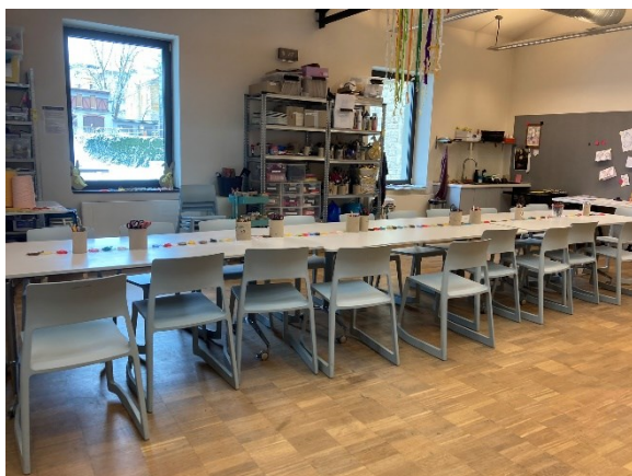
1. Ateliér připravený na edukační program

V Oblastní galerii Liberec jsem se sešla za účelem rozhovoru s jednou edukátorkou v její kanceláři. V rámci setkání jsem absolvovala část edukačního programu pro děti z mateřské školy věnující se Velikonocím. Edukační program vedla podle koncepce edukátorky externí lektorka.