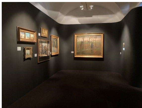
8. Pohled do výstavy ve výstavní síni „13“