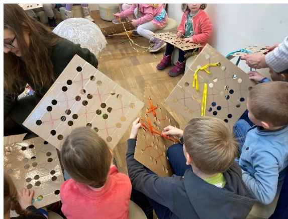
2. Edukační program s dětmi z MŠ k Velikonocím