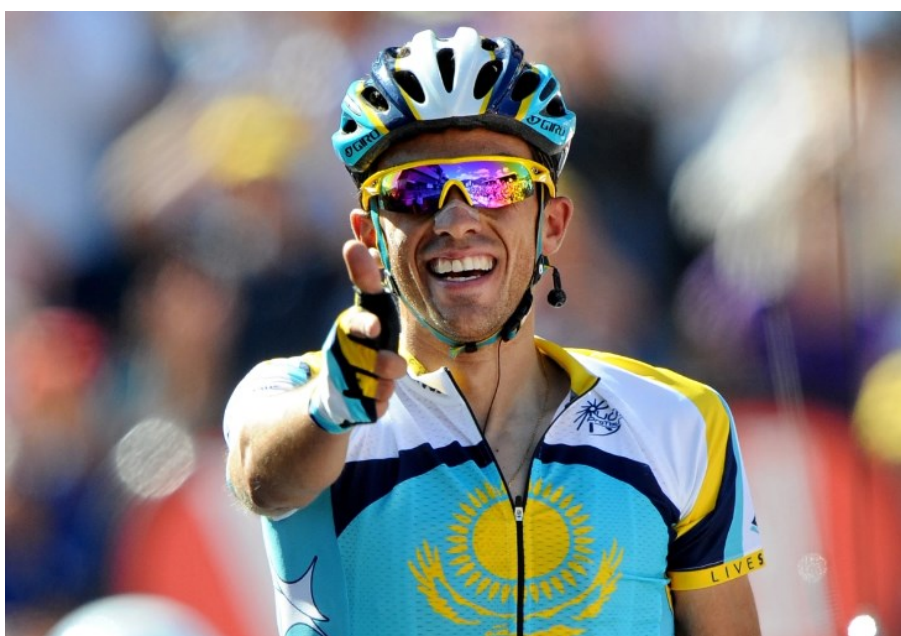
Obrázek 1 Cyklista Alberto Contador

Během své kariéry Contador získal nespočet prestižních ocenění a titulů. Od roku 2007, kdy zahájil svoji kariéru dokázal vyhrát 24 etapových závodů z 64 účastí. Celkem 42 z nich mu přineslo umístění na celkovém pódiu a 57krát se vešel do šestého místa v celkovém pořadí. 80 dní pak strávil v trikotu lídra na Grand Tours. Nad všemi jeho úspěchy a vyhranými závody ovšem ční počet sedmi vyhraných Grand Tours. Contador se rovněž svými výkony zařadil mezi sedm cyklistů v historii silniční cyklistiky, kteří dokázali triumfovati na všech třech třítydenních etapových monumentech – tzv. Grand Tours (Tour de France, Giro d'Italia a Vuelta a España). 53