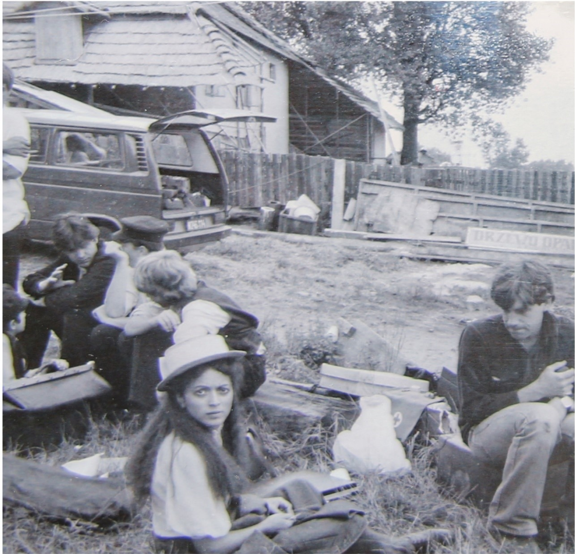
Fotografie pořízená během natáčení amerického filmu Jentl (režie Barbra Streisand, 1983). V popředí Vida N.