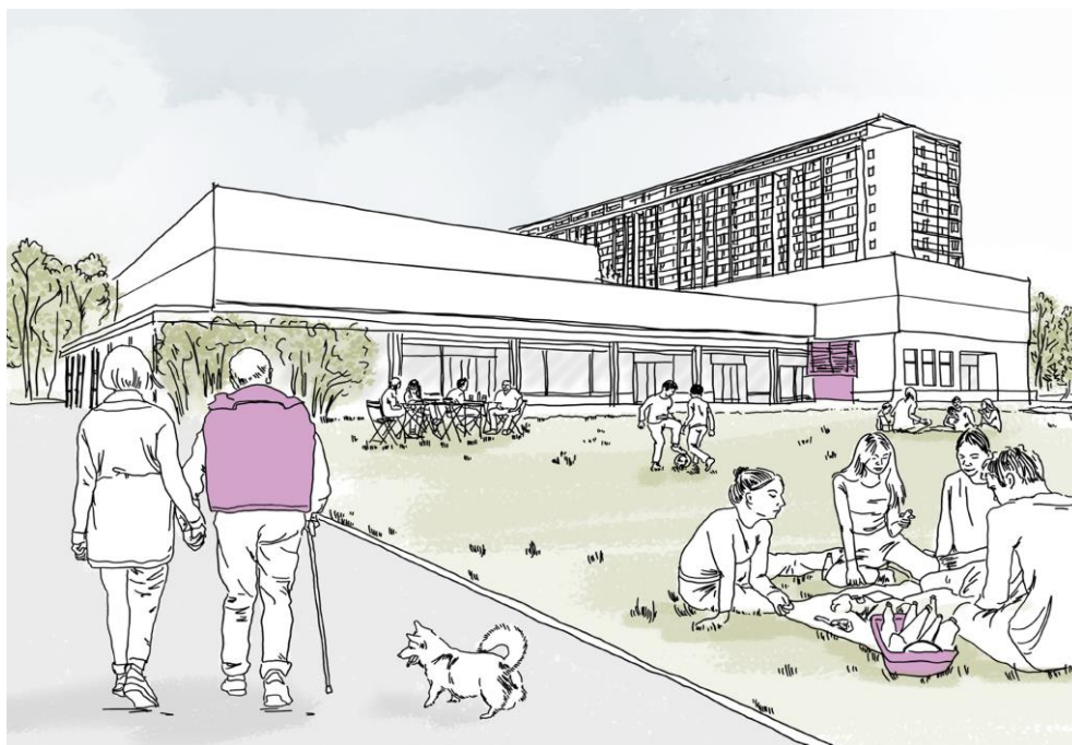
Obrázek 4.1.3.: Jedna z možných variant dostavby okrskového centra Čumpelíkova

2023. Dle vyjádření spolku se jedná o studii, se kterou jsou místní obyvatelé spokojeni, a zároveň splňuje požadavky všech aktérů. S výstavbou podél ulice Střelničná, proti které místní nejvíce brojili v návrhu od studia MOBA, současná studie nepočítá. Zaměřuje se spíše na fungování sídliště a jeho strukturu než na novou zástavbu, což je u toho typu dokumentu poměrně ojedinělé.