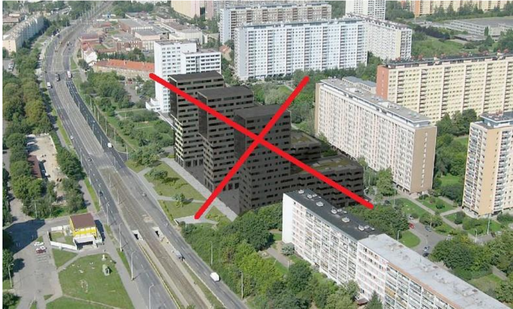
Obrázek 4.1.1.: Přeskrtnutá vizualizace projektu Střelničná