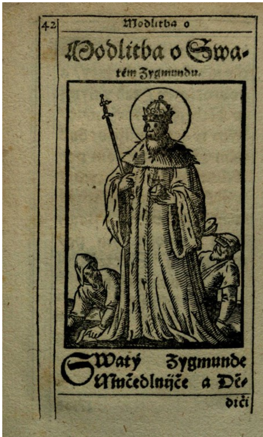
Obrázek 10 – Sv. Zikmund. Duchovní obveselení , s. 42.