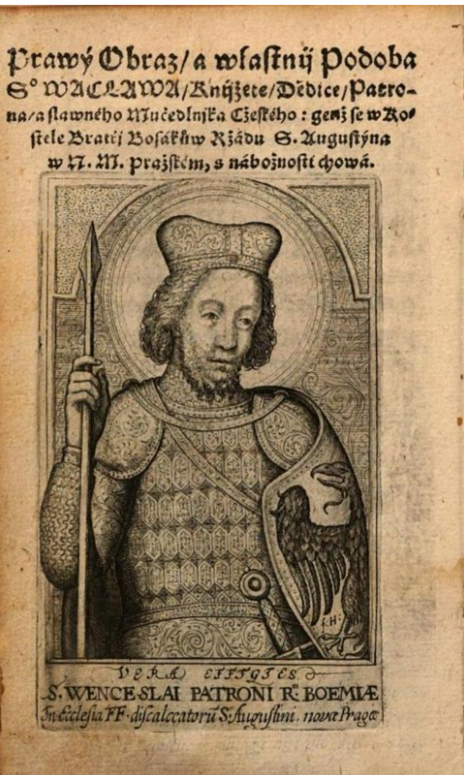
Obrázek 1 – Pravý obraz ( vera effigies ) a vlastní podoba sv. Václava. Aegidius: Věnc blahoslawenému a věčně oslawenému knížeti českému , fol. A5