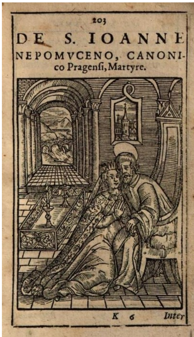
Obrázek 15 – Sv. Jan Zpovědník. Hymnorum sacrorum , s. 203.