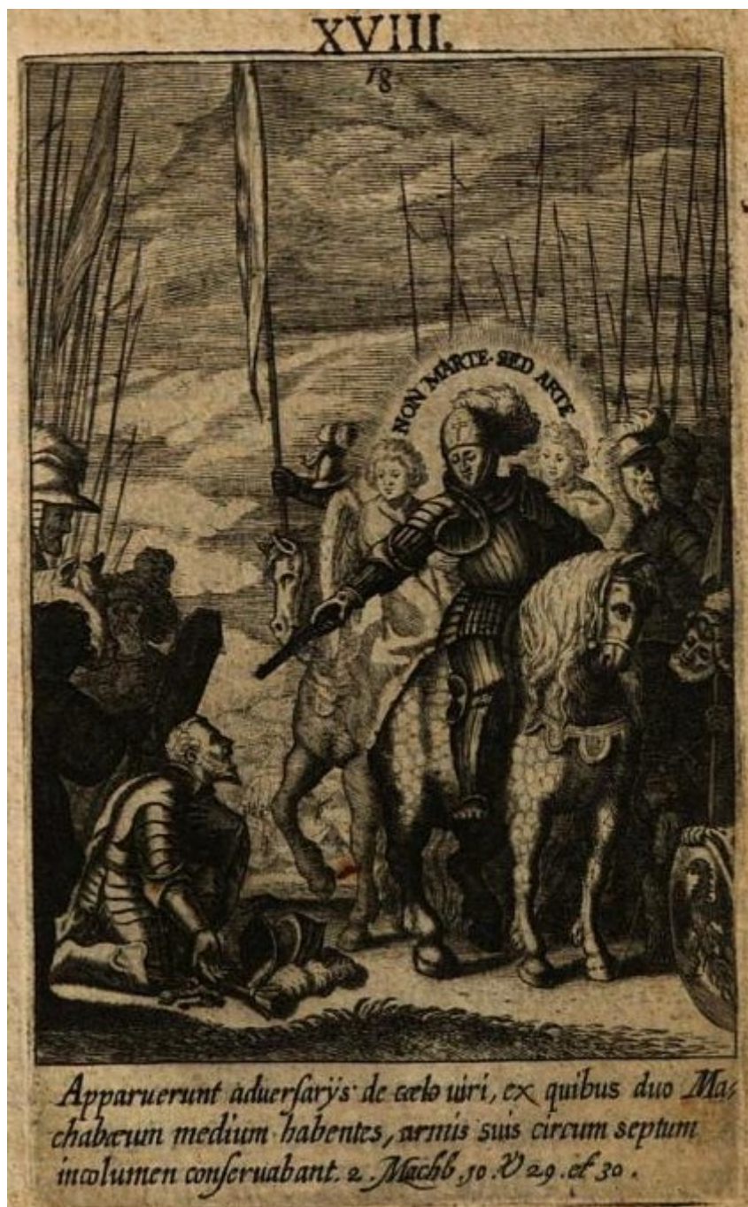
Obrázek 4 – Vyobrazení zlického knížete, kořícího se sv. Václavu. Aegidius: Věnc blahoslawenému a věčně oslawenému knížeti českému , fol. D6