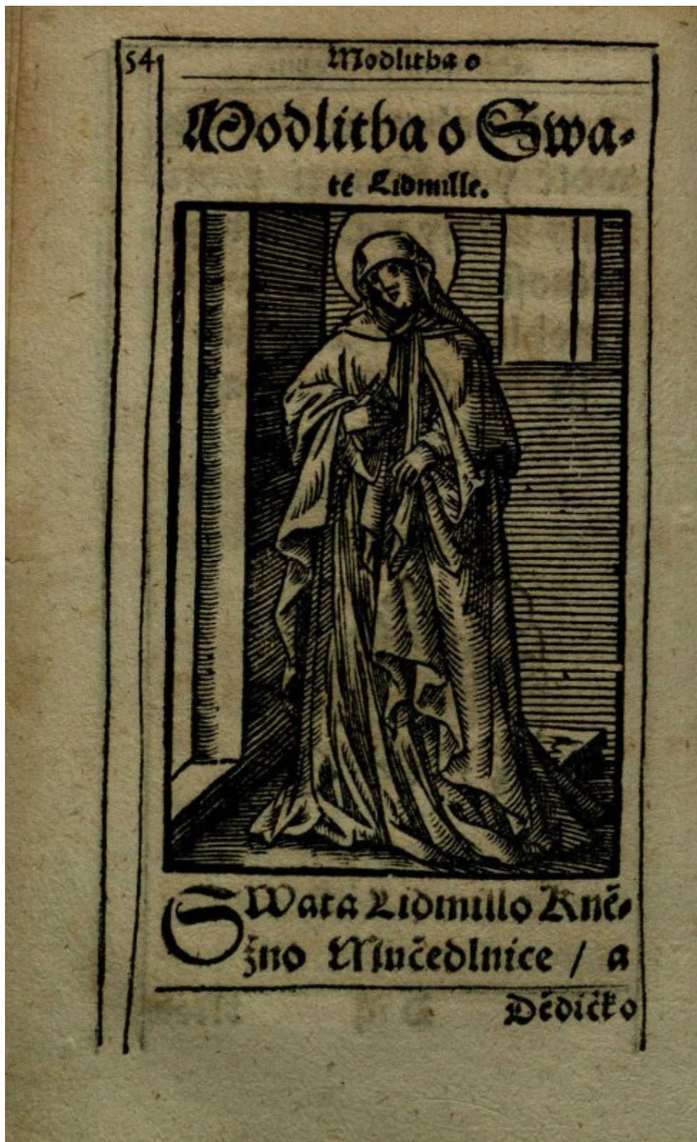
Obrázek 9 – Sv. Ludmila. Duchovní obveselení , s. 54.