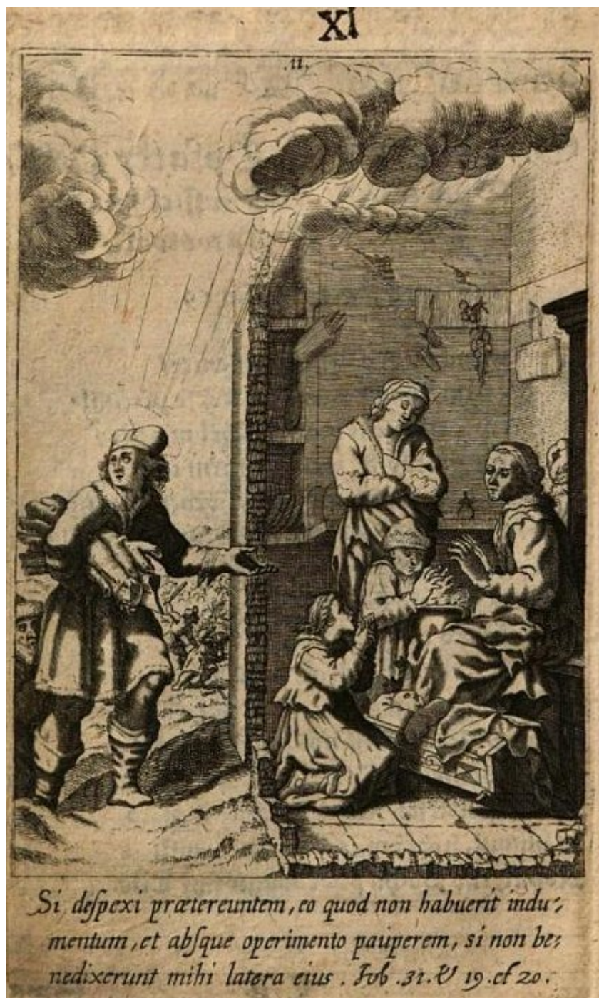
Obrázek 3 – Vyobrazení sv. Václava darujícího dřevo chudým. Aegidius: Věvec blahoslawenému a věčně oslawenému knížeti českému, fol. C2