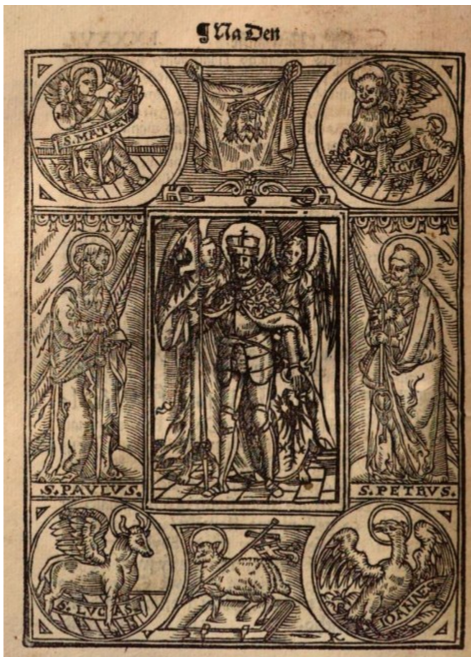
Obrázek 14 – Svatý Václav mezi čtyřmi Evangelisty a sv. Petrem a Pavlem. Modestin: Na den památný Svatého Václava , s. 77.