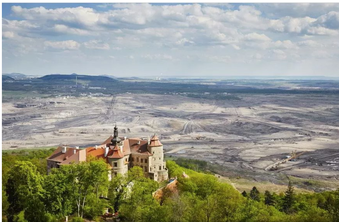
Obrázek 3: Pohled na lom Československé armády z vyhlídky nad zámek Jezeří.