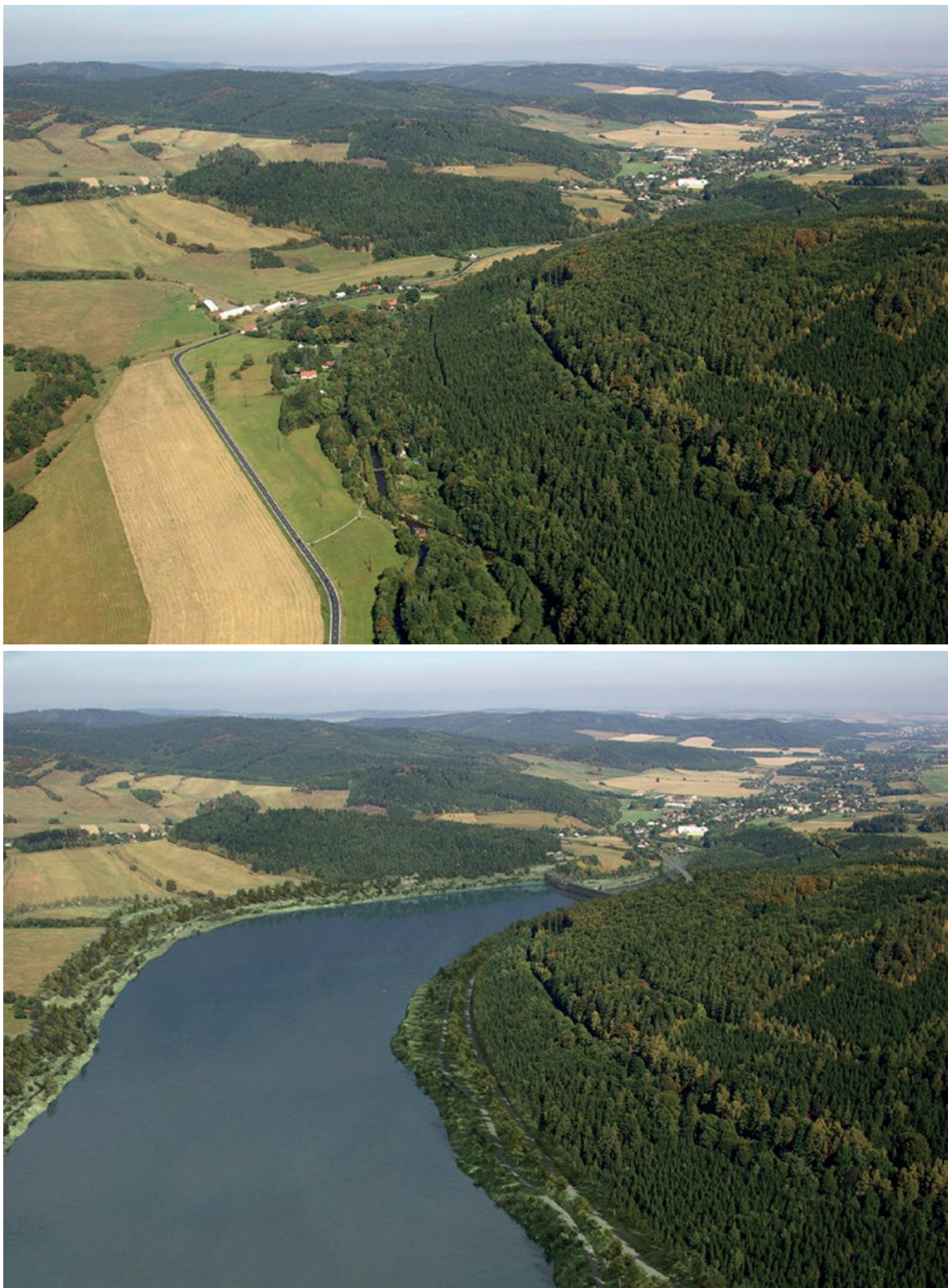
Obrázek 1: Vizualizace přehrady Nové Heřminovy. Současný stav versus předpokládaná podoba.