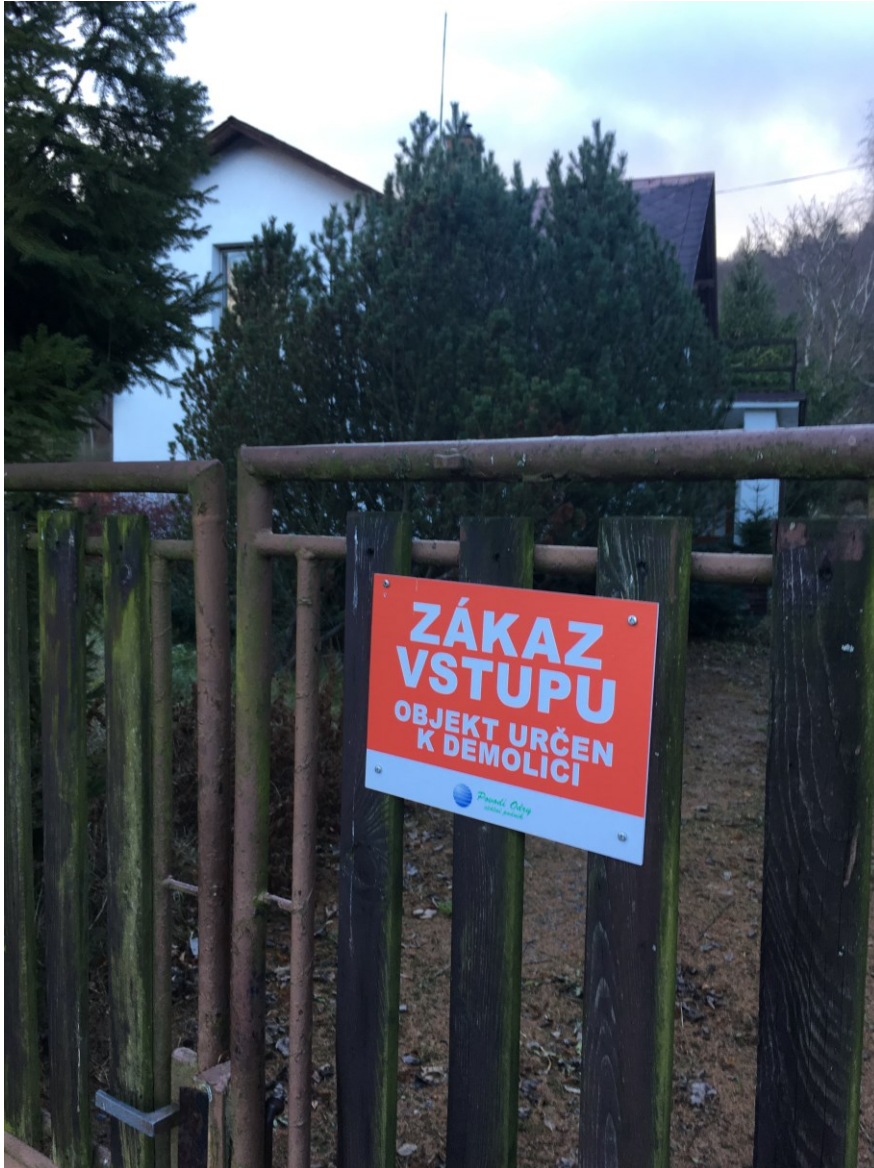
Obrázek 2: Cedule na již vykoupeném domě v nových Heřminovech.