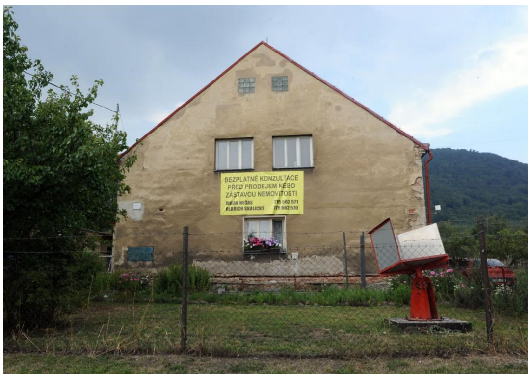
Obrázek 4: Reklama na domě v Horním Jiřetíně na realitní kancelář, jejímž prostřednictvím byly zkupovány nemovitosti v obci.