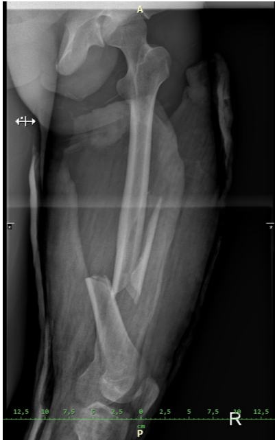
Příloha č. 4: RTG snímek post