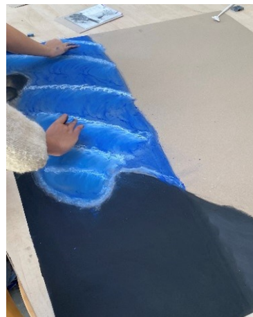
Obrázek 5 Ukázka práce žáků II