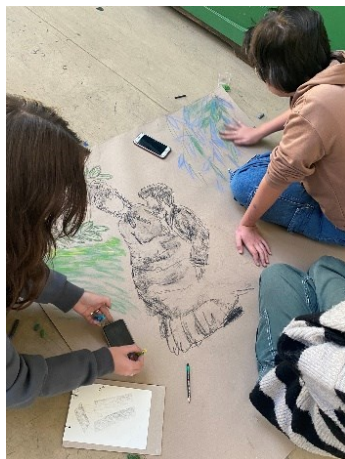
Obrázek 3 Ukázka práce žáků I