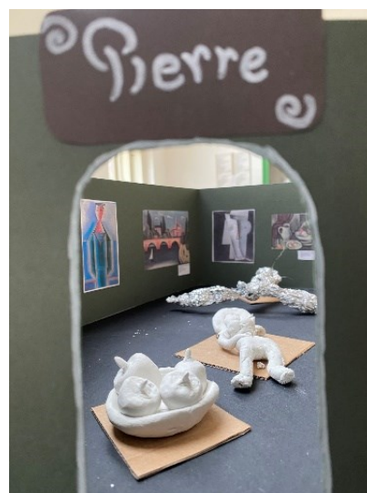
Obrázek 8 Ukázka hotové práce žáků III