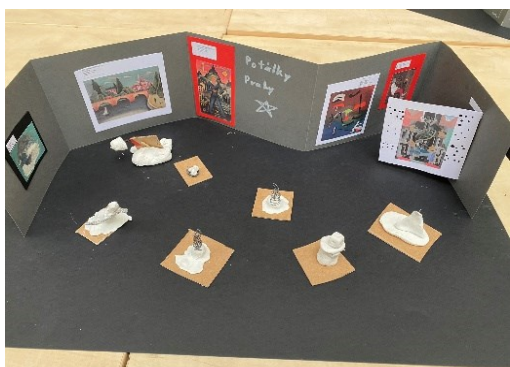
Obrázek 6 Ukázka hotové práce žáků I