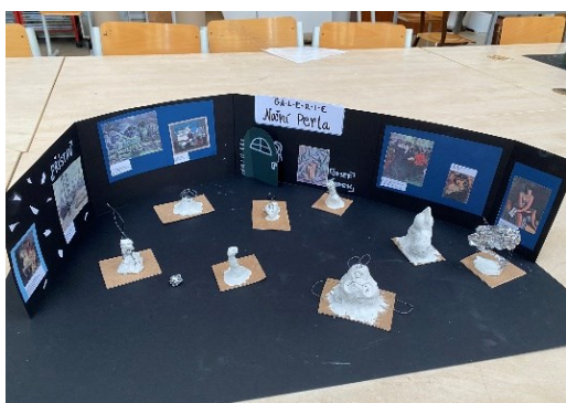
Obrázek 7 Ukázka hotové práce žáků II