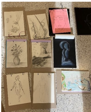
Obrázek 3 Skicáky

Rozdělte se do skupin a vaším úkolem bude zobrazit hlavní poznatky, které jste si z galerie zaznamenali. Zobrazte své detaily a skici tak, aby kompozičně i námětově tvořily záznam vaší návštěvy galerie na velký společný formát.