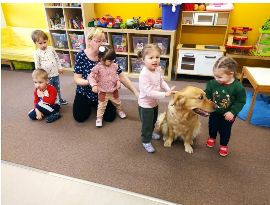
První kontakty s fenkou