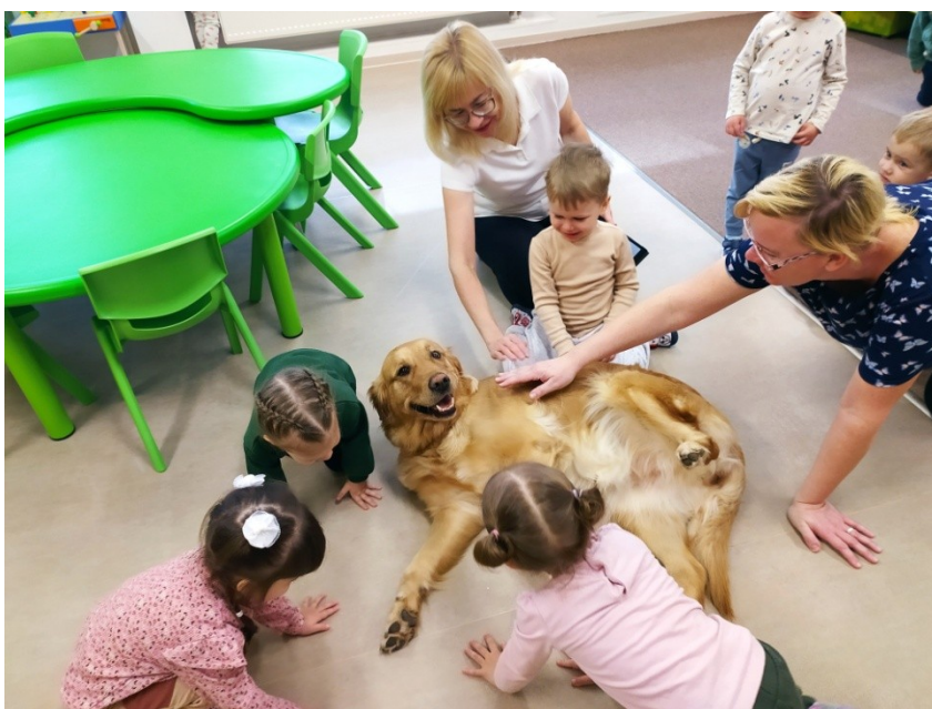
Pohlazení od paní učitelky a asistentky