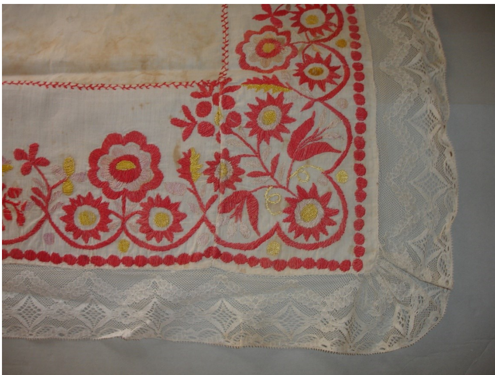
8) H4-8472 Roucha od Emilie Fryšové, sbírka Národního muzea, Etnografické oddělení HM.