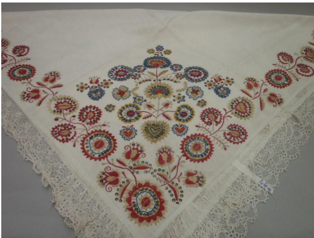
10)44 N Plena od Emilie Fryšové, sbírka Husitského muzea v Táboře , podsbírka etnografická, uložená v pobočkách v Blatském muzeu v Soběslavi a Veselí nad Lužnicí .