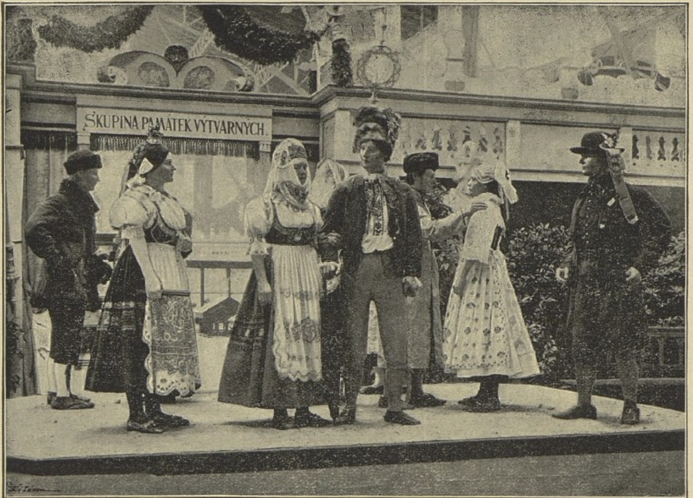
Skupina svatebčanů z Blat (vystavila E. Fryšová na Národopisné výstavě v Praze). (Vyobrazení „Č. Lidu“.)