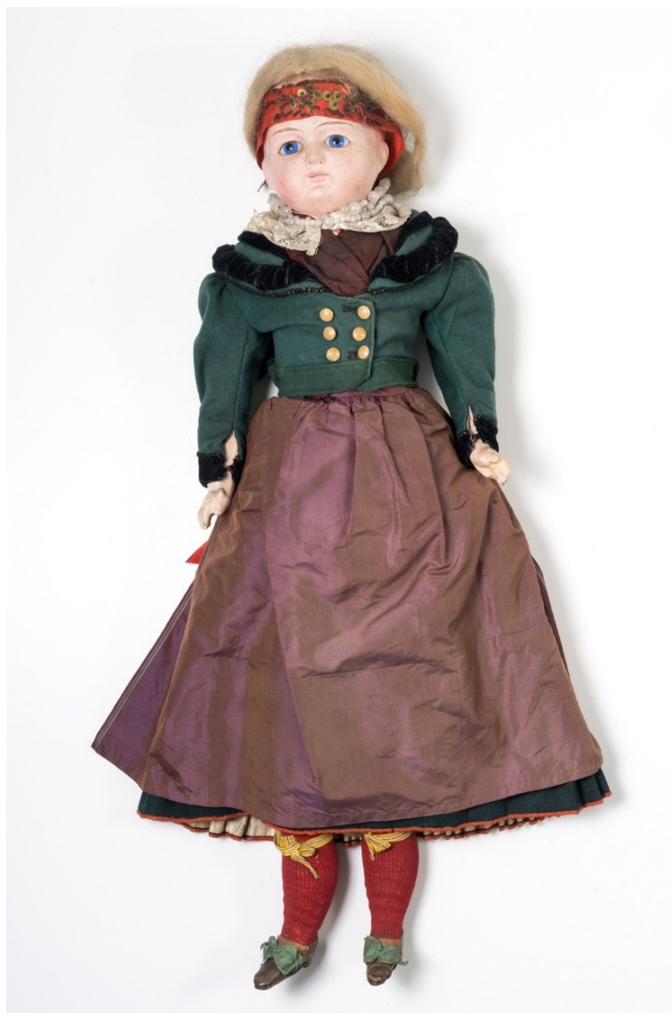
7) HE 309 Model blatské nevěsty od Emilie Fryšové, sbírka Prácheňského muzea , podsbírka etnografie.