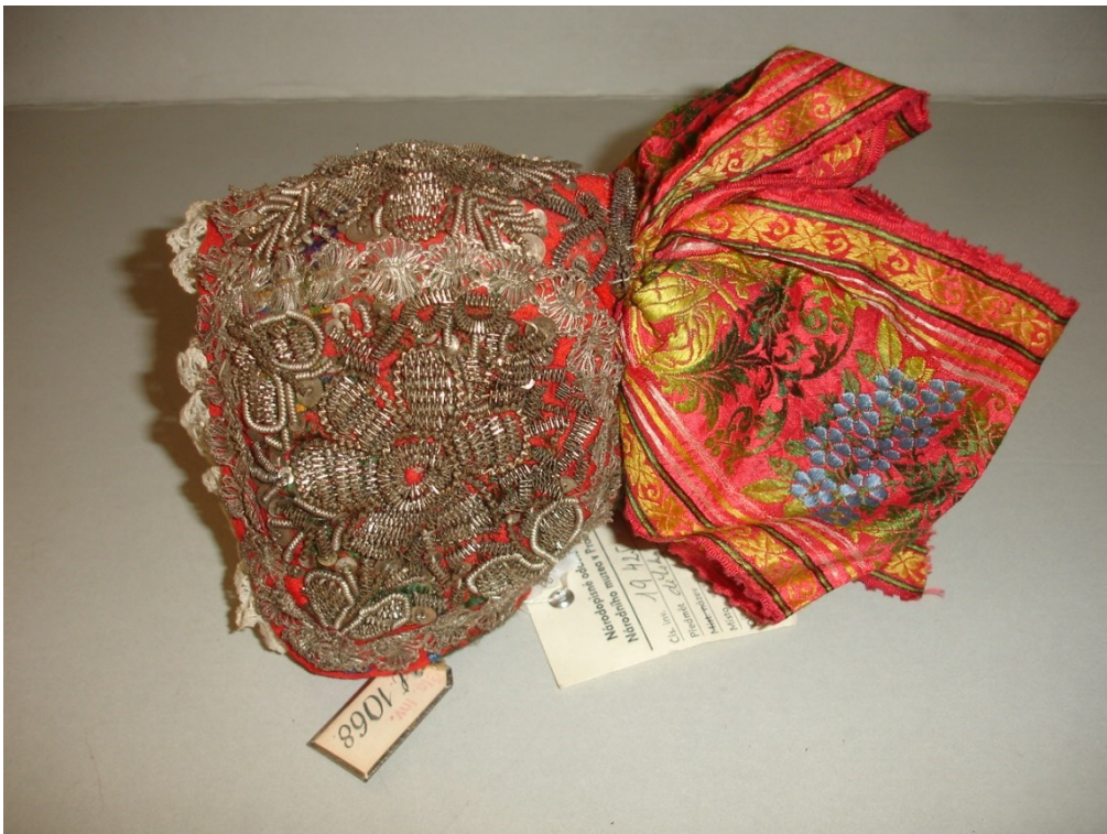
9) H4-192425 Čepček dětský od Emilie Fryšové s původní stříbrnou cedulkou, sbírka Národního muzea, Etnografické oddělení HM.