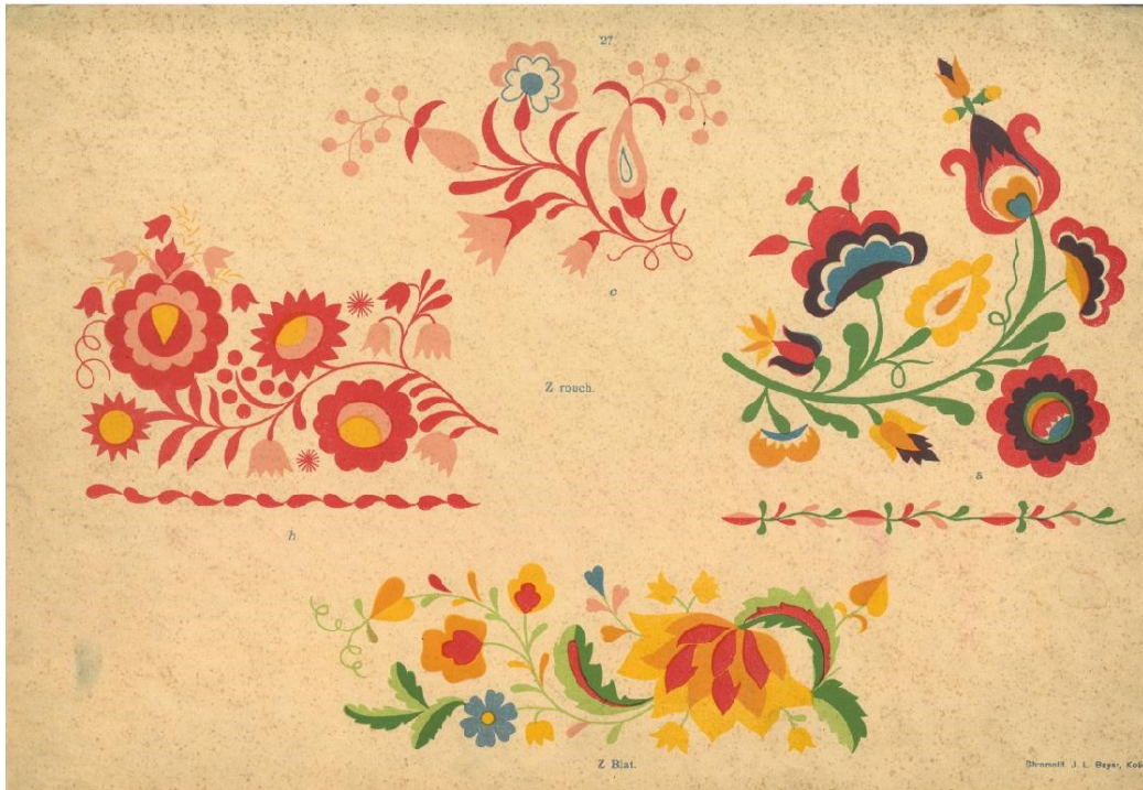
12) Jedna z ilustrací Emilie Fryšové z Ornamentu jihočeského , Západočeské muzeum v Plzni knihovna.