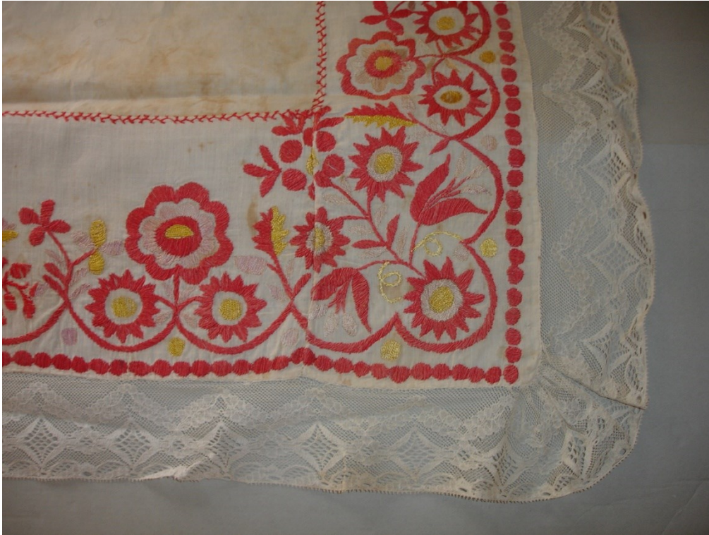
8) H4-8472 Roucha od Emilie Fryšové, sbírka Národního muzea, Etnografické oddělení HM.