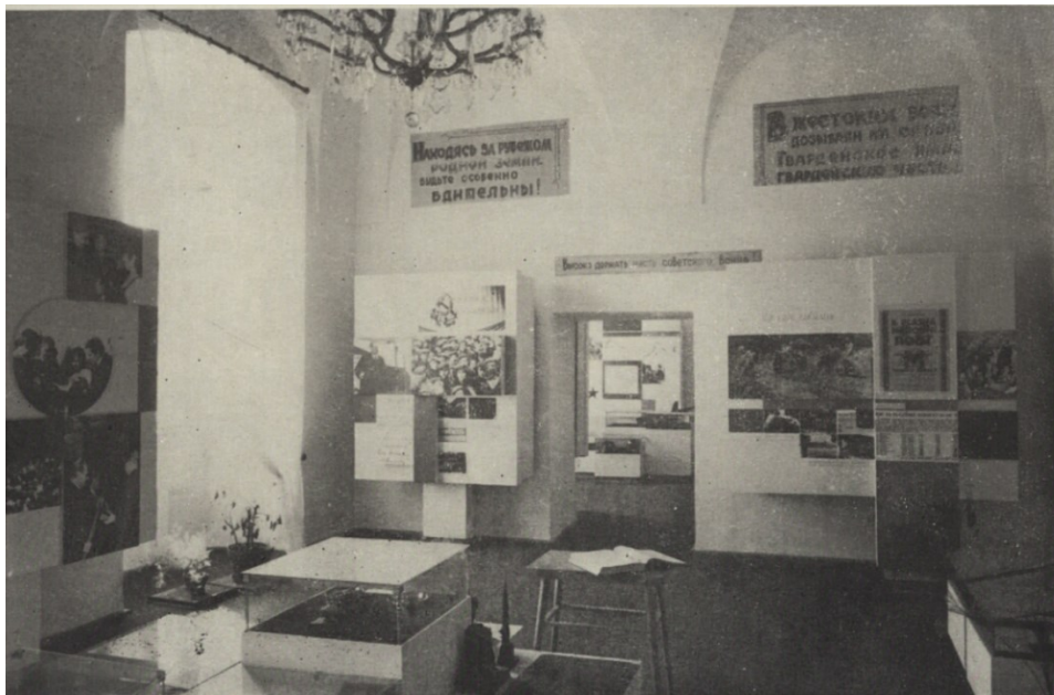
Příloha č. 9 - Expozice Osvobození Sovětskou armádou na SZ Plasy