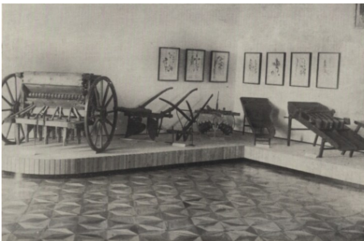
Příloha č. 7 - Expozice Československého zemědělského muzea na zámku Kačina ukazující nevhodnost některých expozic v zámeckých prostorách