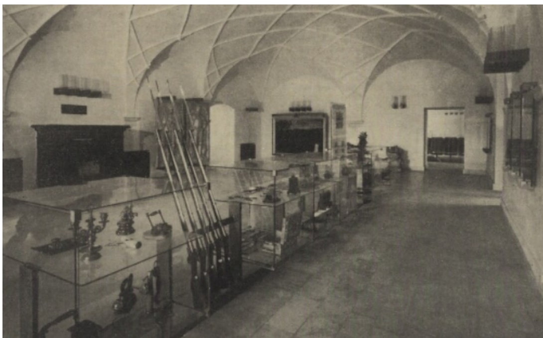
Příloha č. 6 - SZ Opočno – vstupní historická expozice