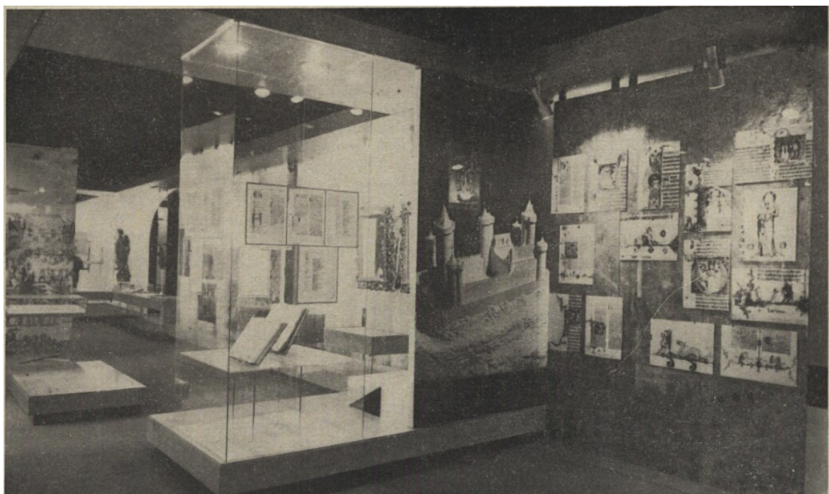
Příloha č. 5 - SZ Březnice – vstupní historická expozice