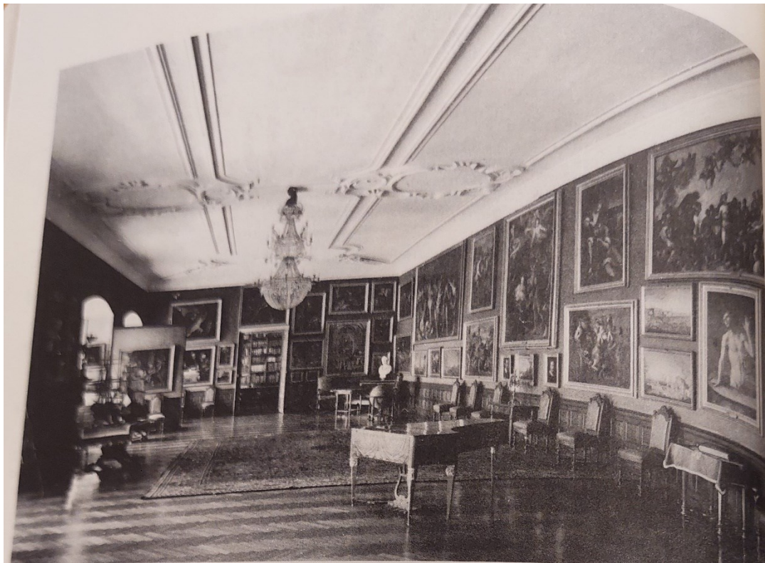
Příloha č. 8 - SZ Opocno – hlavní sál obrazárny, 1977