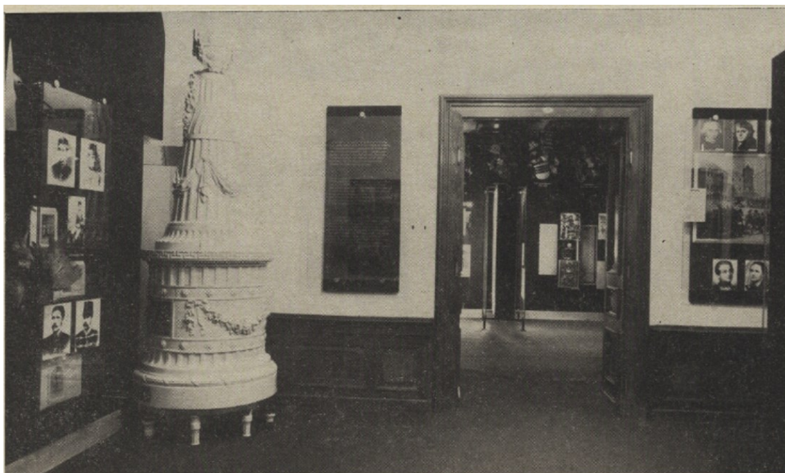
Příloha č. 4 - SZ Konopiště – vstupní historická expozice