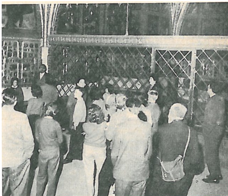
Příloha č. 3 - Návštěvnická skupina na prohlídce SH Karlštejn