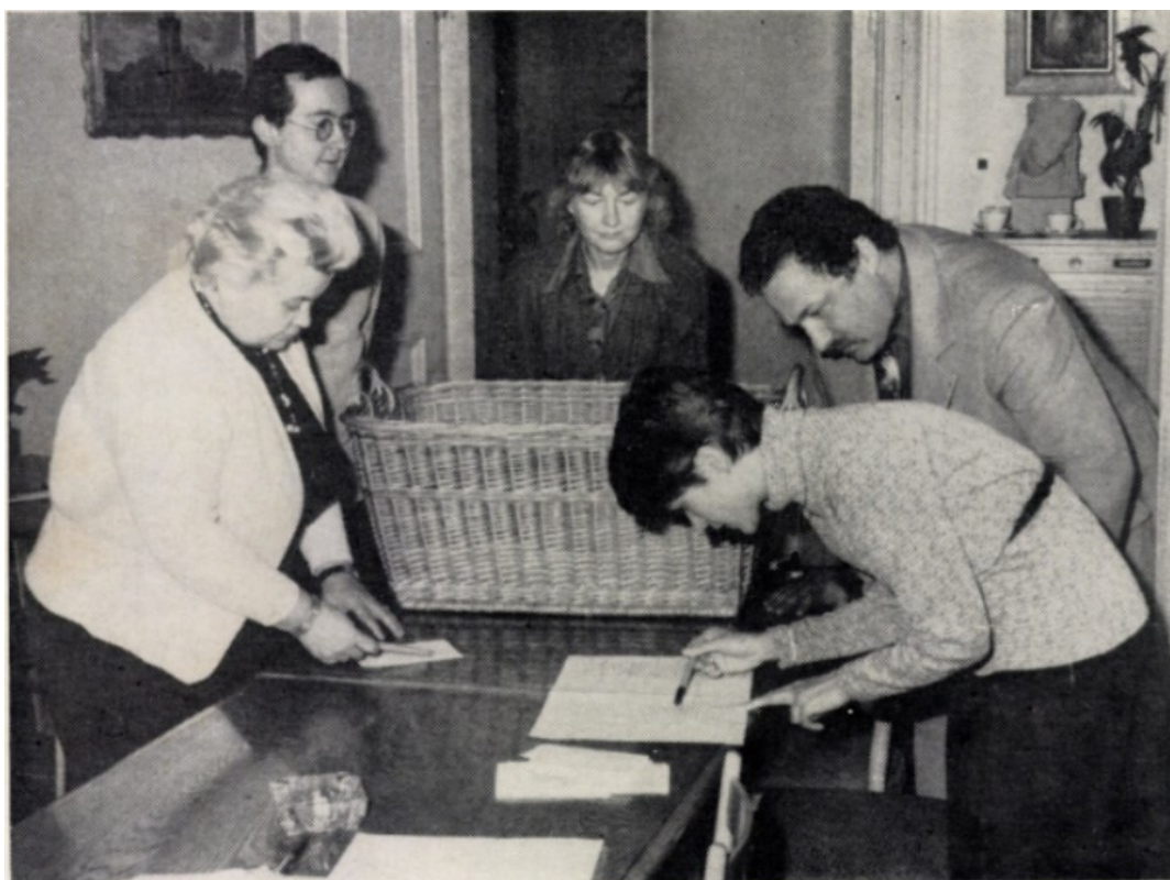
Příloha č. 10 - Losovací komise při slosování soutěže „Po stopách historie” zřejmě v roce 1983