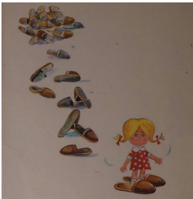
12. Příloha č. 11 - Ilustrace J.E. Jiráčka, která inspirovala název této DP