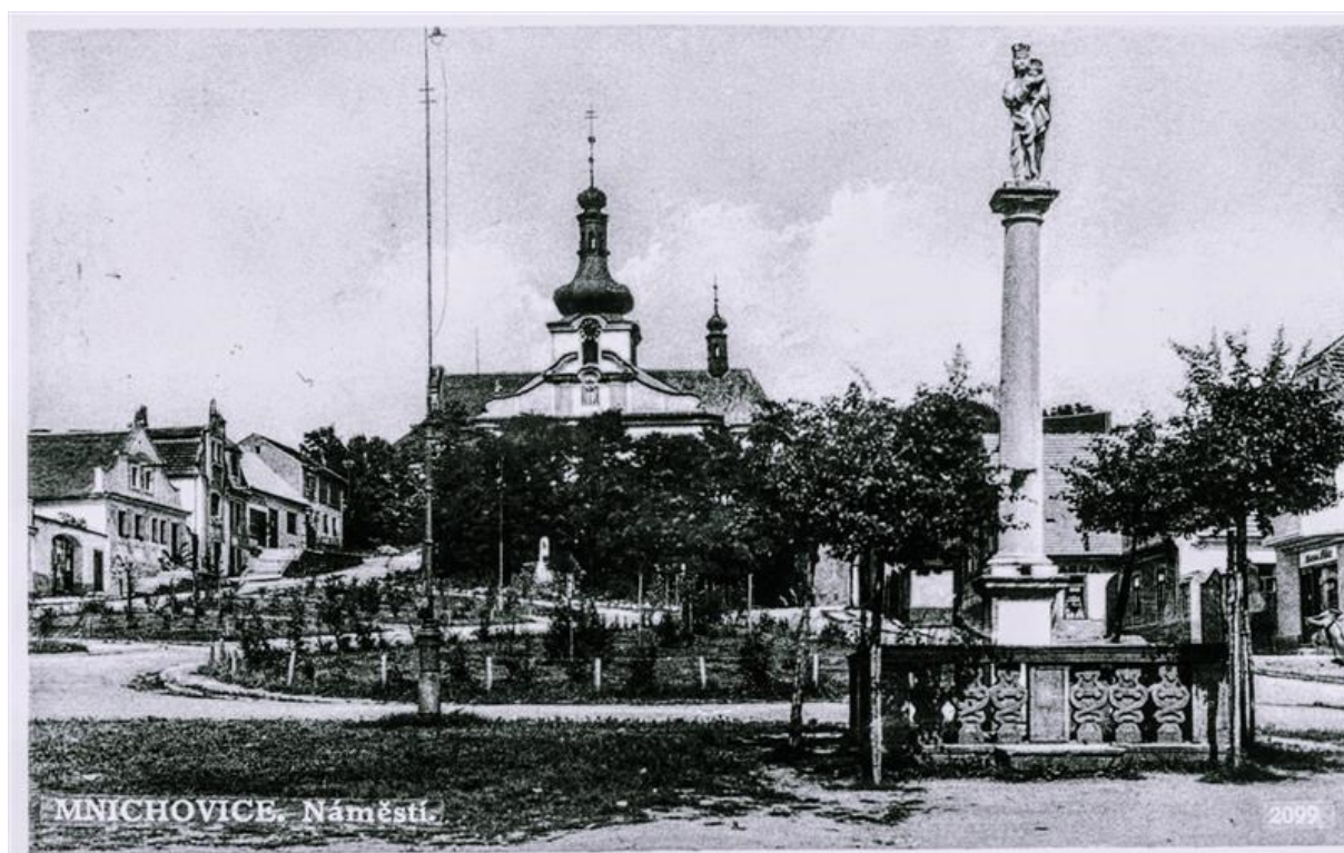
Obrázek 26 - Drobné sakrální památky – Socha panny Marie v Mníchovicích.