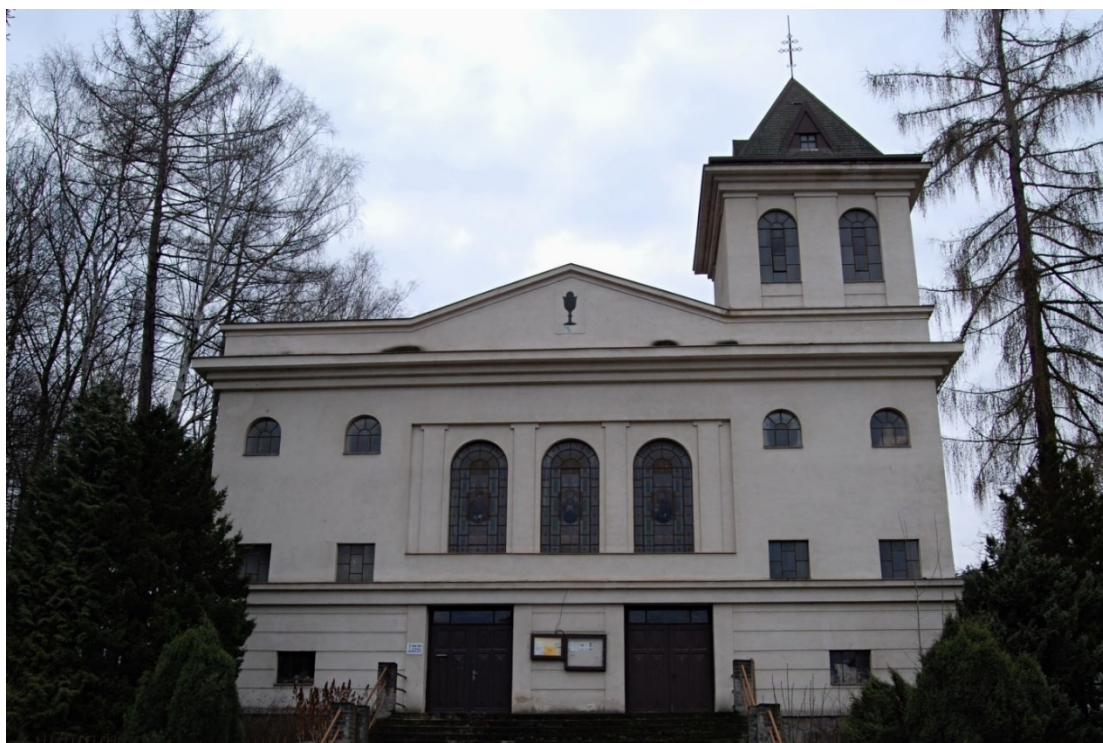
Obrázek 18 - Husův sbor v Mníchovících.