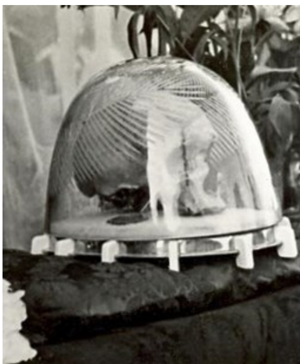
Obrázek 23- Ostatky sv. Vojtěcha vystavované v Mnichovicích.