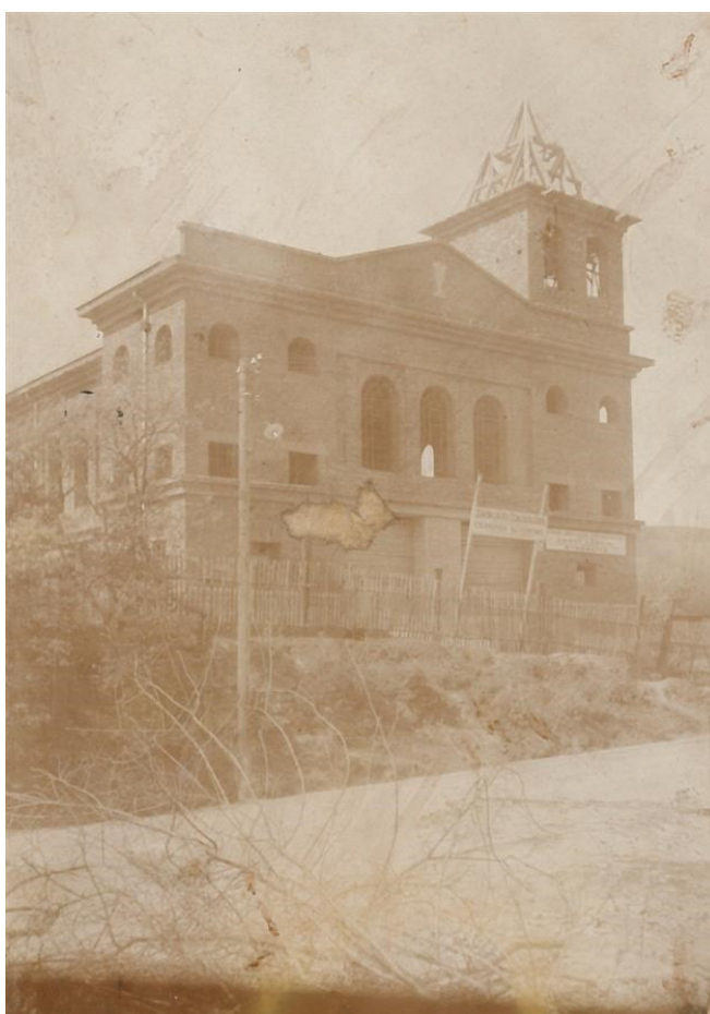
Obrázek 19 - Stavba Husova sboru v Mníchovících, 20. léta 20. století. (Archiv města Mníchovice)