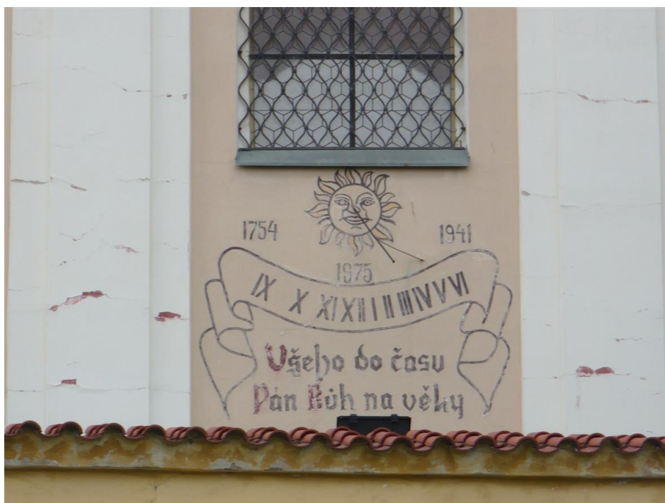
Obrázek 6 - Sluneční hodiny na budově Mnichovického děkanátu.