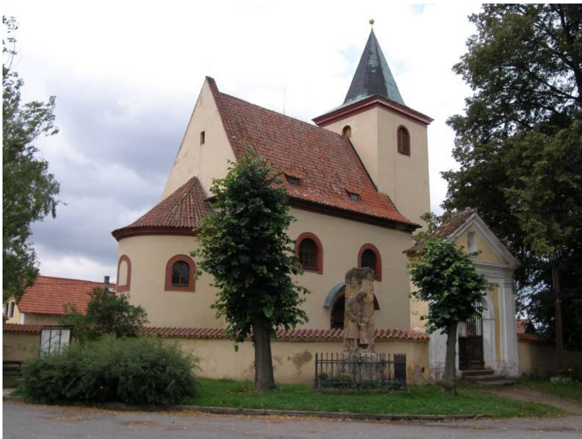
Obrázek 7 - Kostel sv. Václava v Hrusicích.