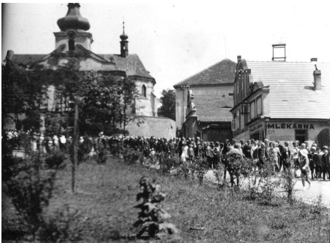
Obrázek 4 – Slavnostní svěcení zvonů v Mnichovicích - rok 1948.