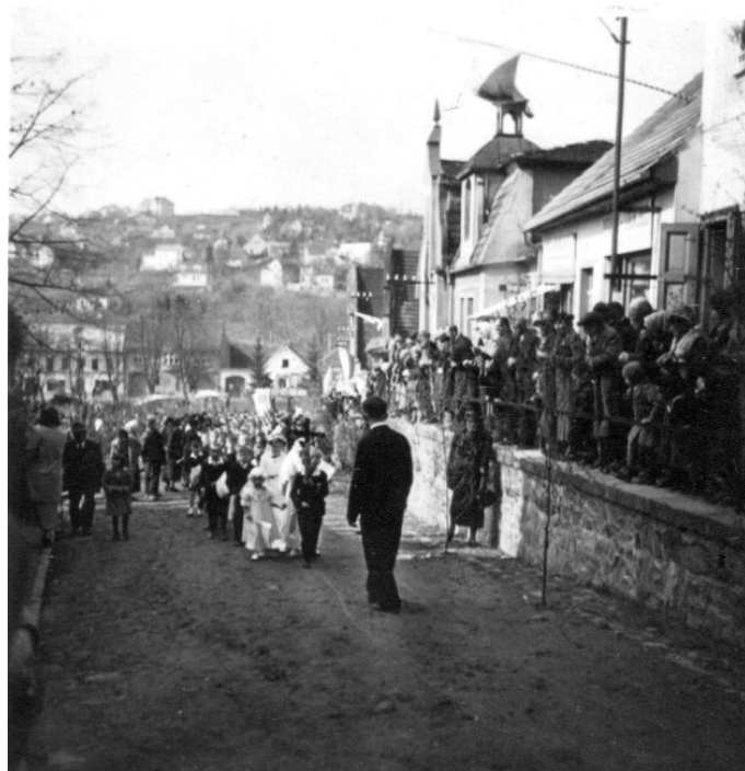
Obrázek 4 - Průvod při slavnostní návštěvě arcibiskupa Kašpara.