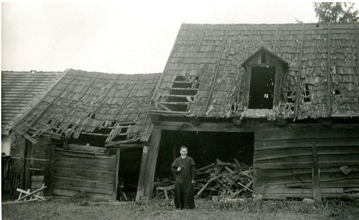
Obrázek 5 - Děkan Alois Nogol s hospodářskými budovami mnichovického děkanství.