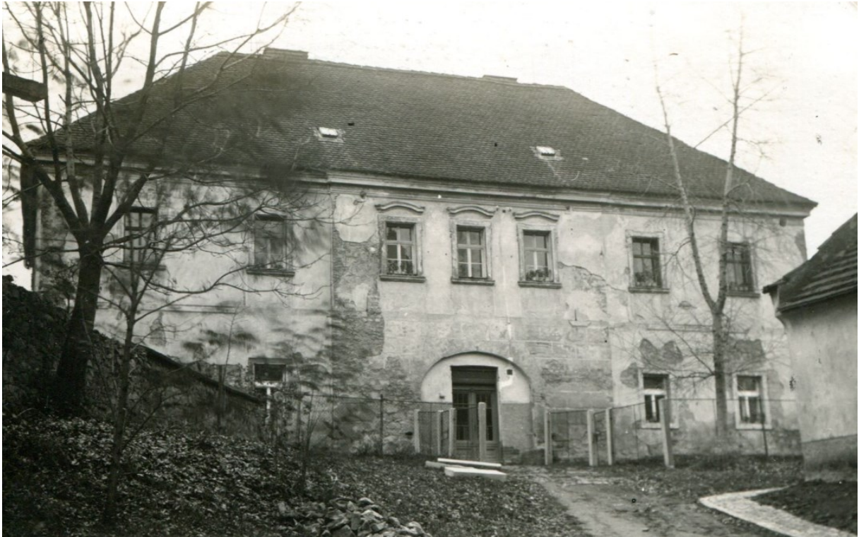
Obrázek 9 - Budova Mníchovického děkanátu.