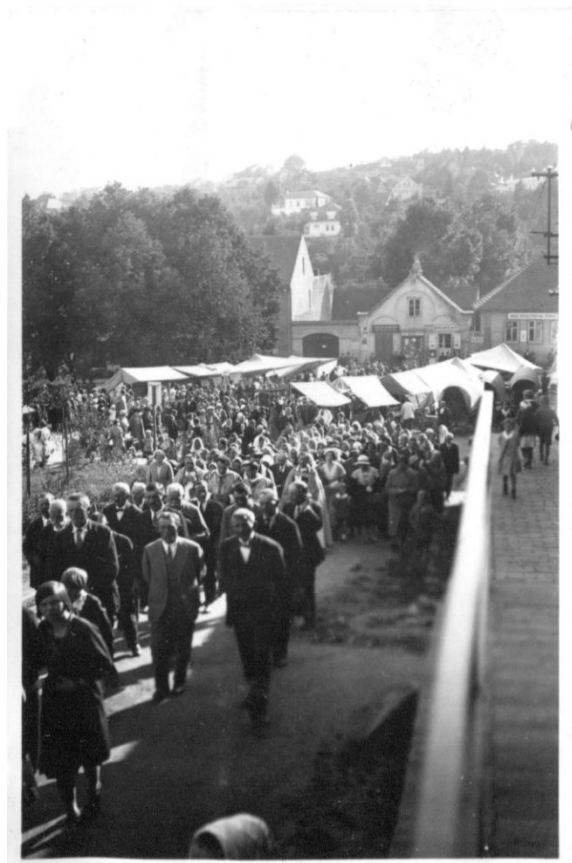
Obrázek 11 - Mníchovická mariánská pouť.