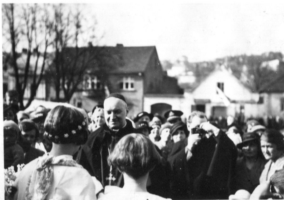
Obrázek 2- Arcibiskup Kašpar při biřmování v Mnichovicích.