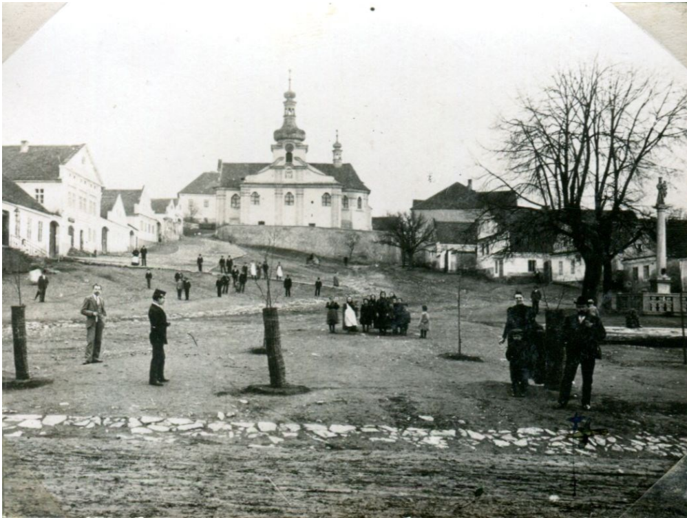
Obrázek 7 - Mnichovické náměstí s Kostelem narození panny Marie.