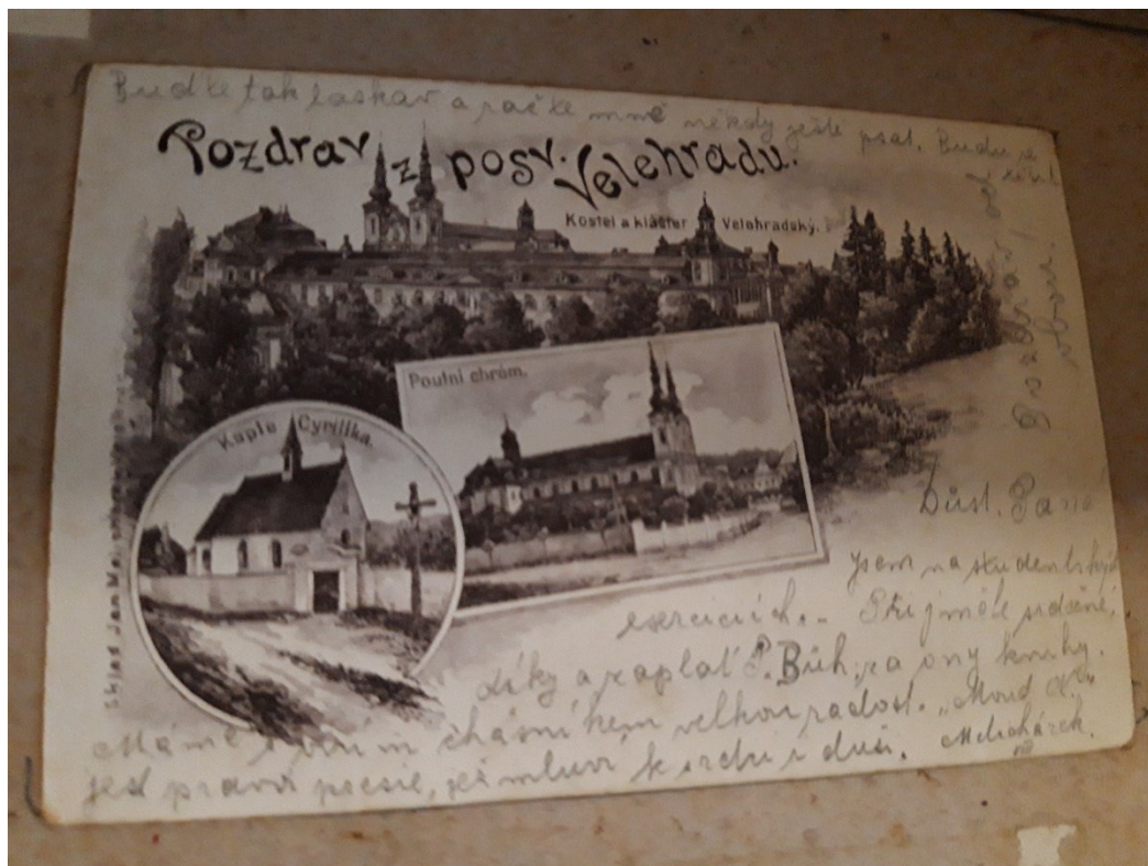
Obrázek 8 - Pozdrav z pouti na Velehradě podniklé poutníky z regionu.