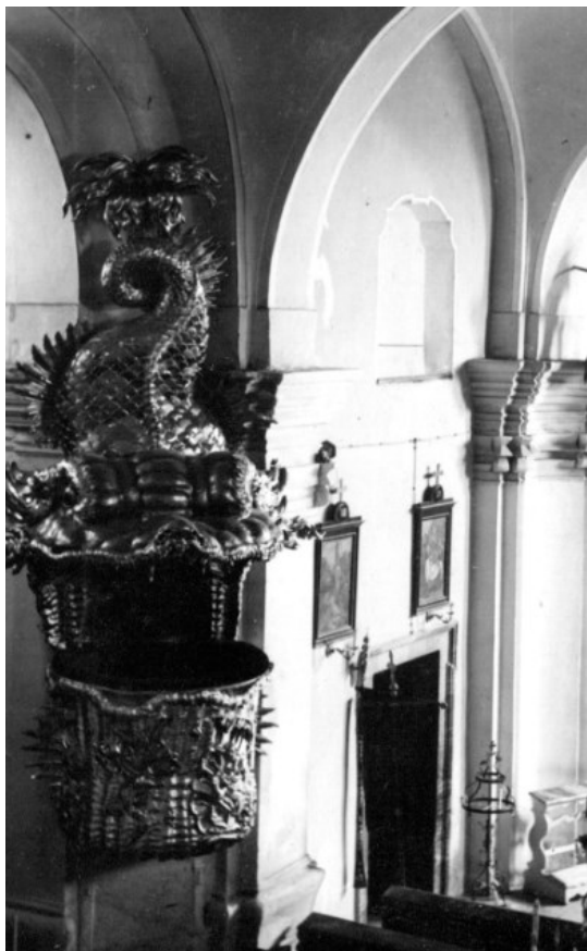
Obrázek 2 - Kazatelna v mnichovickém kostele.