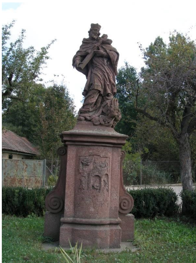
Obrázek 25 - Drobné sakrální památky - Socha sv. Jana Nepomuckého v Mníchovicích.