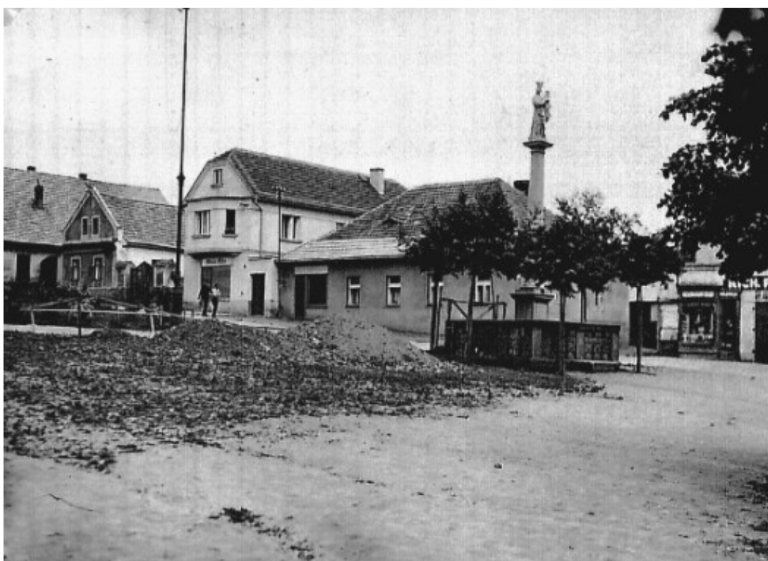
Obrázek 17 - Spor o stavbu váhy na mnichovickém náměstí.