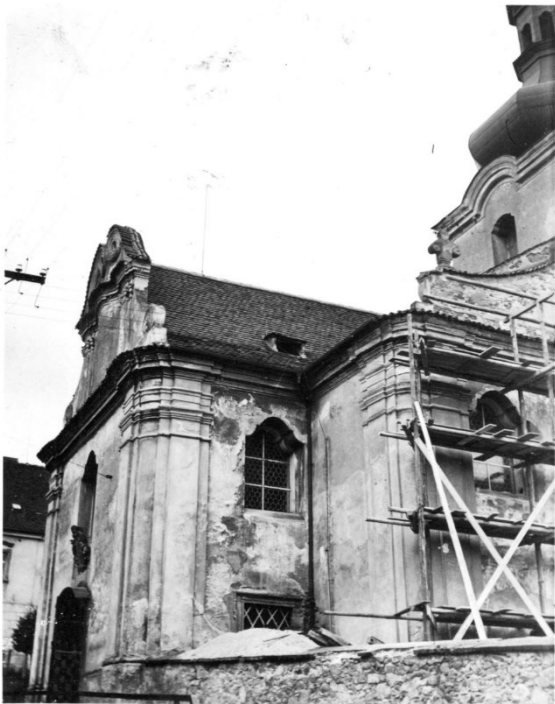
Obrázek 3 - Stav mnichovického kostela. Jeho potřebná oprava.