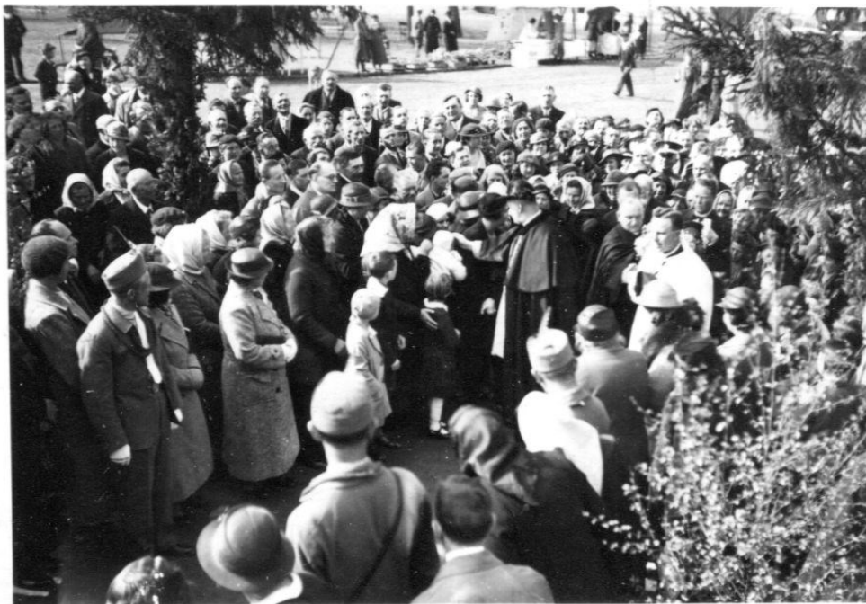
Obrázek 1 - Arcibiskup Kašpar - slavnost v Mnichovicích.