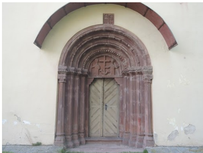
Obrázek 24 - Románský portál - kostel sv. Václava v Hrusicích.