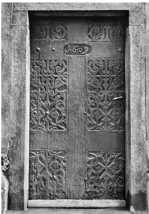
Obrázek 3: Dveře s nápisem „1609“ nyní sloužící jako vchod do sakristie.