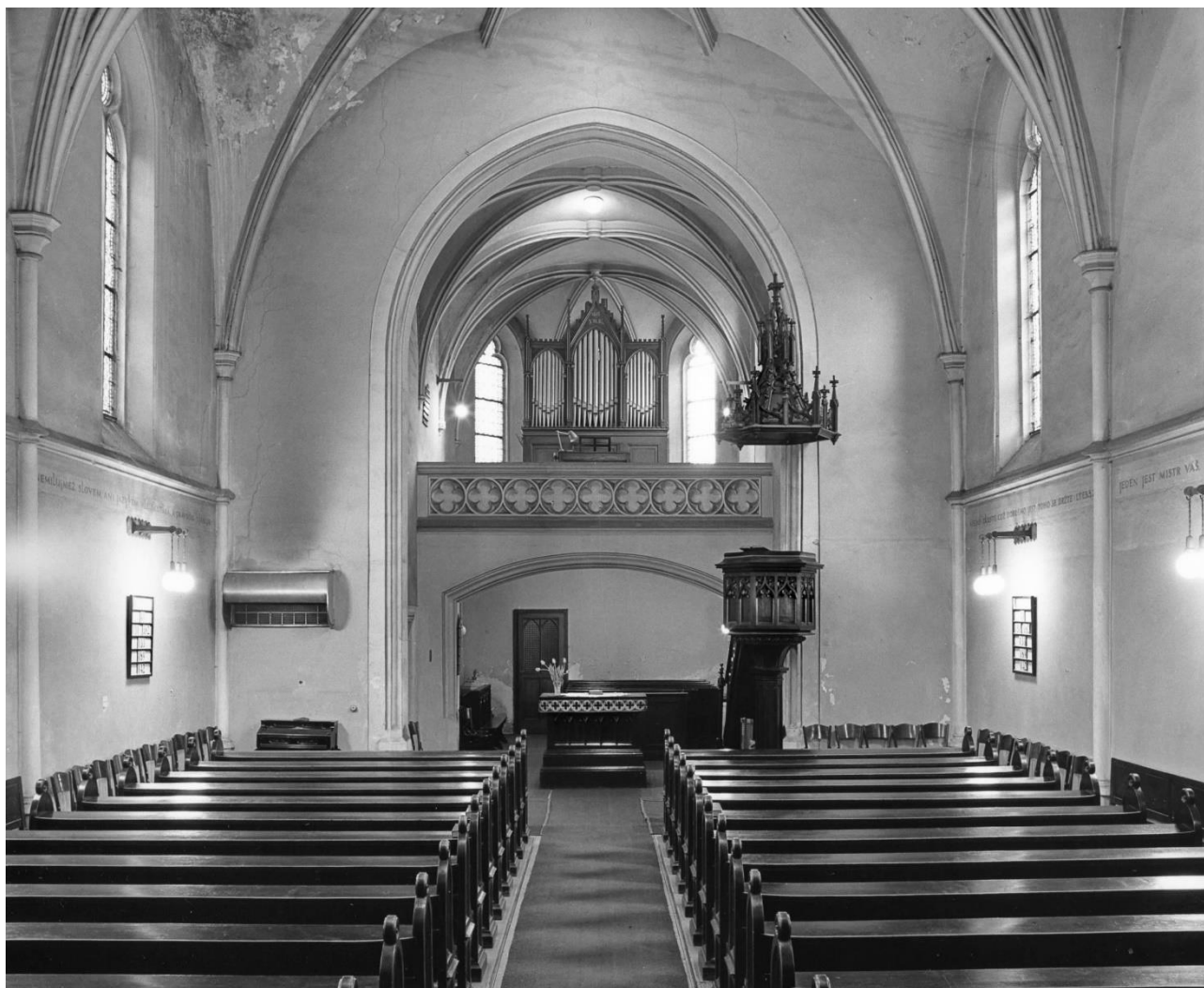
Obrázek 1: Interiér kostela sv. Klimenta na konci 19. století