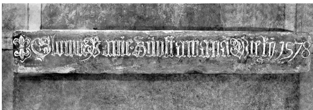
Obrázek 2: Nápis „Slovo páně zůstává na věky“, které se dnes nachází v presbytáři kostela.