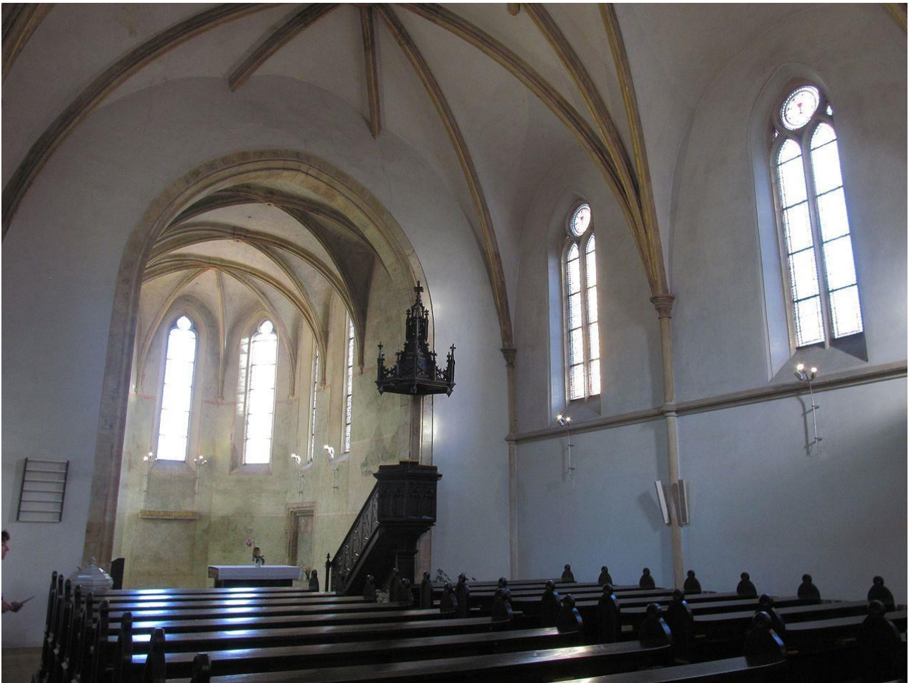
Obrázek 5: Kostel sv. Klimenta, interiér.