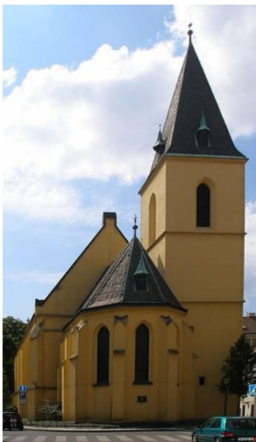
Obrázek 4: Kostel sv. Klimenta, exteriér.