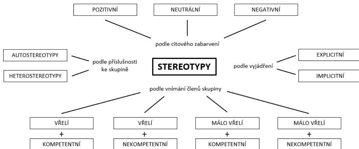
Obrázek 1: Schéma dělení stereotypů