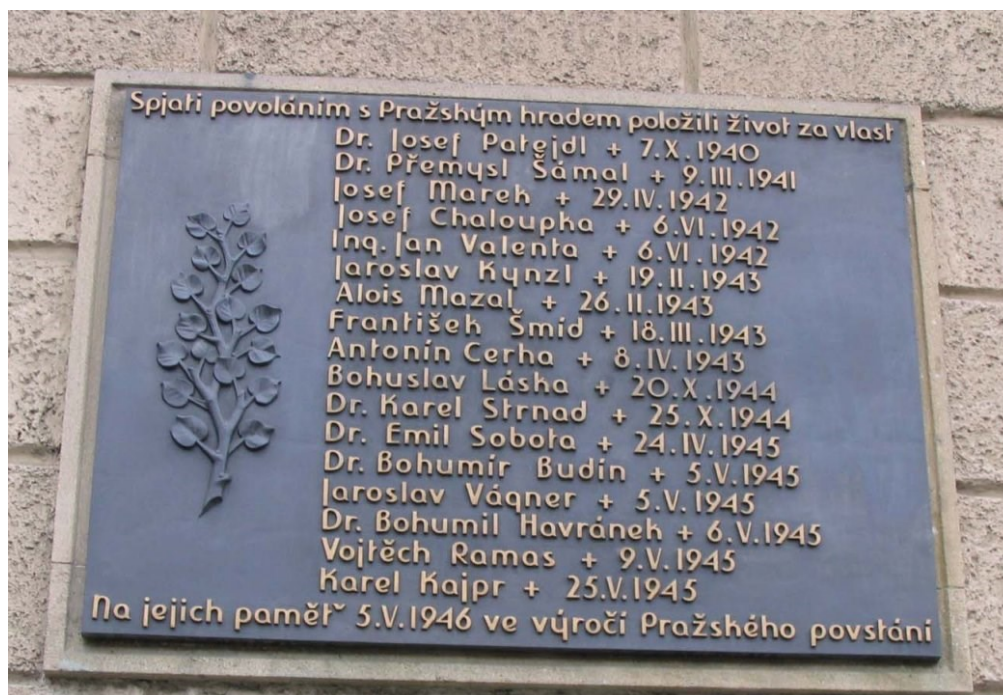
obr. 1 Pamětní deska na budově Starého proboštství