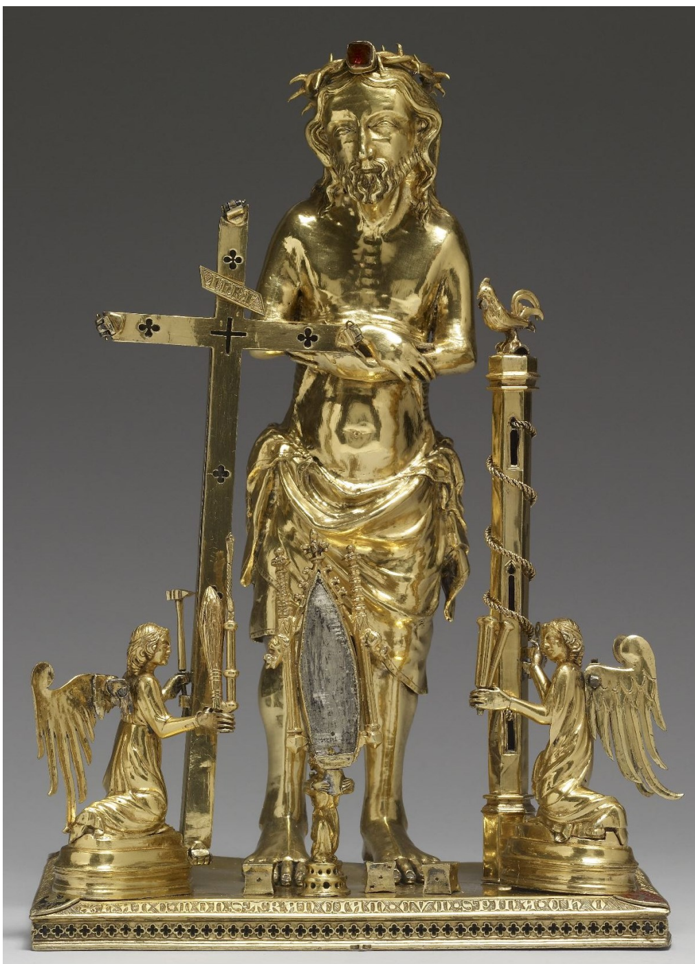
Relikviářová statueta Bolestného Krista. Walters Art Gallery. Baltimore.