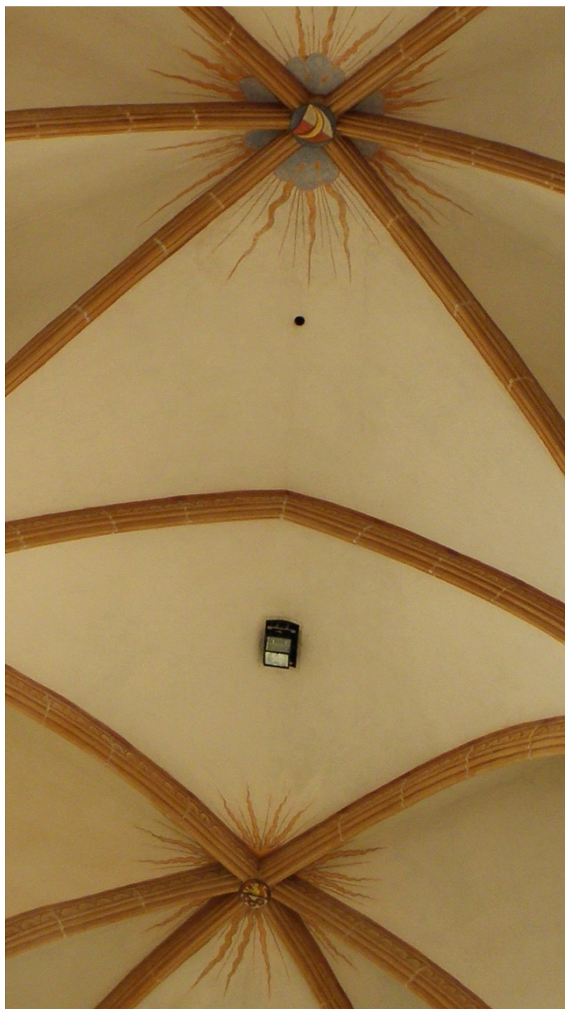
Kostel sv. Mořice v Kroměříži – klenba hlavní lodi. Detail. Dostupná z: https://olomouc.rozhlas.cz/primo-z-mista-kostel-sv-morice-v-kromerizi-6412875 (citováno 10. 4. 2024)