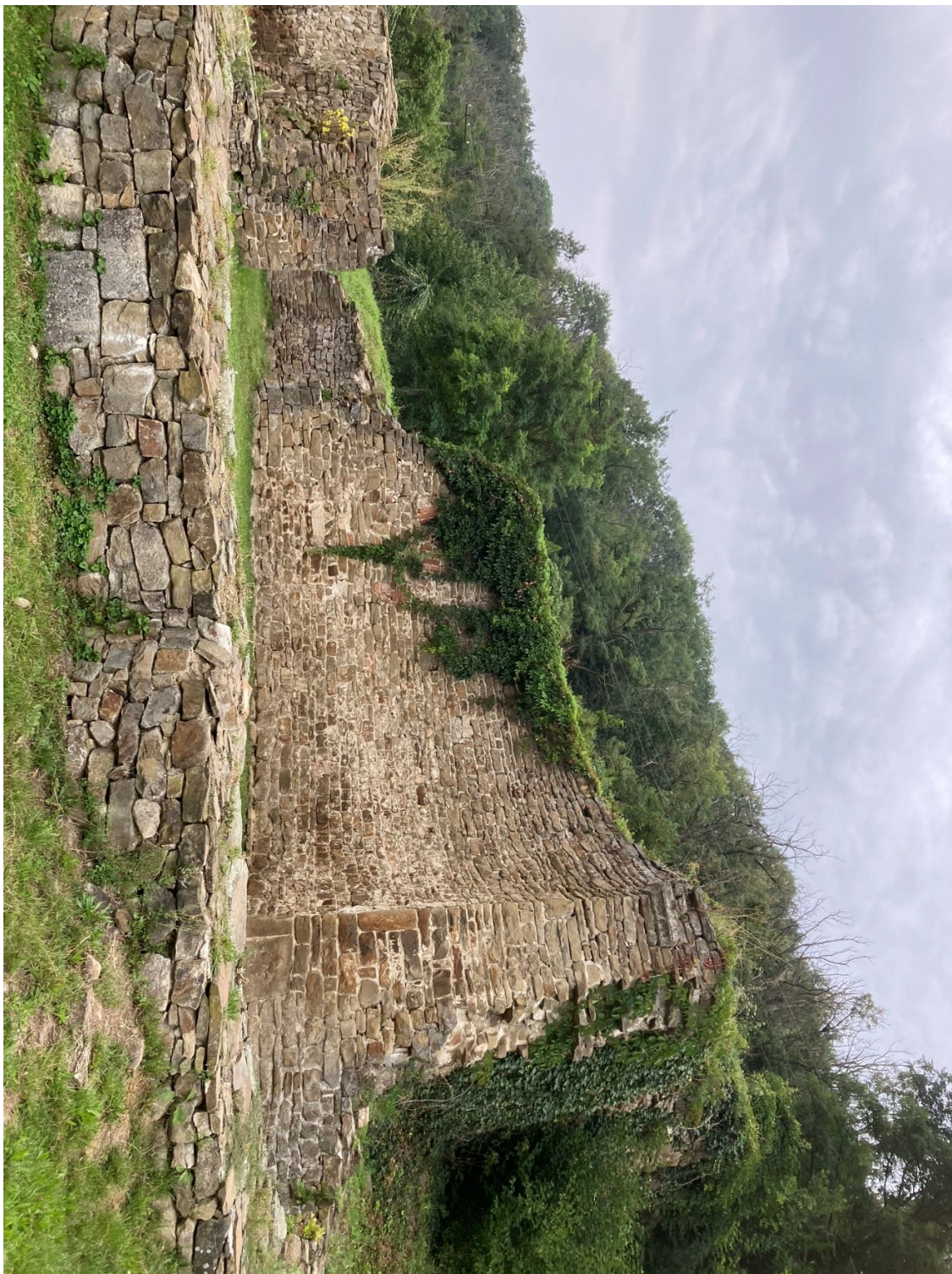
Zbytky rotundy sv. Pantaleona. Pustiměř.