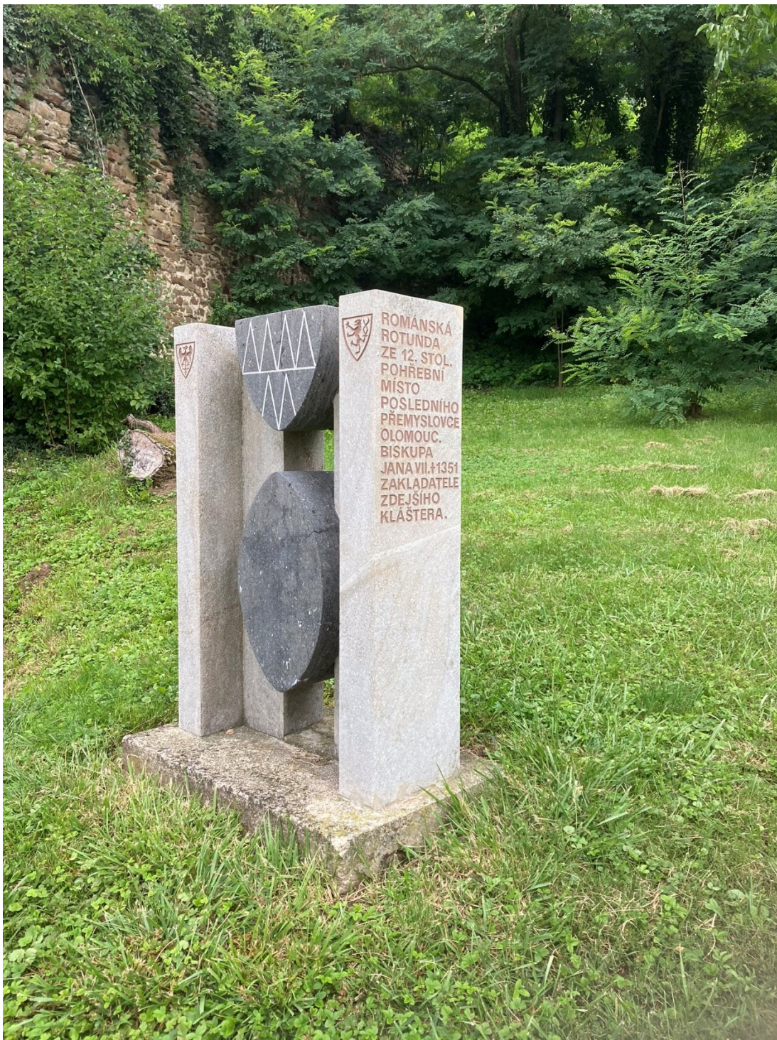
Památník Jana Volka. Pustiměř.