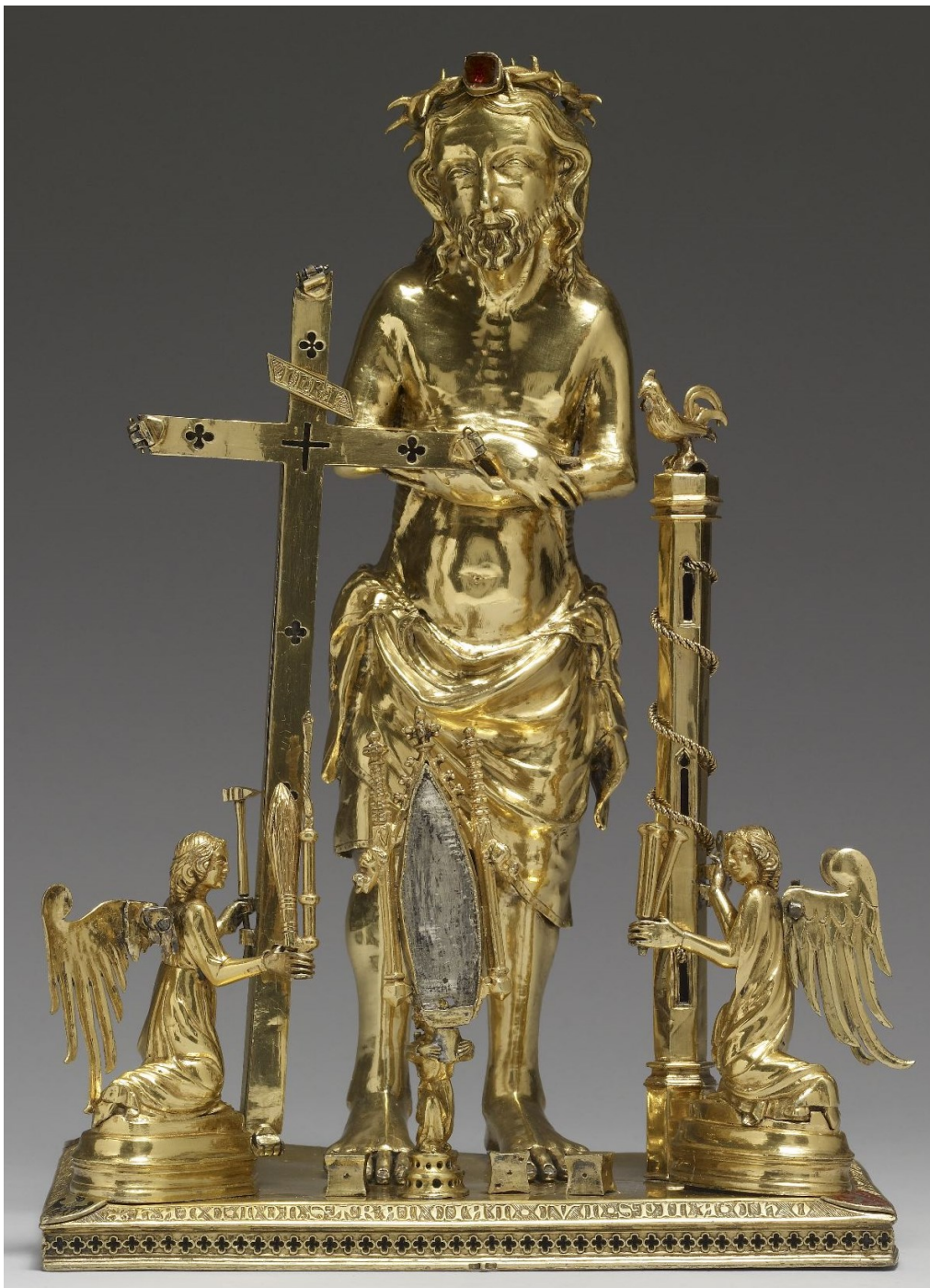
Relikviářová statueta Bolestného Krista. Walters Art Gallery. Baltimore. Fotografie dostupná z: https://art.thewalters.org/detail/29555/reliquary-with-the-man-of-sorrows/ (citováno 19. 4. 2024)