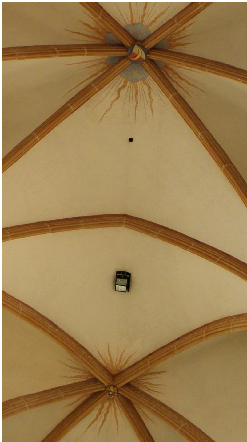
Kostel sv. Mořice v Kroměříži – klenba hlavní lodi. Detail.