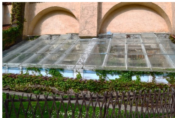
Příloha č.: ve Vojanových sadech se rovněž nachází skleník s exotickými rostlinami. Je ovšem trochu skromnějšího rázu.