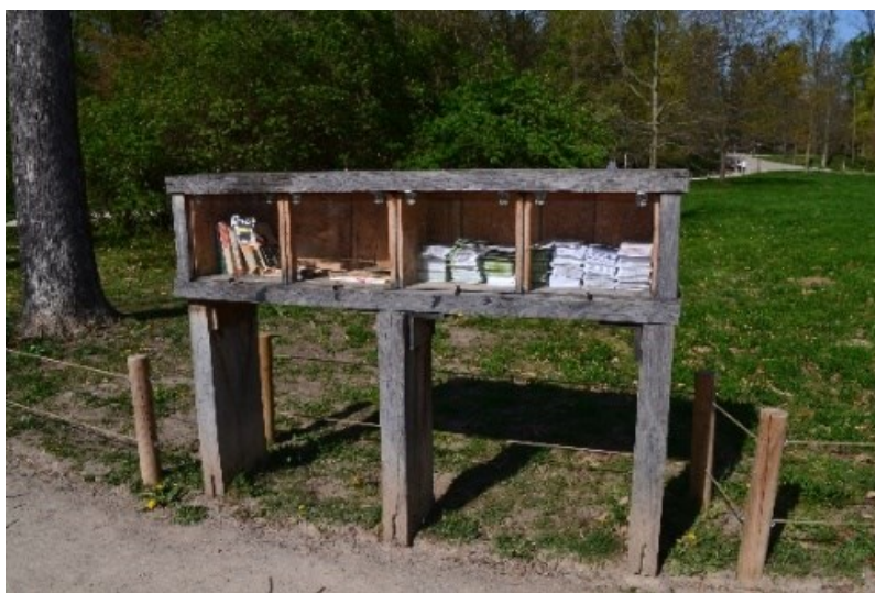
Obrázek č.22.: Čítárna ve Stromovce, k tomu byly vybudovány i designové dřevěné lavice. Toto je v přímé souvislosti se závazkem Strategického plánu spolupráce Městskou knihovnou Praha a má také na tomto základě v plánu podpořit občanskou participaci. 233 Tato designová knihovna spolu s lavičkami oba tyto požadavky splňuje.