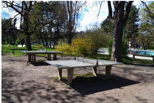
Obrázek č.25.: Pingpongové stoly pro návštěvníky.