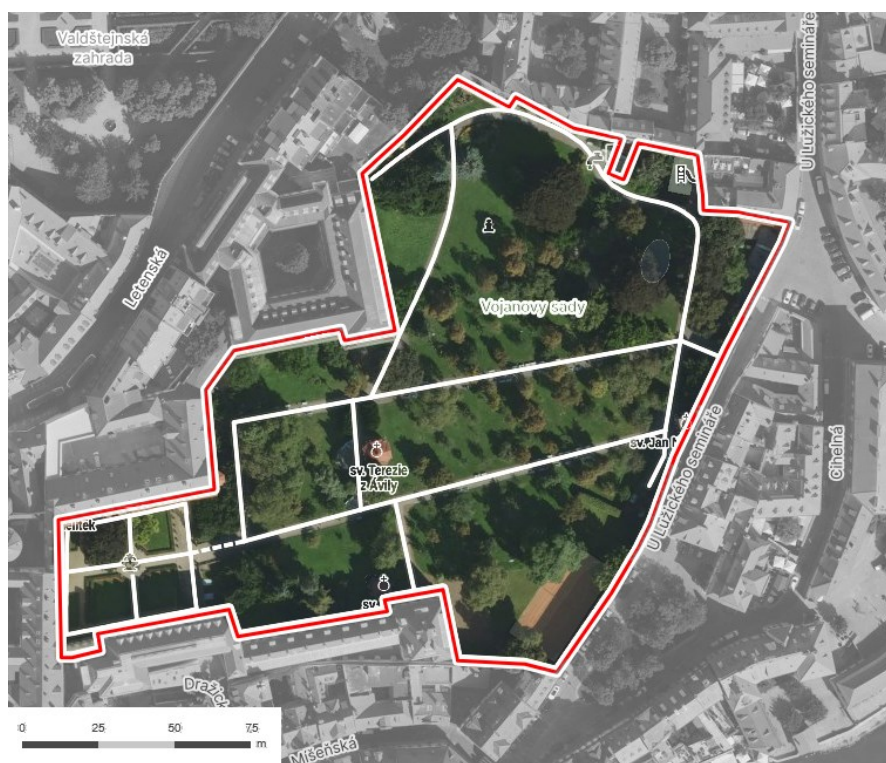
Obrázek č.5: Mapa Vojanových sadů

Vojanovy sady se nacházejí v Praze 1 a mají rozlohu 2,4 hektaru. Jsou v majetku Městské části Praha 1, konkrétně pod správou odboru životního prostředí Úřadu MČ Praha 1. Pro veřejnost jsou otevřeny každý den s proměnnou otevírací dobou v závislosti na ročním období. Vojanovy sady jsou také součástí památkové rezervace historického centra hlavního města Prahy. Vojanovy sady byly stylizovány do anglického parku, avšak charakter sadu je zde rovněž patrný, návštěvníci mohou tedy pozorovat vrstvení stylů vzhledem k požadované funkci zahrady. Jedním z hlavních lákadel těchto sadů jsou volně žijící pávi.