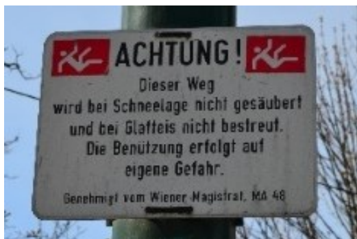
Obrázek č.33.: Pod upozorněním je uvedeno příslušné oddělení magistrátu, které má na starost správu parku, a to: Wiener Magistrat, MA 48.