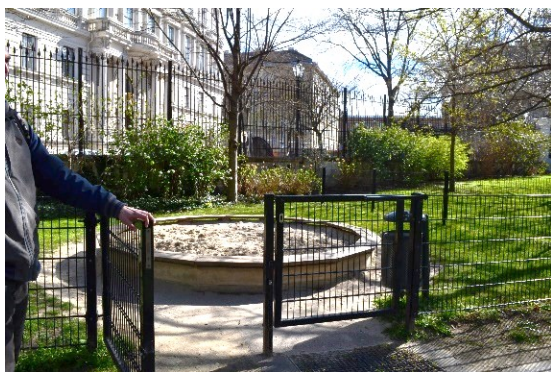
Příloha č.: Malé pískoviště v Burggarten. Mnohem minimalističtější než např. Prater.