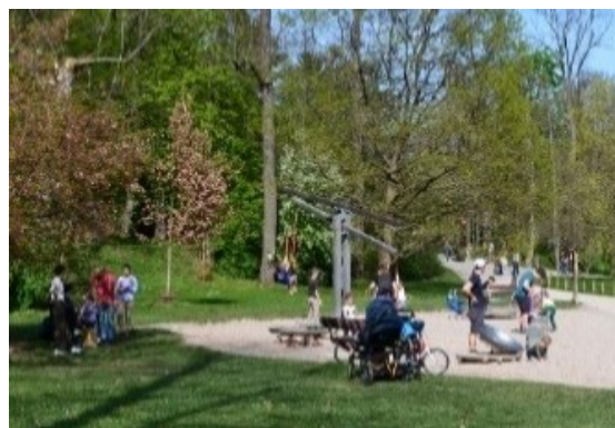
Obrázek č.28.: Dětské hřiště ve Stromovce.