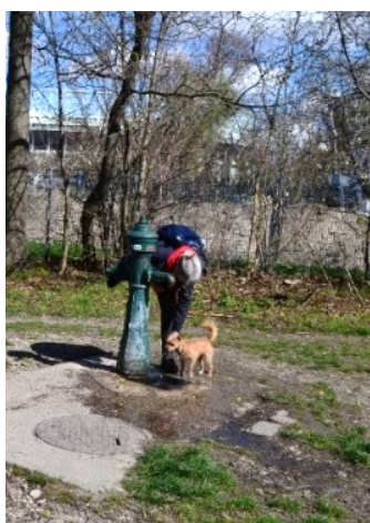
Obrázek č.37.: Pumpa na vodu funguje jako osvěžení pro psy.