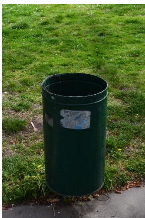
Obrázek č.6.: Koš z nového mobiliáře se do Vojanových sadů nedostal, ačkoli se zahrada nachází v historickém centru města. Místo toho se v zahradě nachází mobiliář zastaralý a prvky jsou nejednotné.