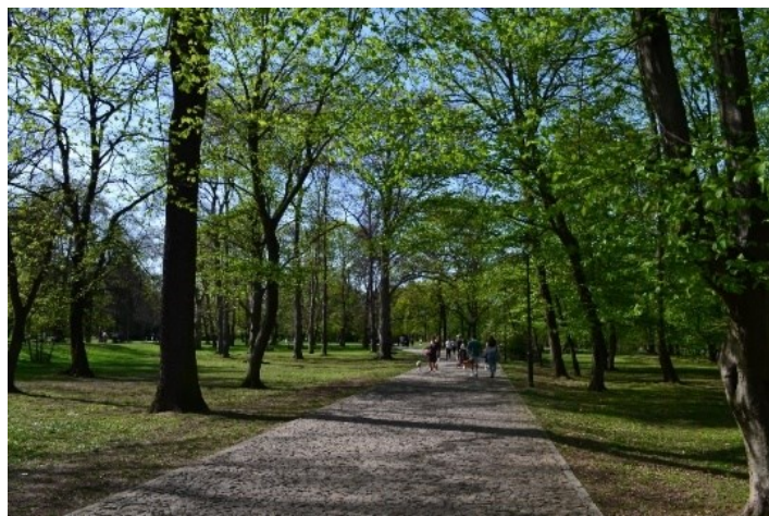
Obrázek č.20.: Nové dláždění cesty, Stromovka. Park je velmi dobře napojen na okolní infrastrukturu, jak se zavazoval Strategický plán v bodu 1.3.E1, „řešení systému parků ve vazbě na systém pěších cest.. propojování cestní sítě města a krajiny“ 232