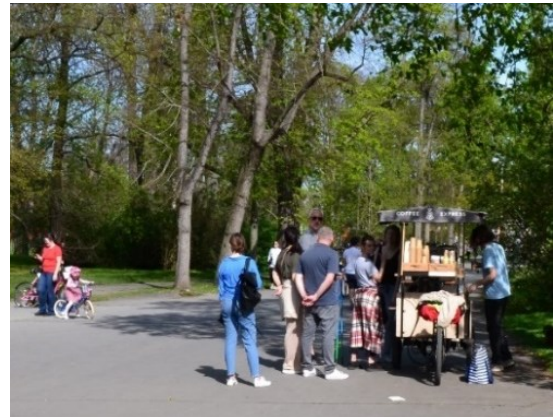
Obrázek č.26.: Stánek s občerstvením. V parku je povoleno umístění stánků ke komerčním účelům, nikoli však v celém parku.