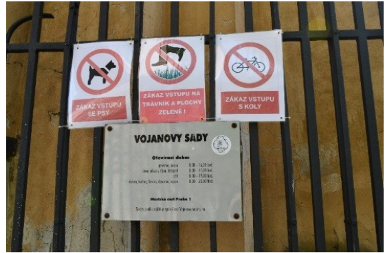
Příloha č. -- : Cedule, Vojanovy sady. Zde je cyklistům vstup zakázáný.