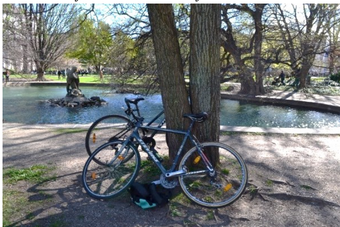
Obrázek č.12.: Pro kola je park otevřený. Odpovídá tak umožnění různorodého užívání prostoru ve shodě s bodem plánu: „Používat město férově a inteligentně“ 194

v současnosti různorodějším účelům a ovlivňují tak atmosféru městského soužití. 193