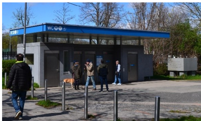
Obrázek č.17.: Veřejné toalety, Prater. Městská správa ve Vídni si zakládá na tom, že v parcích jsou veřejné toalety bezplatné.