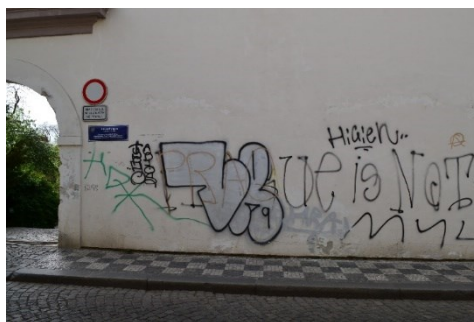
Obrázek č.8.: Zeď Vojanových sadů z ulice. Graffiti, ani jiné projevy vandalizmu a předcházení těmto městským fenoménům ve Strategickém plánu zmíněny nebyly.