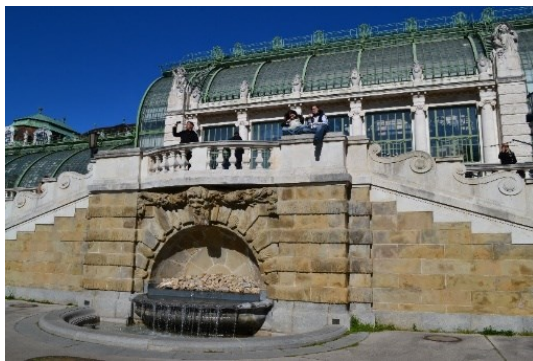
Příloha č. -- : Historický vodní prvek, kašna, je v provozu.