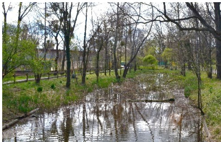
Obrázek č.15.: Lužina Prater Park. Fotografie připomínající původní ráz lužní krajiny. Souvisí se STEP 2025: „Freiraumnetz“ by měl ulevit Prateru od nadměrného užívání, čímž se zachovávají jeho rekreační a ekologické hodnoty.