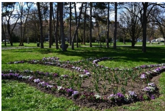
Obrázek č.35.: Záhon v Prater Parku, jarní výsadba, ornament. Působí skromným dojmem.