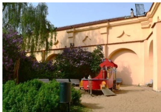
Příloha č. -- : Dětské hřiště ve Vojanových sadech. Zeď vysoká devět metrů tvoří klidné prostředí.