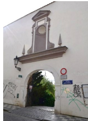
Příloha č. -- : Vchod do Vojanových sadů je na první pohled z ulice přehlédnutelný. Na zdi zvenčí graffiti.