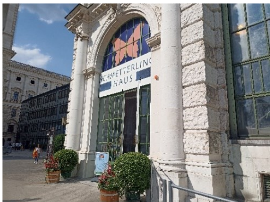
Příloha č. -- : Motýlí dům ( Schmetterling Haus ) jako součást Burggarten. Zahrady spravované „ Österreichische Bundesgärten “ mají často speciální domy, kde jsou pěstovány různé exotické druhy rostlin či živočichů. (Další je například Skleněný dům v Schönbrunnské zahradě.)