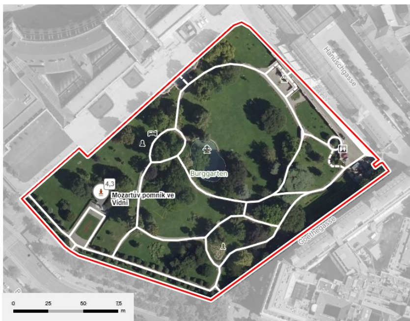
Obrázek č.10.: Mapa Burggarten

Zahrada se nachází ve vnitřním městě, na okraji hustě zastavěného centra Vídně, tedy uvnitř někdejších hradeb. Je v bezprostřední blízkosti Hofburgu, což parku dodává zřetelný historický a kulturní význam. Park má otevřeno každý den, otvírací doba však závisí na ročním období.