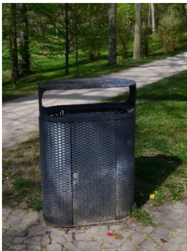
Obrázek č.19.: Koš z nového pražského mobiliáře, Stromovka. Podle závazku Strategického plánu hl. m. Prahy, bodu 1.3.C2 se město zavazovalo inovovat pražský mobiliář. 230 Tomuto tvrzení plán opravdu dostál a odrazilo se to i ve vzhledu parkových prostor. Nový design laviček, stojanů a košů byl v parku Stromovka implementován jako první. 231