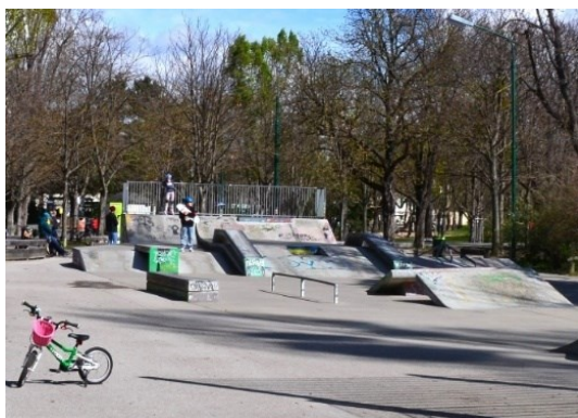
Obrázek č.27.: Skatepark využívaný hlavně dětmi.