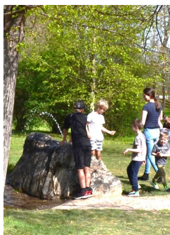
Obrázek č.38.: Pítko ve stromovce, které je využíváno hlavně dětmi.