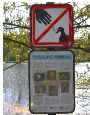
Obrázek č.34.: Na zápatí tabulky je uveden správce parku, tedy Magistrát hl. m. Praha a Lesy hl. m. Prahy, ale také „Obnova a revitalizace pražských nádrží“, což je projekt hl. m. Praha, který byl spuštěn po povodních 2002. Podílel se na revitalizaci soustavy vodních ploch na dně bývalého Rudolfova rybníka.