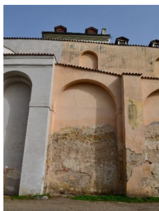
Obrázek č.9.: Zeď Vojanových sadů z vnitřní strany. K revitalizaci došlo po povodni 2002, ale stále jsou zde známky poškození. Strategický plán stanovuje principy regenerace s ohledem na památkářské postupy 187 , lze se tedy domnívat, že ponechání tohoto stavu bylo památkářským zájmem.