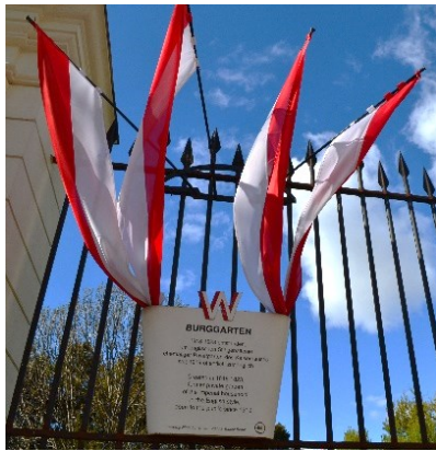
Příloha č. : Vstup do Burggarten označený vlajkami v barvách města. Všechny cedule a vchody jsou dobře označeny, aby bylo každému na první pohled jasné, že se jedná o historicky významnou zahradu.