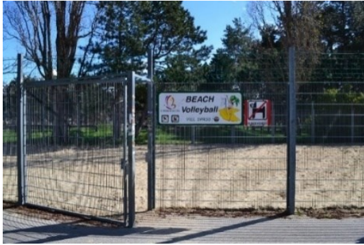
Obrázek č.23.: Volně přístupné hřiště na beachvolejbal.