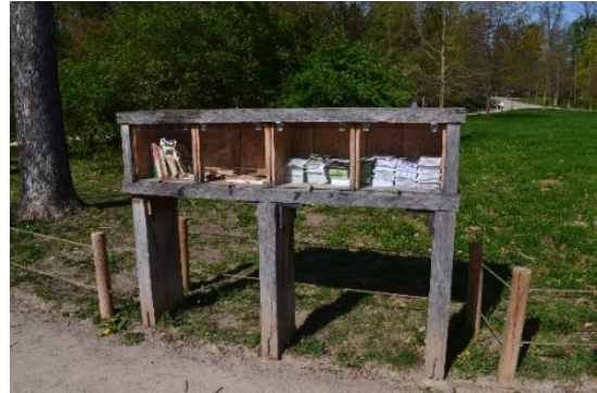
Obrázek č.24.: Čítárna ve Stromovce, k tomu byly vybudovány i designové dřevěné lavice.