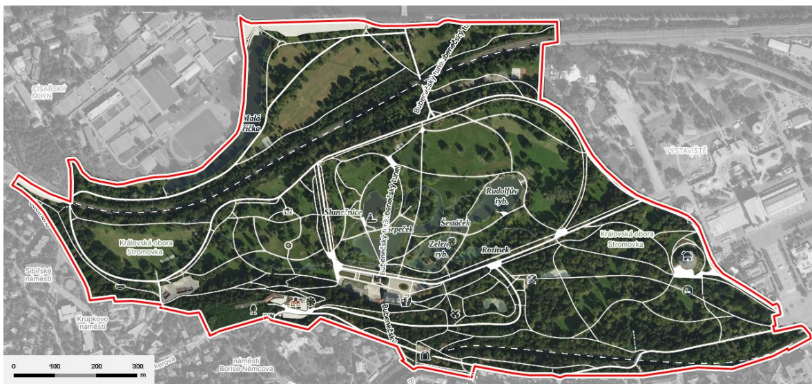
Obrázek č.18.: Park Stromovka

Královská obora Stromovka nedaleko historického centra Prahy má rozlohu zhruba 95 hektarů. 208 Majitelem obory je hlavní město Praha, konkrétně Odbor ochrany prostředí Magistrátu hl. m. Praha a Lesy hl. m. Praha, oddělení péče o zeleň. Správu obory zajišťuje Lesy hl. m. Prahy. Co se týče návštěvnického systému, obora je přístupná bez omezení a to celoročně. Královská obora Stromovka je také chráněna jako kulturní památka s ochranným pásmem památkové rezervace hl. m. Praha. 209 V Královské oboře Stromovka se křižují hlavní cyklostezky, které vedou podél hlavních asfaltových cest s limitovanou rychlostí na 20 km/h. 210 Dle členění územního plánu IPR jde o „metropolitní park“, přičemž dosahuje nejvyššího významu v rámci této hierarchizace. To bezesporu odpovídá jeho roli v rámci města.