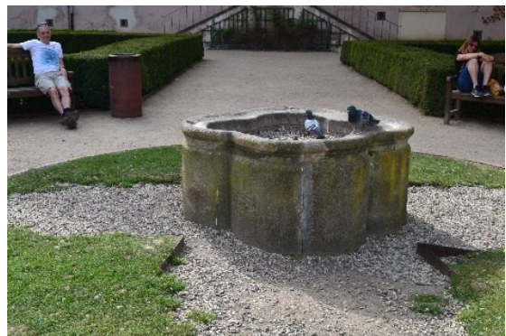
Příloha č. : Historický vodní prvek, malá fontánka, není v provozu.