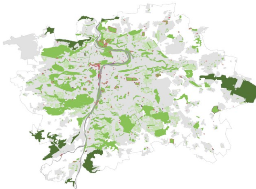
Obrázek č.4. : Veřejná přístupnost parků v Praze. Červeně označené parky jsou přístupné v omezeném režimu. 139

Praha je hlavním městem České republiky s rozlohou 496 km 2 ve 22 správních obvodech. 137 Krajinný ráz Prahy je výjimečný centrální část města leží v tzv. Pražské kotlině, která se vyznačuje velkou výškovou členitostí. 138 Ta umožňuje výhledy na město a je typická panoramatickými výhledy na městské architektonické památky. Řeka se při povodních často rozvodňovala, dnes jsou zaplavované části chráněny protipovodňovými opatřeními.