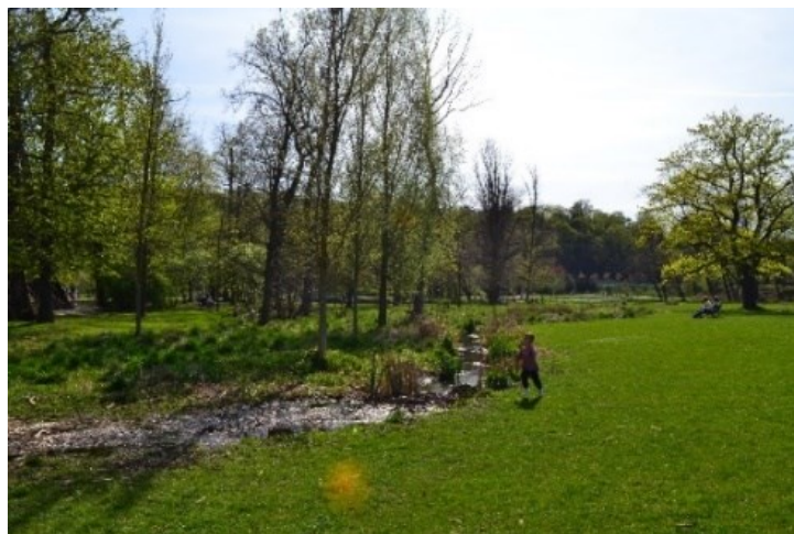
Obrázek č.21.: Fotografie dno bývalého Rudolfova rybníka. Souvisí s Strategickým plánem hl. m. Praha, konkrétně borku 1.4.A7, který se týká devitalizace vodních ploch. Na této obnově se ve Stromovce se podílel projekt hl.m. Praha „Obnova a revitalizace pražských nádrží“, který byl spuštěn po povodních 2002.