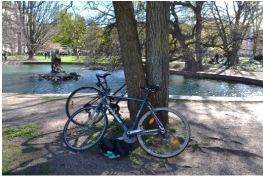
Příloha č. -- : Pro kola je park otevřený.