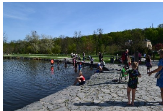
Obrázek č.30.: Rybník je povoleno užívat k osvěžení za horkých dní. Toho využívají především děti. Současně vodní plochy plní dekorální a ekologickou funkci.