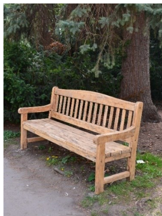
Obrázek č.7.: Tato lavička z pražského mobiliáře není, je specificky pouze v této zahradě. I ostatní lavičky v zahradě se liší a ačkoli odkazují na nejednotnost vybavení, svým způsobem umocňují jedinečnost této zahrady.