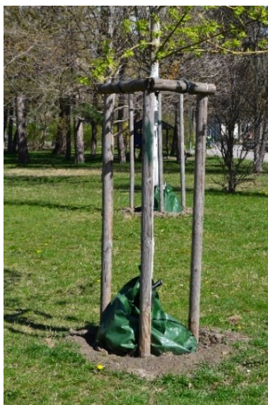
Obrázek č.16.: Výsadba stromů Prater. Nová výsadba se obecně shoduje se STEP 2025, která uvádí kroky pro přizpůsobení se změně klimatu, mezi nimi je výsadba stromů, alejí.