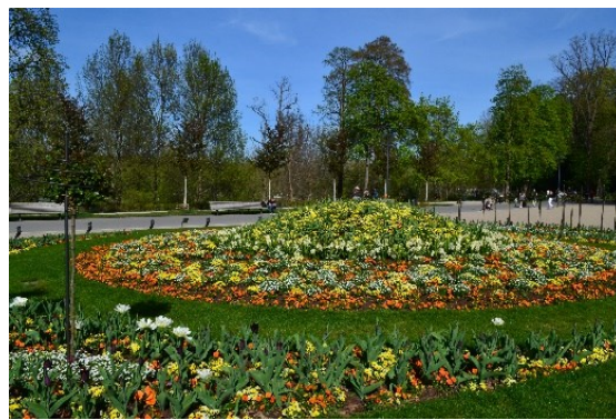
Obrázek č.36.: Stálý okrasný záhon. Působí velkolepým dojmem.