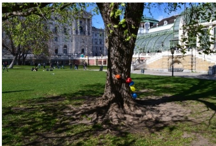
Obrázek č.11.: Burggarten je charakterem historická zahrada, nicméně je také známým bodem k setkávání a dokonce i soukromým oslavám. Odpovídá tak STEP 2025 v tom, že funkce městských zelených ploch čelí