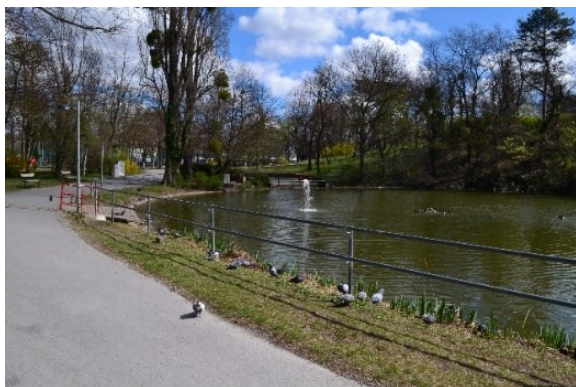
Obrázek č.29.: Vodní plocha v Prateru není určena k přístupu návštěvníků, nýbrž zde plní dekorální a ekologickou funkci.