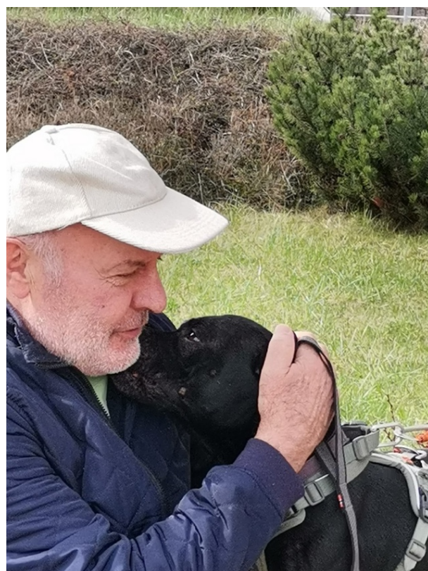
Obrázek č. 13