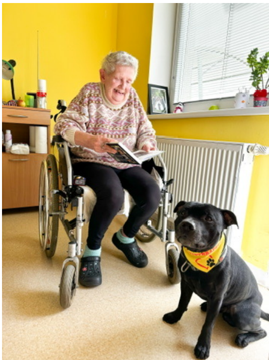
Obrázek č. 7