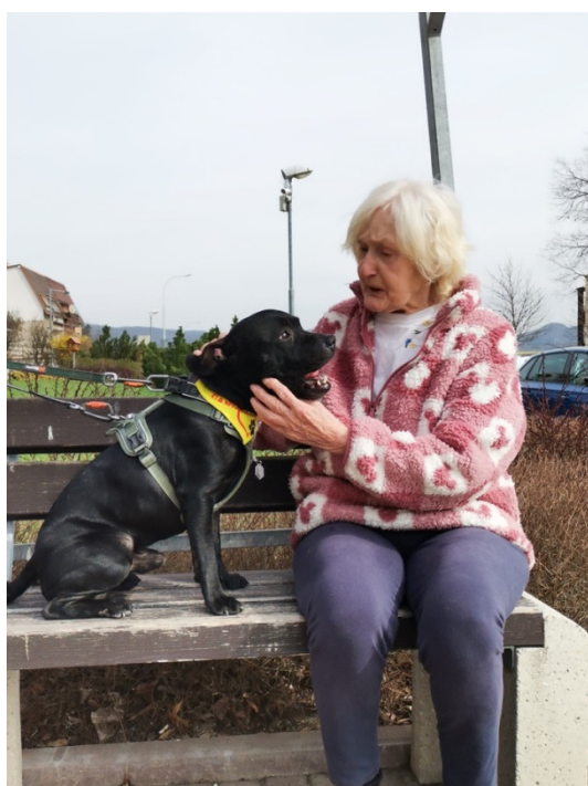
Obrázek č. 11