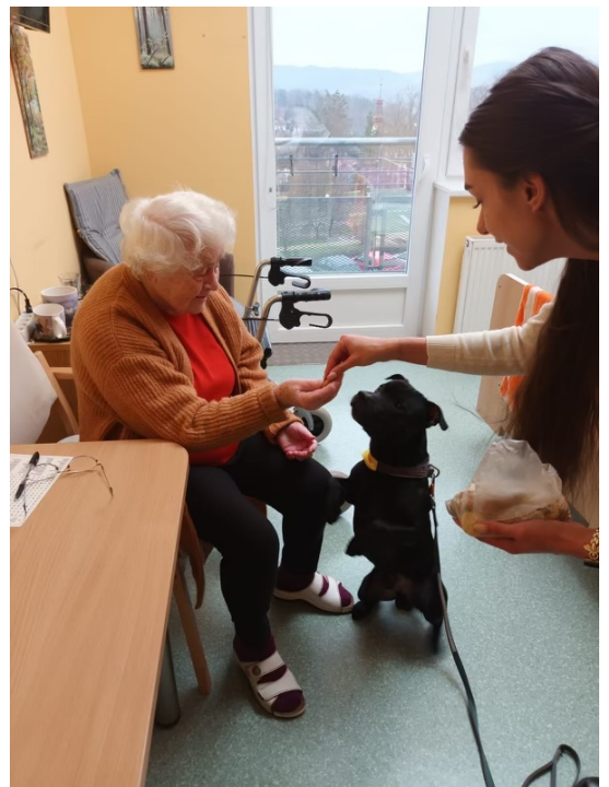
Obrázek č. 5