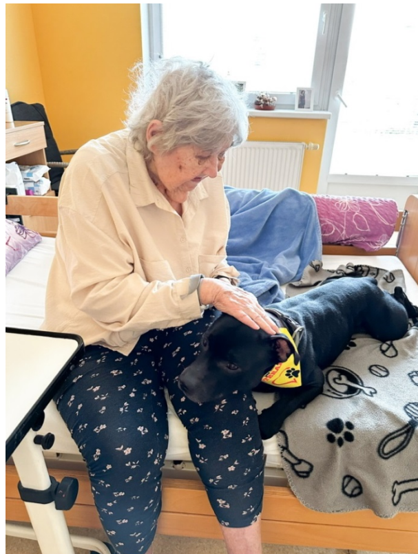
Obrázek č. 12