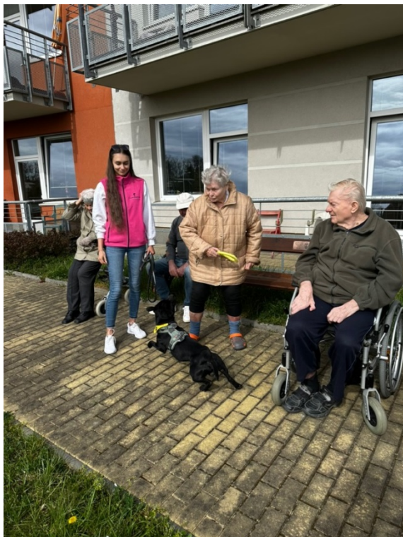
Obrázek č. 10