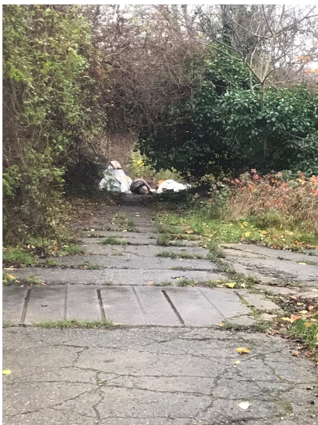
Obr.č.6 Albinův příbytek 1