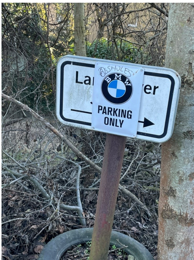
Obr.č.3. značka vymezuující parkovací místo II (foto Matěj Petržilka)