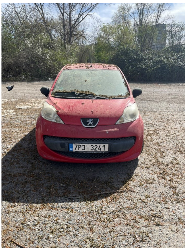
Obr.č.12 Ponechané auto na Parkovišti 1