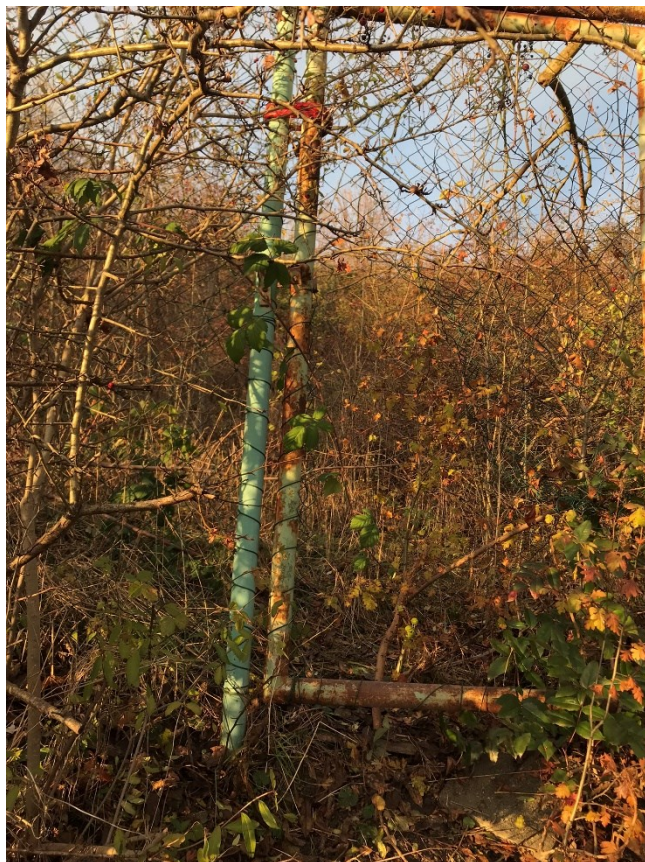
Obr. č. 1: Zvágněná branka 1