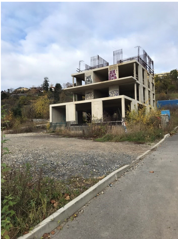
Obr.č.16 Nedostavěné domy 1