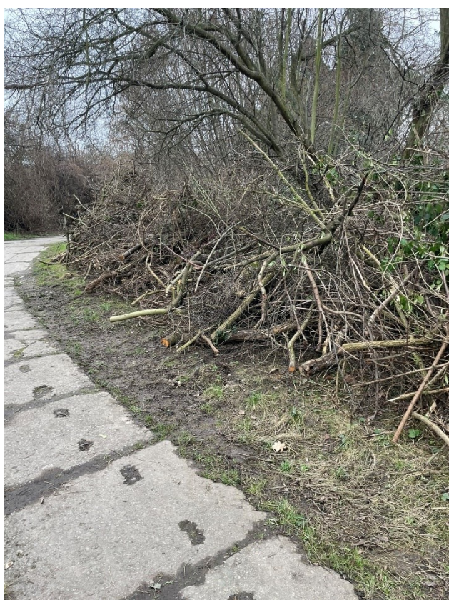
Obr.č.14 Vyklizení Džungle 2