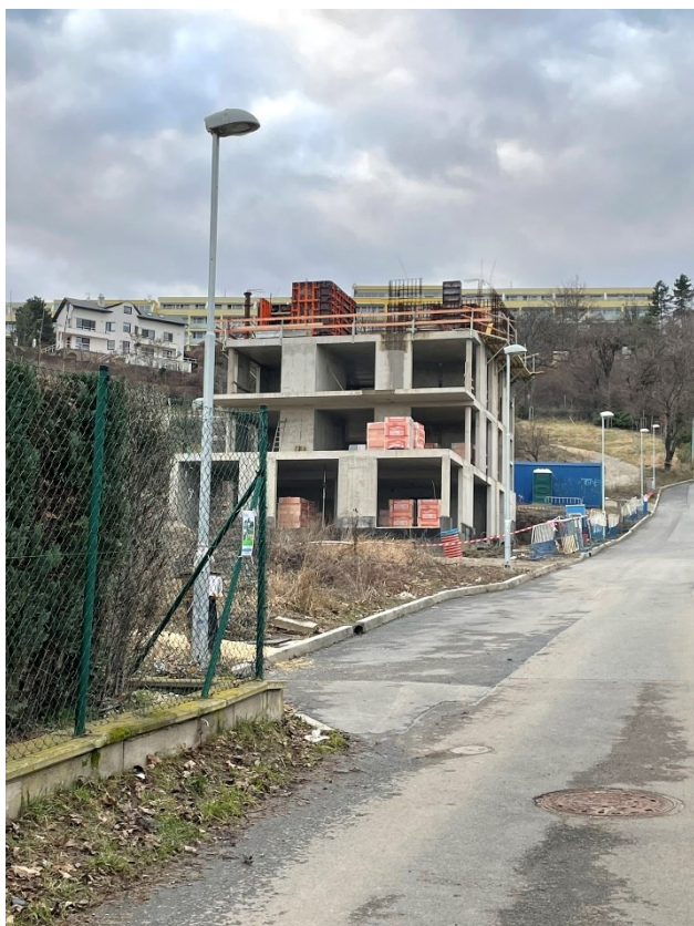
Obr.č.17 Nedostavěné domy 2