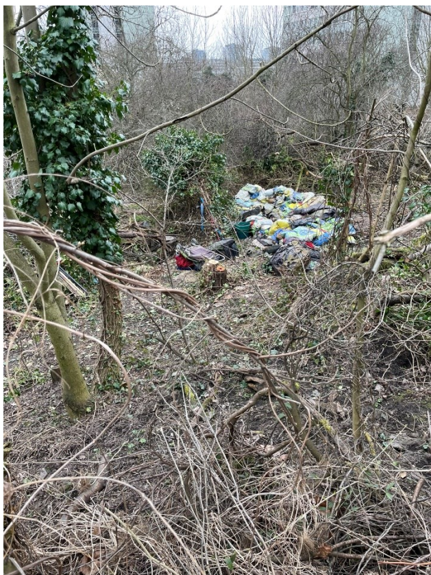
Obr.č.13 Vyklizení Džungle 1