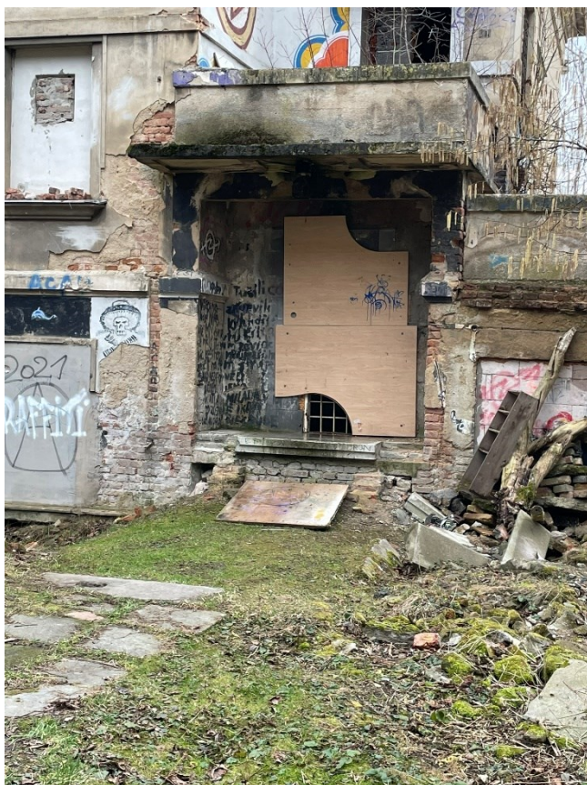
Obr.č.7. Bednění Milady 1