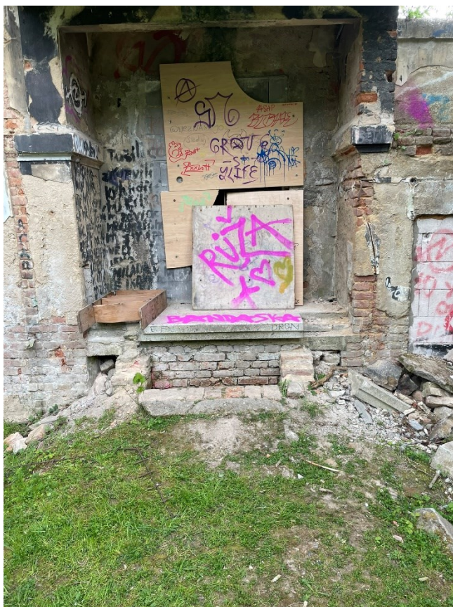
Obr.č.9 Bedněni Milady 3