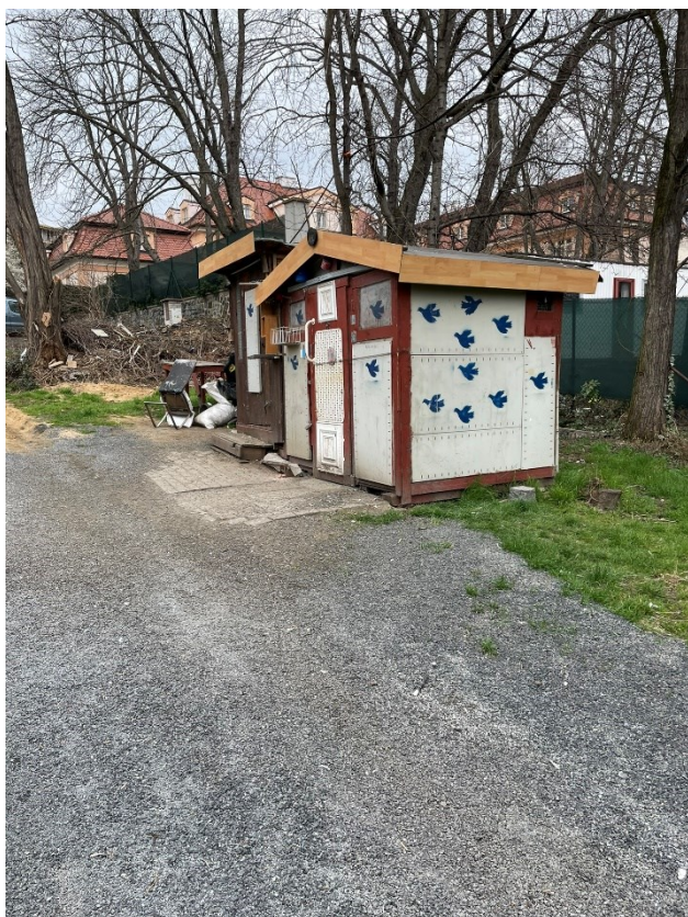
Obr.č.11 Úpravy Holubníku 2