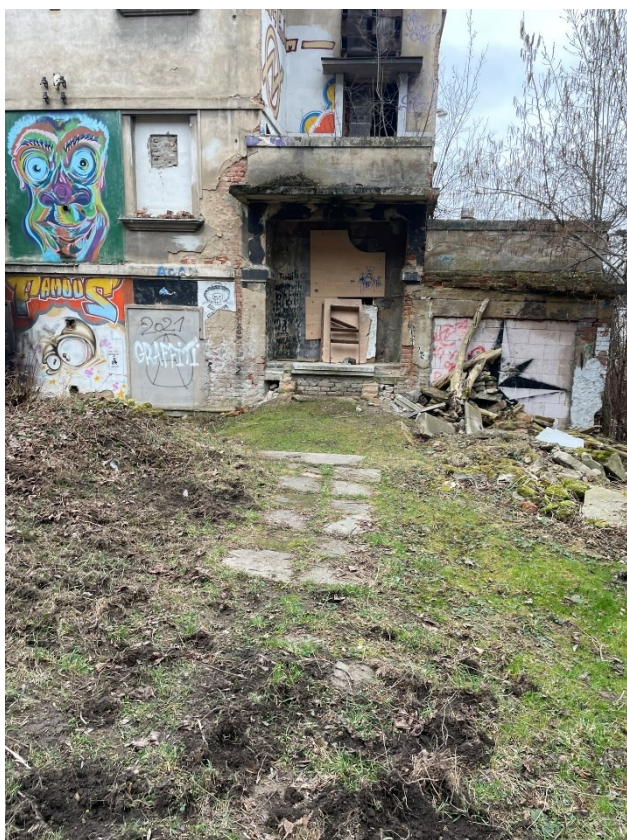
Obr.č.8 Bednění Milady 2