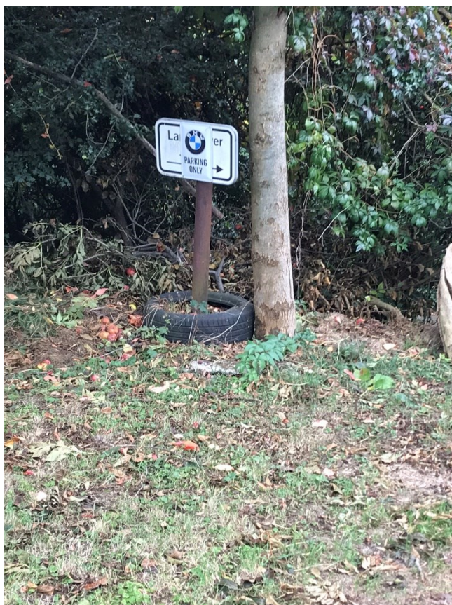
Obr.č.2 značka vymezuující parkovací místo I