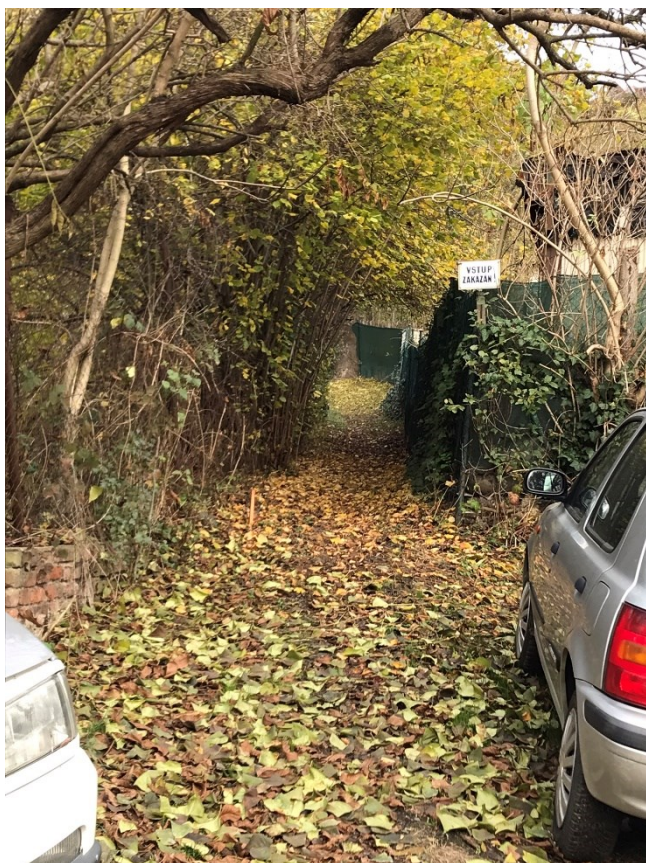
Obr.č.4 Cesta do Neznámé kolonie 1