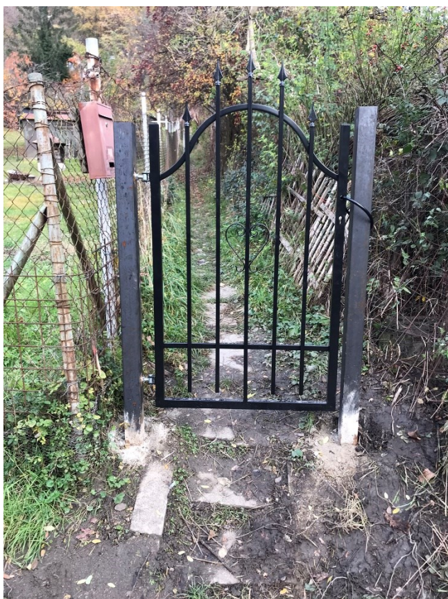
Obr.č.5 Cesta do Neznámé kolonie 2