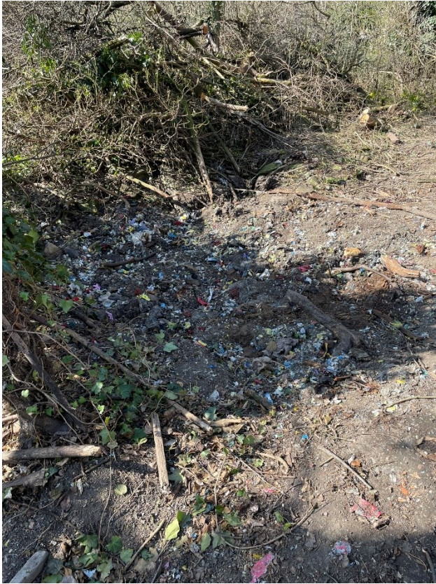
Obr.č.15 Vyklizení Džungle 3