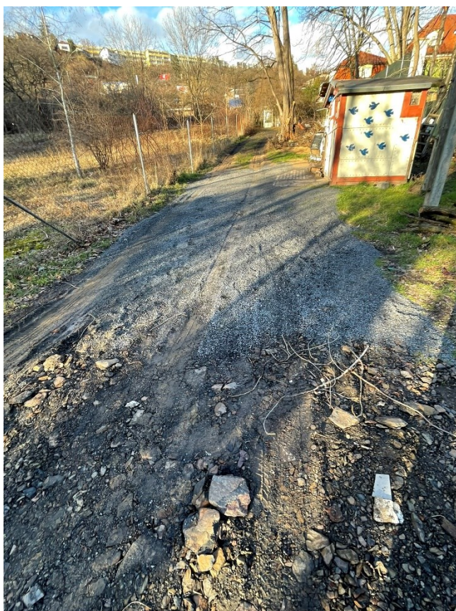
Obr.č.10 Úpravy Holubníku 1