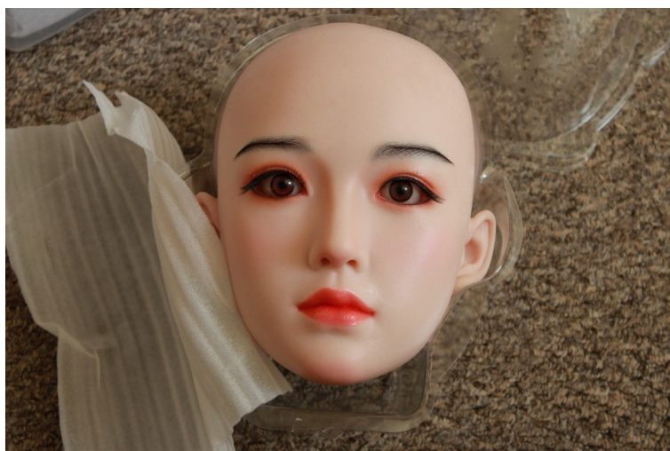
Obrázek 3 - Obrázek ilustruje jak může příchod umělé společnosti vypadat. Použito s povolením autora.

R: „Wow, that's a gorgeous lady you've got there!”