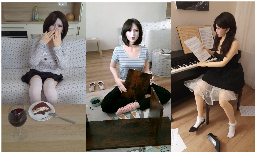
Obrázek 4 - Série fotografií znázorňující umělou společnici jednoho z mých respondentů v různých situacích. Fotografie jsou použity s povolením autora.

Fotografie umělých společnic, které jsou často zobrazovány v sexuálně provokativních pozicích s minimálním oblečením, přispívají k vizuální reprezentaci těchto ideálů a podporují již zmíněné narativy sexuální dostupnosti a atraktivity. Současně ne každý příspěvek nutně nese sexuální podtón a uživatelé sdílejí fotografie svých společnic nejen v sexualizovaných polohách, ale i například jak si čtou nebo pracují jako servírky. Právě fotografie slouží svým uživatelům jako médium, skrze které svou umělou společnicí “oživují” (“ photos kind of bring her to life ”) - statickostí, kterou umělé společnice vykazují v běžném životě se v rámci fotografií vytrácí a normalizuje, jelikož i živá bytost se na fotografii nehýbe. Pomocí série naaranžovaných fotek uživatelé vytváří zdání pohybu, kdy upravují svou společnicí, tak aby výsledné fotky vytvářely iluzi různých činností. Například jak hraje na piano, staví poličku nebo se i směje a užívá si zákusek a sklenku vína (viz obrázek 4).