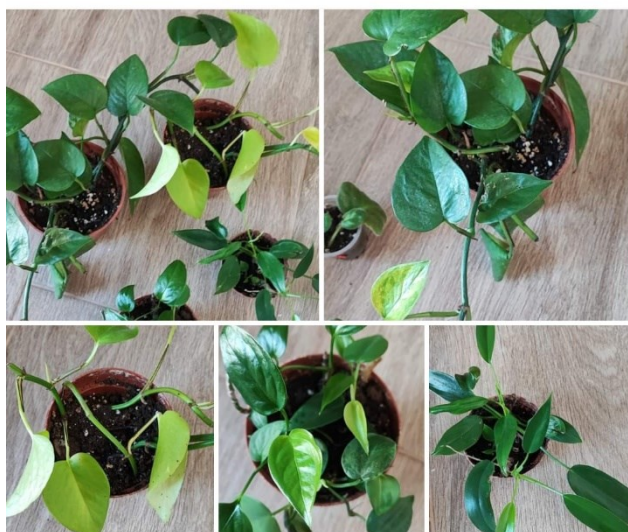
14. Příspěvek ve skupině Pokojovky. Rady. Tipy. Prodej. Výměna.

Prodám filodendrony a scindapsusy. Cena za rostlinu je 100 korun. Osobní předání v centru Brna nebo Zásilkovnou.