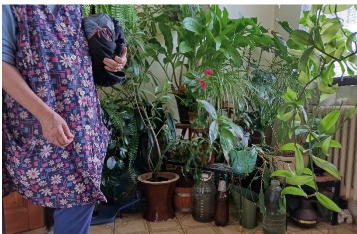
4. Pokojové rostliny mojí babičky, které znám již ze svého dětství, některé z nich jsou v rodině již po generace.

S pokojovými rostlinami jsem se setkávala celý život doma, některými členy rodiny na ně byl kladen velký důraz, ale nikdy mě osobně dlouhou dobu nijak konkrétně nezaujímaly. Byly běžnou, neproblematizovanou součástí mého života. Zнала jsem koncept pokojových rostlin, ale nebyly pro mě odlišné od těch, které se pěstovaly na zahradě a nepředstavovaly pro mě ukazatel životního stylu. Zrovna tak jsem je nebrala jako něco, co by se dalo zakoupit nebo sdílet (fyzicky