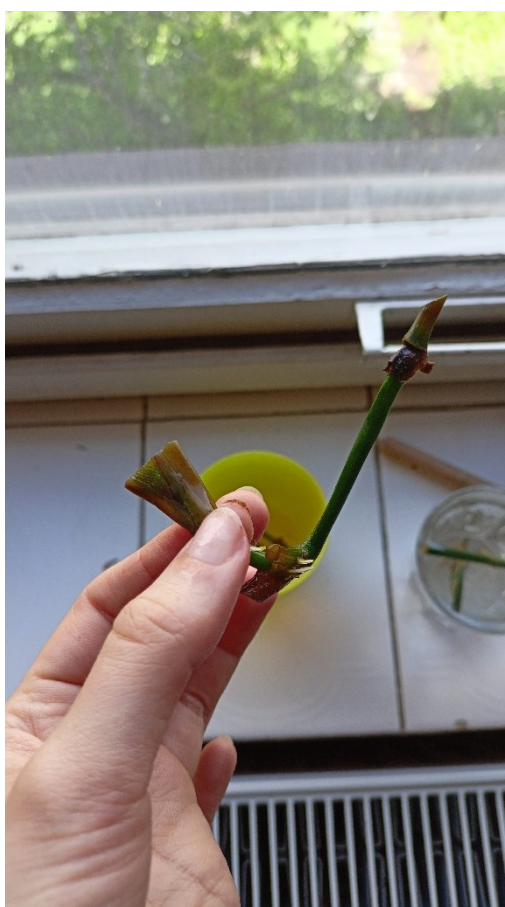
1. Množení pokojových rostlin na okenním parapetu.

Řízkování rostlin má oproti jejich pohlavnímu množení (prostřednictvím semen) několik výhod. Mezi ně patří nenáročnost, větší dostupnost a jistota, že se nebude od mateřské rostliny lišit (jak se může