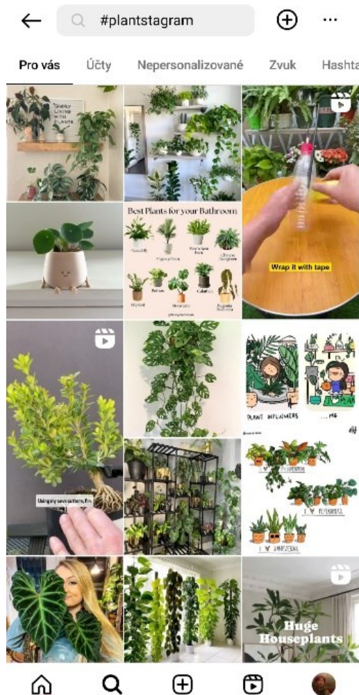
10. Výsledky vyhledání #plantstagram na Instagramu.

Akteři zmiňovali konkrétní instagramové účty, které sledují jen zřídka. Důvodem bude pravděpodobně fakt, že uživatelé často sledují až několik stovek instagramových účtů a v poslední době navíc Instagram na domovské stránce zobrazuje méně a méně příspěvků od sledovaných účtů ve prospěch obsahu, který sám vyhodnocuje jako nejvíce přitažlivý pro uživatele v danou chvíli. Tomu se tak může zobrazovat velké množství příspěvků na náhodné, téma, které pro něj algoritmus posoudil jako nejpřitažlivější v danou chvíli, bez toho, aby sledoval jakýkoliv účet zabývající se tímto tématem a v neprospěch účtů, které skutečně sleduje. Přesto byly zmíněny dva účty, a to plantswithkrystal (634. tis. sledujících), helloplantlover (728 tis. sledujících). 39