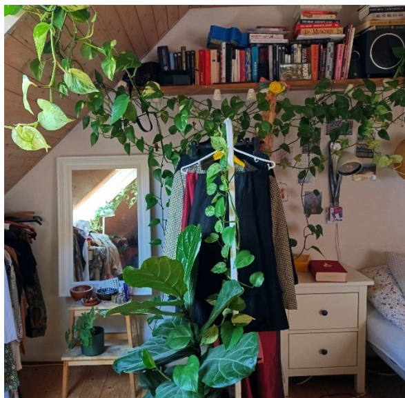
9. Pokojové rostliny jsou součástí také mého domova.

Na závěr této části práce bych ráda uvedla, že ačkoliv jsem sama členkou komunity pěstitelů pokojových rostlin, v závěrech své práce vycházím primárně z výpovědí aktérů, zúčastněného pozorování a analýzy digitálního prostoru. Mé osobní zkušenosti, které jsem popsala výše, jsem využila pouze pro vstup do výzkumného prostoru a orientaci v něm. Závěry této práce z nich nevycházejí.