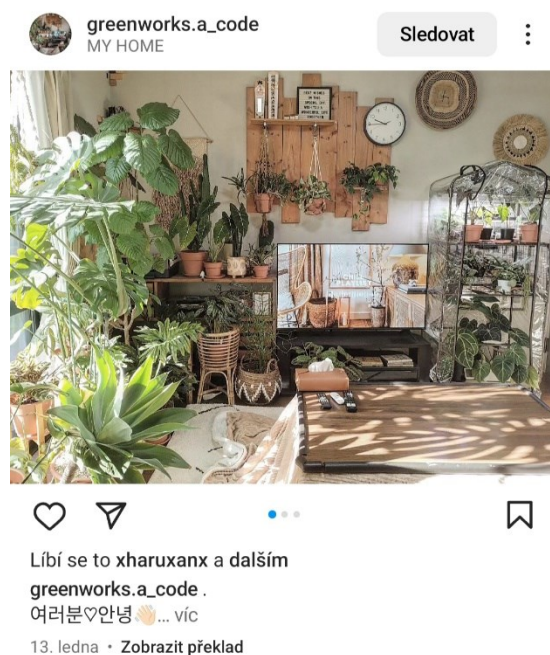
3. Příklad reprezentace pokojových rostlin na sociálních médiích.

Rozdíl mezi sociálními médii a offline prostorem je čím dál více nejasný. V dnešní době je tedy čím dál těžší se provádění výzkumu online vyhnout, jelikož virtuální prostor je součástí každodenního života aktérů, kteří příliš nerozlišují mezi ním a offline prostorem. Je součástí jejich identity a sociální interakce. Sociální média se dají vnímat předmět (object), který je utvářen tím, co se v jeho rámci odehrává, jak ho jeho uživatelé využívají. Nebo se dá vnímat jako prostor (space), ve kterém se děj odehrává. Online etnografie je důsledkem toho, že v některých případech nelze provádět výzkum pouze na jednom místě, ale je třeba sledovat aktéry tam, kam míří oni. Online prostor také rozšiřuje možnosti etnografa. Je možné pomocí něj provádět výzkum klasickými metodami, jako jsou dotazníky či rozhovory, jeho struktura nám ovšem poskytuje mnoho dalších možností. Zpřístupňuje nám data jako jsou počty liků, shlédnutí či hashtagů, informace o aktérech, interakcím a mnoho dalších. Důležité ovšem není pouze jak často je hashtag používán, ale také kým a za jakým účelem. Je důležité rozlišit, zda jej aktér požívá ironicky, či upřímně, nebo zda ho využívá za účelem jeho kritiky, či s ním souhlasí. (Caliandro, 2018)