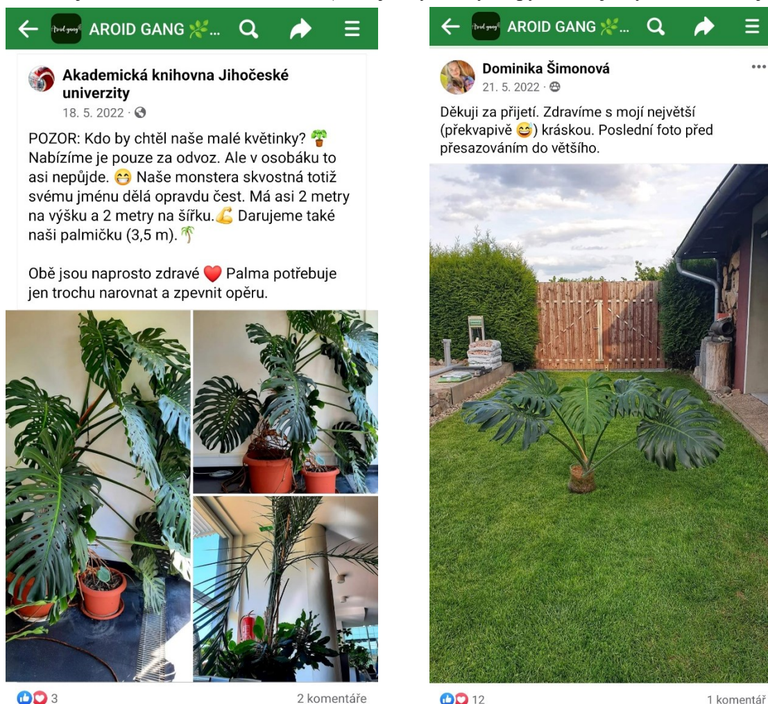
15. Příspěvy ve Facebookové skupině Aroid gang.

Z mého bádání vyplývá, že menší skupiny, skupiny zaměřené na specifický typ rostlin či skupiny, které nemají vymezenou funkci (například swapování apod.) podporují komunitní cítění mnohem více než ostatní typy (a to i když mají široké zaměření). Vyskytuje se na nich větší množství osobních příspěvků, které neobsahují dotazy či nabídky, ale jde pouze o to pochlubit se, jak se některé rostlině daří. (Pokojevky. Rady. Tipy. Prodej. Výměna.; Pokojevé