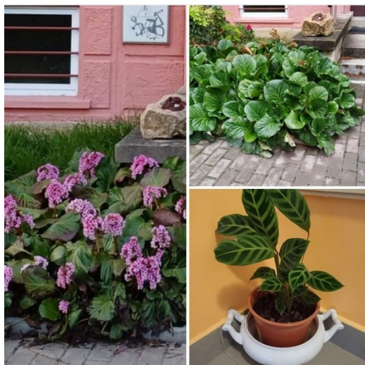
16. Příspěvek ve skupině ZELENY SWAP (VÝMĚNA ROSTLIN).