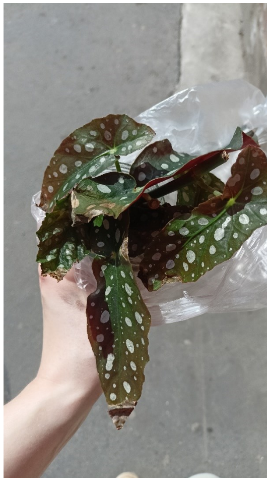
19. Vyswapovaná begónie.

Specializované obchody s pokojovými rostlinami nezastávají pouze funkci místa, kde je možné zakoupit rostlinu, ale (v rozličné míře u konkrétních obchodů) často hrají také funkci