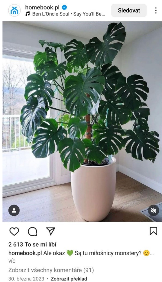
5. Monstera deliciosa .

Někteří aktéři v rozhovorech a předcházející komunikaci mluví o rostlinách jako o něčem ze své podstaty pomíjivém. Časté jsou zmínky o rostlinách, které odumřely vinou škůdců, nebo především špatného zacházení ze strany jejich majitele. Při širším pohledu se ale ukazuje, že tyto rostliny jsou mnohem trvanlivější, než by se mohlo zdát. Je možné že části této rostliny přežívají dál ve formě řízků, které postupem času zakořenily a staly se samostatnou rostlinou. Plant boom a nedávný zvýšený zájem o pěstování pokojových rostlin mezi lidmi mé generace (tato práce se zaměřuje především na starší členy generace Z, ale tento fenomén se týká také mileniálů), udělal z pěstování rostlin aktuální záležitost a mohlo by se zdát, že jde o něco nového. Když byli respondenti otázaní, kdy se s pokojovými rostlinami setkali poprvé, jen několik z nich uvedlo, že se s nimi setkávali již doma u rodičů jako děti (a to zpravidla proto, že sami dostali za úkol se o ně starat). Většina z nich uvedla že se tomu tak stalo pouze několik let nazpět, koncem střední školy či začátkem vysoké školy, často v souvislosti se záměrem přivlastnit si a zútulnit prostor který považují za svůj (pokoj, nový byt po odstěhování se od rodičů). Jak jsem ovšem uvedla již v předchozí části této práce, pokojové rostliny jako takové nás provází mnohem déle, než by se mohlo zdát, klidně i napříč generacemi.