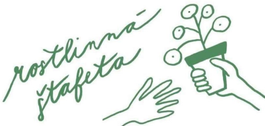
8. Úvodní obrázek swapu Rostlinná štafeta .