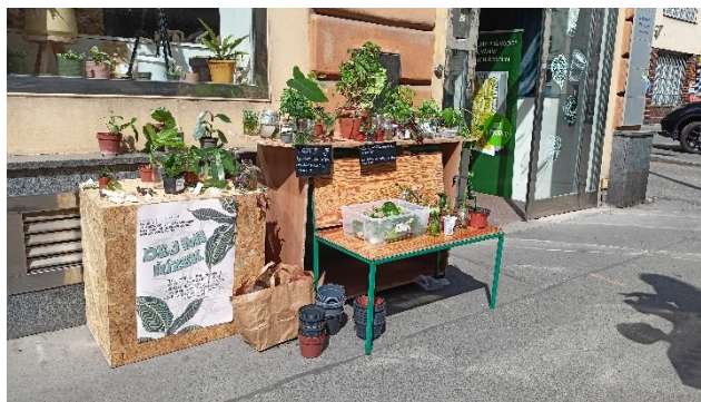
18. Swap obchodu Dej mi pokojovku.

Druhým swapem, kterého jsem se zúčastnila, swap obchodu Dej mi pokojovku. Ten má méně bohatou historii než swap Zahrady na niti, stejně jako obchod samotný. Jeho stránky také obsahují blog a je velmi osobně veden svými zakladateli, kteří dokonce vydali knihu o péči o pokojové rostliny. Tento obchod se zaměřuje specificky na prodej pokojových rostlin v květináčích. Jejich swap probíhal velmi podobně jako ten, který jsem popsala výše a také na něm nedocházelo k mnoha interakcím.