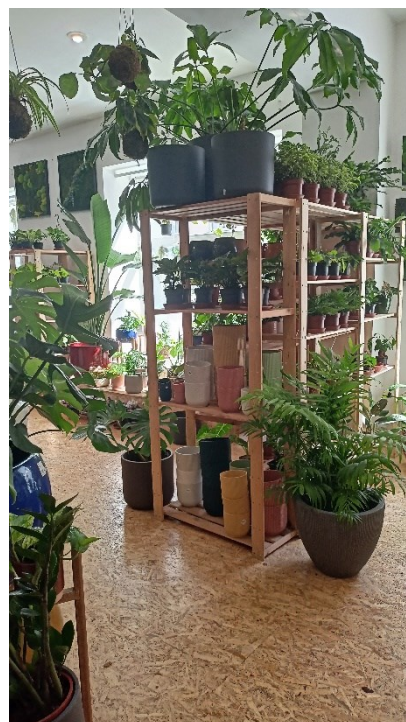
2. Prodejna Dej mi pokojovku na pražské Palmovce.

Rozložení osob, které jsou ochotny zakoupit si pokojovou rostlinu ve společnosti ovšem není zdaleka vyrovnané. U žen existuje vyšší pravděpodobnost, že si koupí pokojovou rostlinu než u mužů. Také u osob, které si zakoupily