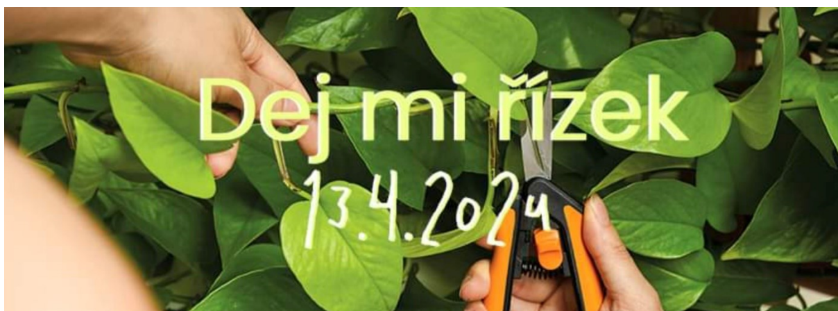
7. Úvodní obrázek swapu Dej mi řízek .