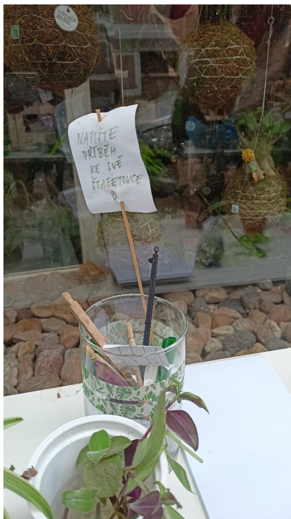
17. Fotografie ze swapu obchodu Zahrada na niti.

Myšlenka sdílení příběhů rostlin napříč komunitou se v rostlinné štafete udržel dodnes. Na Facebookové události je v popisu uvedena žádost o to, aby pěstitelé ke svým řízkům napsali i jejich historii. Jedné rostlinné štafety jsem se zúčastnila také osobně. Ta probíhala tak, že účastníci přinesly na stůl umístěný před prodejnu své řízků či přebytečné rostliny, vybavení apod. Swap probíhal celodenně. Tento typ události nicméně dle mého názoru podporuje komunitní cítění jen minimálně. Má sice za cíl propojit pěstitelé mezi sebou přidáním aspektu sdílení informací o rostlinách, ale alespoň na specifické události, které jsem se zúčastnila, k tomu nedocházelo. Rostliny byly maximálně popsány svým jménem a způsobem, jaký se o ně starat. Interakce na této akci probíhala většinou pouze mezi účastníky,