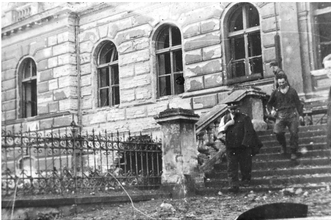
Příloha 6: Budova poškozená bombou v květnu 1945 (místem dopadu je díra v budově viditelná na fotografii).