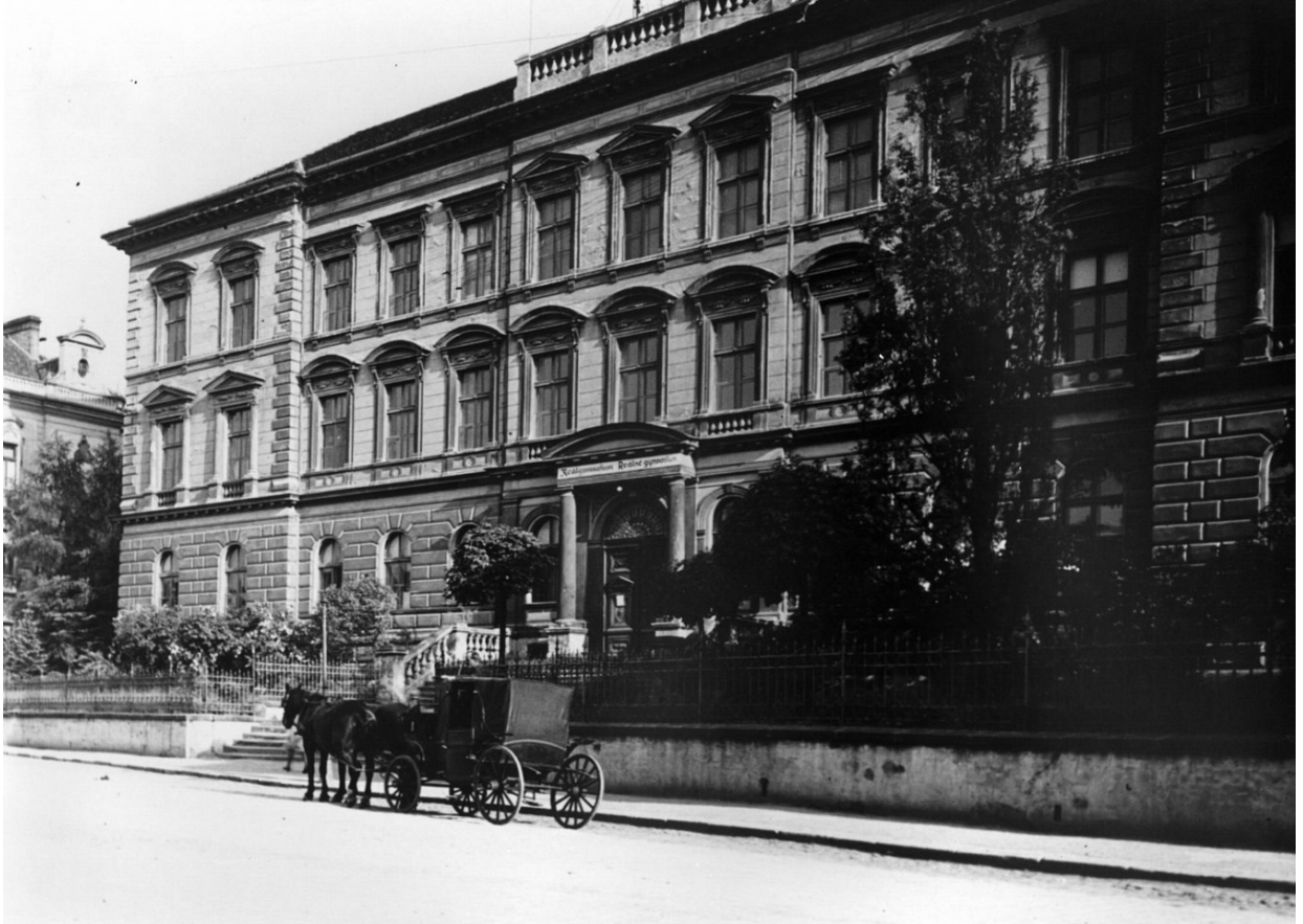
Příloha 2: Budova gymnázia za druhé světové války.