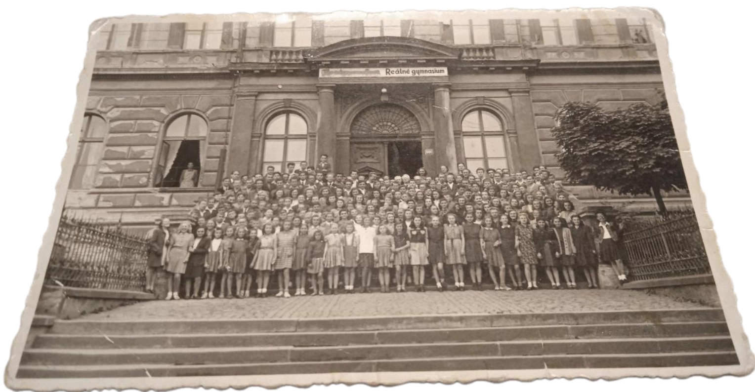
Příloha 5: Společná fotografie studentů po osvobození Roudnice nad Labem.