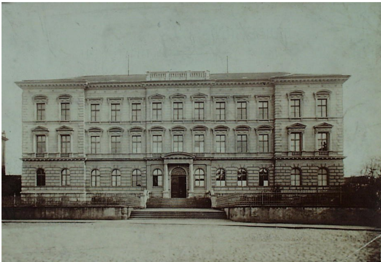
Příloha 1: Gymnázium na počátku 20. století – původní budova v ulici Jungmannova až do roku 1956 (dnes budova 2. základní školy Roudnice nad Labem).