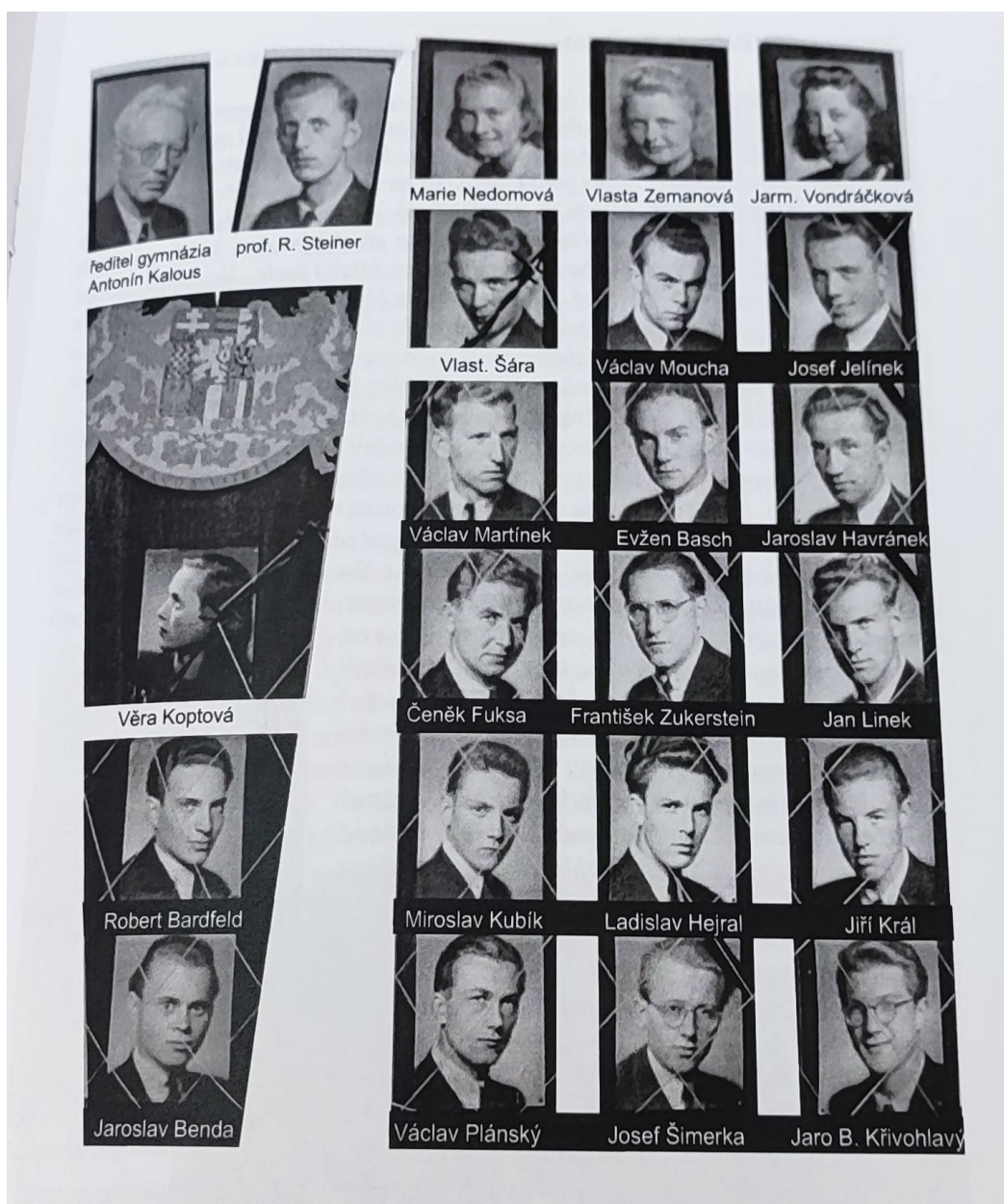
Příloha 9: Maturitní tablo VIII.C z roku 1945 (studenti, jejichž jména jsou na černém podkladě, byli zatčeni a vězněni v Malé pevnosti v Terezíně).