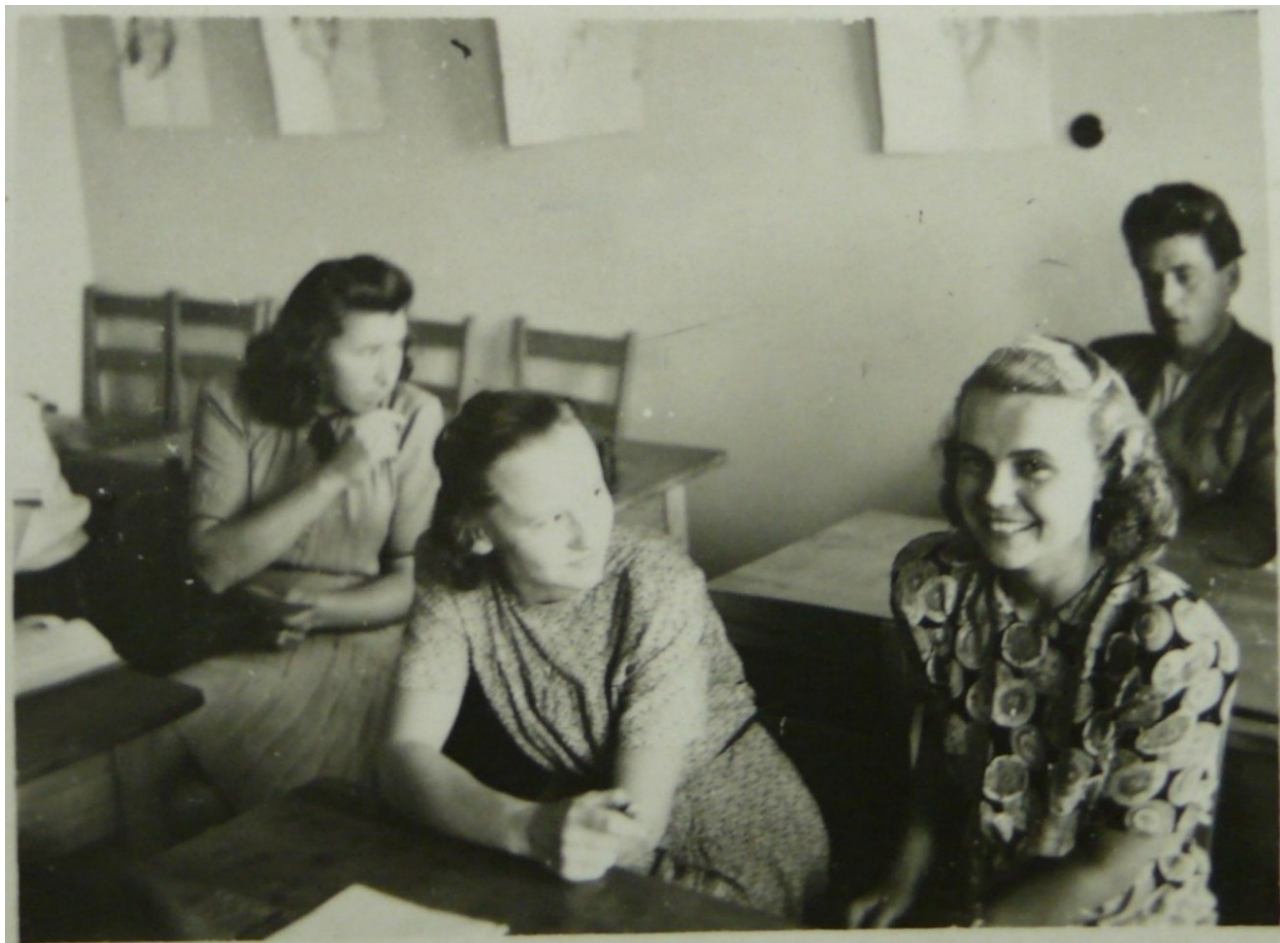
Příloha 7: Studenti během poválečného tříměsíčního kurzu pro studenty oktávy.