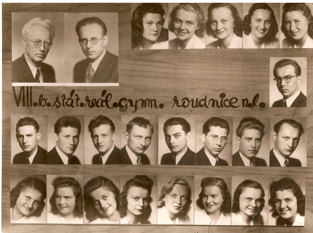
Příloha 8: Maturitní tablo VIII.B z roku 1945.