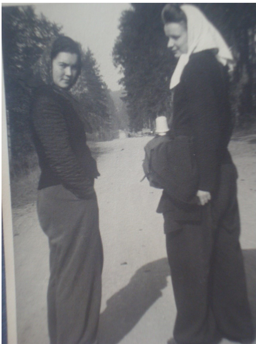
Příloha 4: Studentky na nucených pracích.