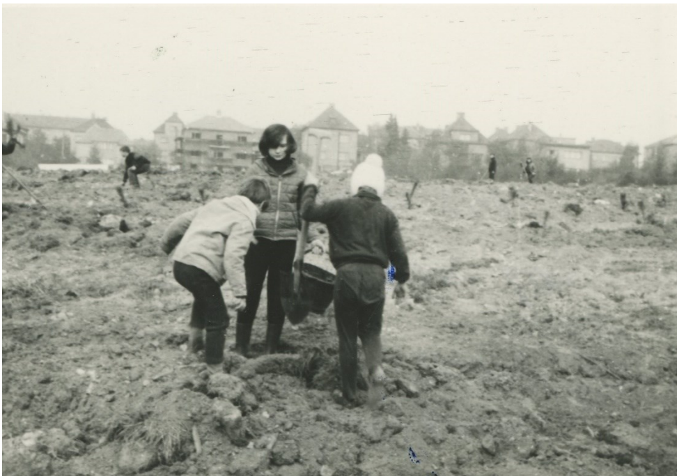
Obr. 12 – Sázání tzv. Dubčekova háje, říjen 1968.