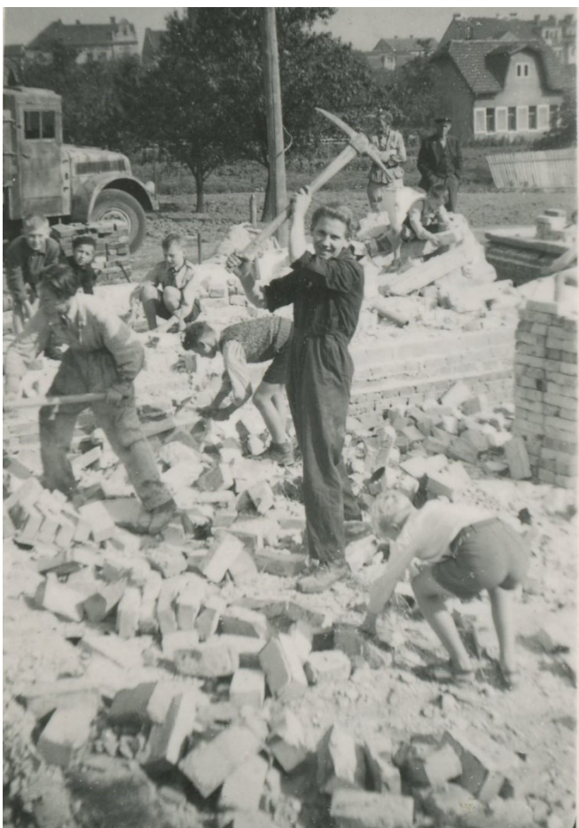
Obr. 1 – Stavba Skautského domova na Bílé Hoře, 1945.