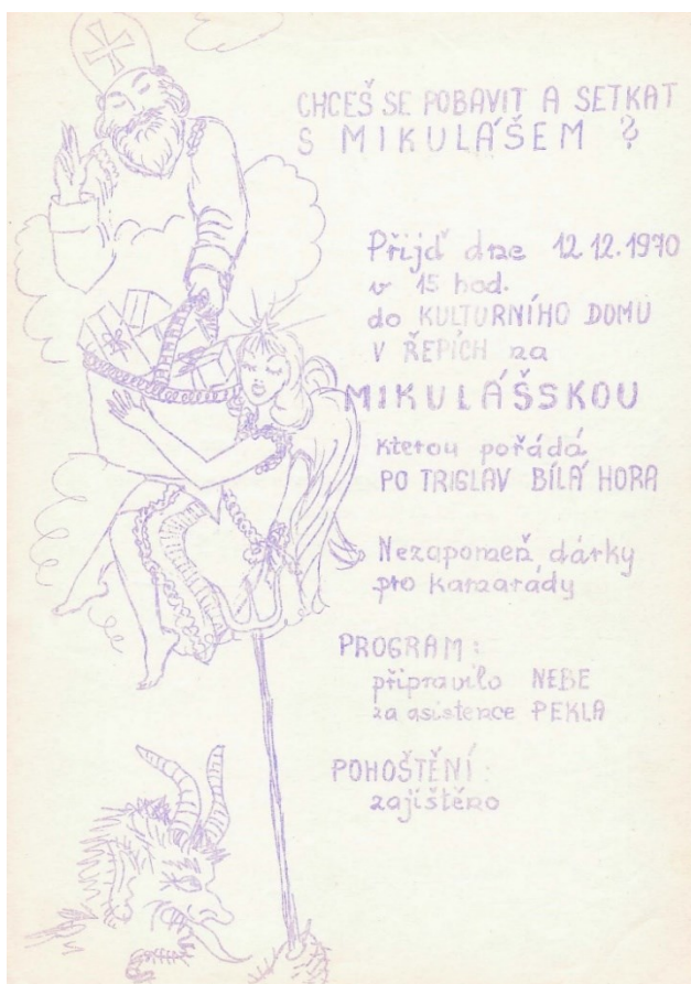
Obr. 29 – Pozvánka na Mikulášskou, 1970.