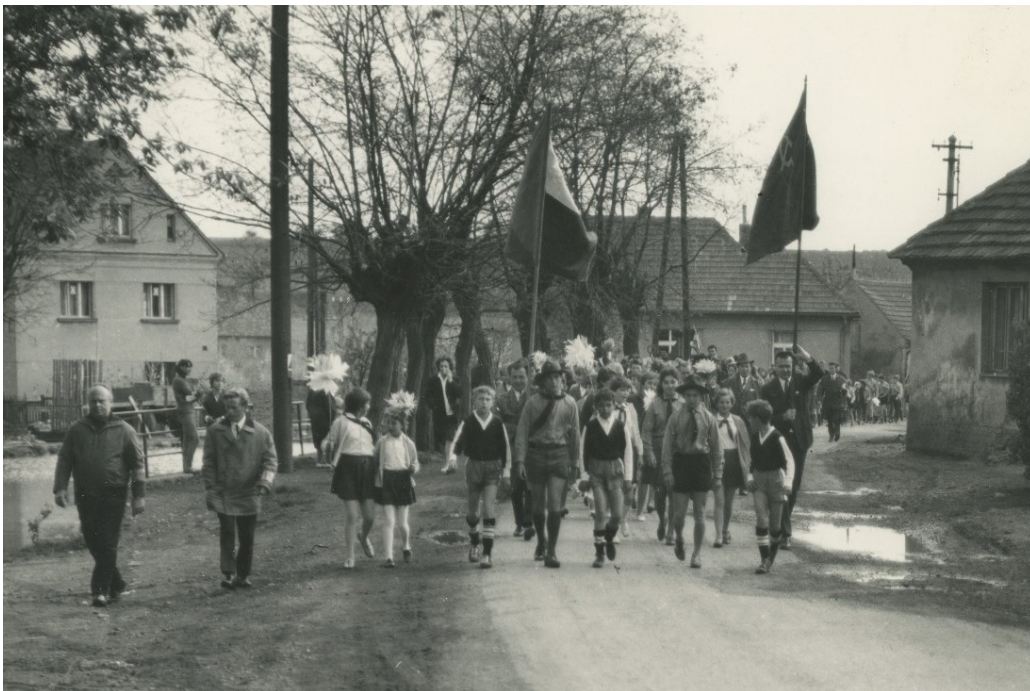
Obr. 4 – První máj 1968.