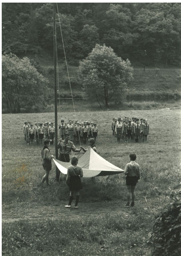
Obr. 28 – Střediskový výlet do Plas, červen 1970. U stožáru Josef Krupička.