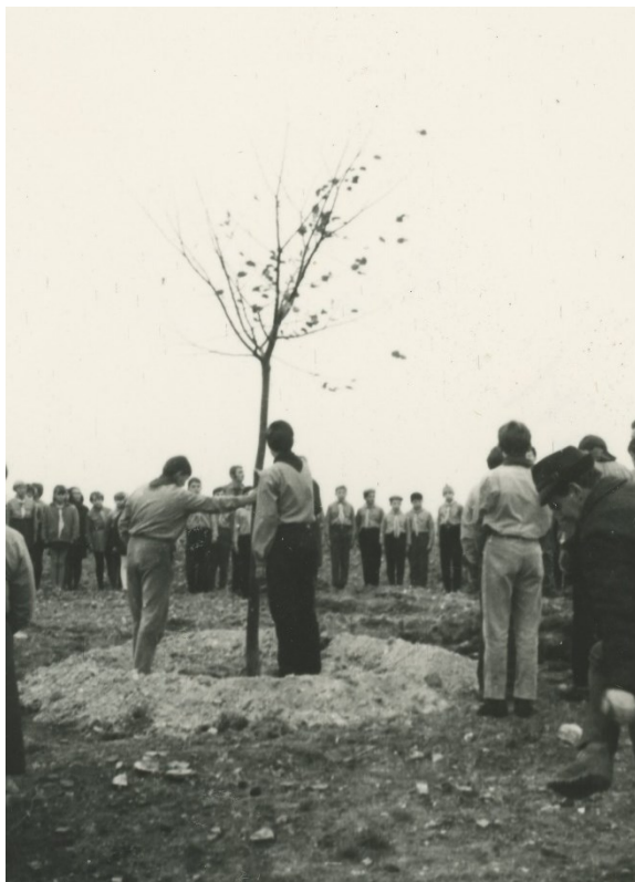
Obr. 10 – Sázání lípy svobody v Borovičkách, 28. října 1968.