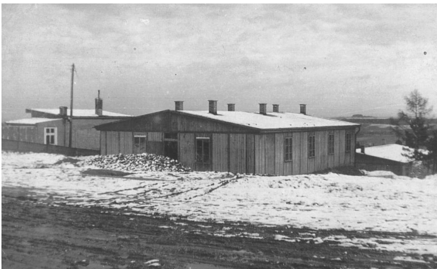
Obr. 2 – Skautský domov na Bílé Hoře.