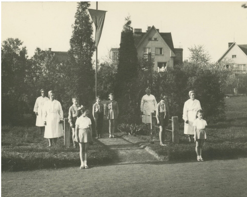
Obr. 14. – U pomníku na Bílé Hoře, květen 1969.