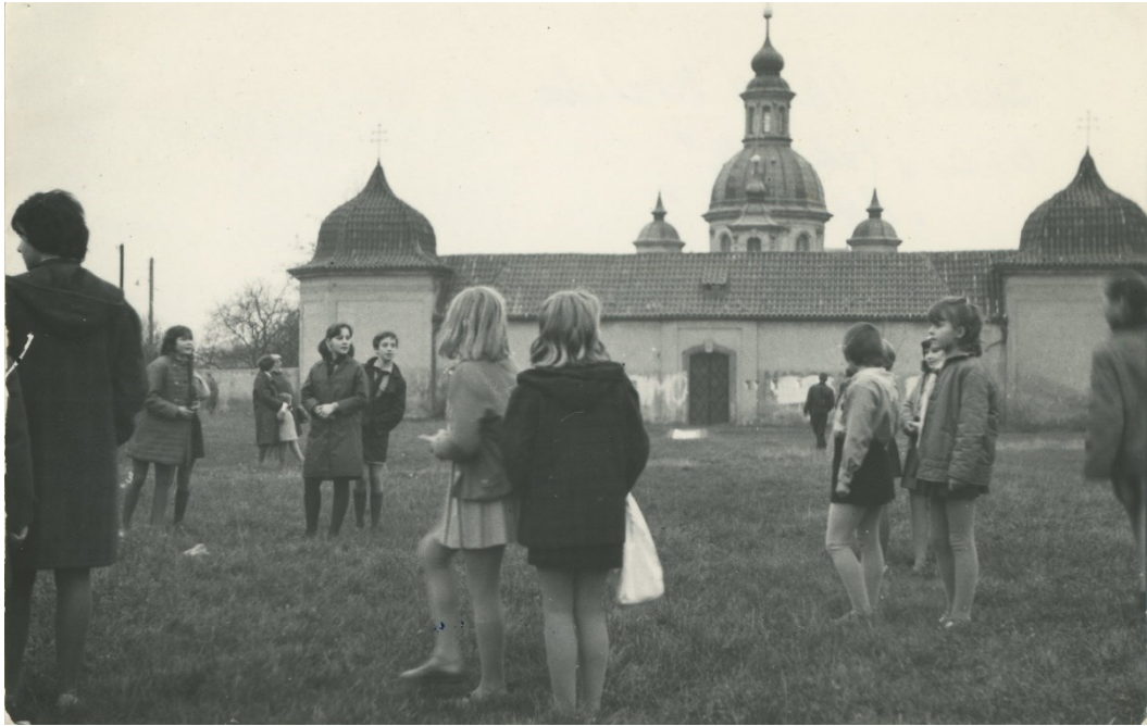
Obr. 7 – Schůzky v blízkosti kostela na Bílé Hoře, jaro nebo podzim 1968.