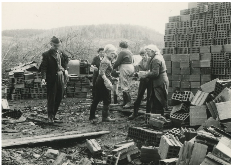
Obr. 27 – Výstavba SOS vesniček v Doubí u Karlových Varů, 1970.