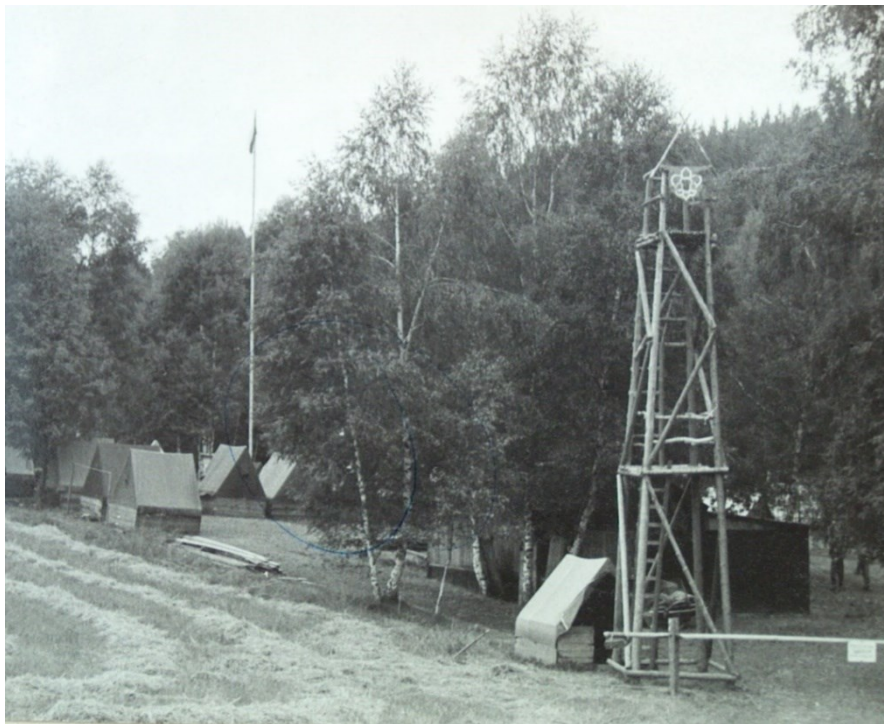
Obr. 6 – Tábor 1968, Miletín.