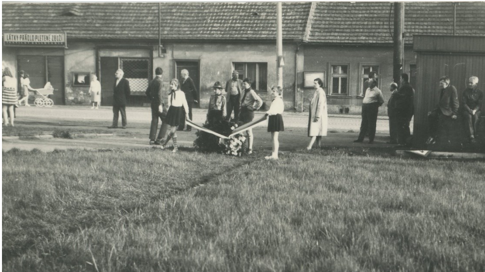
Obr. 15 – U pomníku na Bílé Hoře, květen 1969. U věnce Miluška Váňová a Eva Meskařová.