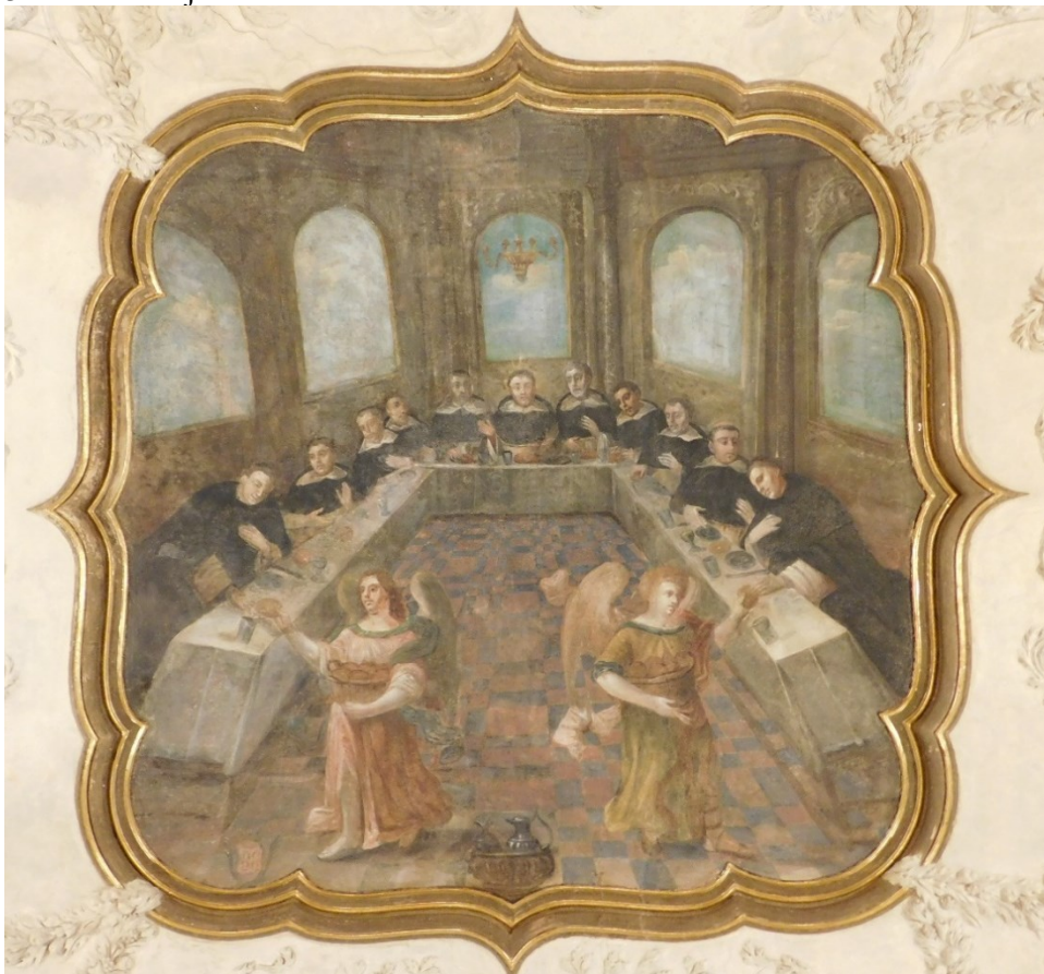
4. Andělé po modlitbě sv. Dominika přináší chléb bratřím řádu kazatelů