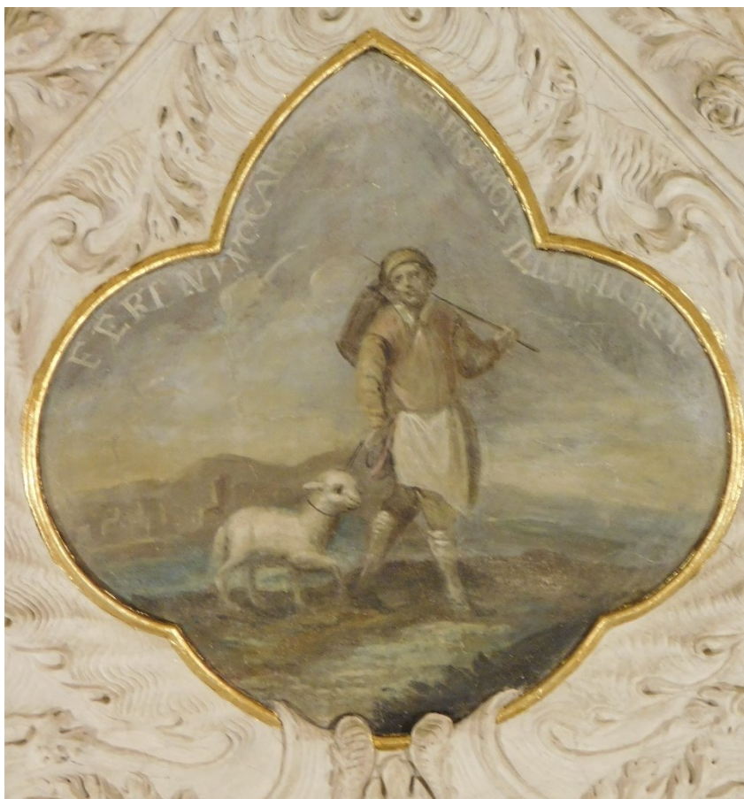
47. Fert nunc candorem, reverens mox ille ruborem (Iz 53?)