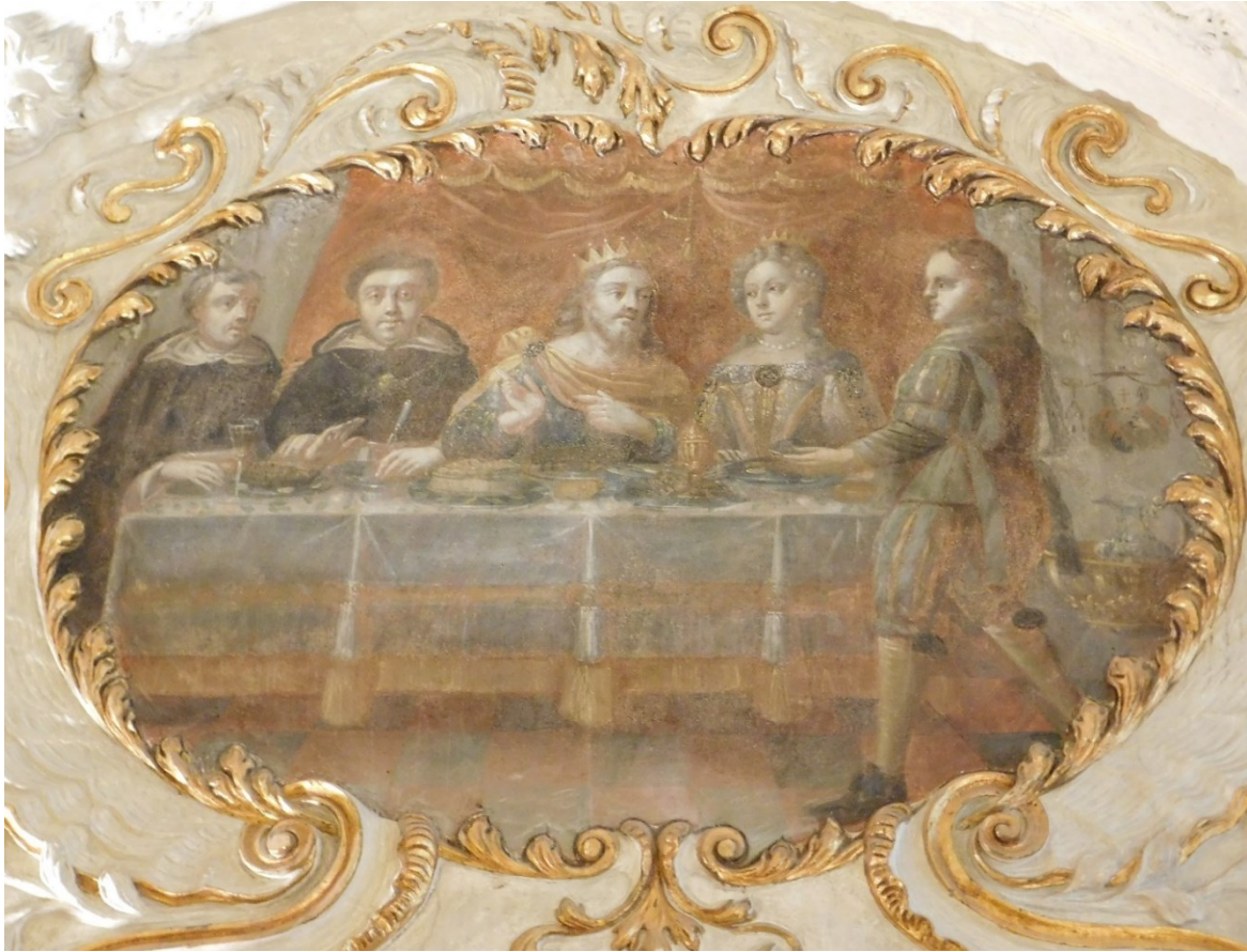
7. Sv. Tomáš Akvinský na hostině Ludvíka IX.