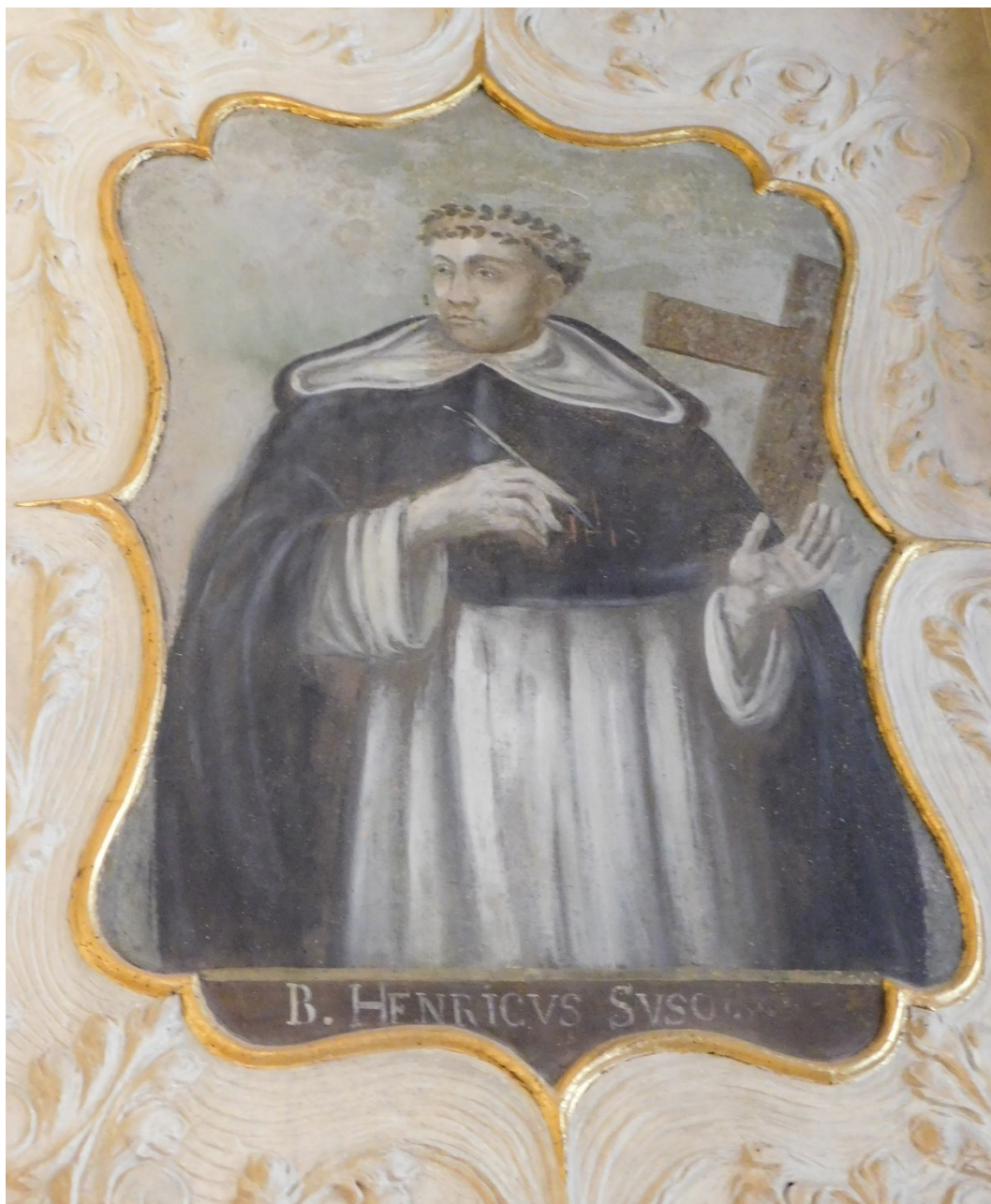
24. Bl. Jindřich Suso