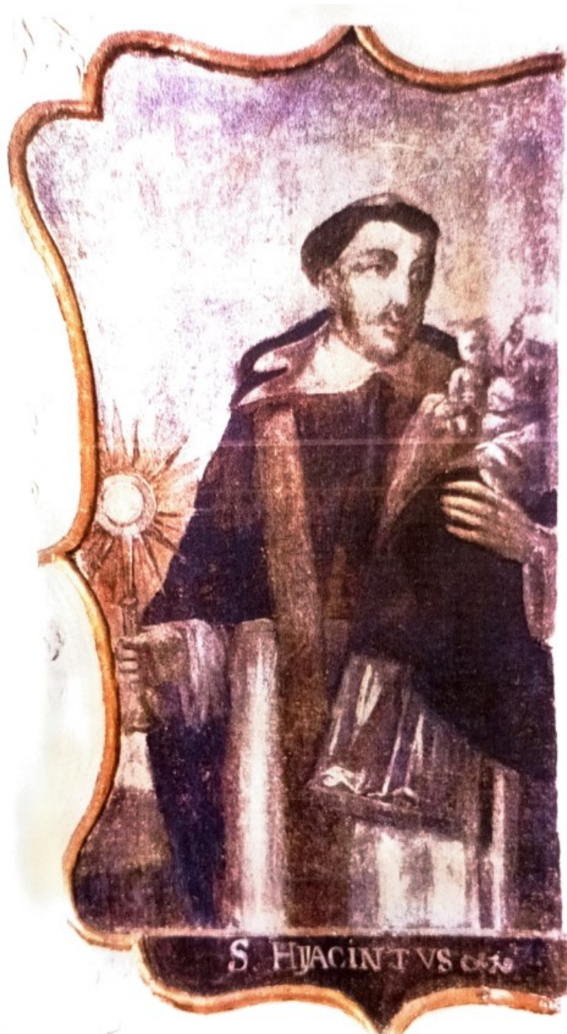
27. Sv. Hyacint.