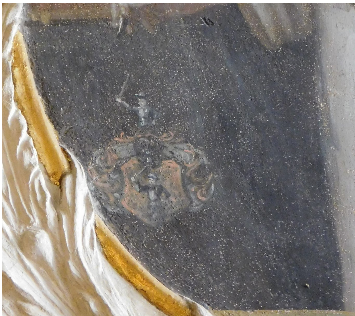
55. Detail znaku neznámého šlechtice(?), malba bl. Jakuba z Bevagna