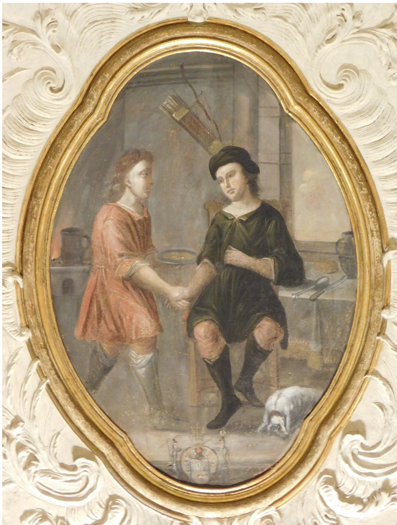
13. Jákob a Ezau