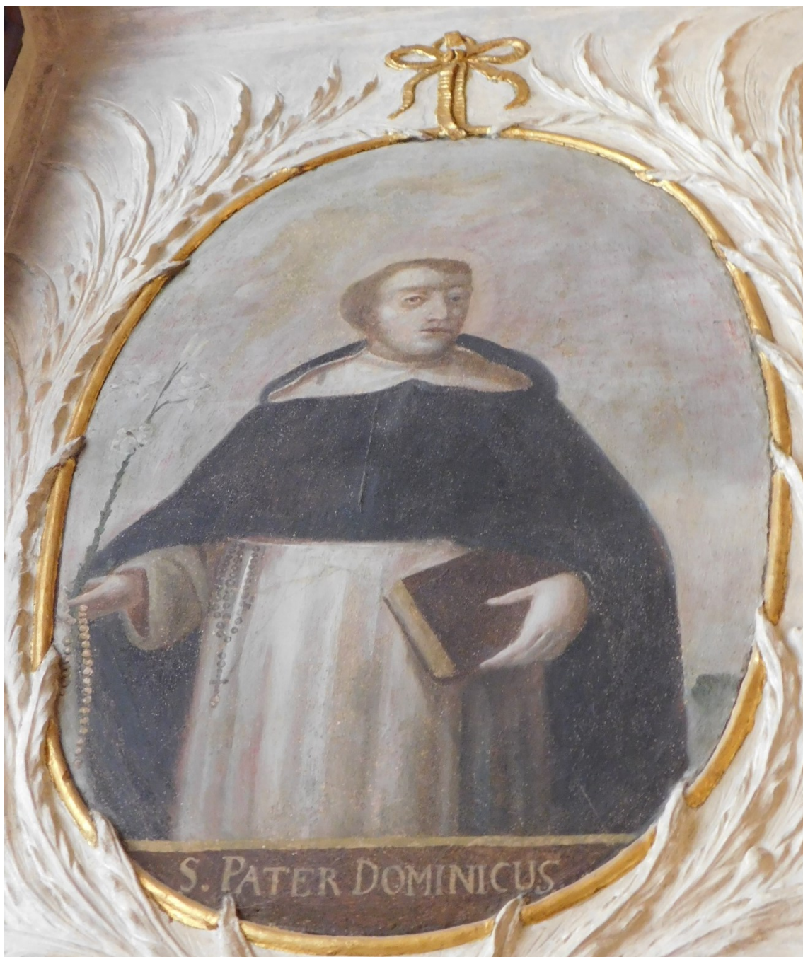
17. Sv. Dominik