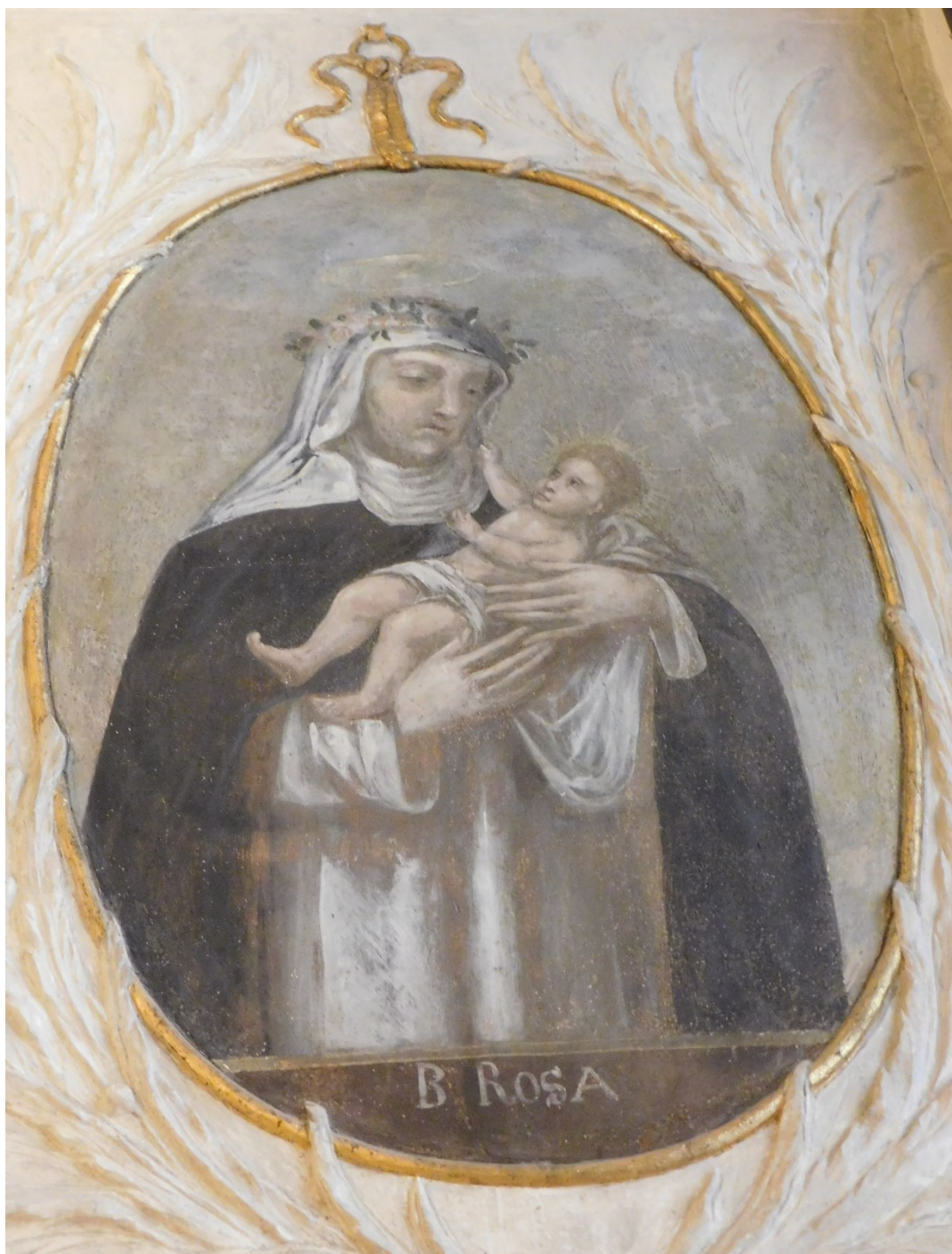
26. Bl. (sv.) Růžena z Limy