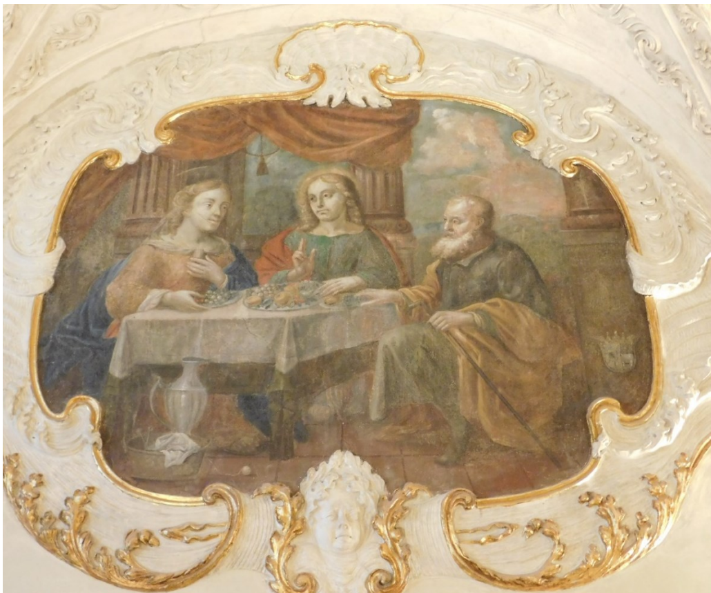
6. Drusiana hostící sv. Jana Evangelistu?