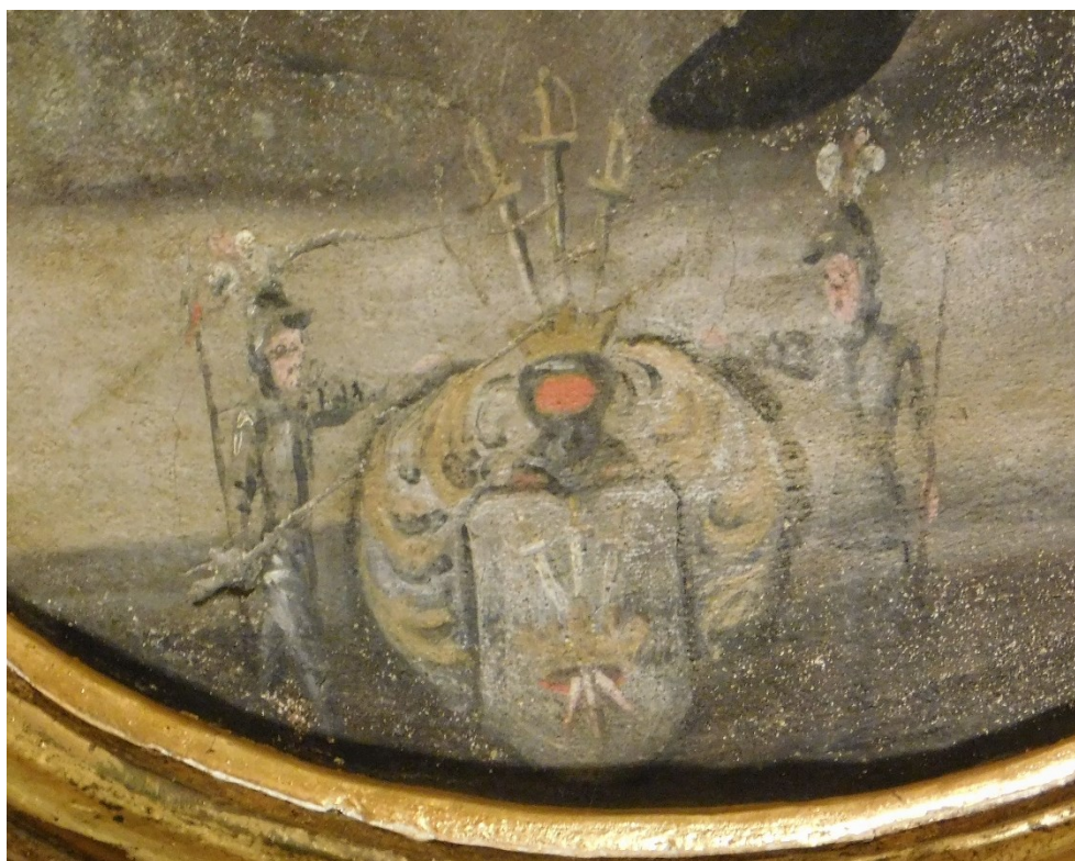
48. Detail znaku cechu mečřřů