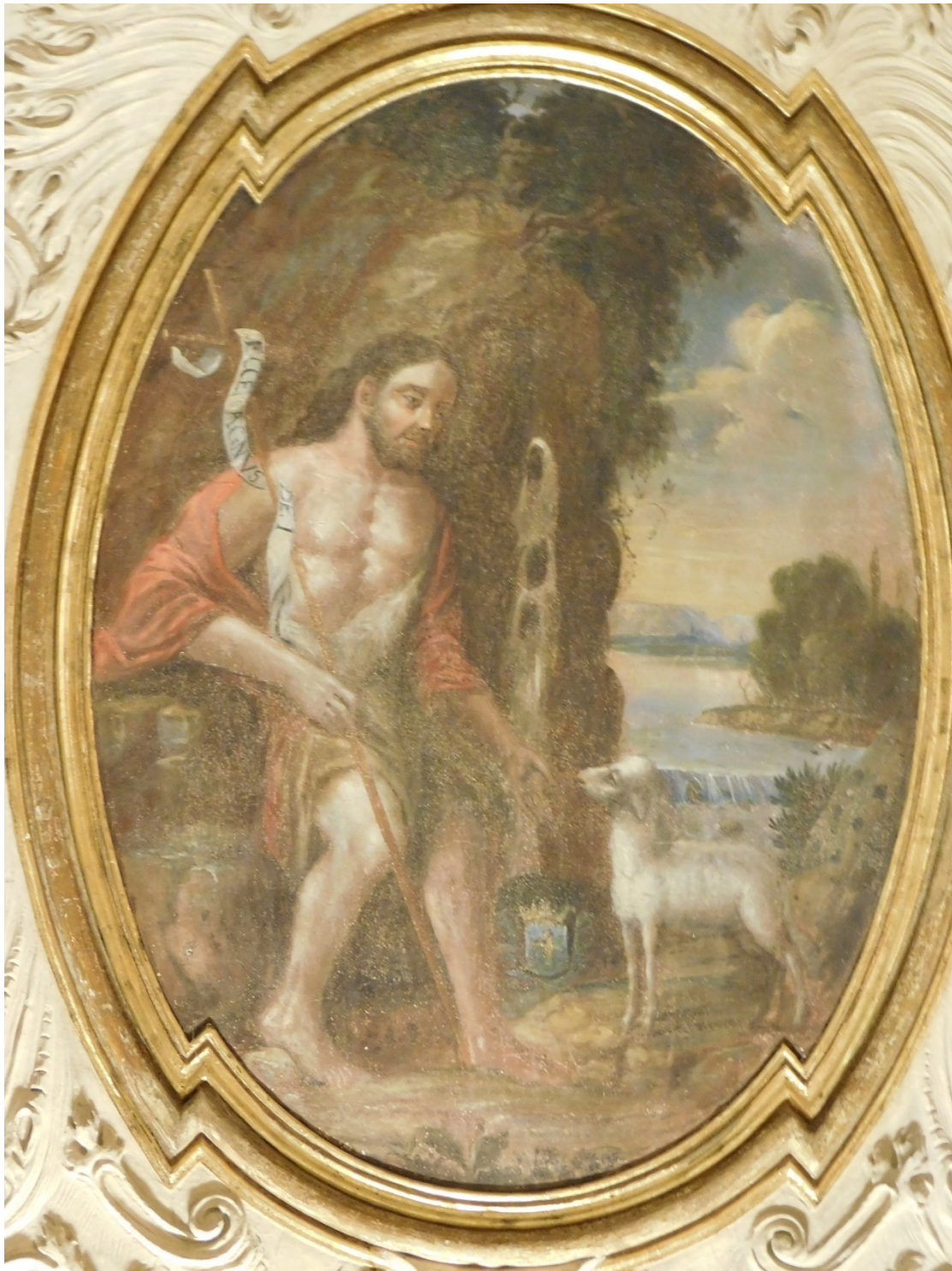
9. Sv. Jan Křtitel