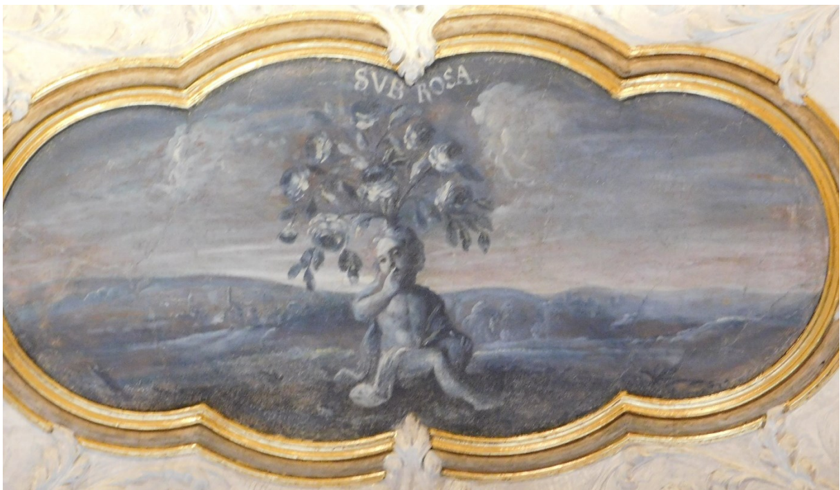
42. Sub Rosa