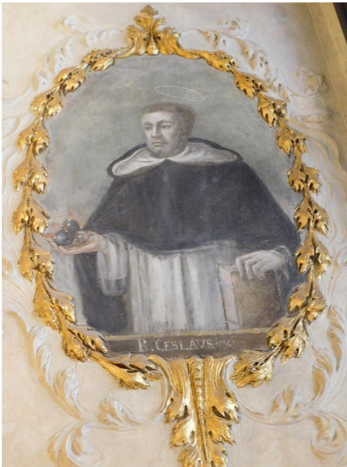
22. Bl. Česlav Odřivous