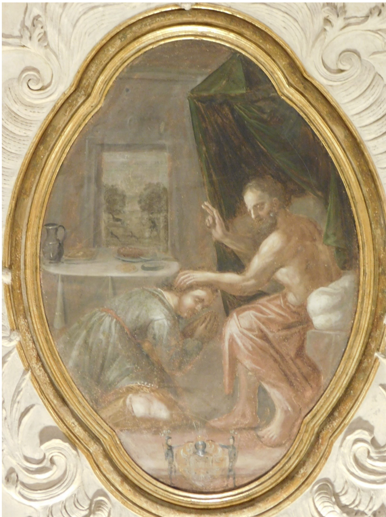
14. Izák žehná Jákobovi