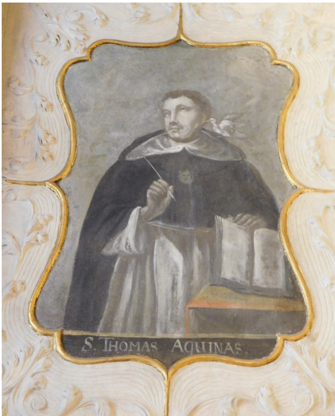
19. Sv. Tomáš Akvinský