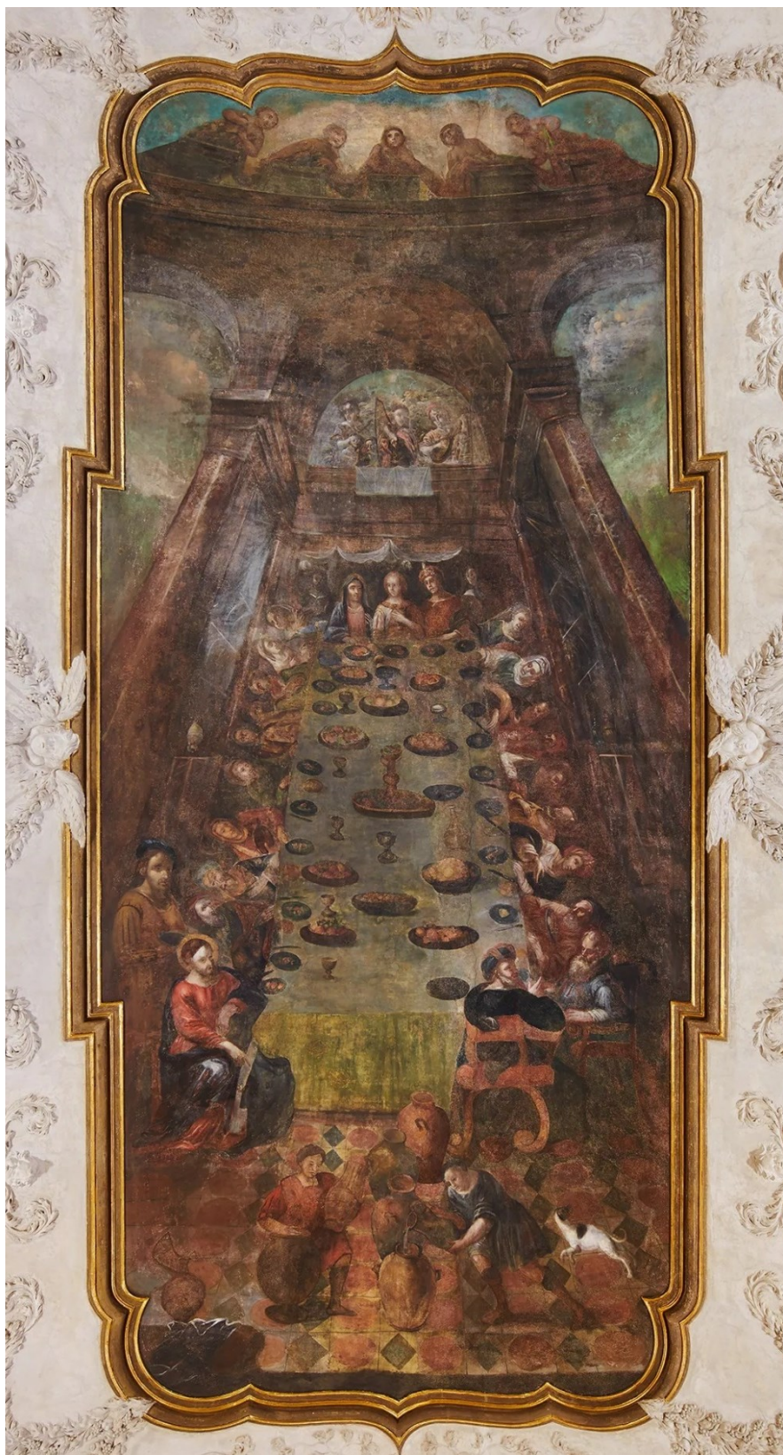
2. Svatba v Káni galilejské