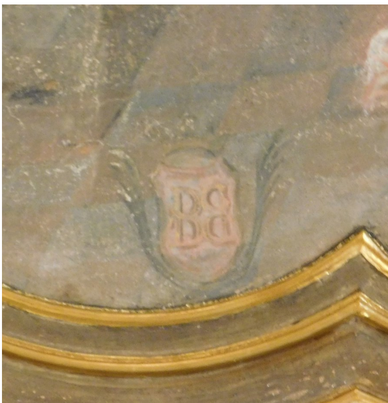
54. Detail znaku neznámého šlechtice(?), malba hostiny sv. Dominika