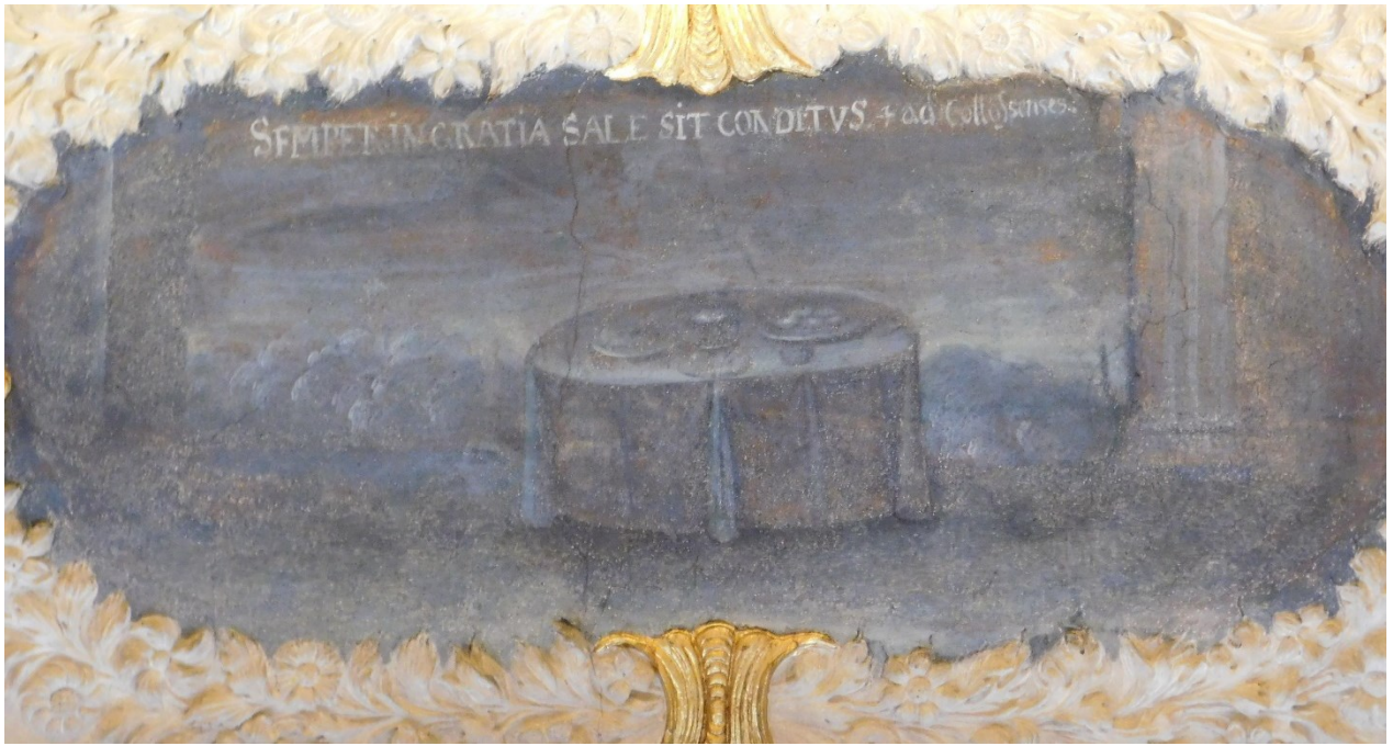
39. Semper in gratia sale sit conditus (Kol 4,6)