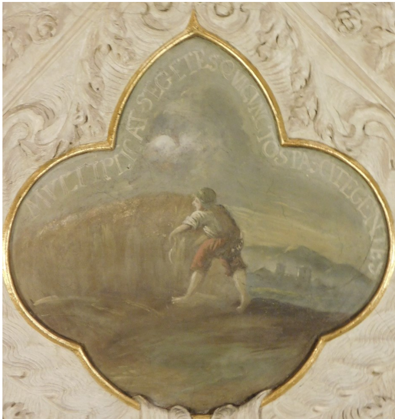
45. Multiplicat segetes quicunctos pascitegentes (Jan 6,1–15?)