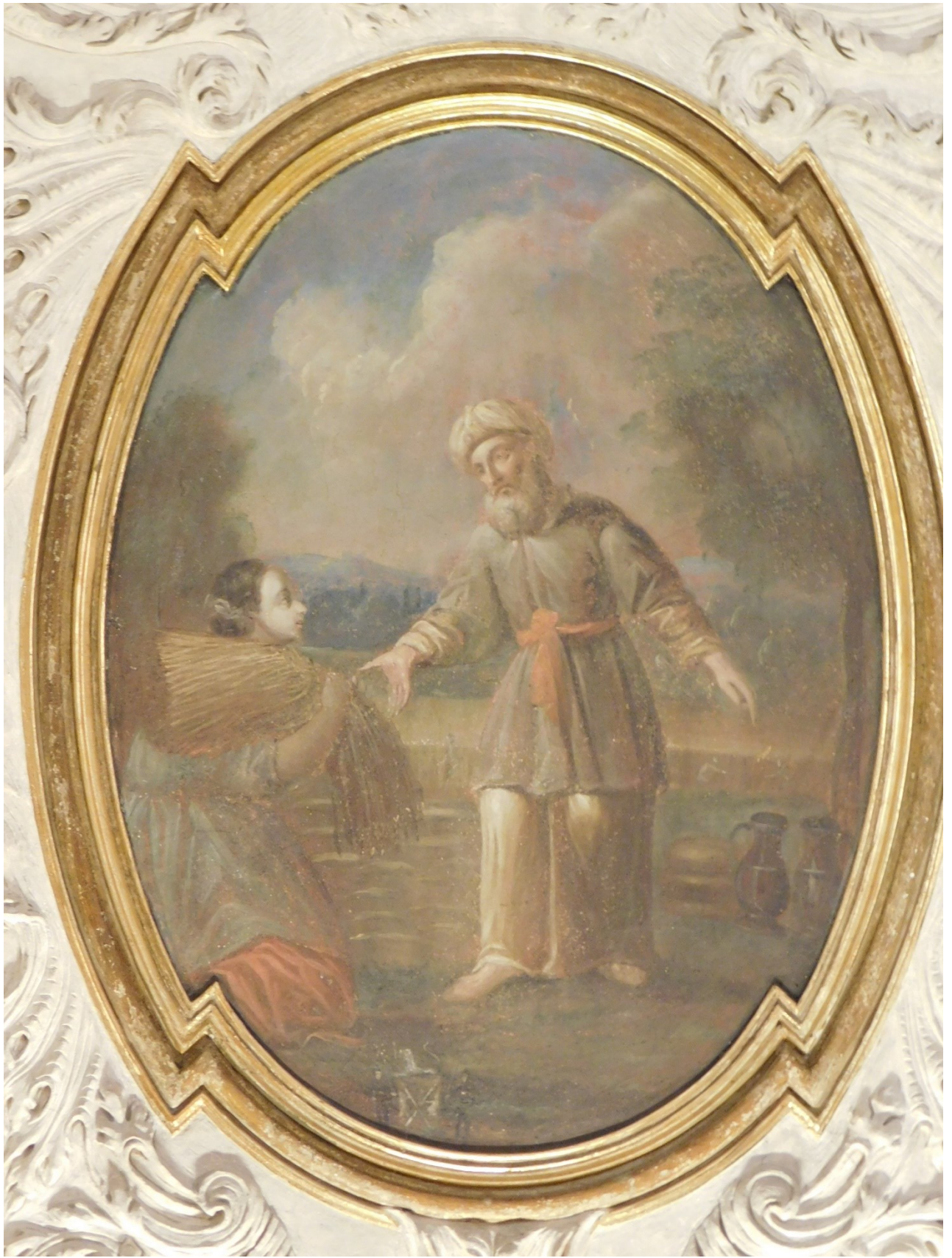
16. Rút a Boáz