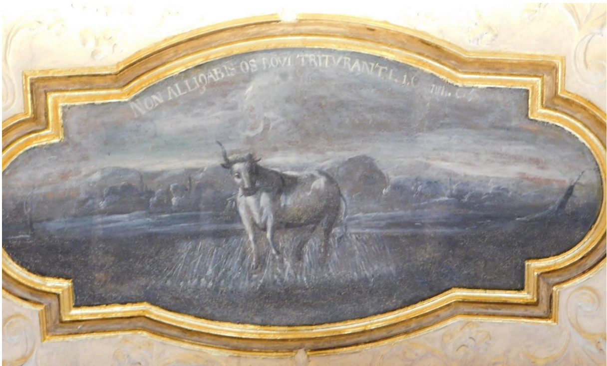
36. Non alligabis os bovi trituranti (1Kor 9,9)