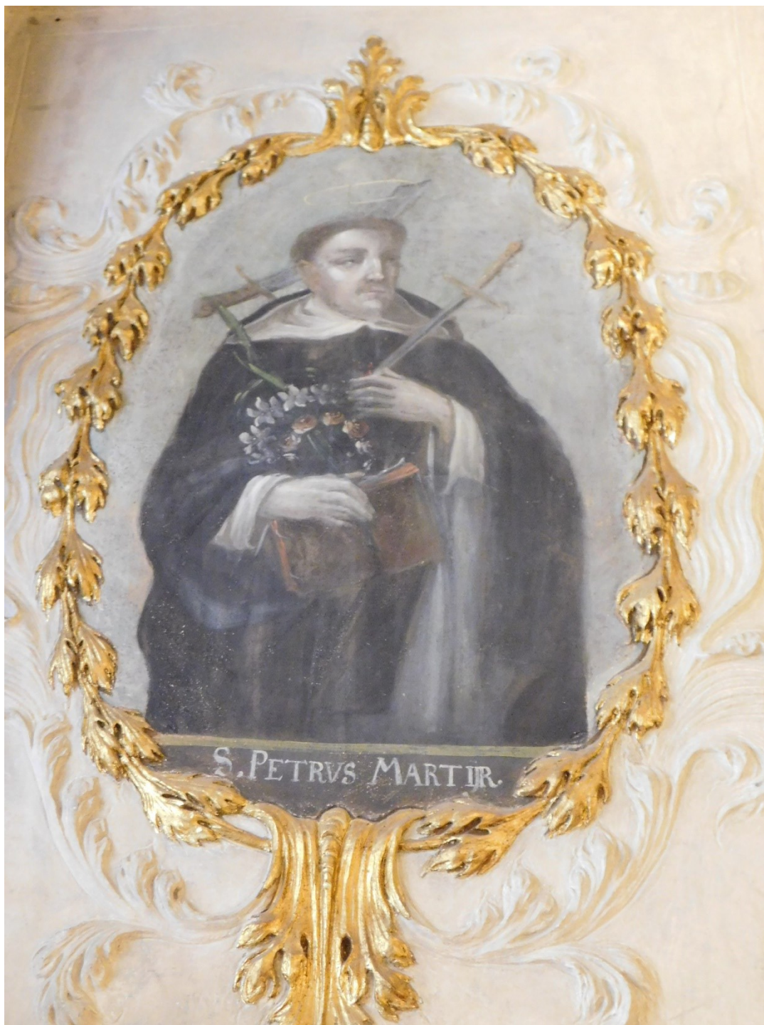
21. Sv. Petr Mučedník