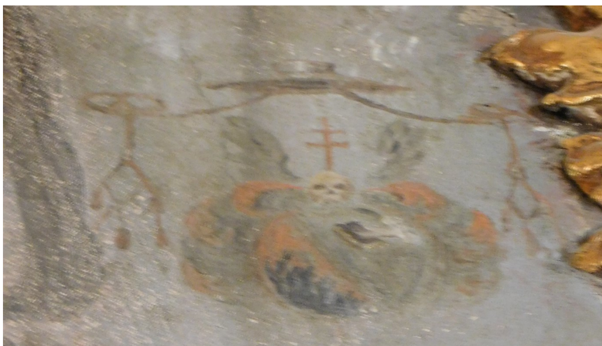
50. Detail znaku neznámého církevního dignitáře