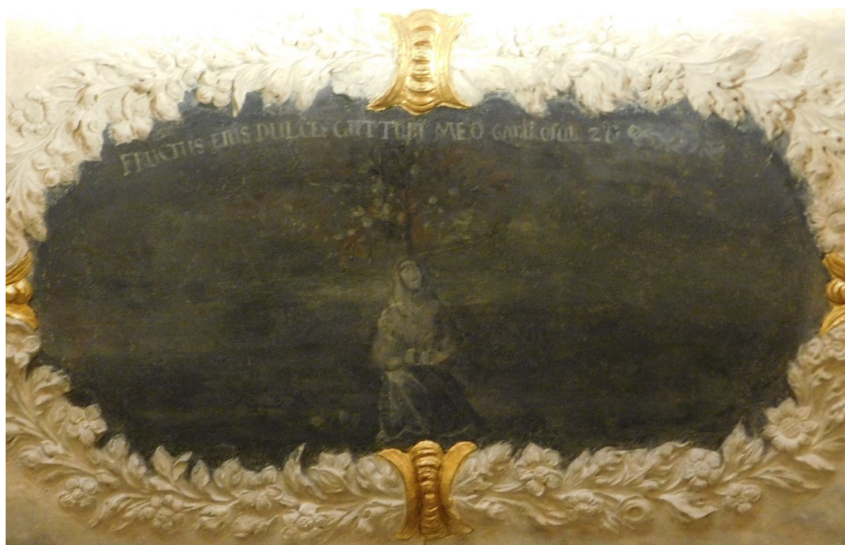
38. Fructus eius dulces gutturi meo (Pís 2,3)