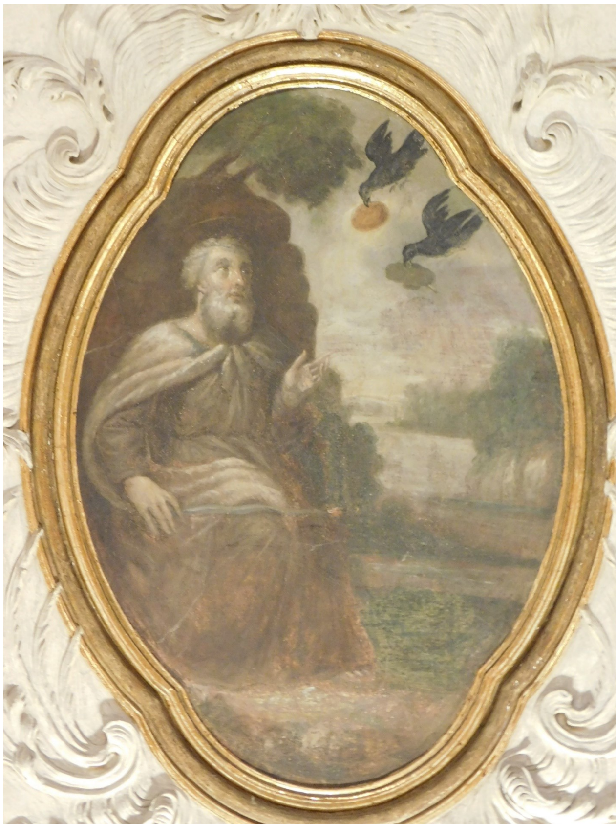
12. Prorok Eliáš krmen havrany