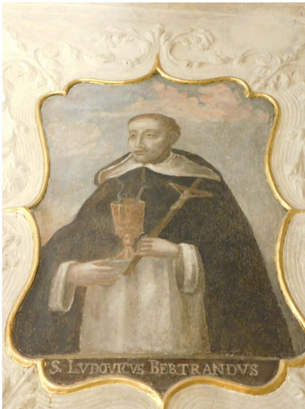
31. Sv. Ludvík Bertrand