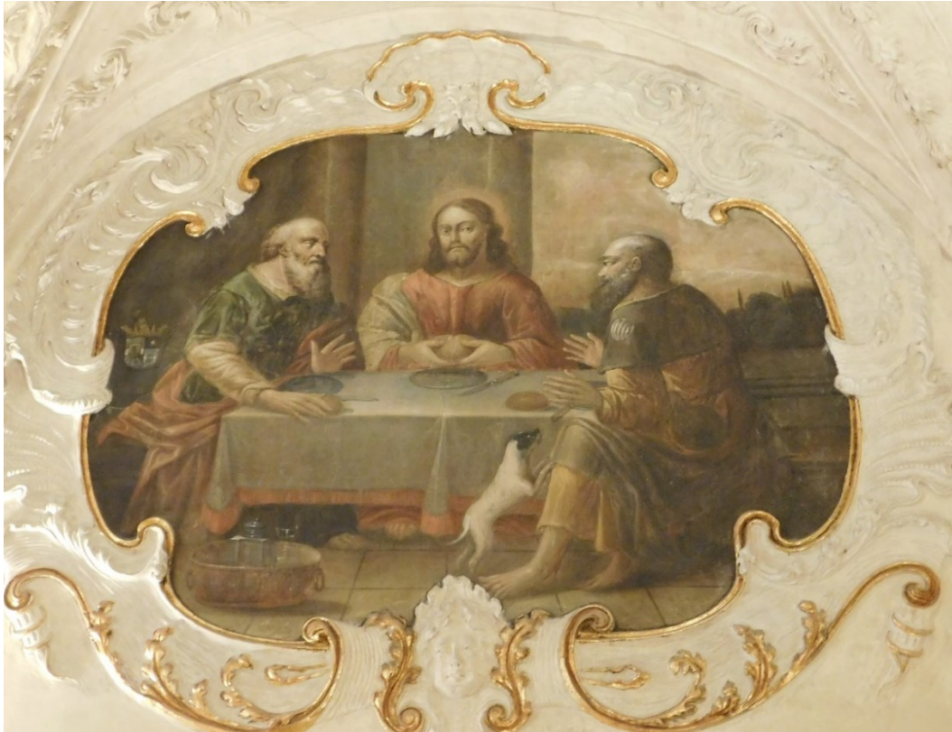
5. Večere v Emauzích