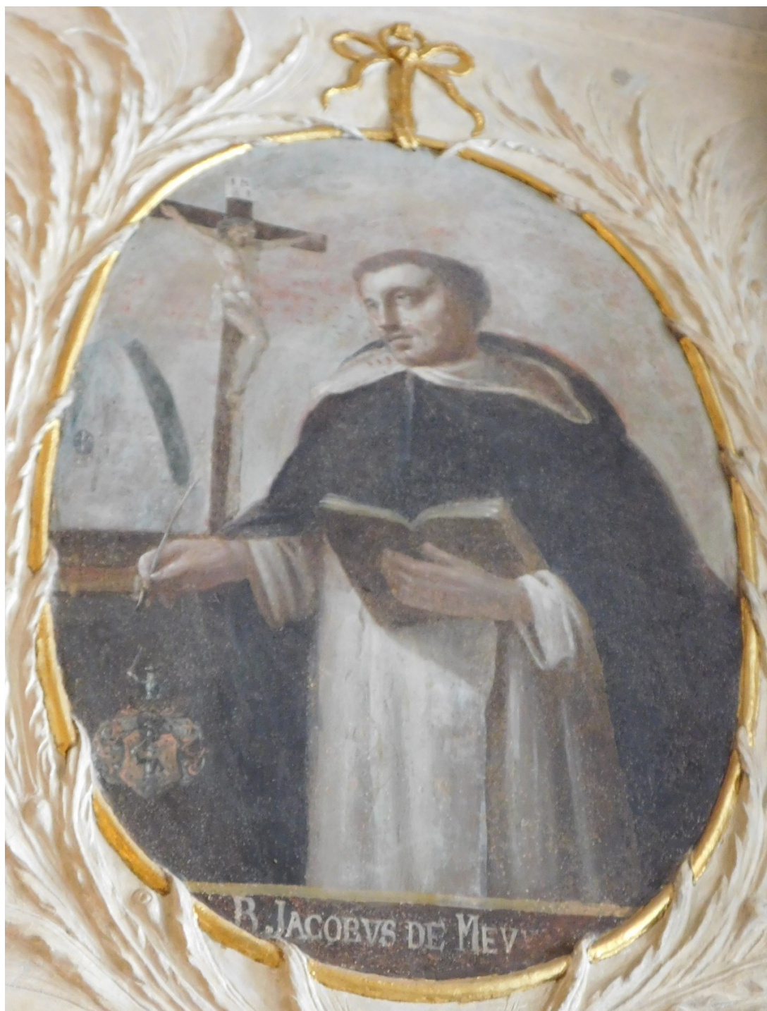
18. Bl. Jakub z Bevagna