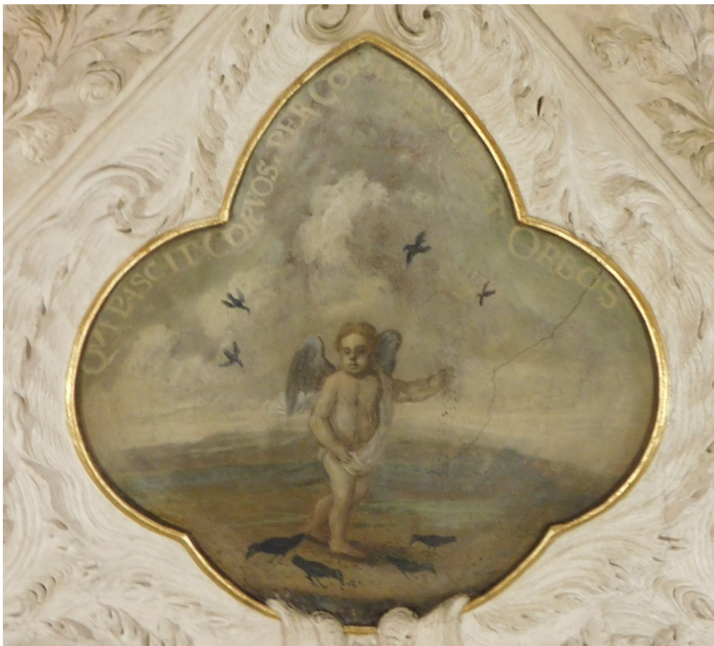
44. Qui pascit corvos per corvos pascit et orbos (Lk 12,24?)