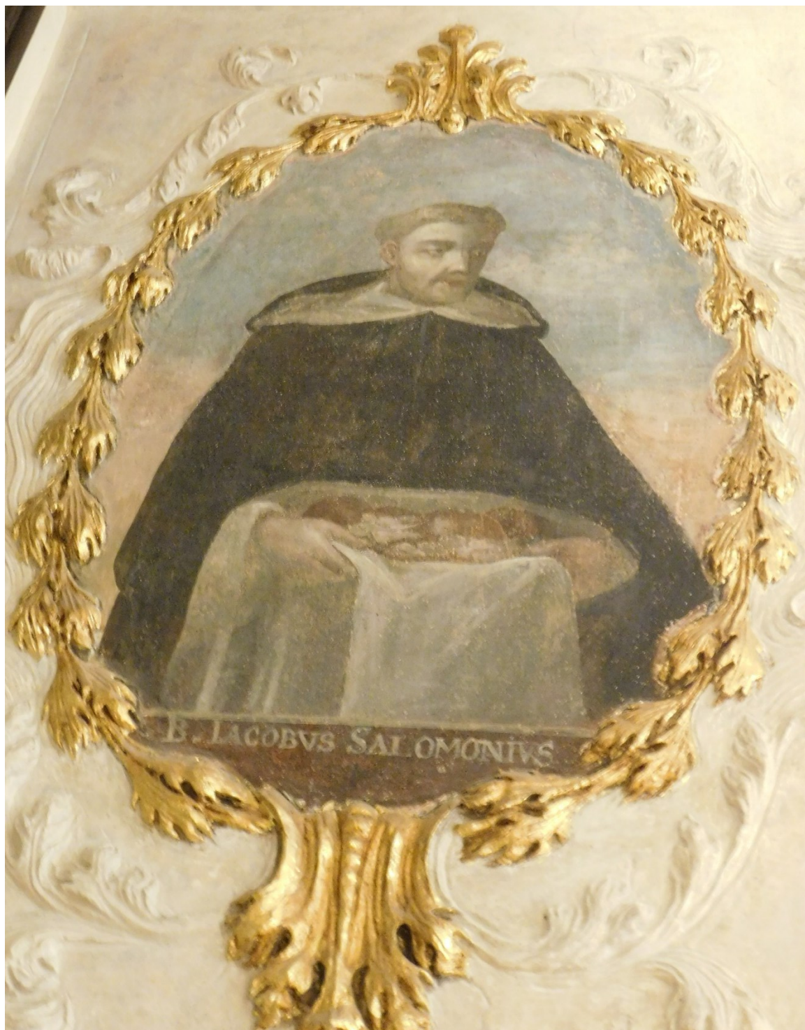
30. Bl. Jakob Salomoni