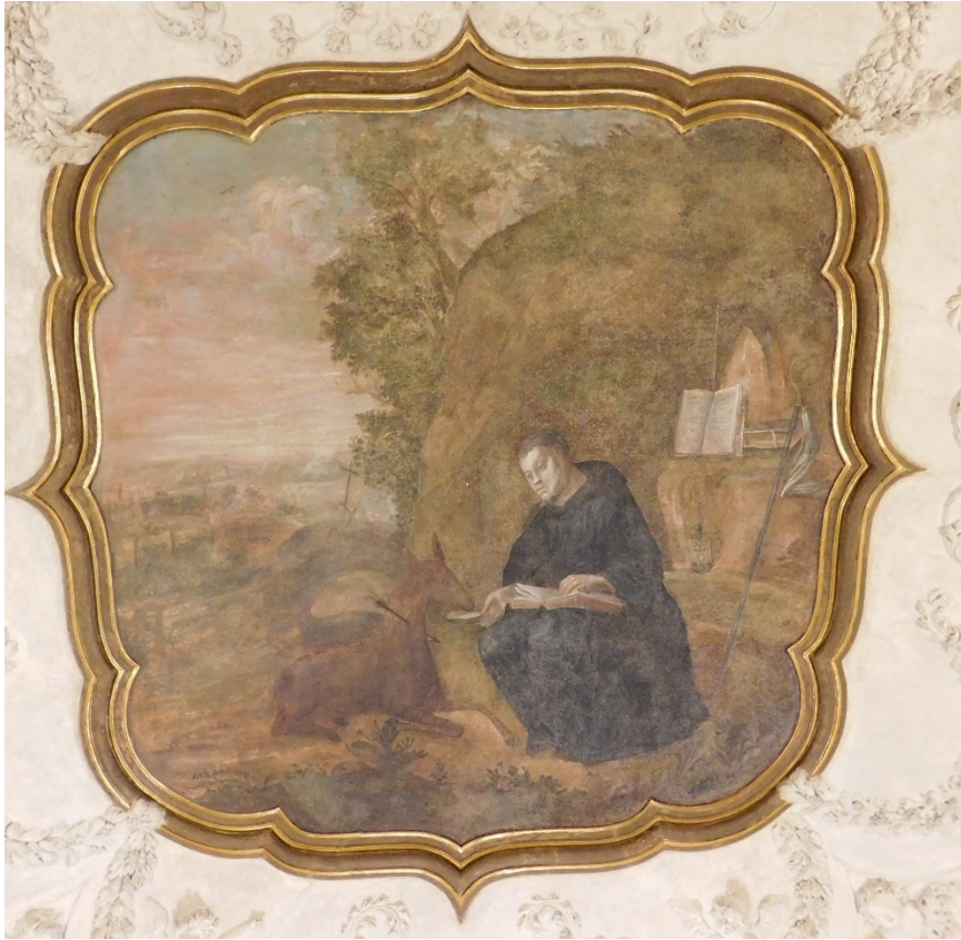
3. Sv. Jiljí krmící laň