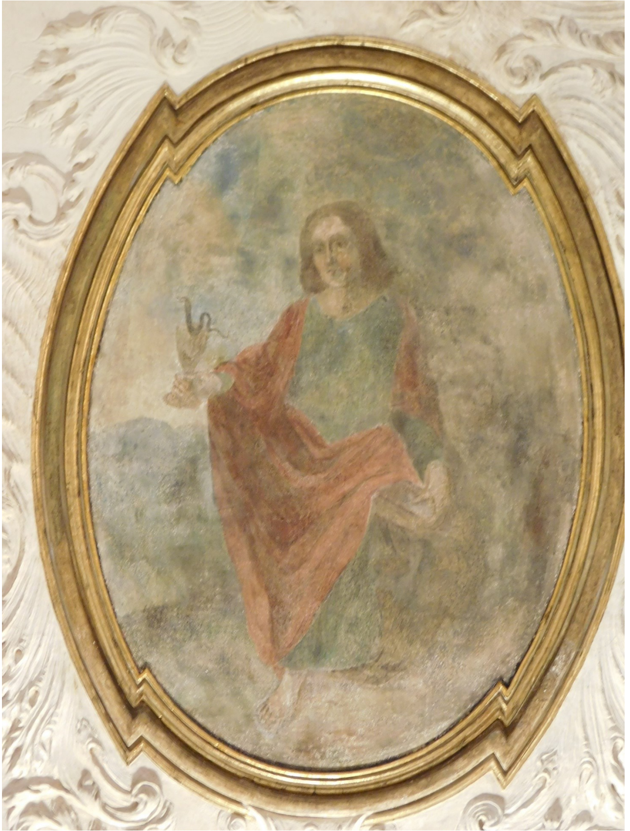
10. Sv. Jan Evangelista