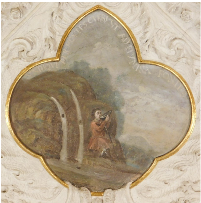
46. Undique per montes currunt ad flumina fontes (Ž 104?)