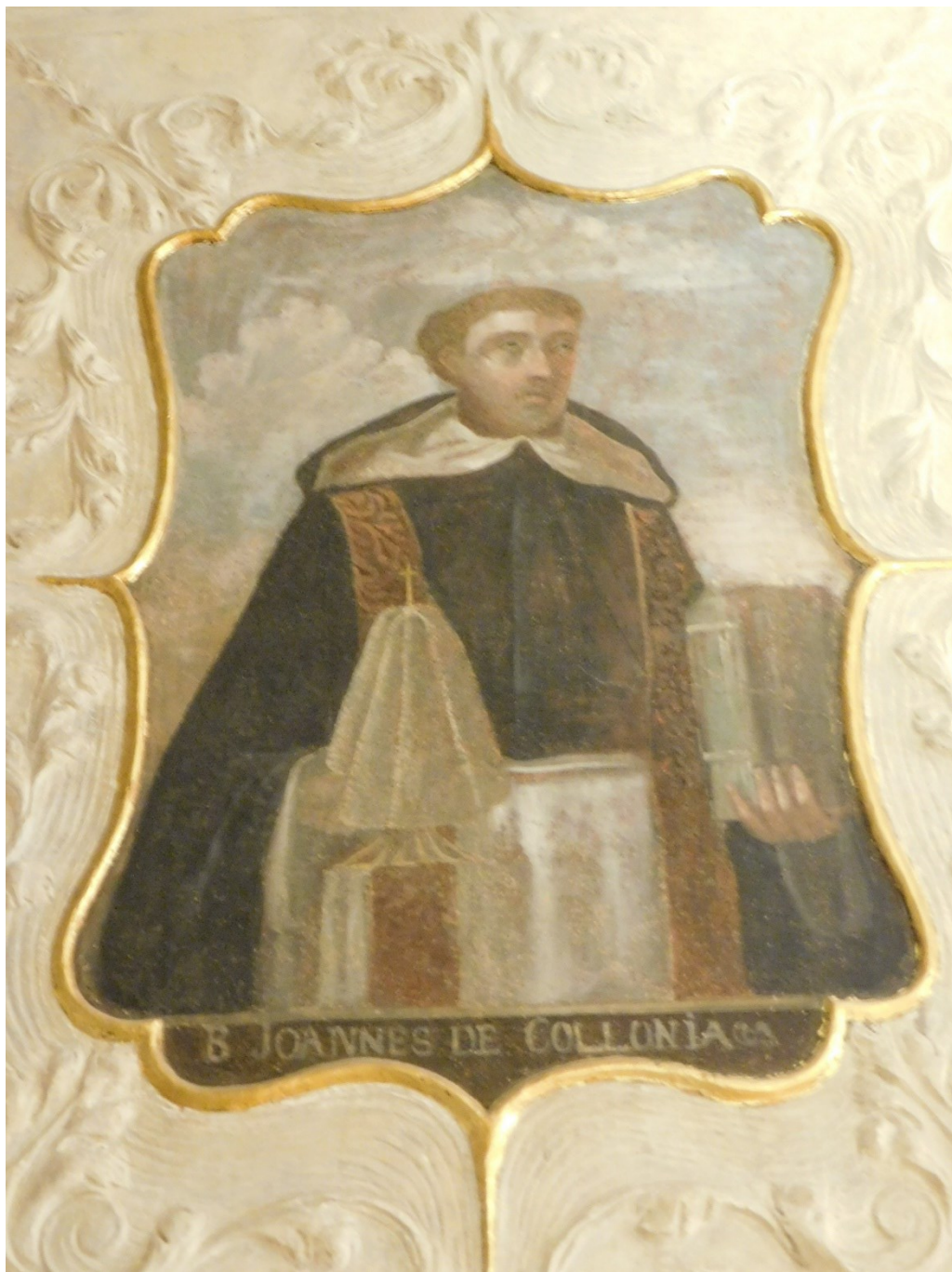
32. Bl. Jan z Kolína