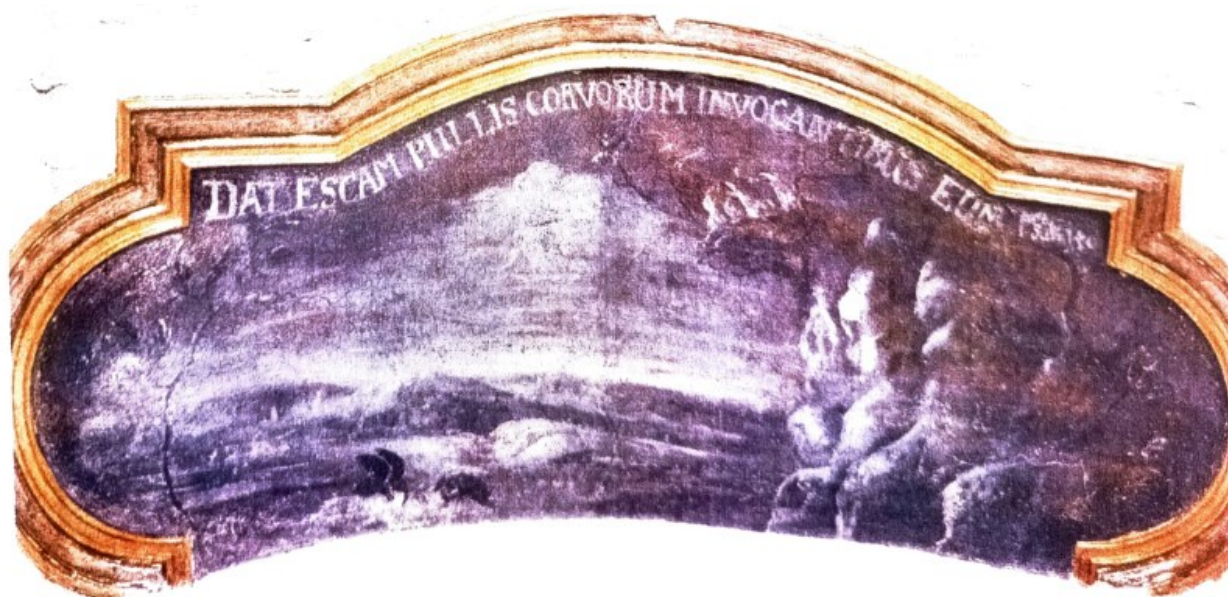
37. Darescam pullis corvorum invocantibus eum (Ž 140,9). Převzato z BERGER, Tomáš, FOLTÝN, Dušan, MADL, Martin a VÁPENKOVÁ, Eva. Technologická studie . 2010.