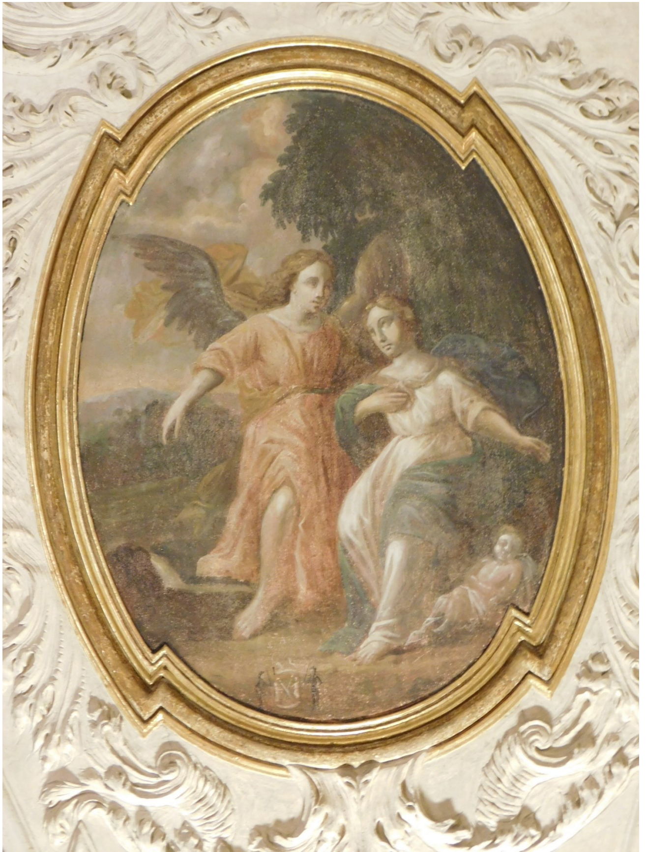
15. Hagar a Izmael