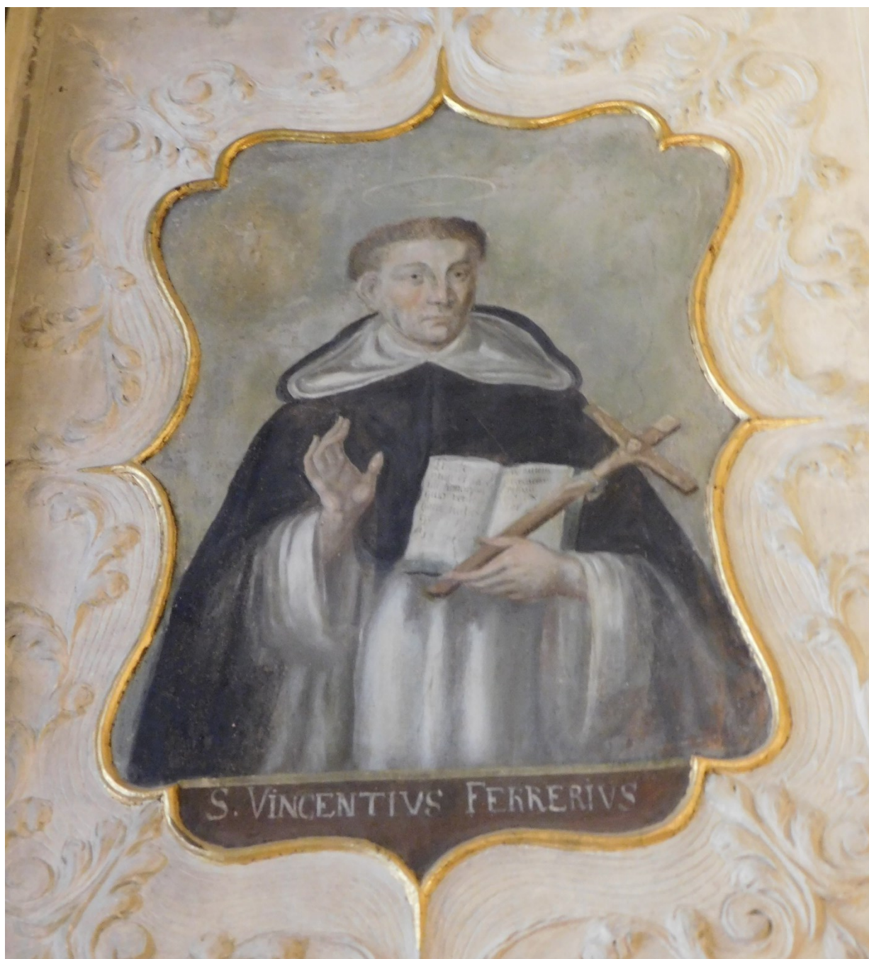
23. Sv. Vincenc Ferrerský