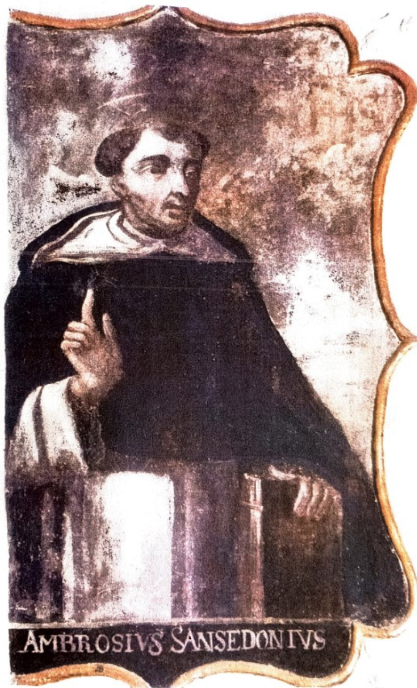
28. Bl. Ambrož Sienský. Převzato z BERGER, Tomáš, FOLTÝN, Dušan, MÁDL, Martin a VÁPENKOVÁ, Eva. Technologická studie . 2010.