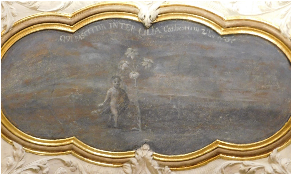
43. Qui pascitur inter lilia (Pis 2,16)