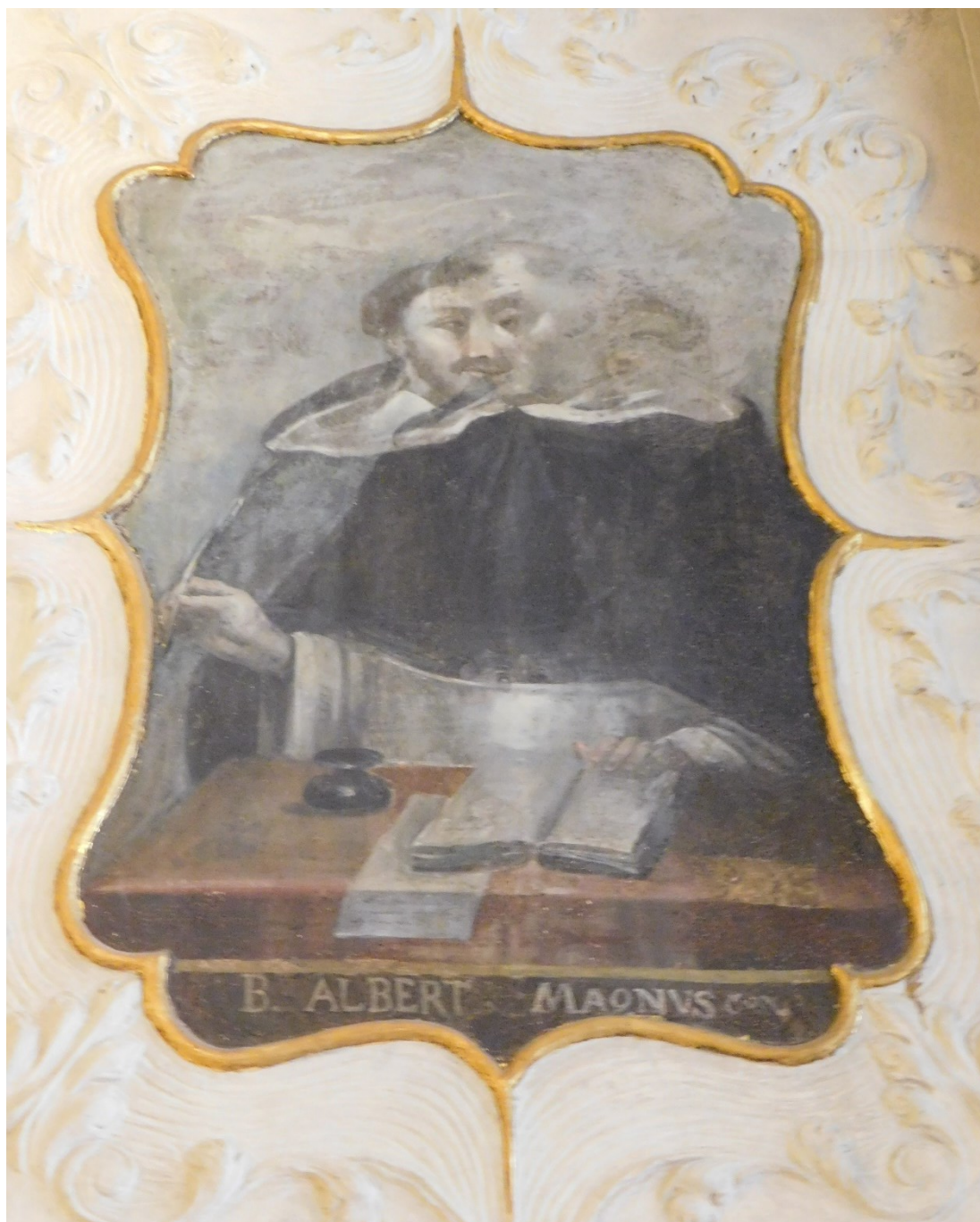
20. Bl. Albert Veliký