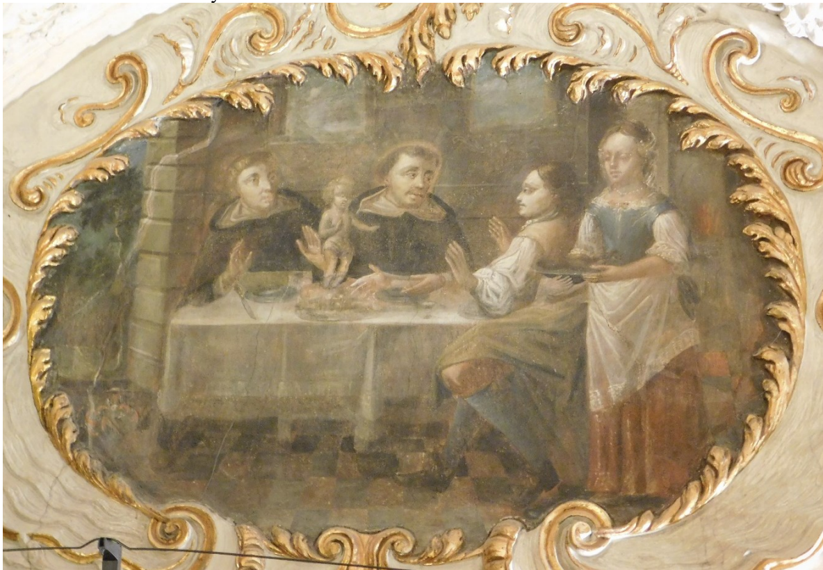
8. Zázračné vzkříšení dítěte sv. Dominikem v Châtillonu