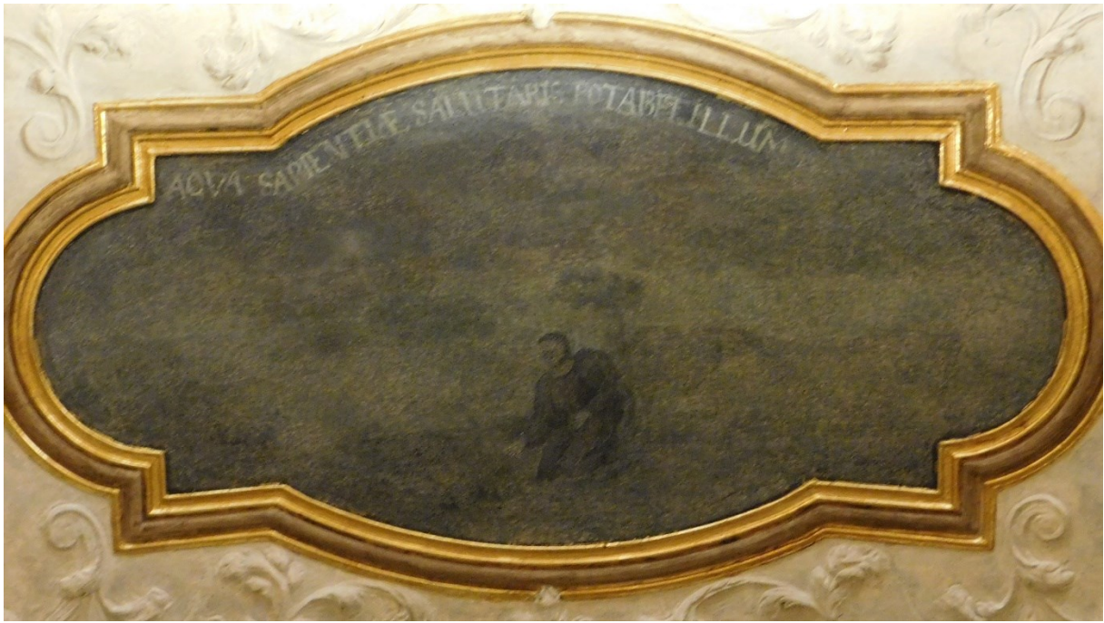
41. ... Aqua sapientiae salutaris potabit illum (Sir 15,3)