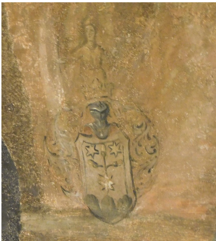
53. Detail znaku neznámého šlechtice(?), malba sv. Jiljí krmícího laň