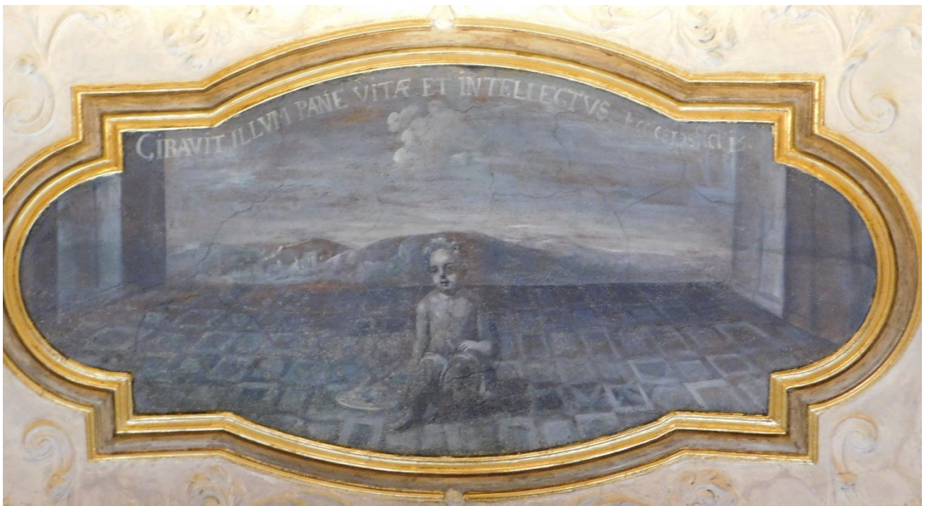
40. Cibavit illum pane vitae et intellectus... (Sir 15,3)