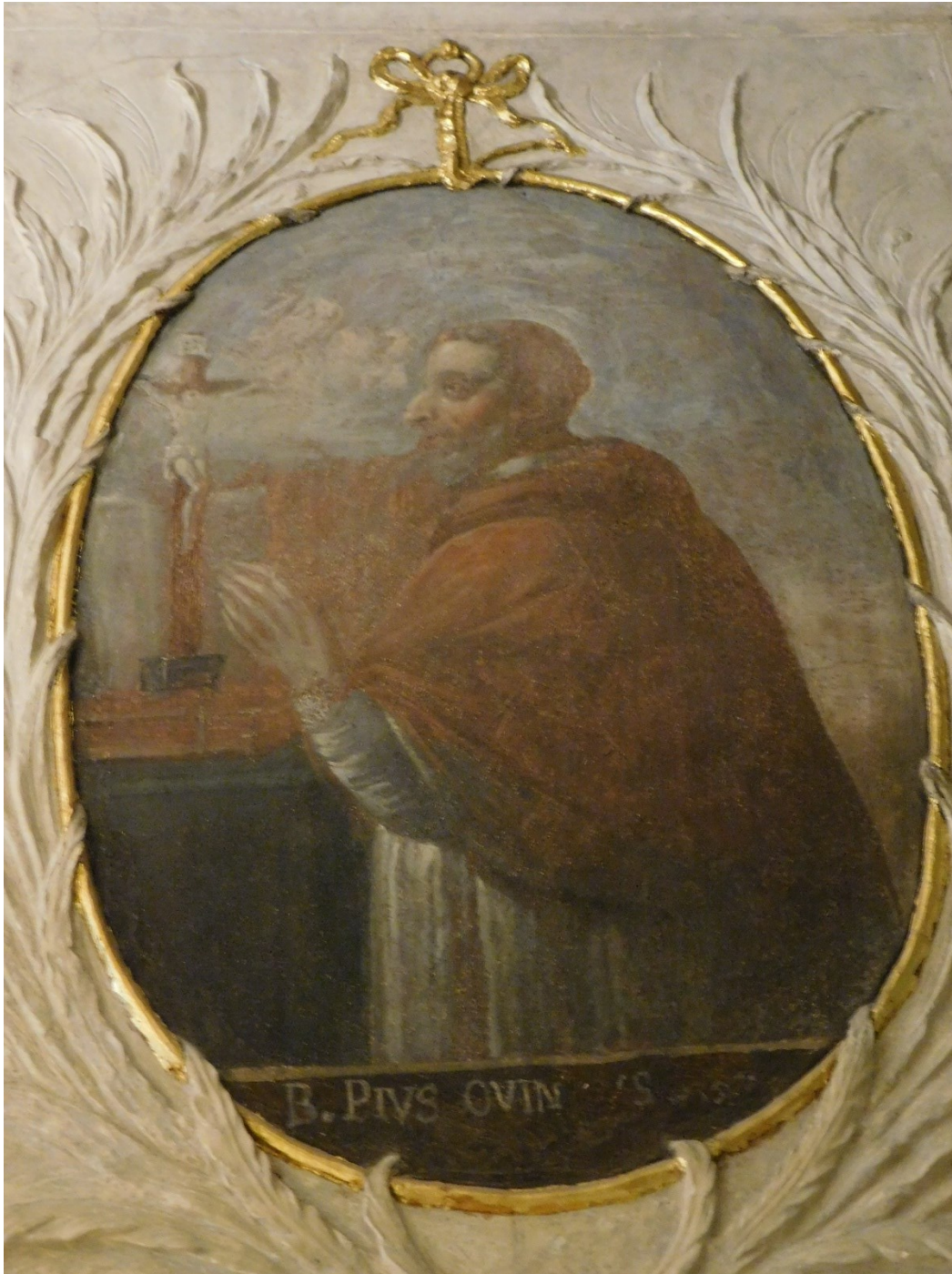
33. Bl. Pius V.