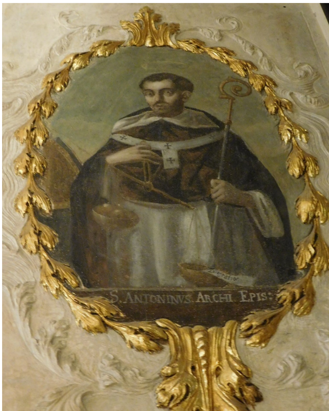
29. Sv. Antonín Florentský