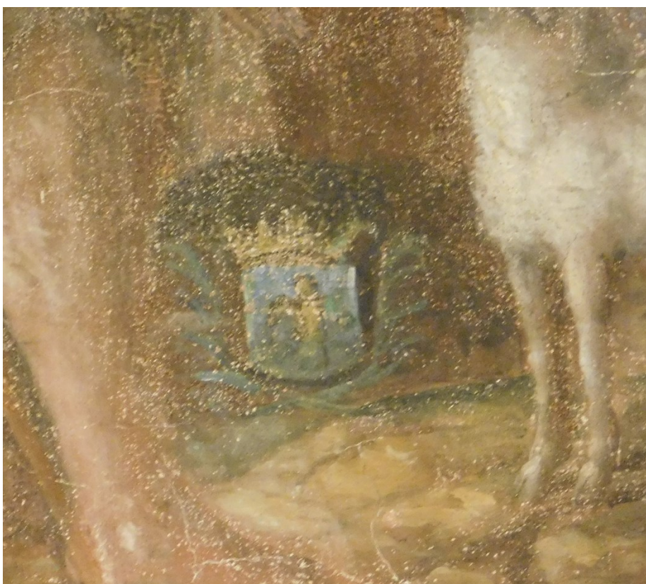
52. Detail znaku neznámého šlechtice(?), malba sv. Jana Křtitele