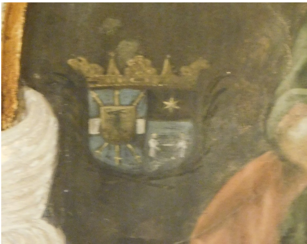
51. Detail aliančního znaku s erbem Nigroniho z Risenbachu