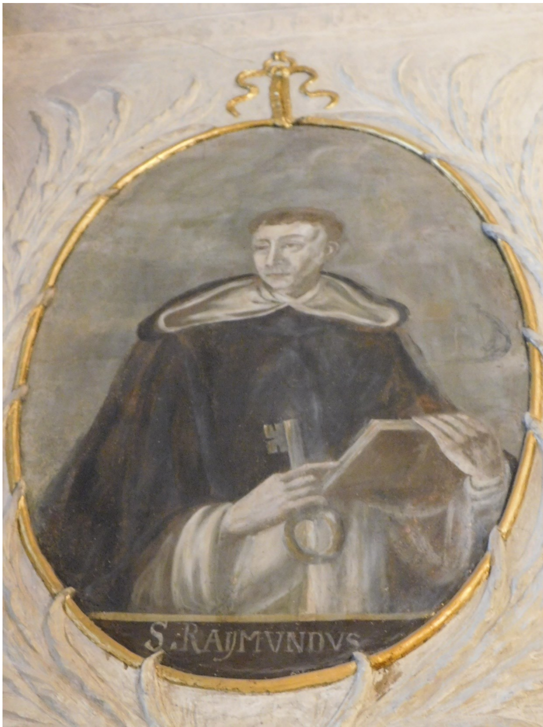
25. Sv. Rajmund z Peňafortu