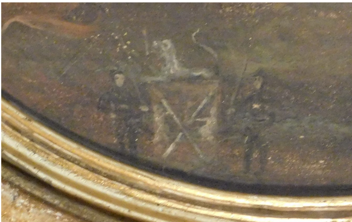
49. Detail znaku cechu mydlářů či voskařů