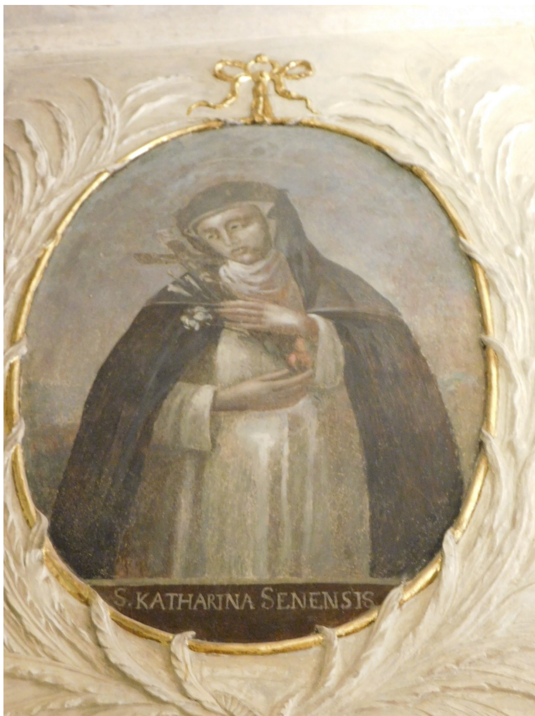
34. Sv. Kateřina Sienská