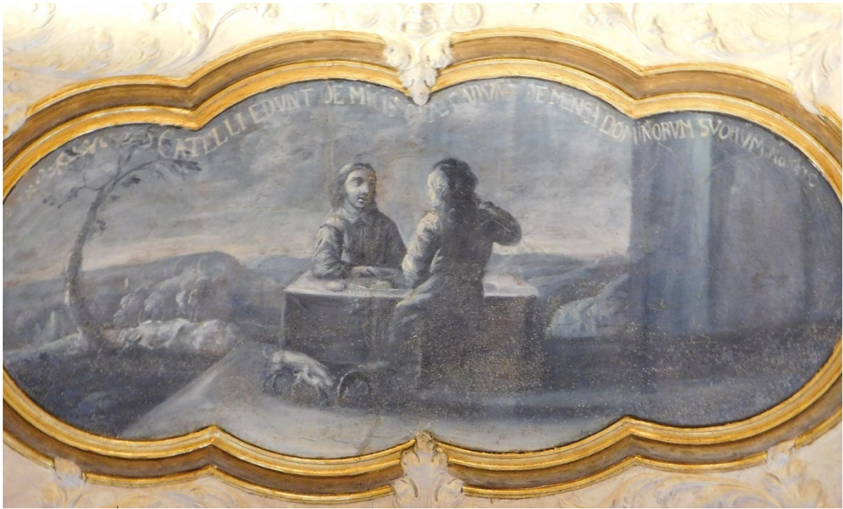
35. Catelli edunt de micis quae cadunt de mensa dominorum suorum (Mt 15,27)