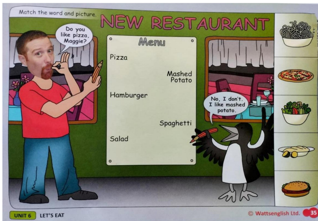
(Obr. 4 – v restauraci)