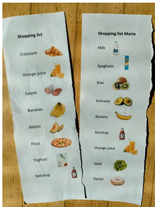
(Obr. 3 – nákupní seznamy)