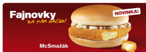
Příloha č. 1 (obrázek)