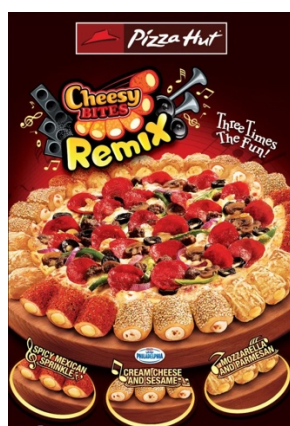
Příloha č. 6 (obrázek)

Fast Food Post. (n.d.). McDonald's Flavors of Japan Menu: The Ebi Burger and Teriyaki Samurai Burger. Retrieved June 31, 2024, from https://www.fastfoodpost.com/mcdonalds-flavors-of-japan-menu-the-ebi-burger-and-teriyaki-samurai-burger/