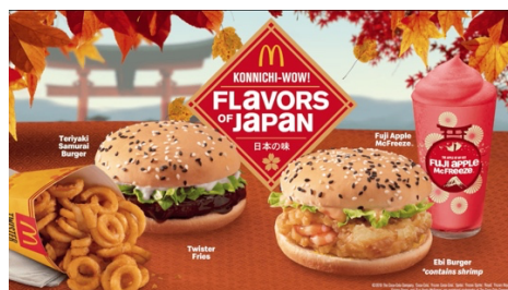
Příloha č. 5 (obrázek)

Fast Food Post. (n.d.). McDonald's Flavors of Japan Menu: The Ebi Burger and Teriyaki Samurai Burger. Retrieved June 31, 2024, from https://www.fastfoodpost.com/mcdonalds-flavors-of-japan-menu-the-ebi-burger-and-teriyaki-samurai-burger/