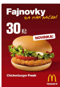
Příloha č. 2 (obrázek)