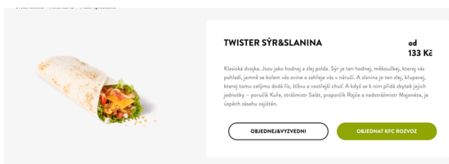
Příloha č. 3 (obrázek)

KFC. (n.d.). Twister. KFC Česká republika. Retrieved June 31, 2024, from https://kfc.cz/menu/twister-10000011#tady