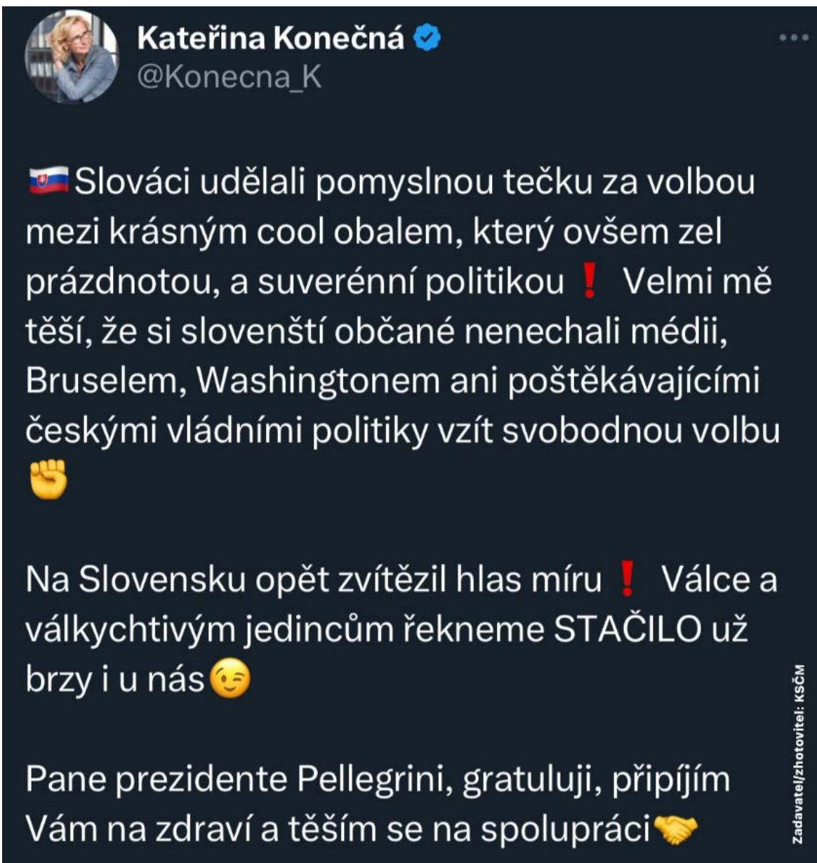
Obrázek č. 10