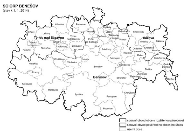
Obrázek č. 2: Mapa ORP (ČSÚ)

Řešené území leží v ORP Benešov, na hranici okresů Benešov a Příbram. Geograficky se jedná o pahorkatinu, zemědělskou oblast s množstvím okolních vesnic v blízkosti přírody. Benešov je vzdálen zhruba 15 km, dostupný autobusovou dopravou (20-25 minut, jízdné 25,-) nebo osobním automobilem (10-15 minut). Sídlo komunitního spolku, který zajišťuje sociálně-aktivizační program, je v části obce Zaječí, městyse Maršovice (necelých 800 obyvatel). V těsné blízkosti obec navazuje na Neveklov (cca 2800 obyvatel). 11