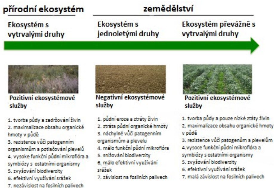
Obrázek 1.: Porovnání ekosystémových služeb ekosystému s jednoletými druhy a ekosystému s vytrvalými druhy (převzato od Crews et al., 2018).