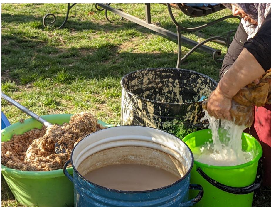
Obrázek 4. - Vpravo žena ždímá namletou naklíčenou pšenicí, která byla namočená ve vodě