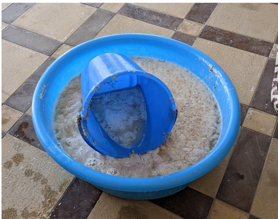
Obrázek 3. - Namletá naklíčená pšenice namočená ve vodě (pozn.: musí být namočená těsně před ždímáním a vařením, aby nezmysla a nezhořkla)