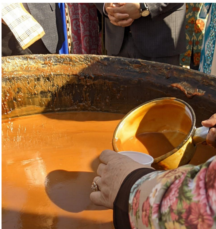
Obrázek 9. - Rozlévání sumalyaku do plastových kelímků pro všechny návštěvníky a zaměstnanci parku