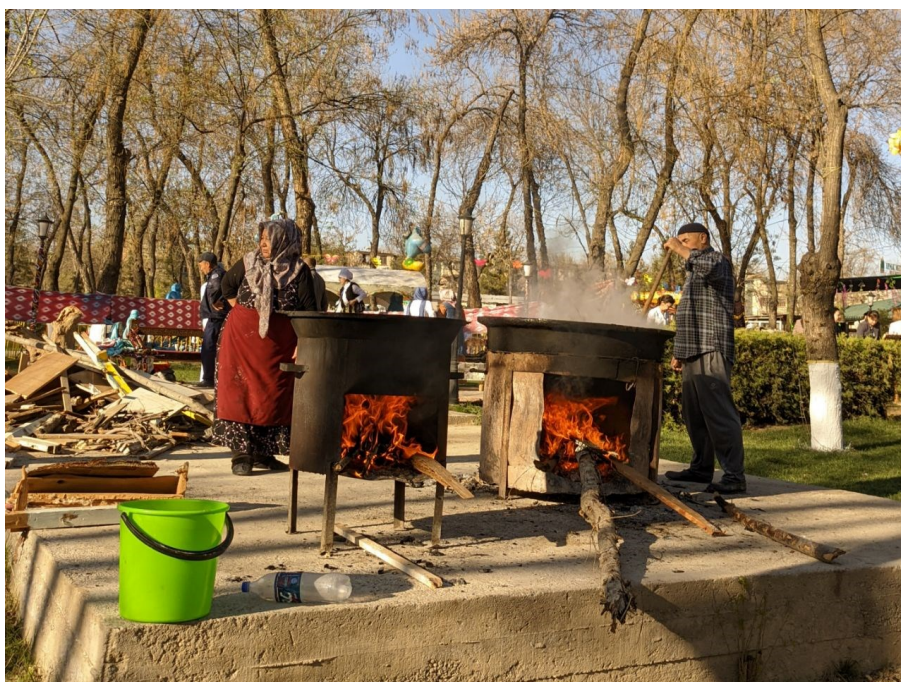
Obrázek 5. - Vlevo je sumalyakči (hlavní kuchařka), menší kotel na ohřívání vody z pšenice, kterou pak dají teplou do vroucího sumalyaku, vpravo je manžel kuchařky, pomáhá míchat sumalyak ve velkém kotli