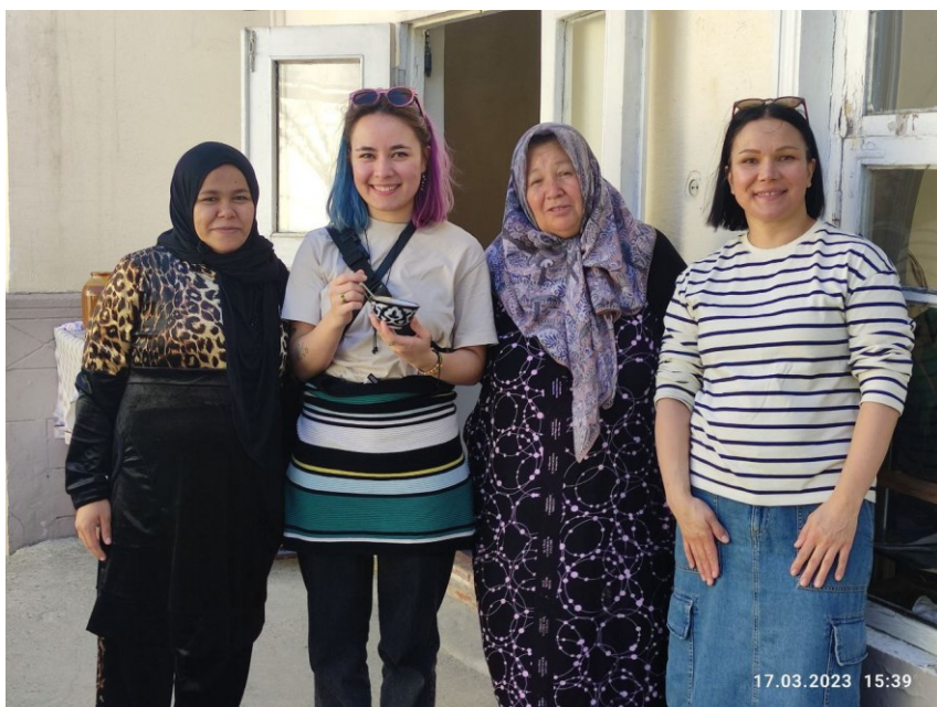
Obrázek 18. – Společná fotografie se sumalyakči v Taškentu, která pozvala mě a mé kolegy k sobě domů, ukázat, jak klíčí pšenice (zleva doprava: dcera sumalyakči , já, sumalyakči , moje kolegyně)