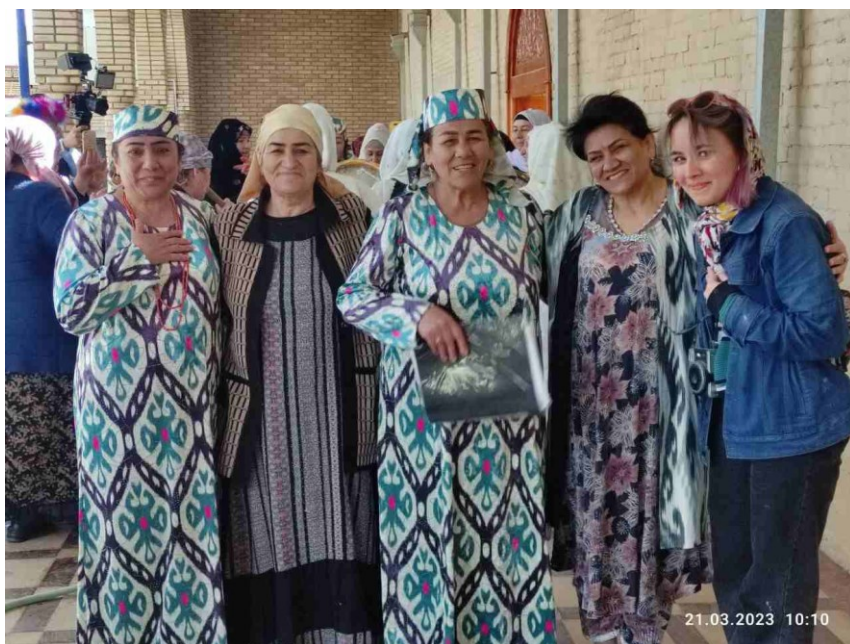
Obrázek 19. – Společná fotografie s ženami v tradičních kostýmech v Íránské vesnici v Samarkandu (druhá žena vlevo je sumalyakči )