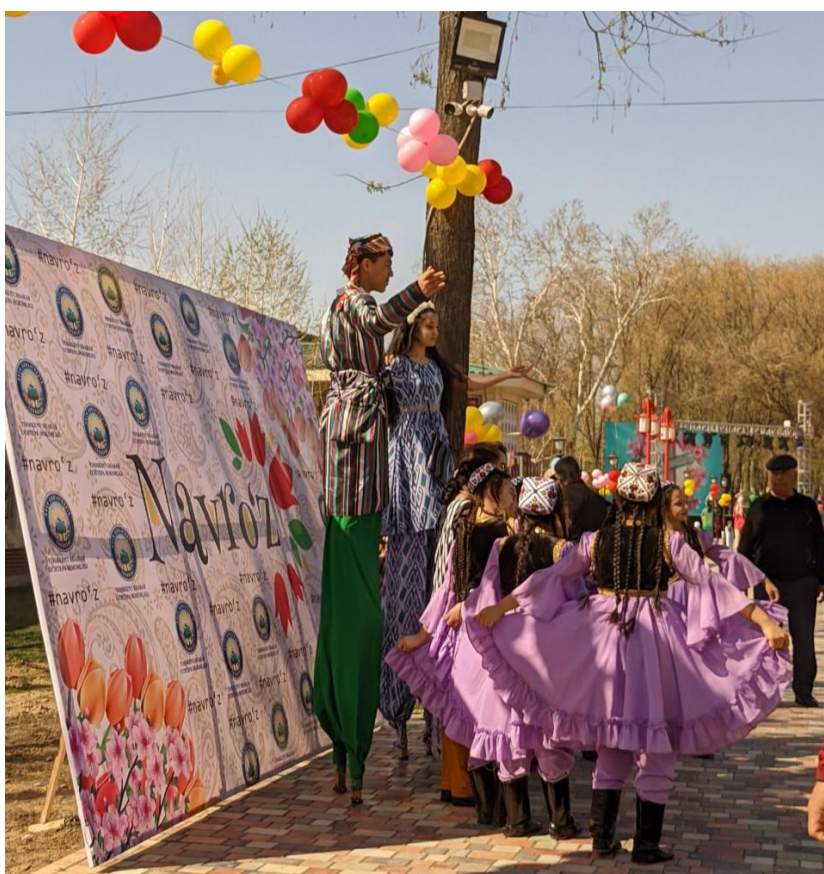
Obrázek 16. - Oslava Nowruzu v parku, sleva jsou muž a žena v tradičních kostýmech, stojí na velkých tyčích, na kterých se pohybují a předvádějí performance