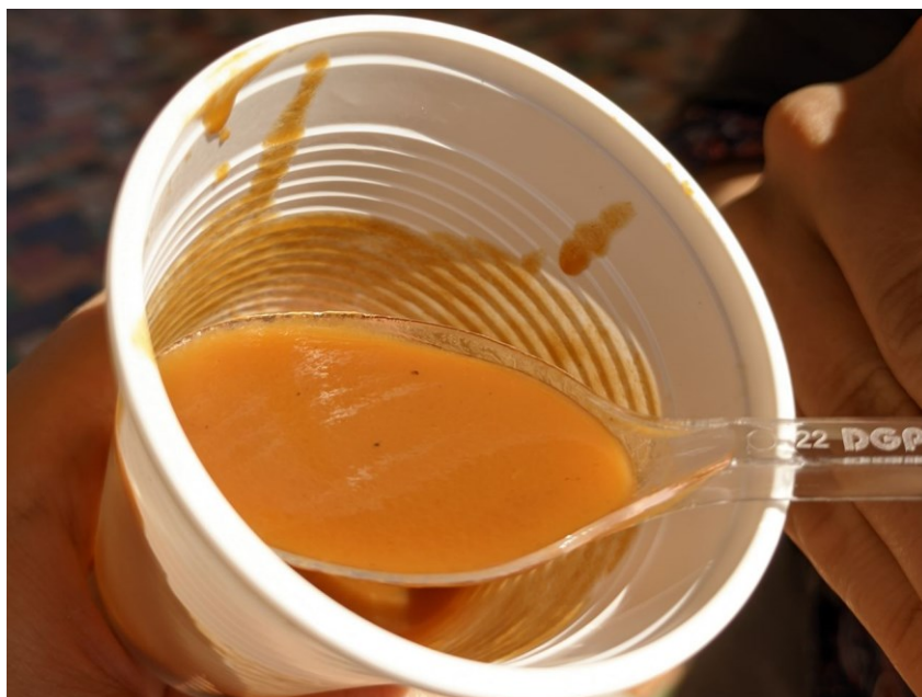
Obrázek 1. - Hotový sumalyak na veřejné oslavě Nowruzu v městském parku v Taškentu

Komentář: předložené fotografie byly pořízené mnou během terénního výjezdu v březnu 2023.