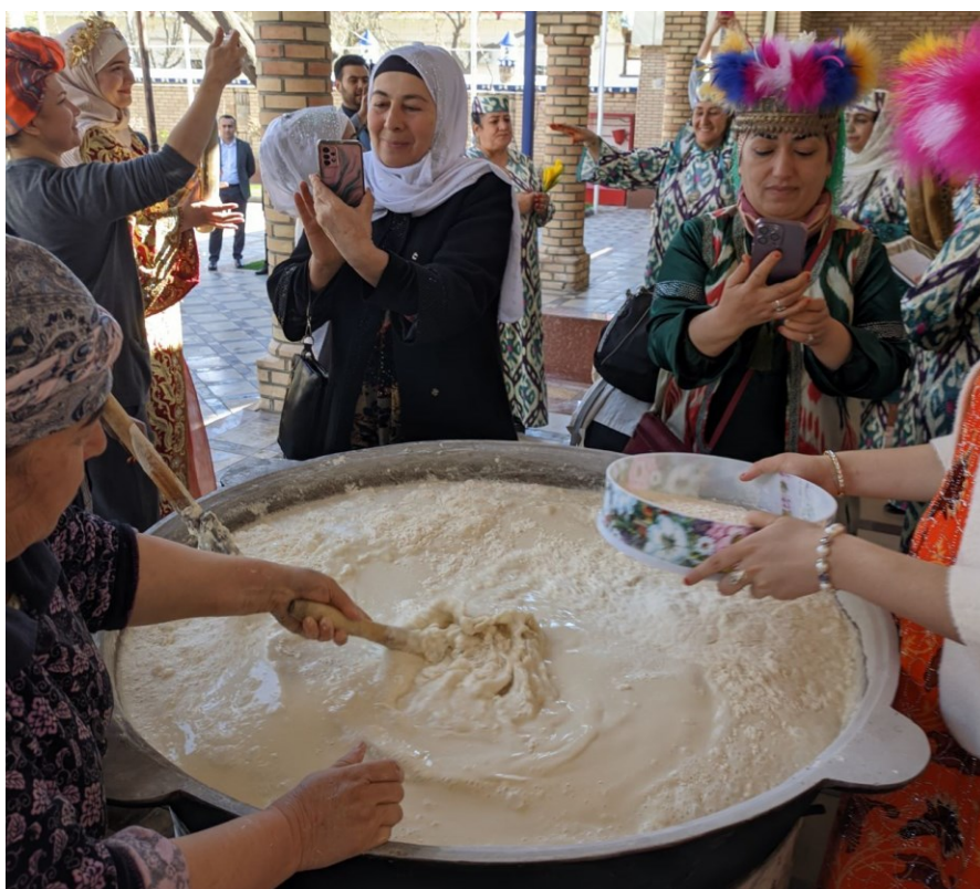
Obrázek 14. - Ženy prosévají mouku, aby nevznikly žmolky