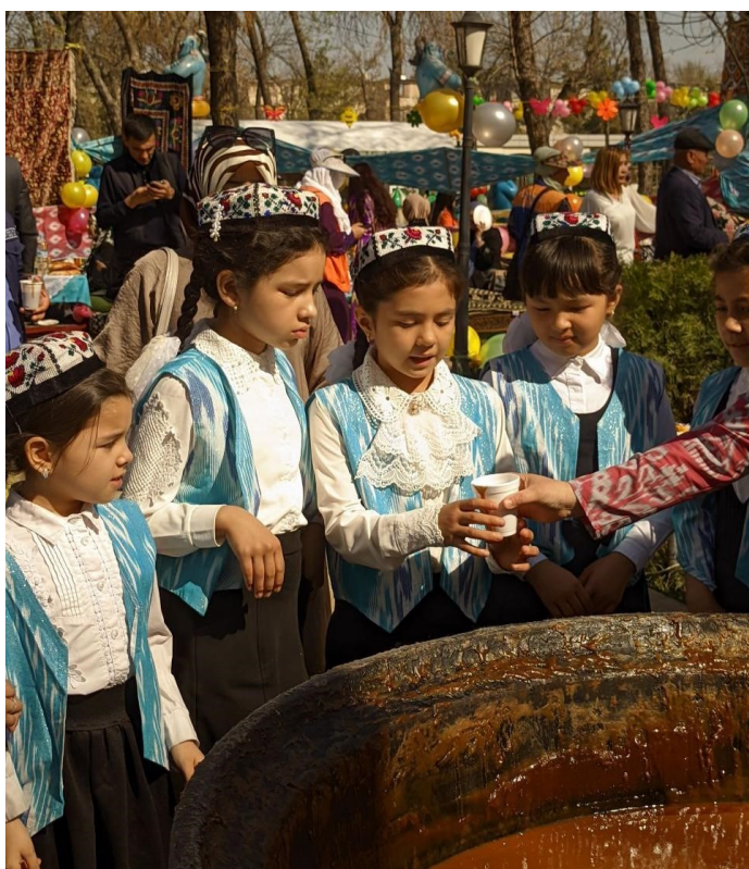
Obrázek 10. - Děti v kostýmech s tradičními vzory a tubětějkách (tradiční čepice) čekají na svojí porci sumalyaku