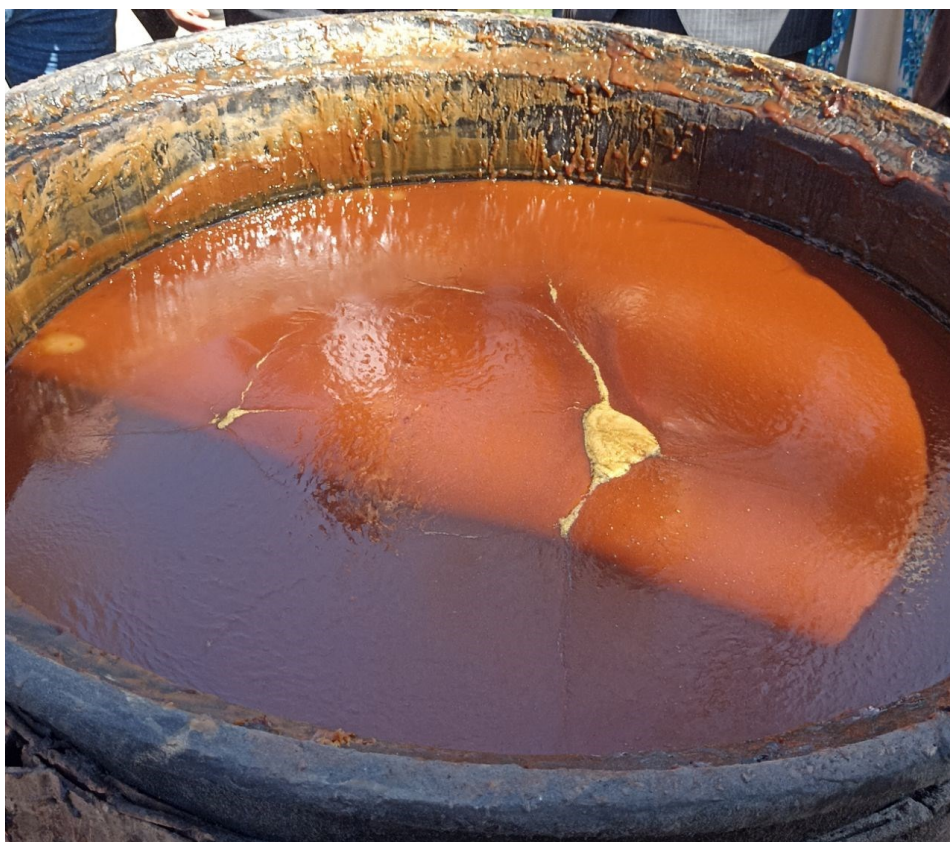
Obrázek 8. - Vzor na hotovém sumalyaku, podle kterého předpovídají, jak se bude dařit v budoucím roce