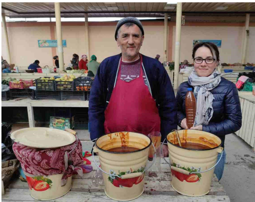
Obrázek 22. – Prodavač sumalyaku na ranním bazaru v Buchaře, který mi poskytl rozhovor