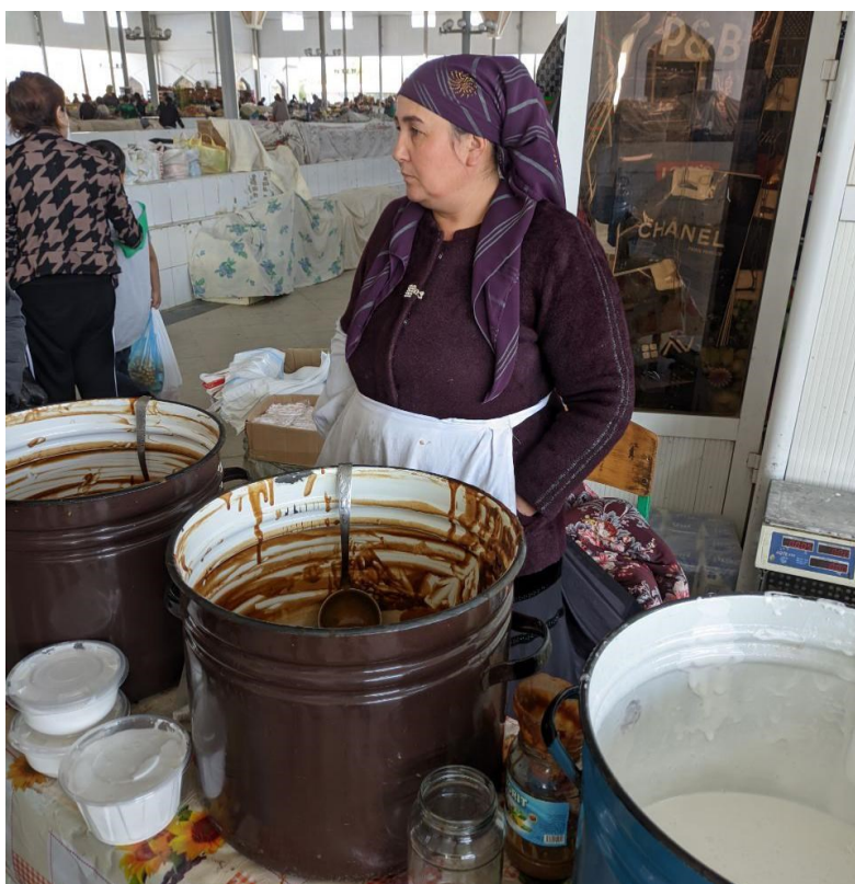
Obrázek 20. – Prodavačka sumalyaku na velkém bazaru v Buchaře