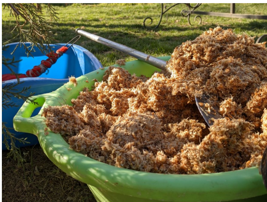
Obrázek 2. - Namletá naklíčená pšenice, před zamočením ve vodě a následným vyždímáním