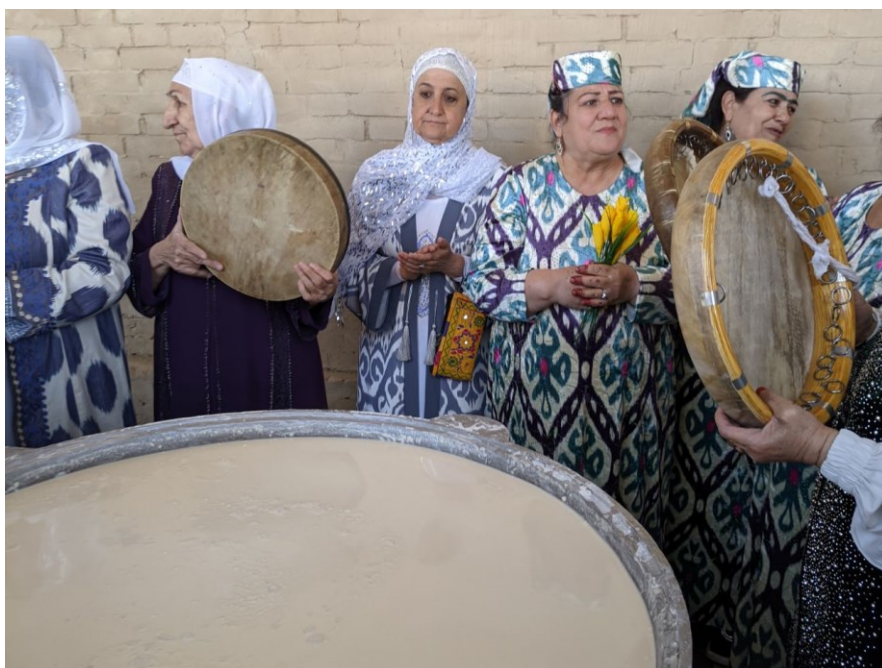
Obrázek 15. - Zpěvačky v tradičních šatech a s bubny