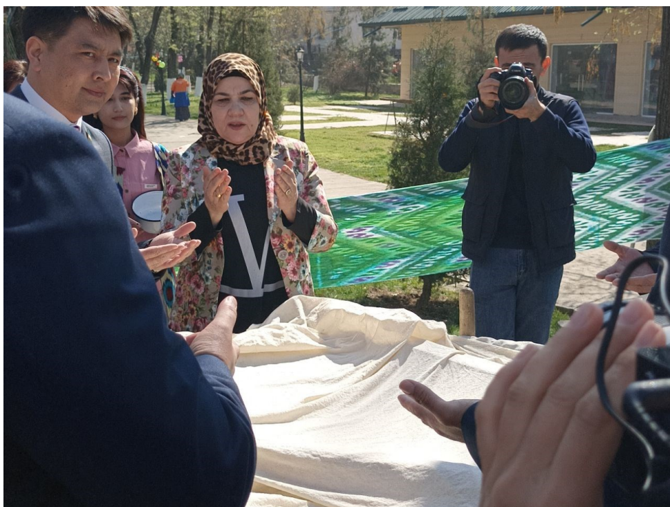
Obrázek 7. - Odříkávání modlitby před otvíráním sumalyaku