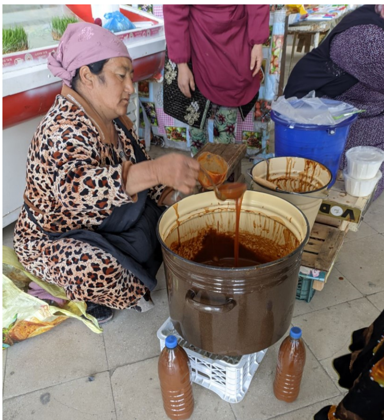
Obrázek 21. – Prodavačka sumalyaku na velkém bazaru v Buchaře, která mi poskytla podrobný rozhovor