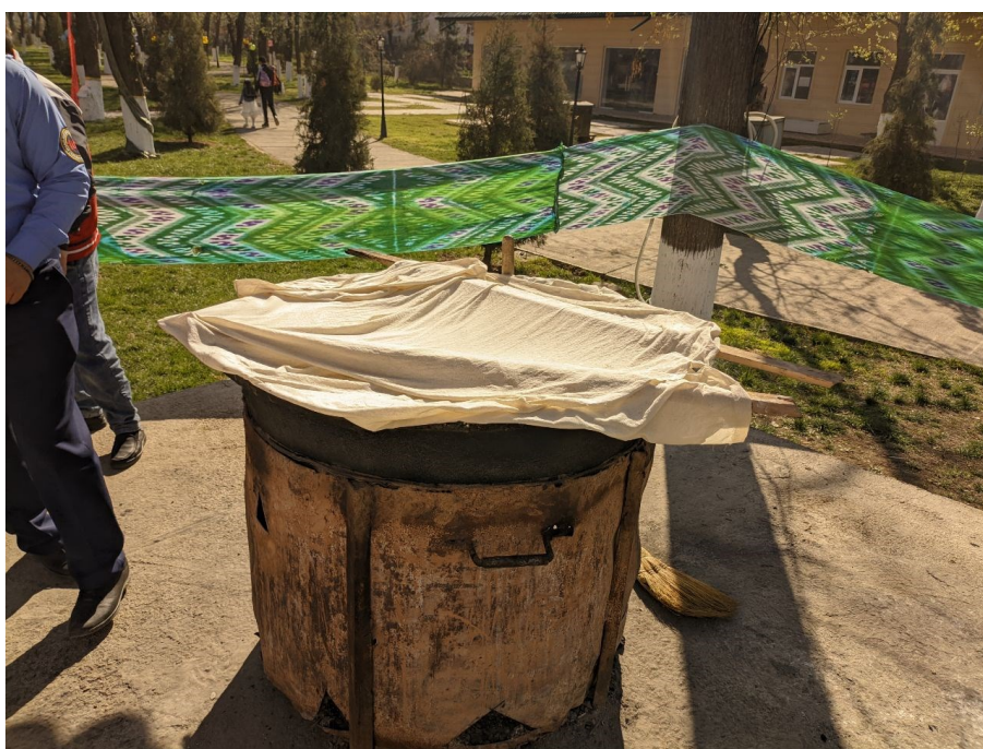
Obrázek 6. - Přes noc sumalyak nechávají takto pokrytý plachtou a zhasínají oheň pod kotlem, tyče drží plachtu, aby nespadla do sumalyaku