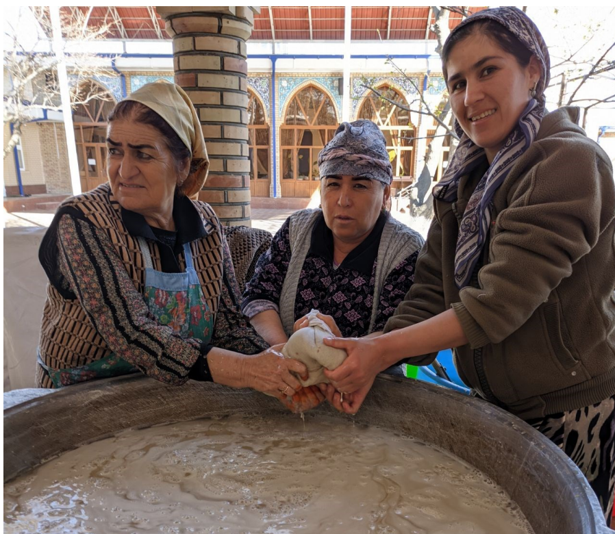
Obrázek 13. - Ženy v íránské vesnici v Samarkandu ždímají šťávu z naklíčené pšenice rovnou do kotle