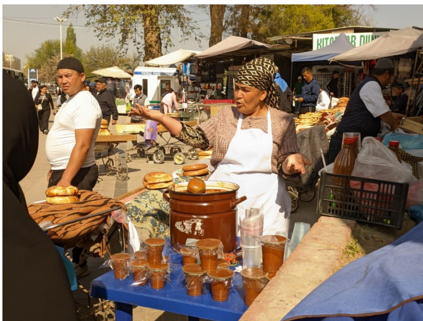
Obrázek 23. – Prodavačka sumalyaku v Taškentu před velkým bazarem