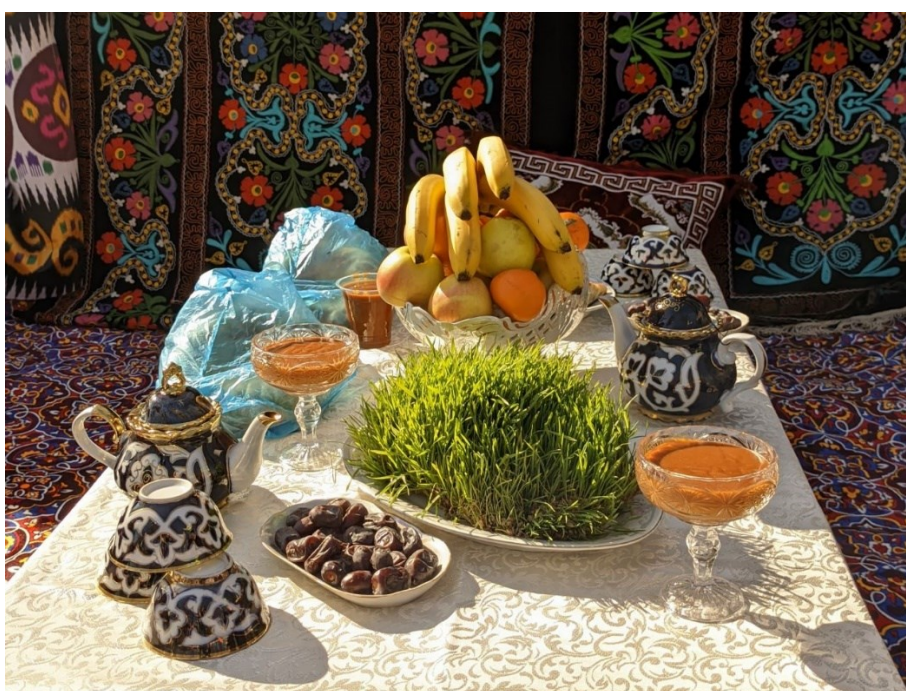
Obrázek 12. - Tradiční úprava stolu: naklíčená pšenice, sumalyak, čaj, ovoce, v modrých igelitových sáčcích je chléb a pečivo