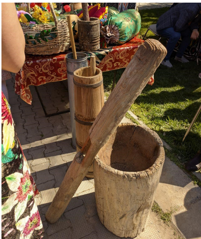
Obrázek 17. - Mlýnek na pšenici, který se používal do té doby, než začali používat mechanický mlýnek na maso