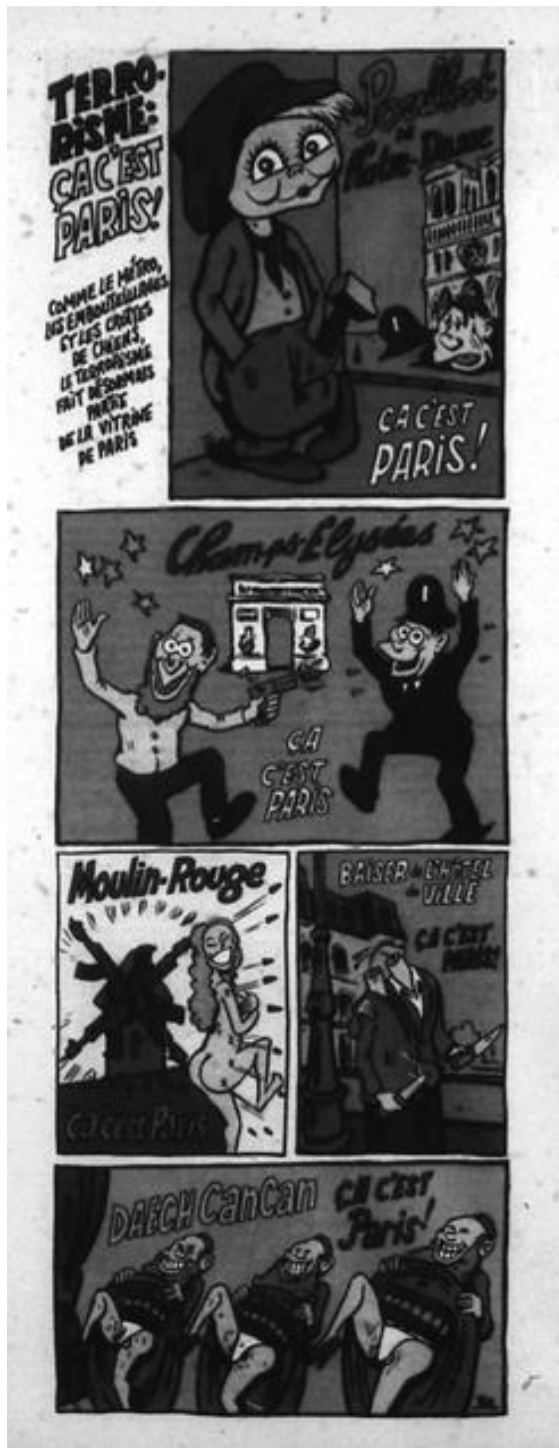
Obrázek číslo 4: Karikatura Charlie Hebdo , 1.6. 2017, č. 1299

Série karikatur byla vydána v čísle 1299 14. června 2017. Autor není uveden. Jednotlivé kresby odkazují na specifický kontext spojený s islámským terorismem. Konkrétně se jedná o útok na policejní hlídku před katedrálou Notre-Dame v Paříži ze 7. června 2017. Útočník,