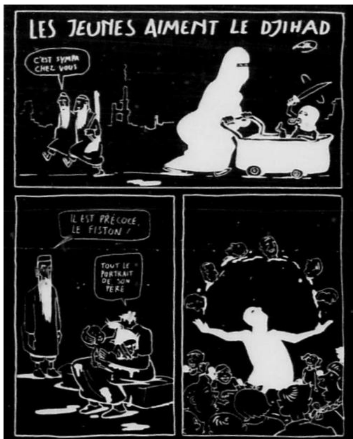
Obrázek číslo 2: Karikatura Charlie Hebdo , 7.1. 2015, č. 1177