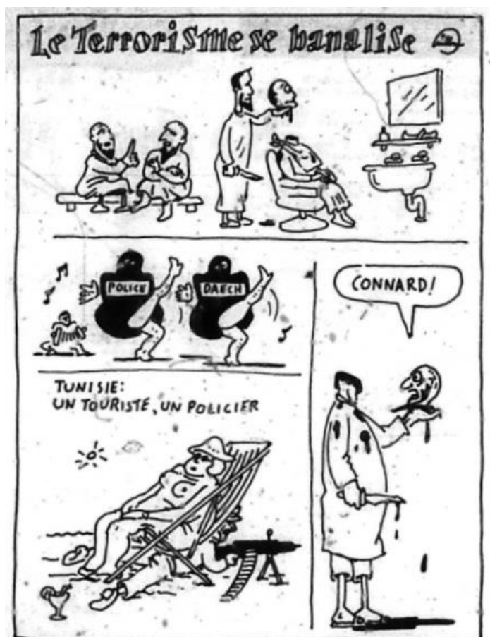
Obrázek číslo 3: Karikatura Charlie Hebdo , 1.7. 2015, č. 1197