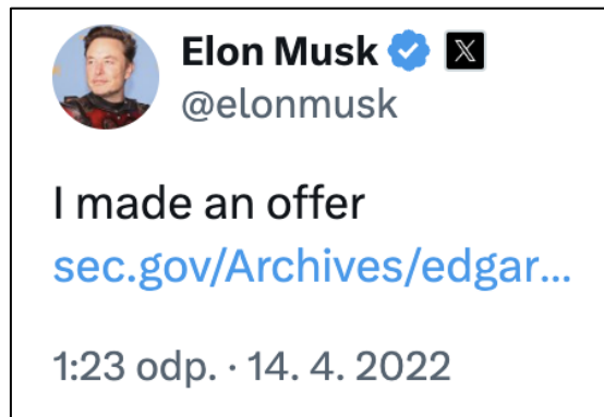
Obr. 2: Elon Musk oznámil nabídku ke koupi Twitteru prostřednictvím tweetu (Musk, 2022b).

Tato zpráva přitáhla značnou mediální pozornost a spustila debaty o budoucnosti platformy a Muskově možném vlivu na moderaci obsahu. Ve zprávě věnované předsednictví Twitteru se Musk ke svobodě projevu vyjádřil následovně: „Investoval jsem do Twitteru, protože věřím v jeho potenciál stát se platformou pro svobodu projevu na celém světě a věřím, že svoboda projevu je společenskou nutností pro fungující demokracii.“ (Abbruzzese & Ingram, 2022), přičemž sám sebe začal označovat za „absolutistu svobody projevu“ (Milmo, 2022). Ještě před dokončením akvizice však sám uváděl, že nemá odpovědi na všechny otázky týkající se jeho plánů, a přiznal, že to nebude jednoduché (Pawson, 2022). Za důležitý úkol považuje především vytvoření „veřejné platformy, která je maximálně důvěryhodná a široce inkluzivní“ (Ingram, 2022). Vedení Twitteru zpočátku nepodporovalo Muskův záměr odkoupit společnost a pokusilo se nabídku zrušit, nakonec však byla přijata dne 25. 4. 2022 (Abbruzzese & Wile, 2022).