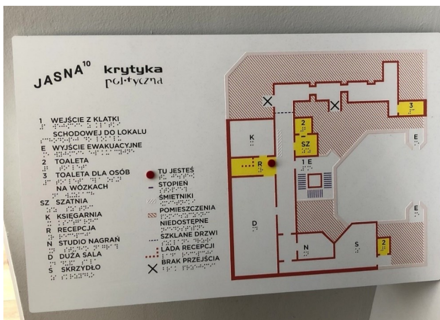
Obrázek 6: Mapa sídla KP.

Kromě redakčních prostorů deníku najdeme i další oddělení organizace, např. tiskové nebo finanční oddělení, sociální síť, nakladatelství, ale i velkou kuchyň (nikoliv kuchyňku), menší pokoj pro různé kurzy či semináře, která trochu připomíná dětskou hernu a též velký sál, kde se konají diskuze či přednášky. Každé z uvedených oddělení má svou vlastní místnost viz Obrázek 6. Kromě toho zde můžeme najít také prostornou šatnu, malé, ale moderní nahrávací studio na podcasty nebo poradní místnost se stolem alespoň pro 10 lidí, kterou obklopují také knihovny – kromě produkce KP jsou v nich ale zastoupeny i zásadní levicové publikace, ovšem také knihy dotýkající se témat historie, sociologie a dalších společenskovedních či humanitních oborů.