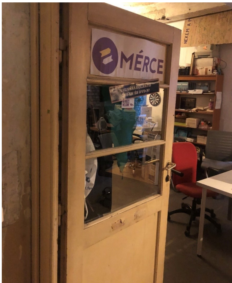
Obrázek 1: Vstup do redakce MÉRCE.