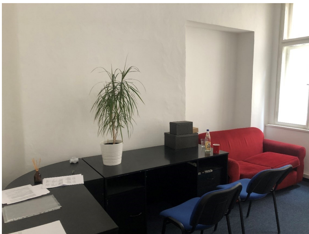
Obrázek 9: Pusté redakční stoly Deníku Alarm.

Redakce na mě působí jako běžná, od devadesátých let netknutá kancelář, do které se firma zrovna přistěhovala. V poslední části věty nejsem daleko od pravdy, Deník Alarm zde sídlí teprve od podzimu. Je to vidět i na nezařízenosti – až na pár dekorací, které si ještě nenašly své místo a jsou pouze opřené o zed', jsou stěny holé, a kromě nadměrného počtu pracovních stolů, sedaček, židlí, pár knihoven a květin prostor působí stále celkem prázdně. Médium na pohled nestrádá, ale rozhodně ani nemá peněz nazbyt.