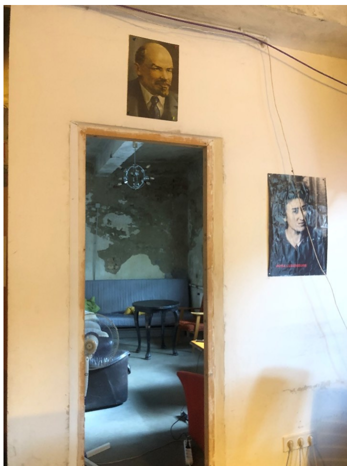
Obrázek 2: Tváře levice a průzor do „meeting room“.

Místnost má do sebe navíc zakomponovaný jeden další pokoj – tento „meeting room“, jak mi jej popsal šéfredaktor, je plný židliček a křesel. „Plný“ však může evokovat větší velikost místnosti a velké množství nábytku, ale ve skutečnosti se jedná o opravdu malou místnost, ve které jsou asi dvě křesla, stoleček, gauč a tři židle. Dále můžeme na stěnách zpozorovat několik plakátů na velmi známé levicové tváře, jakými byla např. Rosa Luxemburg nebo Vladimir Lenin, viz Obrázek 2.