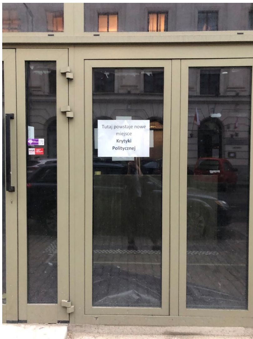
Obrázek 4: Jistota, že jsem správně.