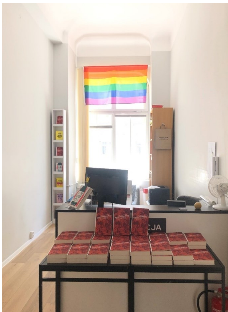
Obrázek 5: Recepce a první pohled do sídla KP.