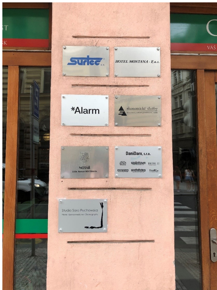
Obrázek 8: Nová identita, nová plaketa.

Deník Alarm má díky své nové identitě i zbrusu novou plaketu, která se mezi ostatními firemními štítky nejvíce leskne, a můžeme si tak být jistí, že jsme zde správně, viz Obrázek 8.