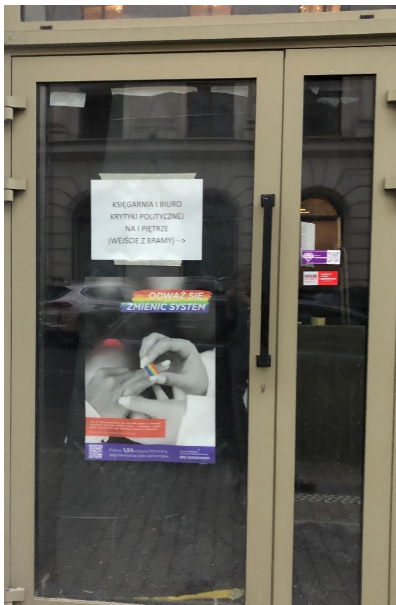
Obrázek 3: První znamení blízkosti KP.