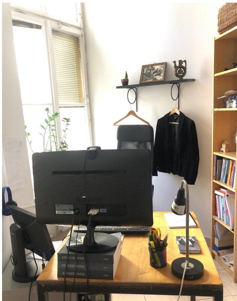
Obrázek 13: Místo šéfredaktorky v KP.