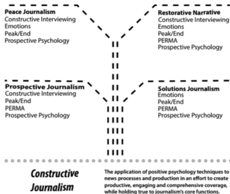
Schéma 1: členění konstruktivní žurnalistiky