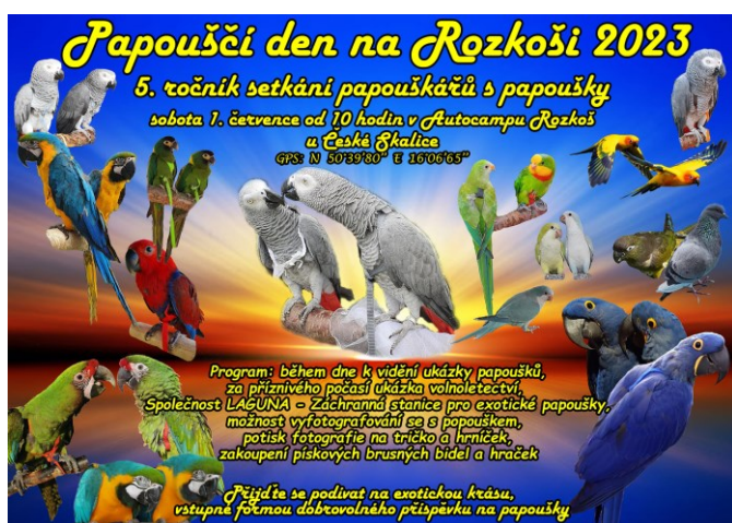
Obrázek 4: Papouščí den na Rozkoši.

odvozen od schopnosti sestavit harmonizující páry a realizovat odchovy v co nejvíce autentickém prostředí, což se zcela vylučuje s možnostmi, ale i úmysly většiny zájmových chovatelů, kteří chtějí opeřeného mazlíčka. Můžeme tedy říct, že v tomto segmentu jsou zastoupeny dvě zcela odlišné skupiny – dva obory chovatelství papoušků, které jsou na sobě sice závislé (chovatelé prodávají zájmovým chovatelům papoušky na mazlíčky), ale netvoří koherentní skupinu. Zájmoví chovatelé pořádají několikrát do roka neformální srazy s papoušky na kšírech a na ramenou, zatímco profesionální chovatelé výstavy, případně burzy s papoušky pro sestavení geneticky nejvhodnějších párů. K uvození tohoto rozdílného pojetí komunitního života mohou posloužit i plakáty na dvě akce se zaměřením na papoušky.