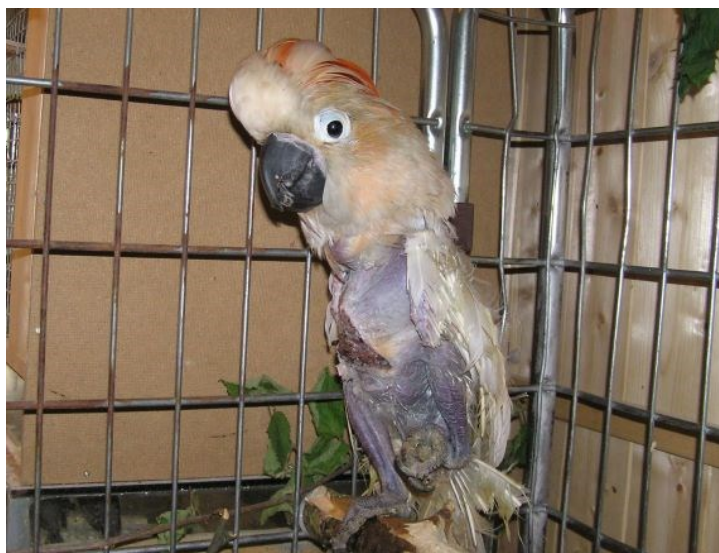
Obrázek 1: Kakadu molucký – stav v důsledku špatné péče.

desítek tisíc pořídit kakadu bílého, který se dožívá 60-80 let, nebo aru araraunu s rozpětím křídel přes metr a chovat je v kleci v panelákovém bytě. Majitelé si často neuvědomují sociální komplexnost a životní potřeby chovaných ptáků. Nežádá končí takové případy fyzickými, ale i psychickými obtížemi papoušků a za určitých nepříznivých okolností i předčasným úhynem. V případě nechtěných psů nebo nevhodných podmínek jejich chovu existuje záchranná síť v podobě psích útulků, u papoušků je situace podstatně komplikovanější. Není možné měnit u těchto vysoce inteligentních tvorů nahodile majitele, a už vůbec ne v případě, že trpí fyzickým nebo psychickým hendikepem. Naštěstí existují organizace, které se snaží pomoci těmto ptákům v nouzi. V takovém případě mluvíme spíše o záchranné stanici než o útulku. V našem prostředí se nejvýraznějších úspěchů těší Společnost Laguna, která se od roku 2000 snaží pomáhat papouškům v nouzi a zajistit jim odpovídající podmínky, což ve většině případů představuje kontinuální odbornou péči na několik desítek let.