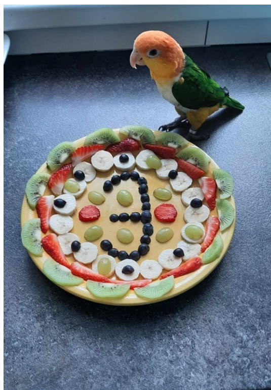
Obrázek 6: Narozeninový „dort“ amazónka bělobřichého. Zdroj: Papoušci, papoušci a zase papoušci.

Komunitní původ vazby fids podporuje i zjištění, že všichni respondenti, kteří jsou zároveň členy zájmových komunit, se shodují na tom, že příspěvky jiných členů pro ně představují důležitý zdroj inspirace pro vlastní chovatelské návyky. „Často mě zajímá, jak to mají zařízený jiný lidi, jaký dávají do klece hračky a z čeho si je třeba sami doma dokážou vyrobit.“ 20 K tomu lze přidat i výrok respondenta E. o počátku připomínání výročí vyklubání u chovaného papouška: „Viděl jsem kdysi pár příspěvků, jak lidi dělají pro své papoušky takový jakoby dorty ze zeleniny, ovoce a různých věcí co se dá třeba najít v lese. Tak nás napadlo, že bychom mu něco takového taky udělali.“ 21