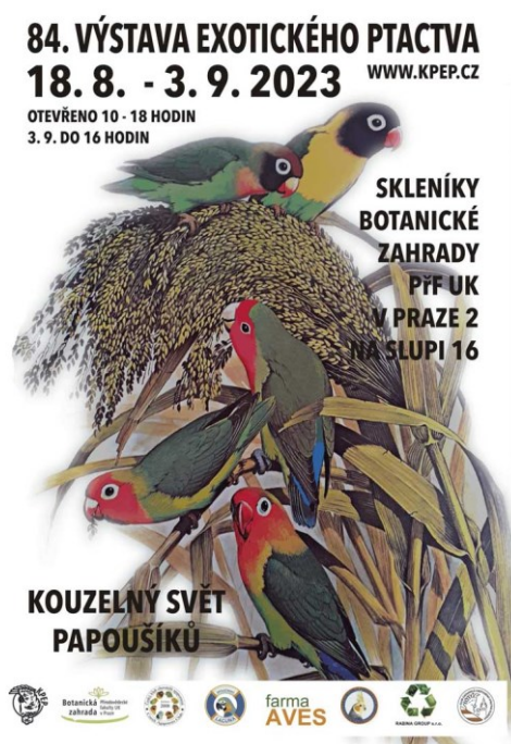
Obrázek 5: 84. Výstava exotického ptactva.

První plakát představuje pozvánku na událost spolku Papoušci v akci, který sdružuje zájmové chovatele v Královéhradeckém kraji. Druhý je pak upoutávkou na velmi ceněnou výstavu exotického ptactva, kterou každoročně pořádá Klub přátel exotického ptactva, nejstarší spolek u nás, zabývající se touto tematikou. Z vizuální stránky obou poutačů je zřejmé, že „opeřené děti“ se vyskytují spíše u první skupiny sdružující zájmové chovatele papoušků jako domácích mazlíčků. Cílem této pasáže je hlavně demonstrovat