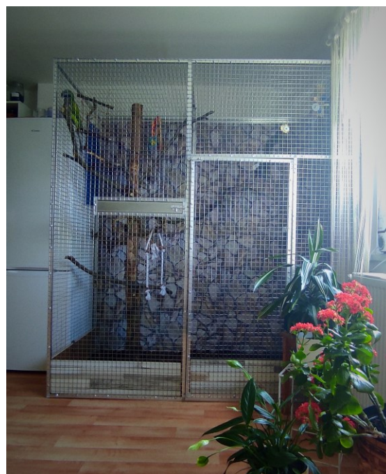
Obrázek 3: Bytová voliéra.

I s ohledem na změnu postoje a přístupu k chovu papouška bych se i nadále označil za zájmového chovatele, tedy „mazlíčkáře“. Stále pro mě vlastnictví papoušků představuje důležitou součást vlastní identity a jejich infantilizaci (s určitými hranicemi) vnímám jako součást snahy o zajištění co nejlepšího welfaru a jejich sociálního vyžití.