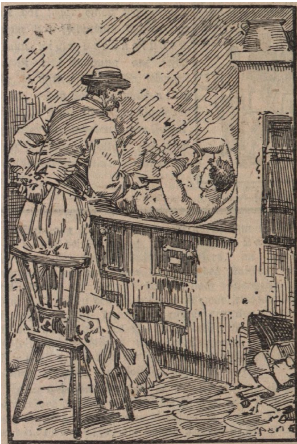
Obrázok 2: – Vyháňanie diabla z chlapca pomocou žeravého železa. Illustrierte Kronen Zeitung, Eine "Teufelsaustreibung" mit tragischem Ausgang , 8. 4. 1909, s. 7.

Ako sme videli pri prípade vo Wemdingu a časopise Jörgel Briefe, noviny neváhali uverejniť o posadnutí aj výsmešné a satirické články. Tento výsmešný tón nebol samoúčelný. Výsmech predstavoval formu odsúdenia poverčivosti a zatemnenosti. Celú udalosť mohol výsmech bagatelizovať alebo naopak ešte viac podrtnúť nezmyselnosť (z pohľadu autora)