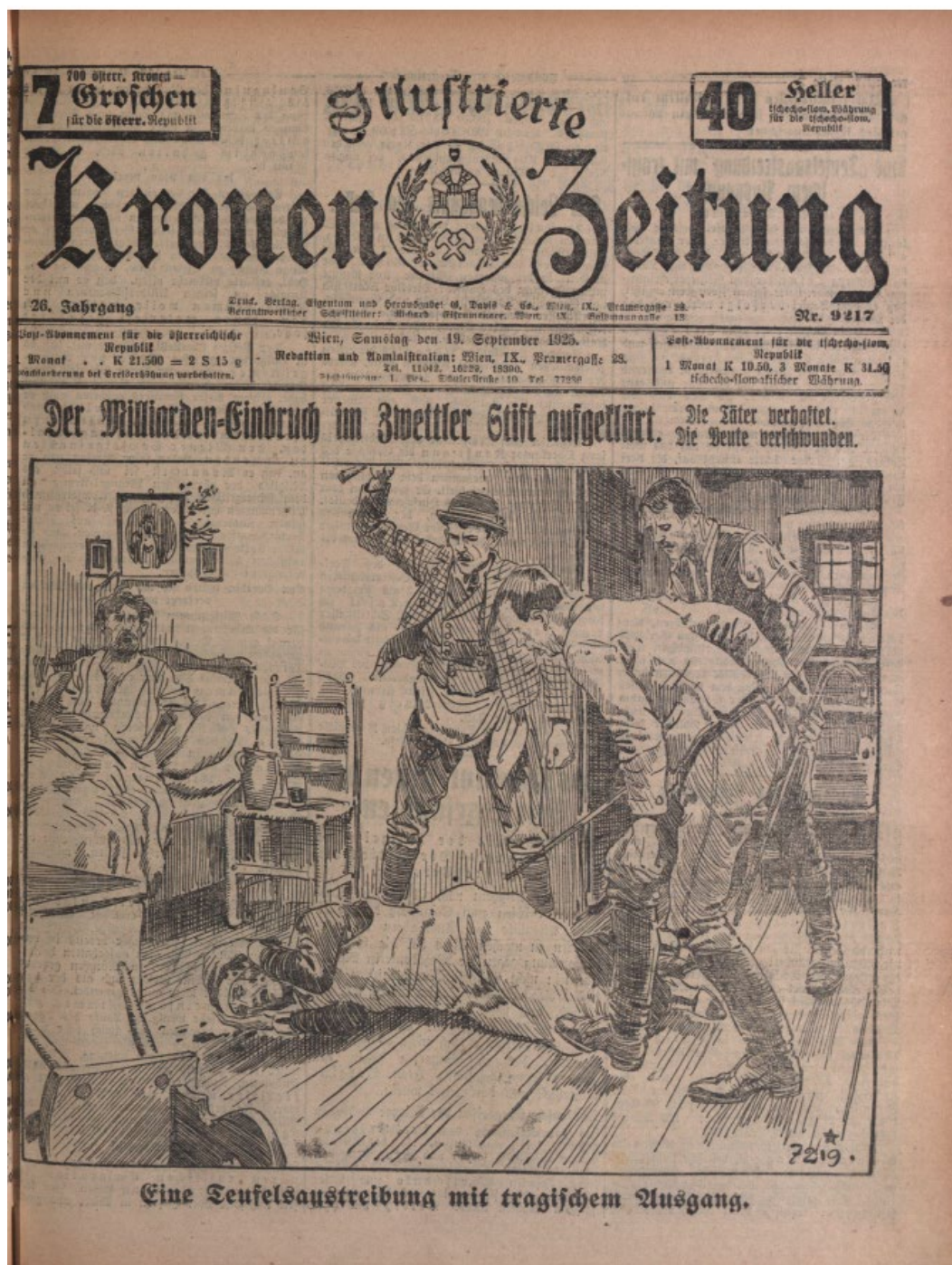
Obrázok 3: Illustrierte Kronen Zeitung, Eine Teufelsaustreibung mit tragischem Ausgang, 19. 9. 1925, s. 1.

Publikovanie obrázkov zobrazujúcich vyhánanie diabla nebolo v analyzovaných článkoch bežnou praxou. Zaznamenali sme dva takéto prípady, oba v Illustrierte Kronen Zeitung (prvý prípad z 1909 z dediny Bágas uvedený vyššie).