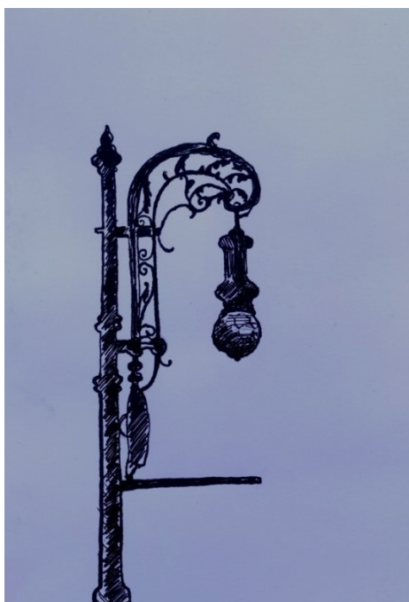
Obrázek 11 – Lampa, peroskresba

Jedna z pouličních lamp lemující chodník směrem od Karlova mostu k náměstí J. Palacha.