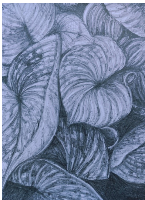
Obrázek 10 - Rostliny u Žofína, kresba tužkou

Pohled na část mostu Legií a postředí Střeleckého ostrova.