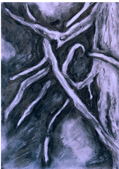
Obrázek 13 – Kořeny, uhl

Kompozice kořenů stromu, který se nachází na břehu Vltavy v parku Cihelná.