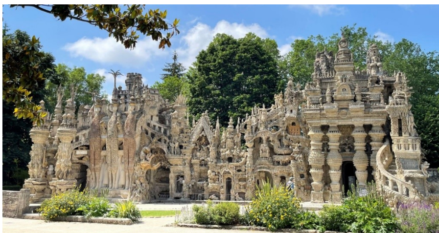
Obrázek 7 - Palais Idéal, 1912

města Hauterives jezdí tisíce turistů ročně. Ferdinand Cheval byl nejen pošťákem, ale především vizionářem, který svůj neobyčejný zápal a odhodlání přetavil do monumentálního díla, jakým je Palais Idéal. Každý kámen, každý detail a každý sochařský prvek tohoto paláce svědčí o jeho hluboké vášni a neúnavné práci. Navzdory posměchu a kritice ze strany jeho současníků, Cheval pokračoval ve své tvorbě s neochvějnou vírou ve svou vizi. Naopak jeho obdivovatelé, mezi které patřil i jeden z hlavních představitelů surrealismu André Breton, dokázali ocenit Chevalovu bujnou fantazii, kterou proměnil ve svůj vysněný palác. Zařazení Palais Idéal do této kapitoly demonstruje, že inspirace v umění nemusí vždy pocházet z fyzických cest. Příběh Ferdinanda Chevala a jeho paláce ukazuje, že umělecká tvorba může být hluboce ovlivněna imaginárními prožitky a sny o vzdálených místech. Tímto způsobem se rozšiřuje naše chápání toho, jakým způsobem mohou být umělci inspirováni a jakou roli hrají v tvorbě jejich vlastní fantazie a imaginace.