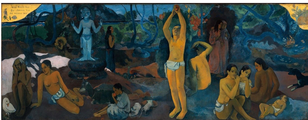
Obrázek 2 - Odkud přiházíme? Kdo jsme? Kam jdeme?, 1897

Celkově lze říci, že Gauguinova cesta do Polynésie představovala zásadní zlom v jeho umělecké kariéře. Tento pobyt mu umožnil objevit nové inspirační zdroje a rozvinout unikátní styl, který zanechal významný otisk v dějinách umění.