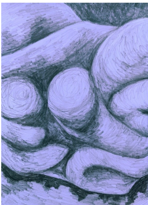
Obrázek 12 – Objekt, kresba tužkou

Jedna z pouličních lamp lemující chodník směrem od Karlova mostu k náměstí J. Palacha.