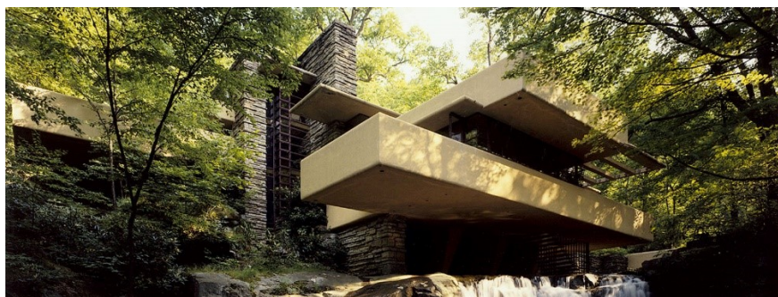
Obrázek 3 - Fallingwater, 1935

architektem Frankem Lloydem Wrightem, u něhož čerpal znalosti v oblasti rodinných domů a jejich úprav. Ačkoliv spolu tito velikáni pracovali a Wright svými zkušenostmi Neutra obohatil, nikdy společně nevytvořili žádný konkrétní návrh. Wrightovým mottem bylo vytvářet architekturu, která bude v harmonii s přírodou a okolním prostředím stavby. Pro tuto myšlenku je dokonalým příkladem dům Fallingwater v Pensylvánii, který je signifikantním dílem, jež vyjadřuje jeho zaměření a uvažování o architektuře. Přesně tímto konceptem, který nahlíží na architekturu jako spojku mezi člověkem a přírodou, se inspiroval i Richard Neutra. Práce s Wrightem ovlivnila Neutra zejména v jeho přístupu k integraci stavby do přírodního prostředí. Přestože Neutra rozvinul svůj vlastní styl, základní princip propojení architektury s přírodou zůstal přítomen. Jeho hluboké porozumění Wrightovým principům organické architektury mělo vliv na Neutrovy návrhy, jež spočívaly ve využití lokálních materiálů, dále propojení stavby s přírodním prostředím a funkční design, který měl sloužit především obyvatelům domu. Ačkoliv byl Neutra silně ovlivněn Wrightovými myšlenkami a díly, jejich nahlížení na účel dané stavby bylo odlišné. Obecně byla Wrightova filozofie umělecká a ideová, zatímco Neutraův přístup byl více vědecký a technický.