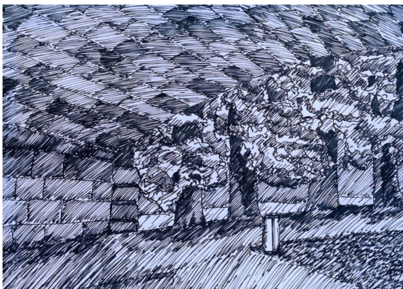
Obrázek 9 – Pod mostem, perokresba

Pohled na část mostu Legií a postředí Střeleckého ostrova.