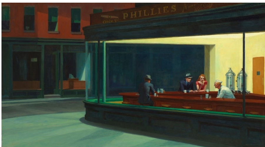
Obrázek 1 - Nighthawks, 1942