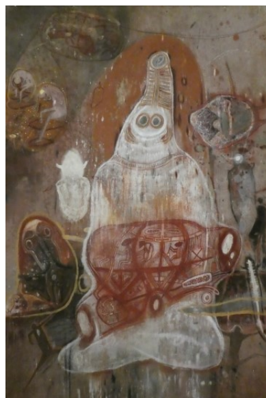
Obrázek 5 - Obrazy ze mě, 2022