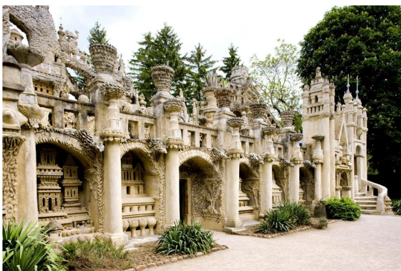
Obrázek 6 - Palais Idéal, 1912

Jak bylo zmíněno, inspiraci nezískal ze své osobní zkušenosti, během níž by fyzicky navštívil konkrétní místo, jež jeho tvorbu určitým způsobem ovlivnilo. Naopak podněty, které ho ke stavbě paláce přiměly, vnímal pasivně z četby a prohlížení časopisů, knih či jiných vizuálních materiálů, které v něm zanechaly trvalý dojem. Fotografie a obrazy, které zkoumal, se promítaly do jeho snů a každodenních myšlenek, které nakonec zhmotnil právě do Palais idéal.