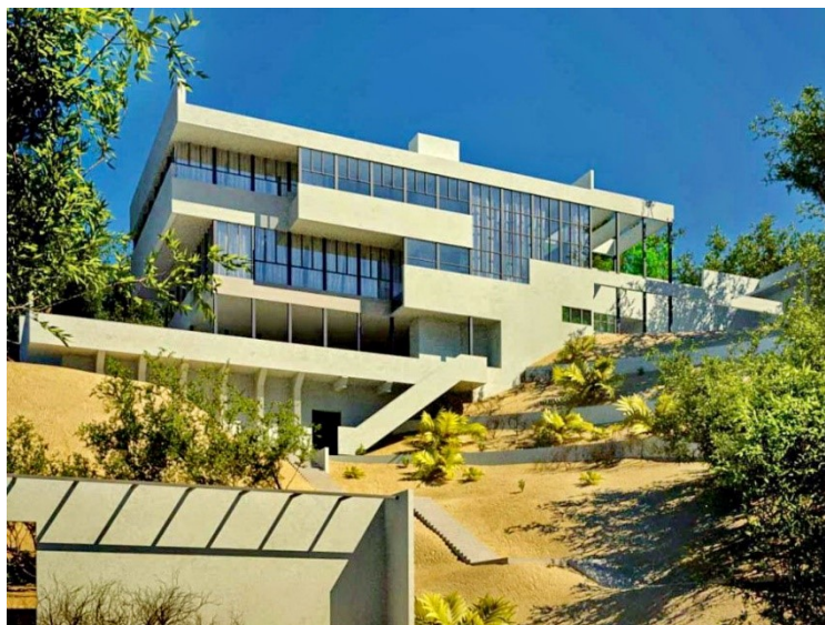
Obrázek 4 - Lovel Health House, 1929

Lovell Health House představuje významný milník v historii modernistické architektury. Z mého pohledu je tento dům fascinujícím příkladem, jak lze architekturu spojit s inovativními stavebními technikami, moderními materiály a hlubokým respektem k přírodnímu prostředí. Stavba se nachází na strmém svahu, a díky použití betonových pilot se téměř vznáší nad terénem, což minimalizuje její dopad na přírodní prostředí. Tento přístup je ukázkou mistrovské schopnosti začlenit architekturu do krajiny, aniž by byla narušena její přirozená estetika. Lovell Health House je skutečně mistrovským dílem, které spojuje prvky evropského modernismu a americké organické architektury. Neutra v tomto díle projevil svou schopnost inovativně pracovat s moderními materiály a technologiemi, přičemž vždy kladl důraz na harmonii s přírodou a funkčnost.