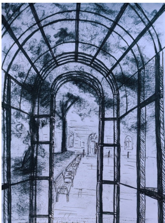
Obrázek 15 – Konstrukce altánu, uhel s perokresbou

Posezení, které lemuje Bachmačské náměstí, na němž se nachází pomník T. G. Masaryka.