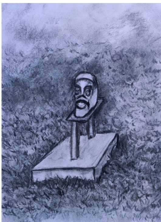
Obrázek 8 - Hlava na podstavci, uhl Pohled z mostu na Dětský ostrov.

Rozhodla jsem se ztvárnit tyto motivy, protože mě zaujaly svou geometrickou nebo organickou kompozicí, která vytváří vizuálně harmonický nebo kontrastní obraz. Právě ono zajímavé uspořádání prvků mě inspirovalo k vytvoření těchto kreseb. Také jsem se nechala inspirovat prvky s historickým nebo kulturním významem. Místní architektura a jiné objekty či prvky mě hluboce oslovily a staly se motivem mého uměleckého záznamu cesty.