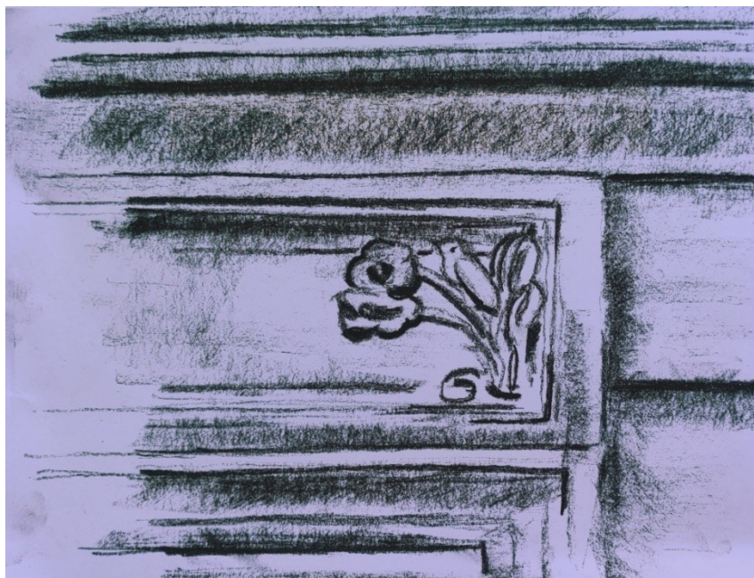
Obrázek 14 – Detail na fasádě, uhl

Kompozice kořenů stromu, který se nachází na břehu Vltavy v parku Cihelná.