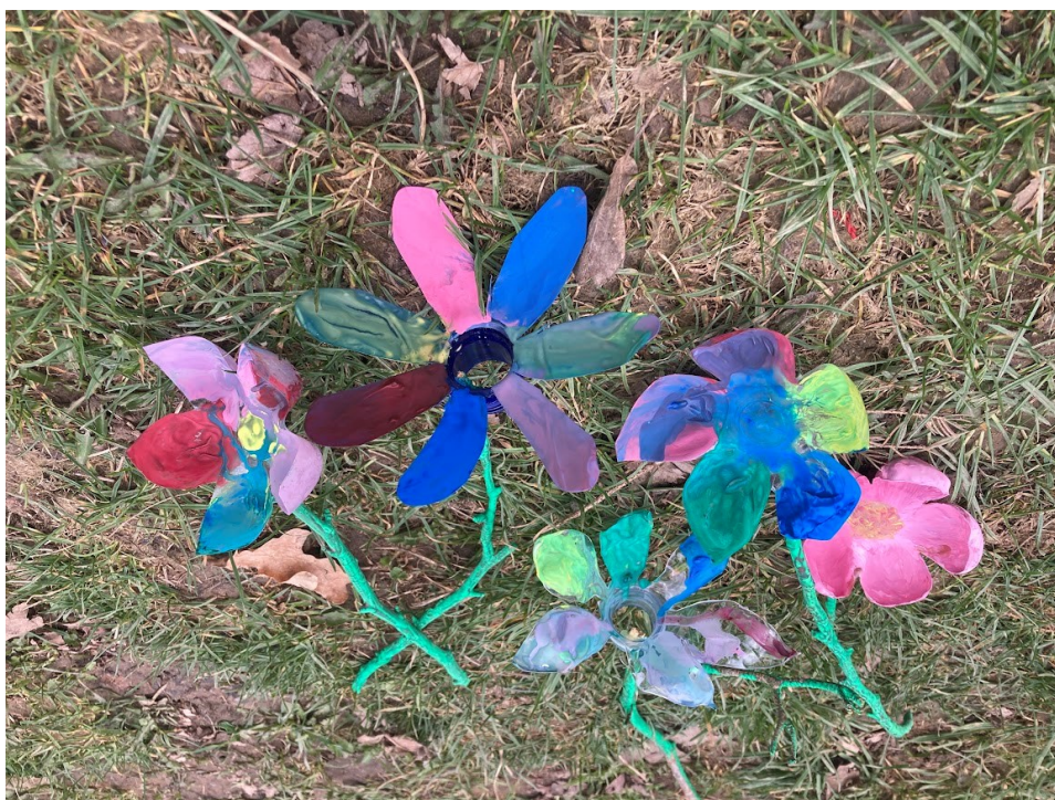
Obr. 34 Ukázka hotových květin