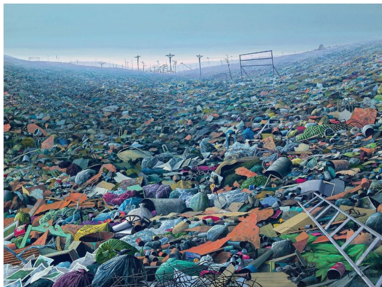
Obr. 1 Tomás Sáncherz, Na jih od Kalvánie

Ve své bakalářské práci jsem se rozhodla zmínit jako příklad dílo Na jih od Kalvánie od kubánského umělce Tomáse Sáncheze z roku 1994, protože jím dokázal vyjádřit problematiku úpadku společnosti skrze materiální konzum prostřednictvím hyperrealistické krajinomalby. Zobrazuje předměty, které lidé vyhodili jako odpadní materiál i přesto, že by mohly být ještě využity. Dílo s pečlivě promyšlenou kompozicí i barevností v sobě skrývá i náboženskou symboličnost.