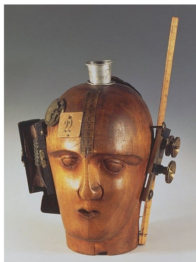
Obr. 3 Raoul Hausmann, Mechanická hlava