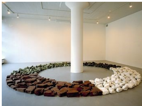
Obr. 8 Richard Long, Vermont Georgia South Carolina Wyoming Circle

své drobné zásahy do přírody, které nikdy veřejnost nespatří doopravdy. Longovo dílo i jeho fotografie vyvolávají náladu určitého místa, v galeriích jeho fotografie doprovázejí krátké texty nebo mapy.