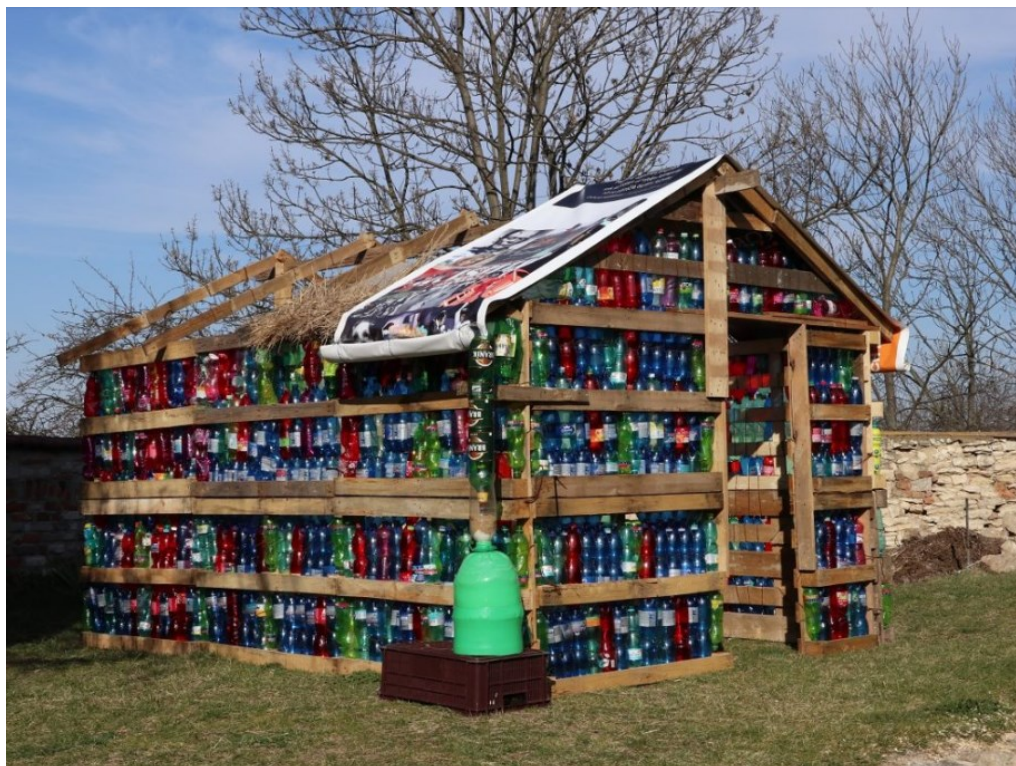
Obr. 17 Veronika Richterová, PalletBottleCabin

se v oblastech těchto táborů příliš netřídí. Lahve jsou naplněny pískem či zeminou, což je vhodné k izolaci, údržbě tepla a ke stabilitě stavby. 43