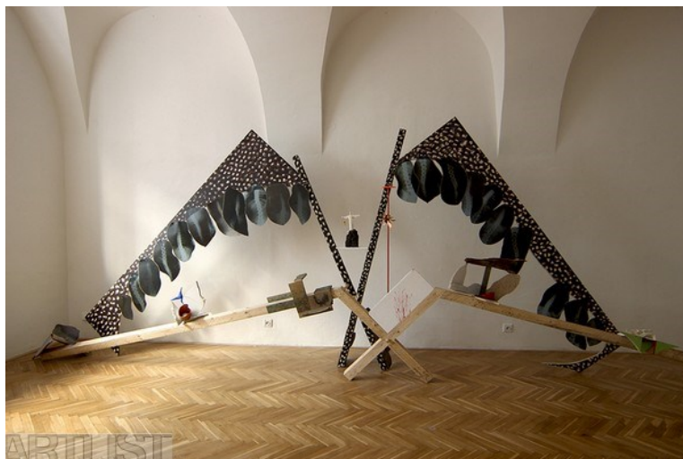
Obr. 11 Jana Doležalová, Proměna společnosti v popelu Fénixe

přírodniny a malé předměty z recyklovaného materiálu. Instalace zobrazuje narušený ekosystém a stopy, které vedou k přírodní katastrofě. 37