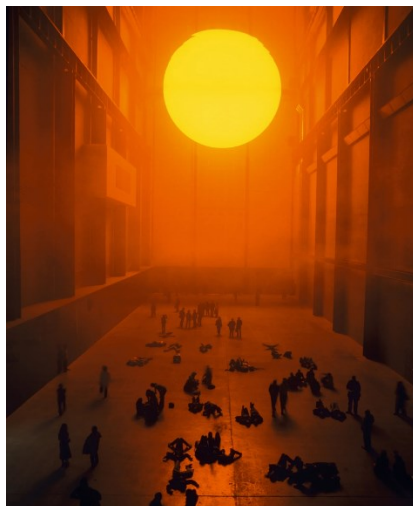
Obr. 9 Olafur Eliasson, The weather project

místa. 47 Toto dílo dle mého názoru představuje jedinečný zážitek z hlediska vizuálních efektů, ale také v rámci stavu přírody. Projekt ve mně evokoval myšlenky týkající se globálního oteplování.