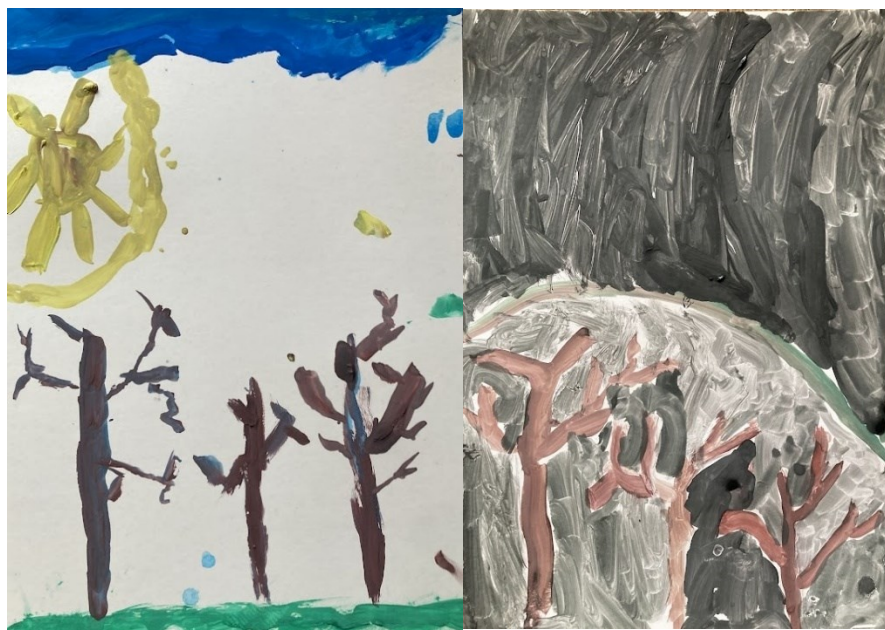
Obr. 24 Ukázka dětských maleb

přece nechtěl žít ve tmě. Oba se dali do řeči a z jejich rozhovoru vyplynulo, že je den stejně důležitý jako noc, protože v noci spíme a spánek je pro nás důležitý. Také si povídali o tom, že mnoho zvířátek ve sne spí a v noci loví. Jedna dívka namalovala několik zvířat. Pověděla mi, že to jsou srnky a zobrazila je, protože jsou podle ní zvířata důležitá.