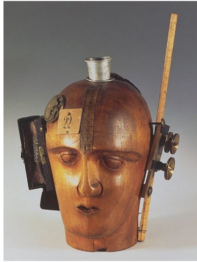
Obr. 3 Raoul Hausmann, Mechanická hlava