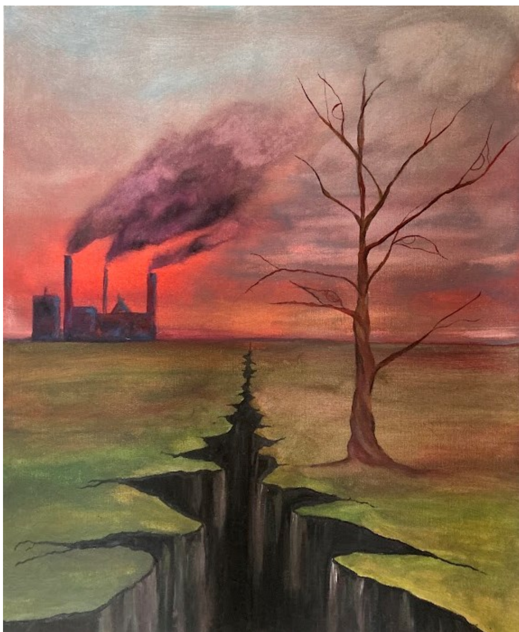
Obr. 20 Anna Mílková, akryl na plátně 50x60