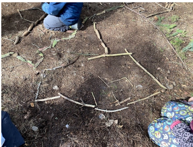
Obr. 30 Ukázka z průběhu tvorby, stavba labyrintů