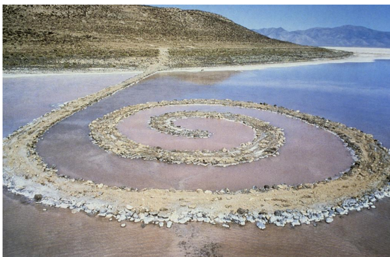
Obr. 7 Robert Smithson, Spirálové molo

Smithson do krajiny nepřiváží žádný nový materiál ani barvu, 39 využívá skály, sůl, krystaly, zeminu, řasy a vodu. 40 Spirála je symbol, který se objevuje na úplných začátcích výtvarného umění a prolíná mnoho historických epoch. 41 Dnes již není možné se na tento Land artový útvar podívat, jelikož je jezero zatopené, ale i v době, kdy tam spirála existovala, bylo téměř nemožné ji vidět na vlastní oči, protože byla vytvořena na místě velmi vzdáleném a veřejnost znala toto dílo především prostřednictvím fotografie. 42