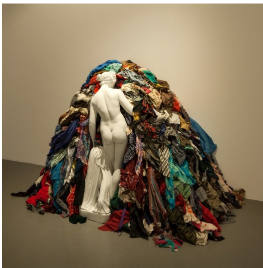
Obr. 6 Michellangelo Pistoletta, Venuše z hadrů

myšlenkou spojení těchto dvou symbolů je odstranit hranici mezi běžným každodenním životem a výtvarným uměním. 32