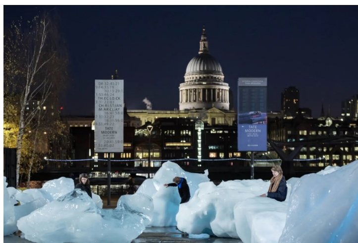
Obr. 10 Olafur Eliasson, Ice watch , Tate Modern, London, 2018

11. prosince 2018 vystavuje v Londýně u Tate modern a u sídla společnosti Bloomberg další bloky ledovců pocházející s Grónska. Vzhledem k tomu, že Grónský ledový příkrov ztrácí ročně 10 000 podobně velkých bloků, nemělo toto vylovené množství ledu v Grónsku vliv. Umělec vyzývá kolemjdoucí, aby si sáhli na tající ledovce a nabádá je, aby se stali svědky ekologických změn. Jeho cílem je, abychom nebyli pouze pasivními diváky, ale abychom si uvědomili, že se změny týkají nás všech a musíme nalézt společnou sílu pro kolektivní změny v této oblasti. 50 Projekt Ice watch mi přijde jako skvělý způsob, jak komunikovat s veřejností ohledně změny klimatu. Považuji ho jako nosiče zpráv, který zaujme i ty, kteří se o ekologické problémy nezajímají.