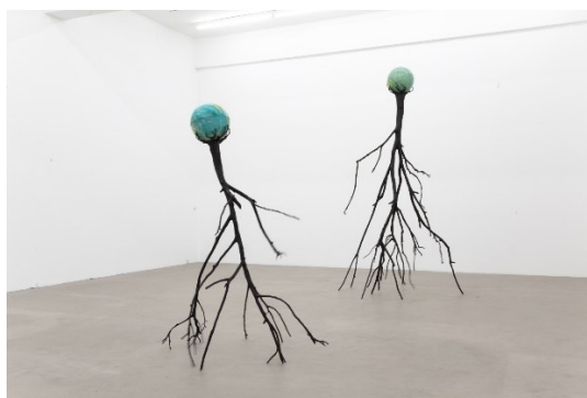
Obr. 14 Křištof Kintera, Nervous trees

Název Nervous Trees vznikl podle sochy, kterou Kintera vytvořil v jiném období. Tato třesoucí se socha vybízí k zamyšlení, zda-li je možné, aby stromy byly nervózní. Na první pohled na mě působí toto dílo jako varování, strach nebo jakási nestabilita. Naše zeměkoule stojí na úzkých a třesoucích se kmenech. 65 Na první pohled ve mně tato socha evokovala myšlenku, že naší lidskou existenci má v moci příroda, která je ale lidmi postupně devastována. Kintera však tvrdí, že nemá strach o přírodu, ale spíše o lidskou existenci. Mocná a silná příroda zde přetrvává, ale lidstvo může vyhynout. V knize s názvem Křištof Kintera zmiňuje svou nervozitu z civilizačních neduhů, protože žádné umění, ani on sám nenabízí celospolečenské řešení. 66 Instalace Public Jukebox je interaktivní vzhledem k tomu, že si divák může vybrat muziku či zvuky, které si sám zvolí.