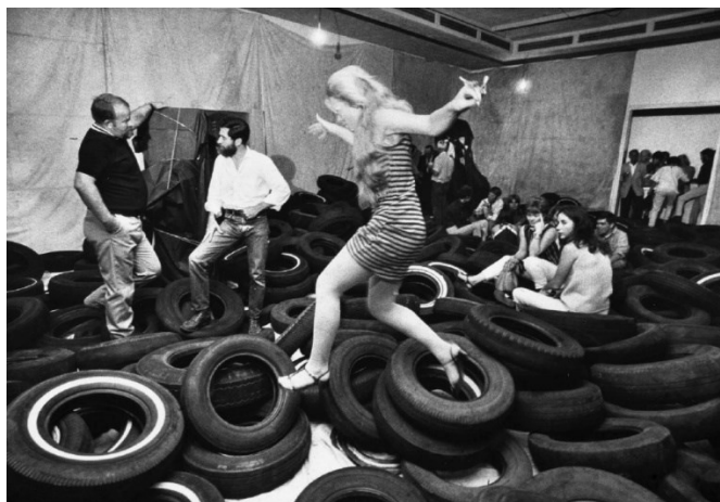
Obr. 5 Allan Kaprow, Dvůr

Teoretik umění a umělec Allan Kaprow , který byl propagátorem Happeningu, a zmiňují ho kvůli tomu, že významně ovlivnil vývoj ekologického umění. Kaprow pracoval s interakcí publika a spojením každodenního života do běžné tvorby. Kaprow začal na konci roku 1957 vytvářet prostorové environmenty, což jsou instalace, kterými interaktivně zapojoval diváky do prostředí. Jeho environmenty měli v publiku evokovat myšlenky na vztah člověka k přírodě. Jednou z jeho instalací byl Dvůr z roku 1961, kde vystavil na dvoře hromadu pneumatik, ve které se diváci mohli libovolně pohybovat. 27