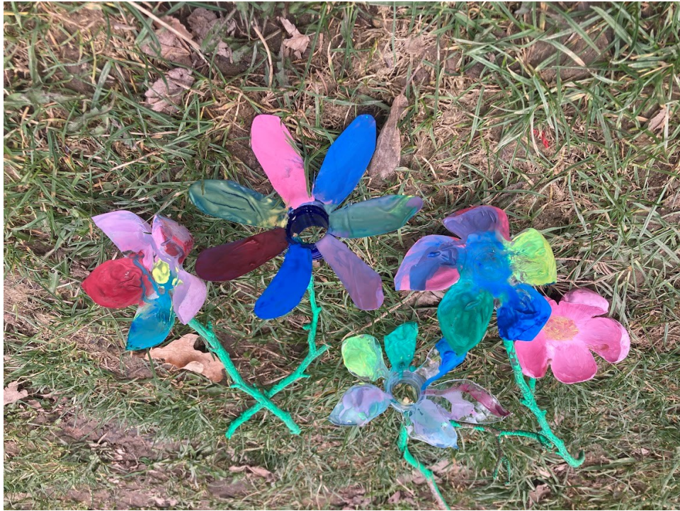
Obr. 34 Ukázka hotových květin