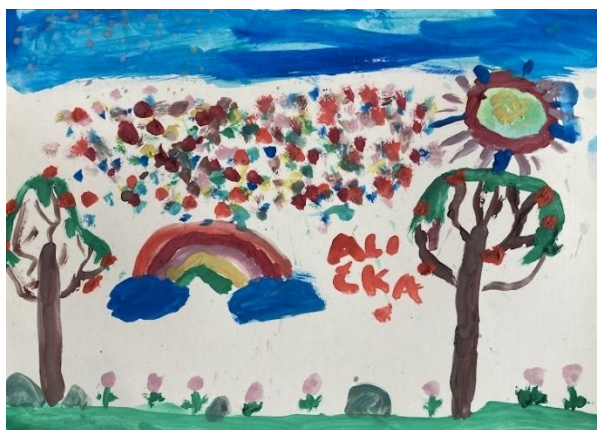
Obr. 26 Ukázka dětské malby

Co se týče prostorových vztahů, spodní linii, kterou děti chtěly znázornit trávník, chápou jako základní linii, na které stojí zobrazované objekty. Podle Piageta a Inhelderové (1970) se děti do 7 let tolik neorientují v prostoru, aby dokázaly řešit, jak vypadá určitý objekt z různých úhlů pohledu. Z tohoto důvodu dochází ke smíchání různých pohledů na jednom obrázku. 82 Například u obrázku se srnkami jsem zpozorovala to, že srnky, které jsou blíže a stojí přímo na linii, kde je trávník, jsou stejně velké, jako srnky, které jsou namalované dál. Mezi nebem, které je podobně jako trávník zobrazeno v horní linii, děti prostor nevyplňují a nechávají ho prázdný.