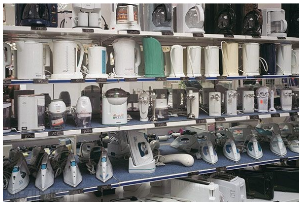
Obr. 12 Krištof Kintera, Spotřebiče

Mezi lety 1997-1998 vystavuje Spotřebiče . Spotřebiče slouží ke spotřebě energie a pro diváka působí sice atraktivně, ale tyto předměty se nedají používat. 60