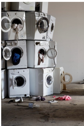
Obr. 15 Krištof Kintera, We all Want to Be Cleaned

Poslední částí výstavy jsou nahromaděné pračky a prádlo, které vytvářejí hluk a třesení. Každý zná zvuk pračky a podle autora je tento zvuk svým způsobem spirituální záležitost. Souvisí s rituálem, kterým je očista. Zvuk jedné pračky může připomínat domov, ale rozeznění více praček může působit až hrůzostrašně. Tyto hroživé zvuky mají nést poselství celé výstavy. Autor si je vědom toho, že elektronický odpad je prakticky nezničitelný a zůstane tu déle než celé lidstvo. On mu ale může věnovat nový život v podobě svých instalací. 67