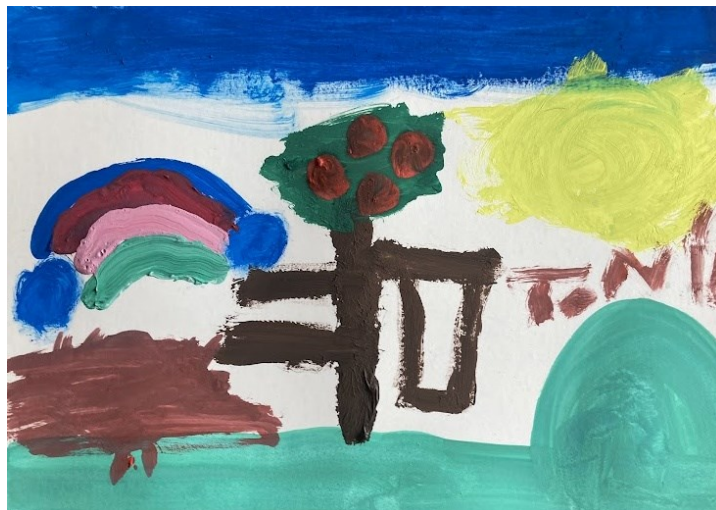
Obr. 27 Ukázka dětské malby

jsou postavené v řadě vedle sebe, u květin, které jsou namalované na trávniku, nebo u řady domků. Z některých děl je také patrný R-princip, který znamená využívání pravých úhlů v kresbě nebo malbě. To je patrné například u větví stromů na následujícím obrázku. 83