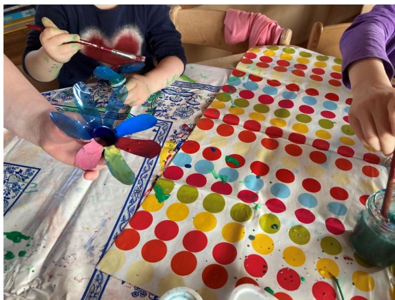
Obr. 33 Ukázka z průběhu tvorby, barvení květin