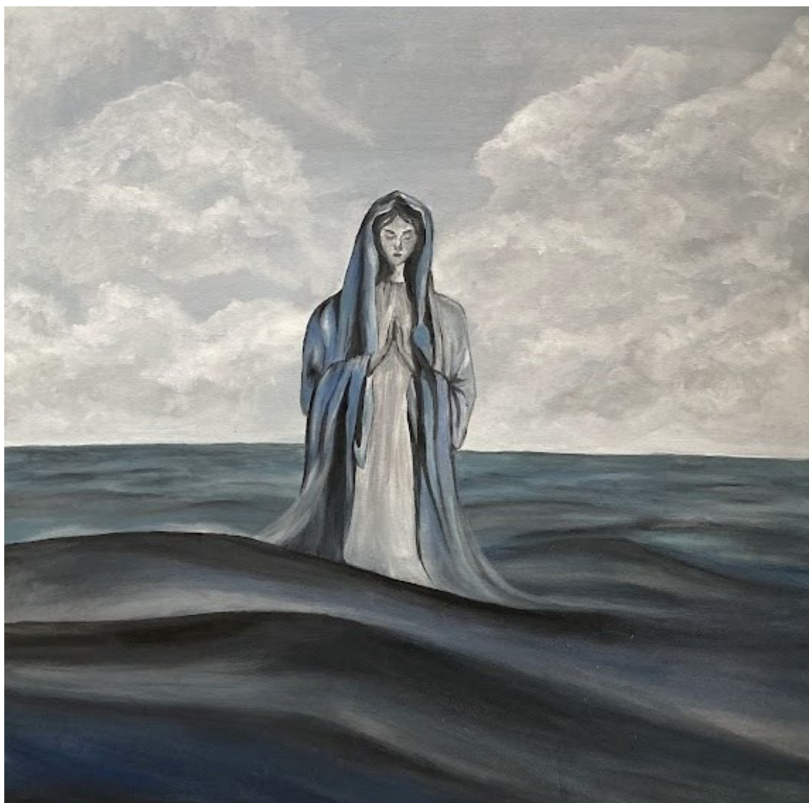
Obr. 22 Anna Mílková, akryl na plátně