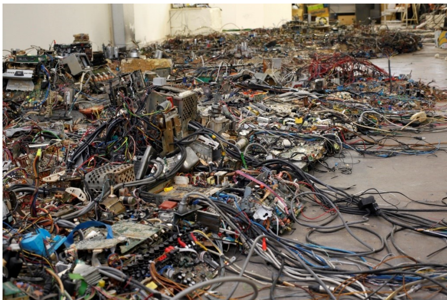
Obr. 13 Krištof Kintera, Postnaturalia

Kintera se také věnoval recyklované elektronice, které dává nový život v podobě různých instalací. Na výstavě Nervous Trees v Rudolfinu v roce 2017 představuje svou tvorbu z posledních 5 let. 61 V bývalé Masarykově pracovně vystavuje ulomený lustr, který pochází z doby, kdy bylo Rudolfinum sídlem československého parlamentu. 62 Vedle něj navoził hromadu znečištěného sněhu, který zobrazuje kontaminaci vody. Součástí výstavy je instalace Postnaturalia, kterou provází motiv věcí, které nebyly vyrobeny pro krásu, ale pro funkčnost. Zobrazuje syntetickou přírodu neboli jak může příroda vypadat, kdyby bylo tvořeno elektronikou, kterou vytvořil člověk. 63 Instalace připomínající nervovou soustavu 64 je tvořena kabely, cívkami, měděnými dráty, elektrickými součástmi.