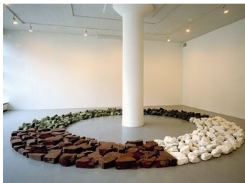
Obr. 8 Richard Long, Vermont Georgia South Carolina Wyoming Circle

Longovo dílo i jeho fotografie vyvolávají náladu určitého místa, v galeriích jeho fotografie doprovázejí krátké texty nebo mapy. 43