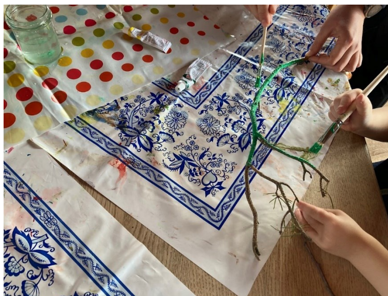
Obr. 32 Ukázka z průběhu tvorby, barvení klacíků

Představila jsem jim, co budou vyrábět. Ukázala jsem jim mnou vyrobenou květinu z plastové PET lahve a chtěla jsem, aby mi řekly, z čeho je vyrobena. Děti přišly na to, že je vyrobena z plastu. U výroby těchto květin jsem se inspirovala Veronikou Richterovou. Dětem jsem připravila ustrížené PET lahve a pomáhala jsem jim předkreslit tvar květiny. Pomáhala jsem se stříháním, protože i pro předškoláky bylo poměrně obtížné, aby květina měla pravidelné listy. Poté si děti začaly barvit svůj klacík, který poslouží jako stonek samotné květiny. Když měly děti hotovo, tavnou pistolí jsem slepila květinu s klacíkem.