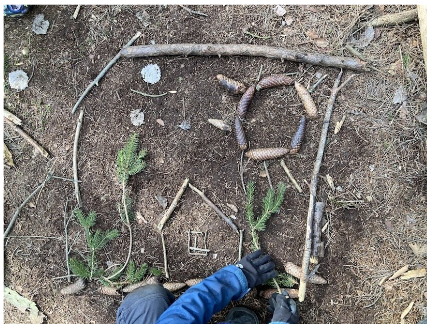
Obr. 29 Ukázka z průběhu tvorby, stavba vlastní vesničky

Děti pak měly za úkol představit své dílo mladším kamarádům ze školky. Popsaly svůj společný obrázek a jednotlivé složky v něm. Pak každý sám za sebe reprezentoval vlastní tvorbu. Zajímalo mě, jak děti vnímají rozdíl v individuální tvorbě a ve skupinové tvorbě, a také ,co jim vyhovuje více. První dívka mi pověděla, že jí nejvíce vyhovuje pracovat samostatně, protože má ráda, když jí do tvorby nikdo nezasahuje. Chlapec naopak raději pracuje ve skupině, protože je pak dílo rychleji hotové. Druhá dívka mi řekla, že si není jistá, co je lepší, protože obě formy práce mají své výhody a nevýhody. Když se pracuje ve skupině, je vše rychlejší a méně namáhavé, když ale člověk tvoří sám, může si vytvořit vše podle sebe.