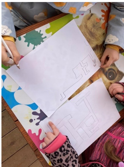
Obr. 31 Ukázka z průběhu tvorby, kresba labyrintů

nejsložitějším způsobem. Ve školce si pak děti vzaly výtvarné potřeby rozhodly se, že si labyrinty ještě zaznamenají na pastelkami na papír. Tato aktivita opět nebyla mým záměrem, ale myslím si, že je pro děti zajímavé vytvářet různé výtvarné řady, skrze které poznávají daný motiv jinými způsoby. Na tuto aktivitu jsem navázala otázkou, jak vnímají rozdíl mezi tvorbou v lese a kreslením na papír ve školce. Děti se shodly na tom, že je jim pohodlnější kreslit na papír, ale v lese obrázky vypadají také hezky, ale bohužel nevydrží navždy. S dětmi jsme se domluvily, že pokud budou chtít, mohou i v následujících dnech obrázky v lese rozšiřovat. Snažila jsem se vysvětlit, že výtvary v lese jsou sice pomíjivé, protože se mohou snadno rozbořit, ale že na tom není nic špatného.