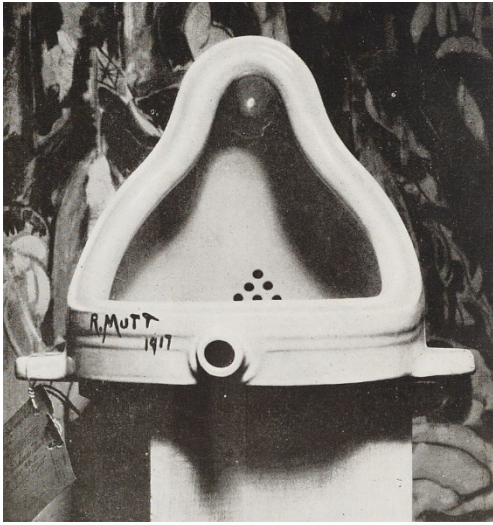
Obr. 2 Marcel Duchamp, Fontána