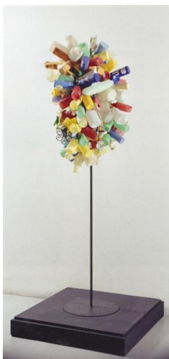
Obr. 4 Martial Raysse, Tree

nezidealizovaný život. Nový realismus navazuje na dadaistickou tvorbou a čerpá z ready-made nebo kubismu a surrealismu. 23 Svými díly se soustředili na tehdejší společnost a přesunuli umělecká díla z galerií na úroveň veřejného prostoru. 24 Do svých děl se snažili vmístit obyčejné předměty. Martial Raysse upoutaly vlastnosti plastů a vytvářel asambláže z různých zbytků a odpadků. Roku 1960 vytvořil asambláž tree , jehož koruna je sestavena z plastových lahví.