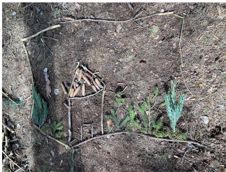
Obr. 28 Ukázka výsledného díla, první společná vesnička

zahrádky, mech využily místo trávníku a popadané jehličnaté větvičky využily k zobrazení stromů. Dívky se pak rozhodly, že vedle domku zobrazí i sebe samotné. Jedna postavička z mechu, klacků a malého kaštanu má roztažené ruce a zdraví slunce a jaro. Když měly děti pocit, že je jejich společné dílo hotové, navrhla jsem, že by mohly překročit hranice klacíků a pokusit se jejich dílo rozestavit.