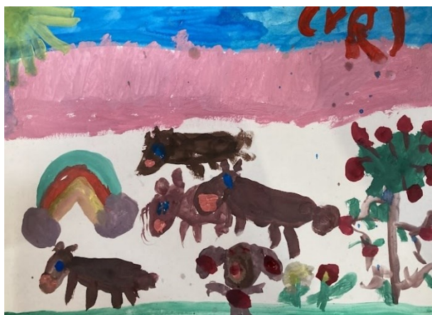
Obr. 25 Ukázka dětské malby

Co se týče prostorových vztahů, spodní linii, kterou děti chtěly znázornit trávník, chápou jako základní linii, na které stojí zobrazované objekty. Podle Piageta a Inhelderové (1970) se děti do 7 let tolik neorientují v prostoru, aby dokázaly řešit, jak vypadá určitý objekt z různých úhlů pohledu. Z tohoto důvodu dochází ke smíchání různých pohledů na jednom obrázku. 82 Například u obrázku se srnkami jsem zpozorovala to, že srnky, které jsou blíže a stojí přímo na linii, kde je trávník, jsou stejně velké, jako srnky, které jsou namalované dál. Mezi nebem, které je podobně jako trávník zobrazeno v horní linii, děti prostor nevyplňují a nechávají ho prázdný.