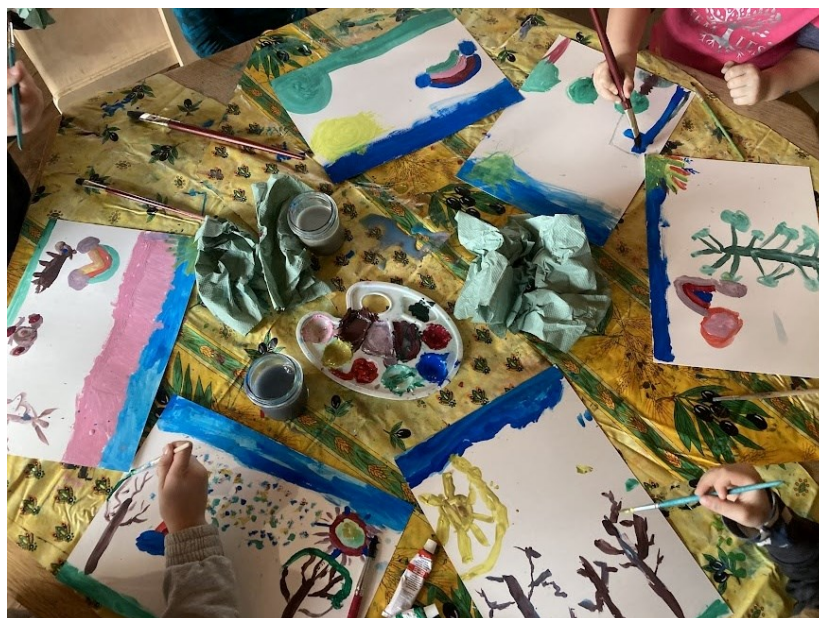
Obr. 23 Fotografie dokumentující průběh výtvarné aktivity

Myslím si, že můj obraz posloužil jako velmi účinný zdroj motivace, protože připoutal dětskou pozornost a přivedl je k různým otázkám ještě před tím, než jsem jim otázky začala pokládat já. Myslím si, že některé děti trochu navázaly na můj obraz, co se týče motivu stromu a jeho rozvětvení. Děti ve školce malují a kreslí často, stromy ale zobrazují jiným způsobem a větve často skryjí za listy tak, že nejsou vidět. Ale tentokrát se děti snažily větve zviditelnit a zpozorovala jsem snahu o jejich realističtější zobrazení.