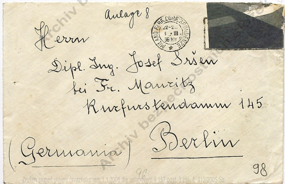
Obrázek 6: ABS, f.141 - NSŘ, sign. 141-59-2.

Archiv bezpečnostních složek Archiv bezpečnostních složek